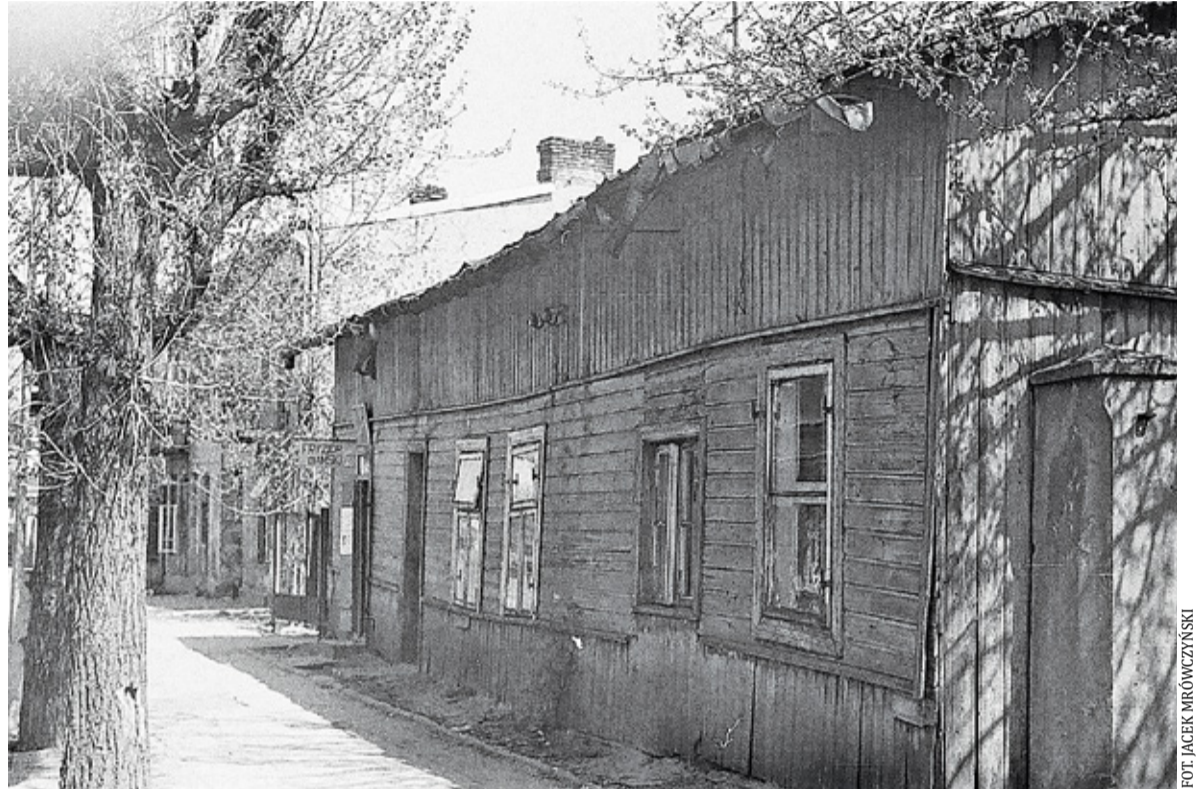
Salon Joanny Żyro, ul. Sierakowskiego, początek lat 70.

która wyglądała stylowo i modnie. Liczne zakłady fryzjerskie wypuszczały ze swojego salonu klientki z przepalonymi od trwałej ondulacji włosami i stylem na przestraszonego, źle ostrzyżonego pudła. Jeździłam w tych latach do bardzo drogiego zakładu fryzjerskiego na ul. Nowy Świat w Warszawie, nieco później do salonu Laurenta na ul. Szpitalną. Był początek lat 70. i chyba w tym czasie ktoś mi powiedział, że w Piasecznie jest fryzjerka, która świetnie