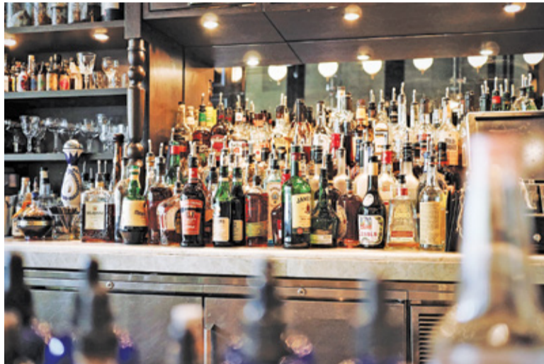
Mimo że w okresie zamknięcia barów i restauracji alkohol nie jest sprzedawany, przedsiębiorcy muszą wносить opłatę za koncesję

P rzepis dający samorządom możliwość zwolnienia przedsiębiorców z opłaty za koncesję na sprzedaż alkoholu wszedł w życie 26 stycznia. Pierwsze gminy w Polsce podjęły już stosowne uchwały. Przymierza się do tego również samorząd Piaseczna.