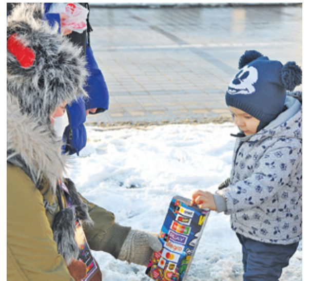
Najmłodszy jak zawsze chętnie wrzucał pieniądze do kolorowych puszek