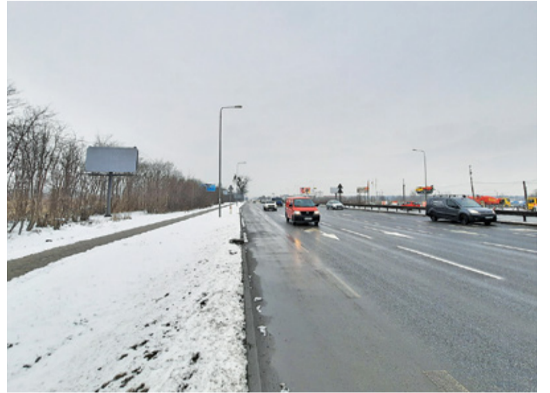
Czy w najbliższej przyszłości przy ul. Puławskiej powstanie kolejne centrum handlowe i biurowiec?

Kiedy to nastąpi? Gmina przygotowuje się do sfinalizowania porozumienia ze spadkobiercami. Podczas ostatniej sesji radni podjęli uchwałę w sprawie wyrażenia zgody na obciążenie hipoteką działek nr 1/272 i 1/273 o powierzchni ok. 10 ha na kwotę ponad 14,7 mln zł na rzecz spółki SETE. Jest to niezbędne do uwolnienia hipoteki na działce sąsiadującej z Selgrosem, która ma zostać w ramach porozumienia przekazana spadkobiercom, a jest obciążona na rzecz realizacji umowy ze spółką SETE właśnie. Zgodnie z założeniami porozumienia ze spadkobiercami gmina ma przekazać im około 10 ha, w zamian za zrzeczenie się roszczeń do pozostałych ok. 53 ha na terenie dawnego KPGO Mysiadło. Z pewnością gmina będzie chciała sprzedać te ziemie, by