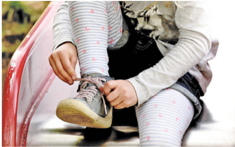
Wnioski o przyjęcie dziecka do placówki można składać od 1 do 12 marca

Dziecko, którego rodzice (jeden rodzic w przypadku samotnego wychowywania dziecka) są zatrudnieni w pełnym wymiarze lub uczą się w trybie dziennym, może liczyć na 5 pkt. 4 punkty otrzymuje dziecko, którego starsze rodzeństwo chodzi już do tego przedszkola lub do szkoły, przy której działa placówka. Jeśli w rekrutacji zgłaszamy więcej niż jedno dziecko jednocześnie, przysługują nam 3 punkty. Dziecko, którego rodzice zadeklarowali korzystanie z wychowania przedszkolnego przez co najmniej 8 godzin dziennie, otrzyma 2 pkt. (jeśli zadeklarujemy co najmniej 7