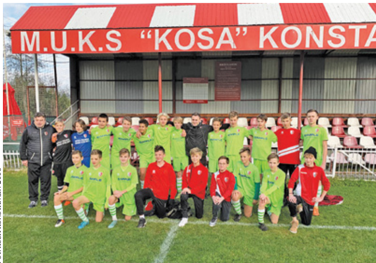
Kosa Konstancin talentami stoi