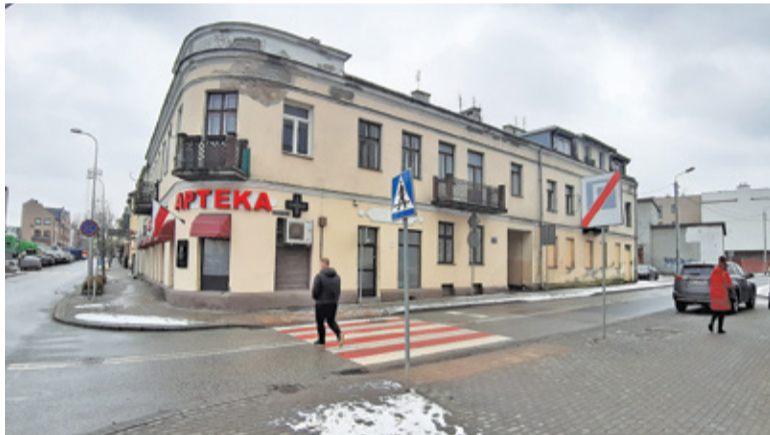
Kamienica na rogu ulic Kościuszki i Nadarzyńskiej jest wpisana do rejestru zabytków

Jednym z nich jest wpisana do rejestru zabytków kamienica na rogu ulic Kościuszki i Nadarzyńskiej. Budynek ten wymaga pilnego remontu. Zwłaszcza, że w październiku ubiegłego roku wybuchł w nim pożar. Oczywiście remont zabytkowej kamienicy wymaga sporych nakładów finansowych.