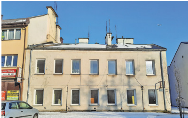
Gmina chciałaby szybko znaleźć nabywcę częściowo zabudowanej nieruchomości przy ul. Puławskiej 20

– W tym wypadku nie było zgody na rozbiórkę. Za chwilę znowu ktoś się tam włamie, coś się stanie, a uważam, że to miejsce również zasługuje na zagospodarowanie – mówił Putkiewicz podczas sesji. Licząca 1305 m 2 nieruchomość znajduje się w obszarze, w którym powstają nowe budynki, a stare są poddawane modernizacji. Zgodnie z mpzp dopuszczalna jest tu zabudowa mieszkaniowo-usługowa. W uzasadnieniu uchwały pojawiła się informacja, że pozyskane dzięki sprzedaży tej nieru-