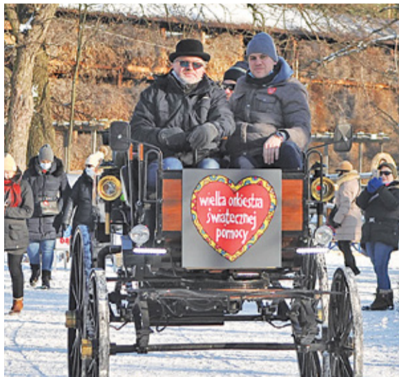
W Konstancinie-Jeziornie można było się przejechać zabytkowym pojazdem