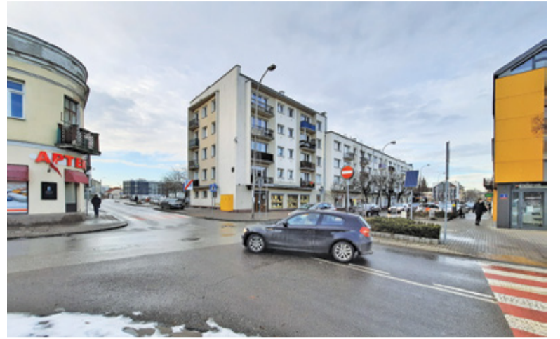
Sygnalizacja ma regulować ruch i poprawić bezpieczeństwo na skrzyżowaniu

– Ja jazdę przez centrum porzuciłem tydzień po tym, jak wprowadzili