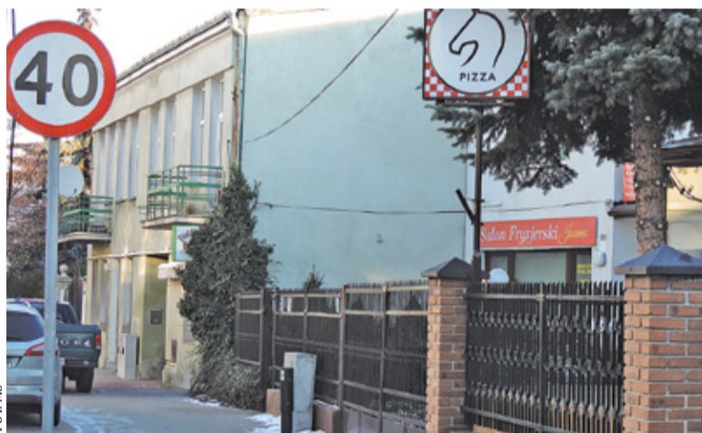
Ul. Józefa Sierakowskiego dziś

napisz do autorki m.szturowska@przeładpiaseczynski.pl