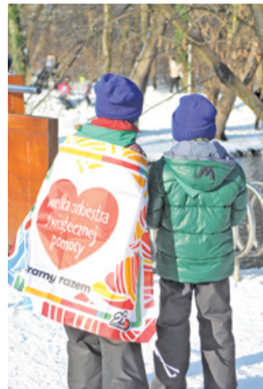
Kilka godzin zbiórki na mrozie to duże wyzwanie dla małych wolontariuszy