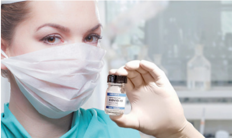
Od lutego w Górze Kalwarii szczepić można się już w dwóch przychodniach