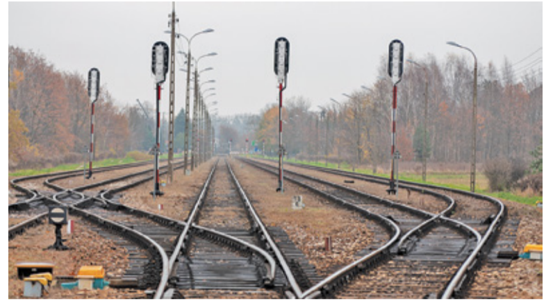
Czy tory do Konstancina-Jeziorny będą miały szansę służyć przewozom pasażerskim wstępnie dowiemy się po opracowaniu studium wykonalności

Odstąpiono od realizacji tego projektu z uwagi na fakt, że PKP PLK podpisała w lutym 2020 r. z firmą BBF sp. z o.o. umowę na opracowanie dokumentacji przedprojektowej dla projektu „Dobudowa torów aglomeracyjnych na odcinku Warszawa Al. Jerozolimskie – Piaseczno wraz z połączeniem do Konstancina-Jeziorny – opracowanie studium wykonalności”. Zakres umowy przewiduje również warunkową analizę włączenia bocznic kolejowej nr 937 Warszawa Okęcie – Jeziorna w ciąg komunikacyjny linii kolejowej nr 8. Ponadto, linia do Konstancina-Jeziorny