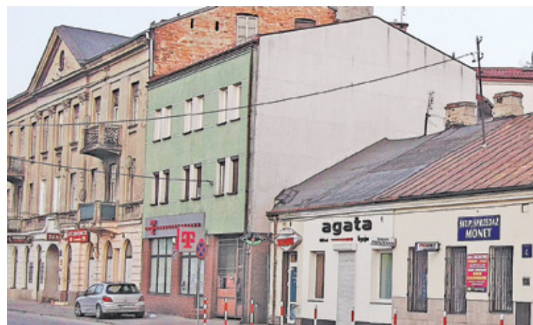
W miejscu drewnianej budki, w której mieściła się cukiernia dziś jest zielony, piętrowy budynek, ul. Sienkiewicza w Piasecznie

Pamiętam pewien wieczór, był to zapewne tłusty czwartek, gdy wracałam z mamą z przedszkola z ul. Kauna. Zima była śnieżna i na trasie mojego marszu, czyli na ul. Kauna, Gruzowej, Żabiej i Kościuszki usypane były ogromne góry śniegu. Na ul. Sienkiewicza ustawił się długi ogonek przy cukierni Przystępnych i w blasku światła zapalonego w