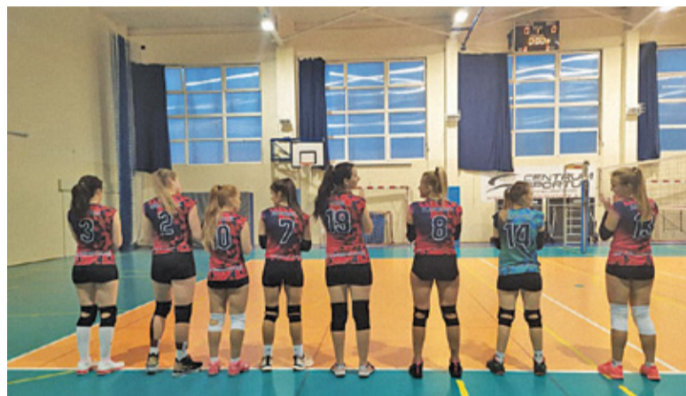
Zawodniczki UKS wygrały z rywalkami z dołu tabeli

Pierwszy set rozpoczął się od zwycięstwa siatkarek z Lesznowoli, które wygrały 25:14. W drugim secie mieliśmy identyczny wynik, aczkolwiek na korzyść Nadarzyn. W trzeciej odsłonie meczu wyraźną przewagę miały reprezentantki UKS Lesznowola, które zdołały zwyciężyć 25:18. W czwartym secie nie brakowało emocji. Przy stanie 24:20 wydawało się, że GLKS jeszcze spróbuje powalczyć o tie-breaka, ale wtedy zna-