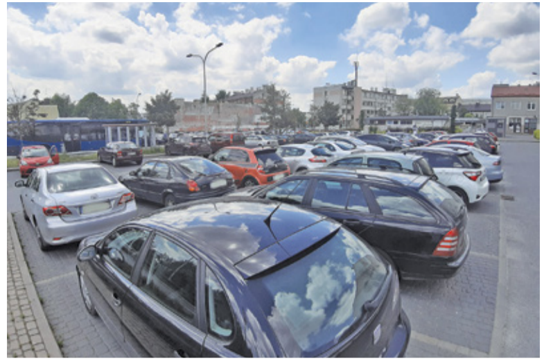
W większości na parkingach w powiecie stoją te same marki, co w całej Polsce

A czym jeżdżą mieszkańcy powiatu? Niestety uzyskanie szczegółowych danych na temat marek czy wieku pojazdów wymagałoby od urzędników dużych nakładów pracy, więc nie udało nam się zdobyć takich szczegółów. Na naszych ulicach, podobnie jak w wielu innych miejscach Polski, obok wysłużonych sprowadzanych głównie od zachodnich sąsiadów kilku- czy kilkunastoletnich aut, dominują młodsze modele popularnych marek samochodów. Spotkać też można pojazdy bardziej