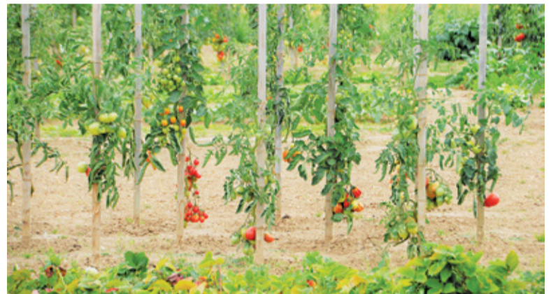
Uczniowie mogliby w ramach praktyk zostać zaproszeni do współpracy w zakresie nasadzeń i pielęgnacji

Czy pomysł znajdzie uznanie projektantów? Przekonamy się już niebawem. Wstępna koncepcja powinna być