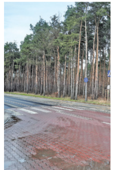
Skrzyżowania na wyniesieniu powstały m.in. w Bobrowcu

poszczególnych ulicach. Na ul. Orzeszkowej przewidziano 37 takich miejsc, na ul. Emilii Plater – 56, na ul. Przedwiośnia – 39, a na ul. Kauna – 44 miejsca. Ulice te staną się na całej długości jednokierunkowe dla ruchu kołowego między Żeromskiego a Staszica (nakaz nie obejmuje rowerzystów). Wyjątkiem będzie ul. Orzeszkowej, na której ma zostać wprowadzony jeden kierunek tylko od ul. Wschodniej do Żeromskiego. Z uwagi na konieczność zachowania płynnej obsługi Państwowej Straży