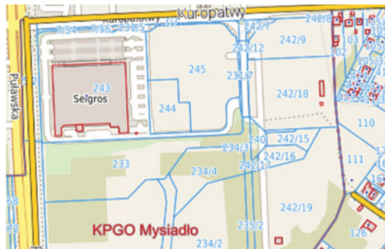
Kilka działek w sąsiedztwie Selgrosa zostało już sprzedanych prywatnym inwestorom

Jak udało nam się dowiedzieć w gminie, działki te zostały sprzedane firmie SETE Sp. z o.o. za kwotę 46 mln 965 tys. zł. W związku z tym, że ani w budżecie na rok 2018, ani na rok 2019 po stronie dochodów kwota taka się nie pojawiła, poprosiliśmy o wyjaśnienie, gdzie w takim razie podziały się pieniądze ze sprzedaży.