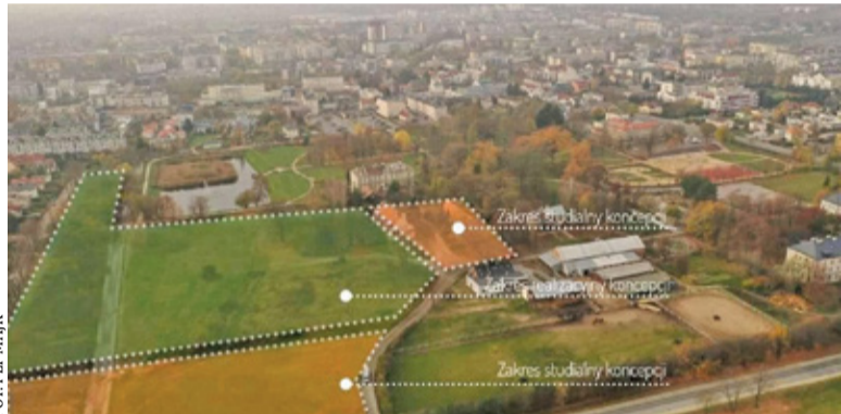
Obecnie opracowywana jest koncepcja zagospodarowania terenu od stawu do obwodnicy