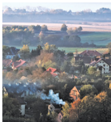
Mieszkańcy skarżą się, że konstancińskie powietrze jest wręcz gęste od smogu

Lasy Chojnowskie i Las Kabacki osłaniają Konstancin od wiatru, który pomógłby wywiać unoszące się w powietrzu pyły. Do tego rzecz jasna dochodzi problem jakości opału używanego przez mieszkańców. Gmina stara się walczyć ze smogiem, oferując mieszkańcom wymianę starych pieców węglowych. Program przynosi efekty, jednak postęp jest powolny. Przyspieszyć go może edukacja mieszkańców, którzy ociągają się z wymianą „kopciuchów”.