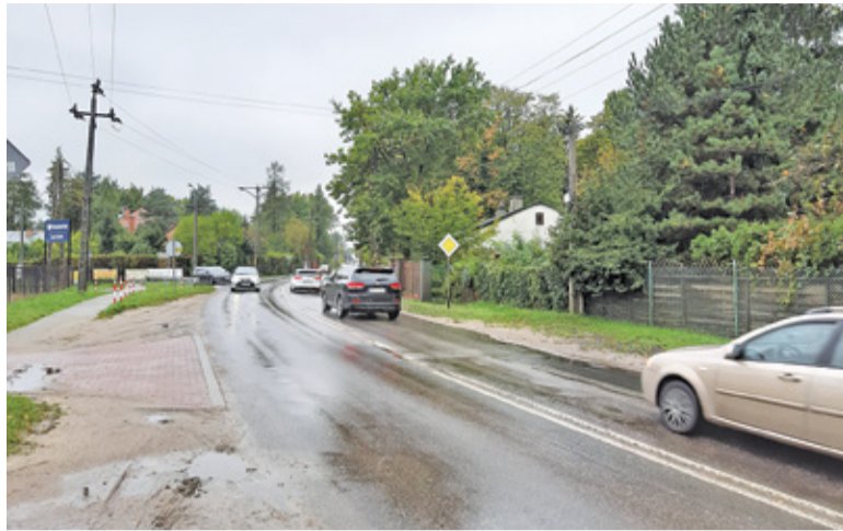
Jednym z newralgicznych punktów jest skrzyżowanie z ul. Dworską