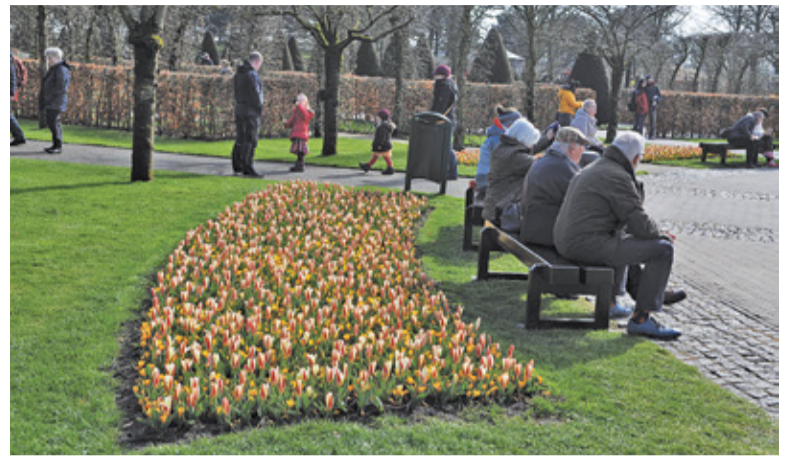
W piaseczyńskim parku mogłyby powstać np. klomby kolorowych tulipanów

Na osi wschód – zachód mogłaby powstać niewielka fontanna. Część wa-