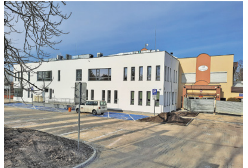
Nowe skrzydło szkoły jest już gotowe i czeka na uczniów

Dzięki rozbudowie szkoły przybyły dwa oddziały przedszkolne z odrębnym wejściem, pięć sal lekcyjnych, w tym pracownie do przedmiotów ścisłych. Powstała też przystosowana do obsługi większej liczby uczniów stołówka szkolna, szatnia na 260 szafek, nowe przebieralnie z zapleczem sanitarnym