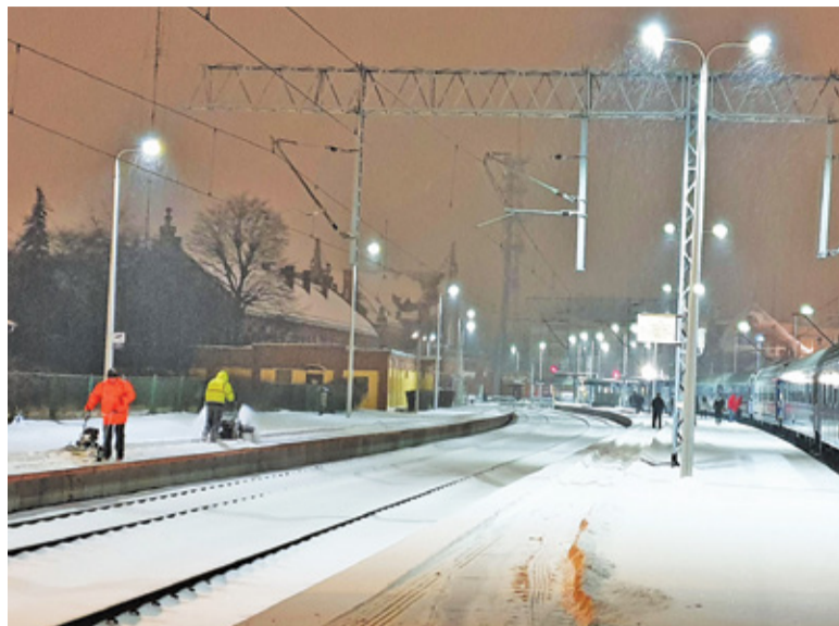
Pasażerowie mają możliwość zgłoszenia nieodśnieżonego peronu. Może to być jednak nieco czasochłonne

Użytkownicy smartfonów przyzwyczaili się już do słowa „aplikacja” oznaczającego program, który instalujemy w naszym urządzeniu. Tymczasem twórcy kolejowego usprawnienia mianem „aplikacji” określają de facto stronę internetową. Jeśli zatem chcemy skorzystać z przygotowanej przez kolejarzy funkcjonalności, musimy wejść na stronę PLK, rozwinąć menu „więcej” i kliknąć zakładkę „situacja zimowa”. Proste, szybkie i praktyczne, kiedy czekamy na pociąg brodzący po kostki w śniegu, prawda? Przyjmijmy jednak, że jesteśmy naprawdę zdecydowani zgłosić nieodśnieżony peron i nie