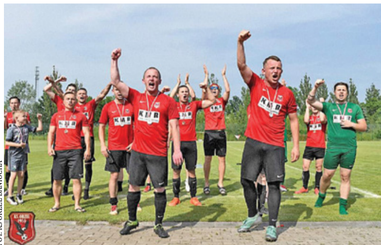
Orzeł Baniocha jest liderem ligi okręgowej