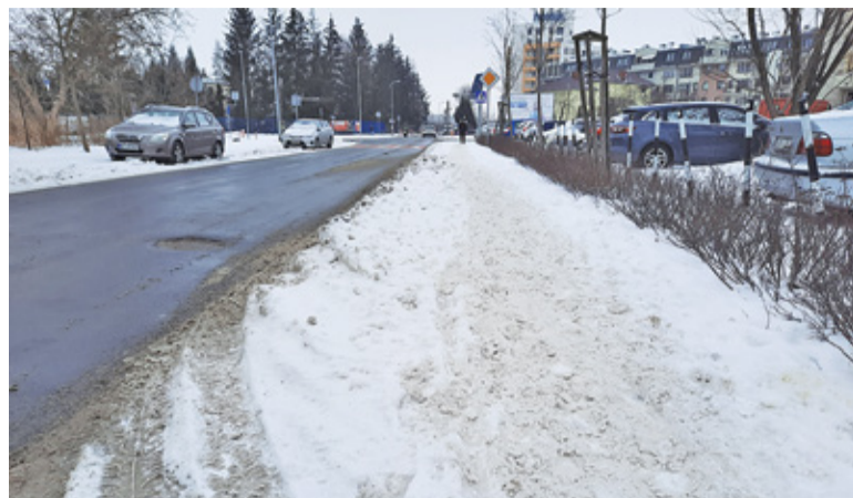
Część chodników nadal czeka na odśnieżenie

– Czy gminie nie jest wstyd brać pieniądze za tak wyglądający parking? – pytał jeden z mieszkańców, prezentując zaśniewane miejsca przy bazarku na ul. Szkolnej. Śnieg utrudniał też parkowanie przy ul. Kościuszki, został usunięty dopiero po uwagach mieszkańców w mediach społecznościowych. Ten na Szkolnej, znacznie już rozjeżdżony, leżał tam do końca tygodnia. Podobnie sytuacja wyglądała na wielu parkingach osiedlowych czy przy sklepach. Niestety w ciągu dnia, gdy miejsca są zajmowane przez kolejne samochody, odśnieżenie jest trudne. Miejskie parkingi można odśnieżyć nocą. W przy-