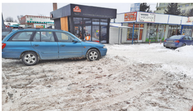
Odśnieżenie płatnego parkingu przy bazarku to zadanie gminy

na to, że... większość z nas już zapomniała, jak wygląda „prawdziwa zima” i z czym się wiąże.