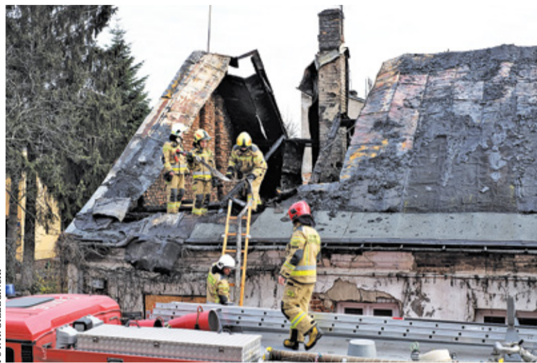
Od pożaru w 2019 r. degradacja budynku postępuje

Parterowa kamienica przy ul. Warszawskiej 2 spłonęła w grudniu 2019 r. Od tamtej pory trwa impas między samorządem i konserwatorem zabytków. Ten ostatni nie pozwala bowiem na rozbiórkę ruiny. – Raczej trzeba by w jakiś sposób wzmocnić ściany przez dołożenie specjalnej konstrukcji od wewnątrz. Nigdy nie zrobimy takiego budynku jakim on był, nie odtwo-