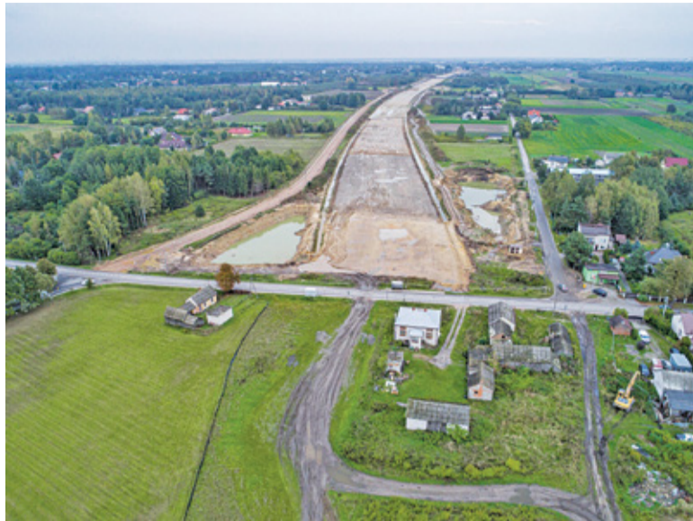
Jeśli nie będzie żadnych problemów z ofertami i odwołaniami, umowa na kontynuację prac budowlanych umowa z wykonawcą powinna zostać podpisana w maju br.