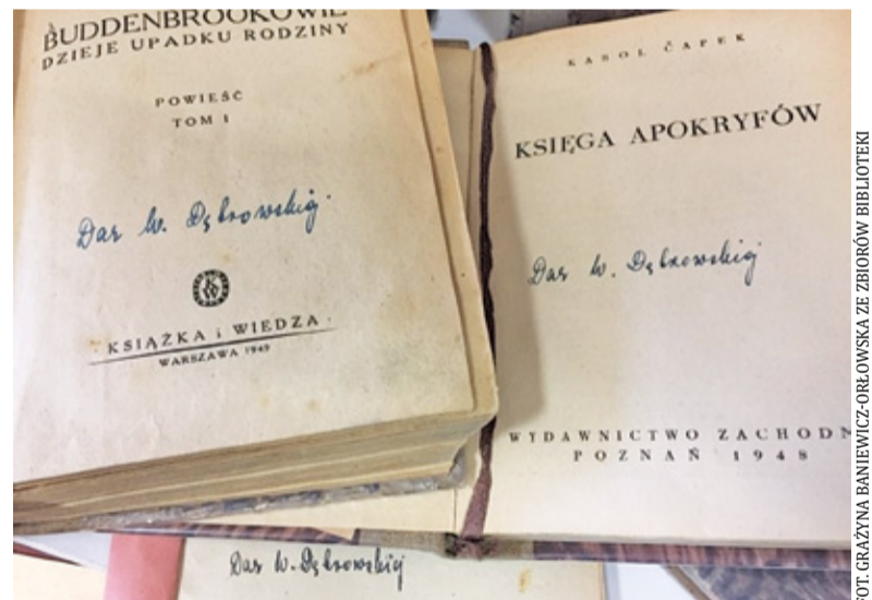
Książki podarowane przez Wandę Dąbrowską bibliotece w Zalesiu zachowały się i można je zobaczyć

Pełno wiewiórek. Sójki, sikorki. Ciśsza zupełnie bezwietrzna. Drobny deszczyk szeleści. Wacek wyszedł naprzeciw w »wystawowym« kasku kolonialnym z