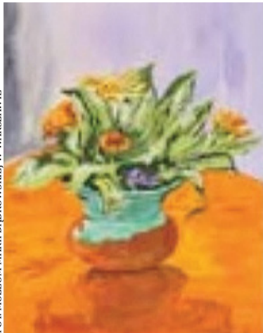
Obrazek malowany przez Marię Dąbrowską w domu Dąbrowskich w Zalesiu

W Zalesiu pod Piasecznem tuż po wojnie biblioteka jest marzeniem mieszkańców, ale władze są niechętne. Grupa ludzi na czele z Wacławem Borowym i Wandą Dąbrowską, przy dużym udziale dyrektorki szkoły pani Ewy Krauze, wyjednuje zezwolenie i powstaje biblioteka, w jednym pokoju. Dobre i to! Walka o tę bibliotekę będzie trwała latami, ale to już inna opowieść.