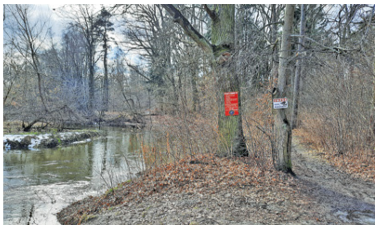
Najczęściej używany jest szlak biegnący od al. Kasztanów do Górek Szymona

– Na razie pracujemy nad wstępną koncepcją. W grę wchodzi oczywiście kwestie własności terenów – mówi nam burmistrz Putkiewicz. – Nie ma mowy o dużej ingerencji w przyrodę, w grę wchodzi ścieżka z naturalnego materiału, uporządkowanie roślinności tak, by można się bezpiecznie poruszać.