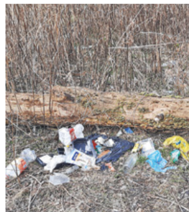
Śmieci przy ścieżce nie brakuje

W przyszłości szlak nad Jeziorką mógłby się ciągnąć aż do Pólka. Również tutaj istnieją fragmenty ścieżki, z której korzystają głównie wędkarze, ale i nieobawiający się przedzierania przez krzewy czy pod zwalonymi pniami spacerowicze. Częściowo jednak tereny są zagrodzone przy prywatnych posesjach. Ścieżka wymagałaby więc nie tylko uporządkowania, ale załatwienia również kwestii formalnych związanych z własnością gruntów i regulacjami prawnymi dotyczącymi terenów nadrzecznych.