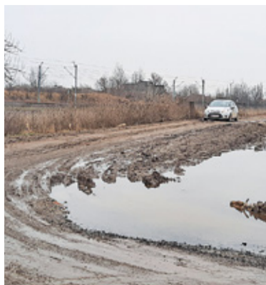
Na niektórych odcinkach ulicy Gogolińskiej nie ma możliwości mijania się jadących z dwóch kierunków pojazdów

Gmina zaproponowała mieszkańcom wykonanie nakładki asfaltowej na wiecznie rozjeżdżonej ulicy Gogolińskiej. Mieszkańcy Zgorzały takiego rozwiązania nie chcą, bo ich zdaniem oddali to docelową inwestycję w nieznaną przyszłość.