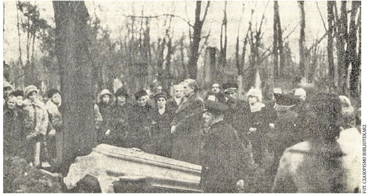
Pogrzeb Wandy Dąbrowskiej w styczniu 1975 r.

1.XI.[1948] Poniedziałek. Wszystkich Świętych. Rano o wpół do dziewiątej wyszłam, by pojechać do Wacków. Było pochmurno, cicho, mżył mały deszczyk. Straszna jest ta kolejka grójecka. Na ogół w kolejnictwie obserwuje się wszędzie postęp i ulepszenia z każdym rokiem. Tam wszystko jest tak, jak było przed pierwszą wojną światową. Zawsze za mało pociągów i wagonów, za-