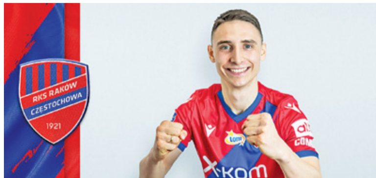
Wychowanek Victorii Głusków trafił do Rakowa Częstochowa