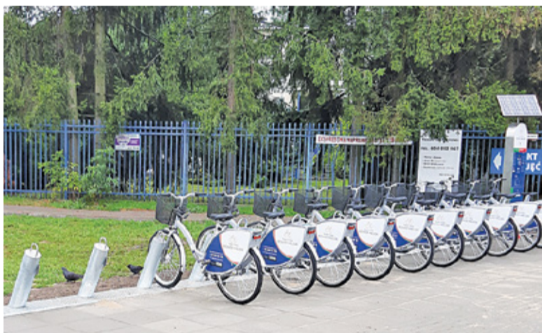
Najnowsza, szósta stacja PRM została otwarta na początku września 2020 r. przy ul. Jarząbka

W poniedziałek 1 marca ruszył czwarty sezon Piaseczyńskiego Roweru Miejskiego. Od września 2020 roku w Piasecznie działa już 6 stacji, na których możemy wypożyczyć w sumie 60 rowerów. Ubiegły rok był specyficzny, ponieważ zgodnie z decyzją rządu wypożyczalnie rowerów zostały wyłączone z użytku w pierwszym okresie pandemii. Dodatkowo część dotychczasowych użytkowników rozpoczęła pracę lub naukę zdalną, w związku z tym zainteresowanie rowerami mogło być mniejsze.