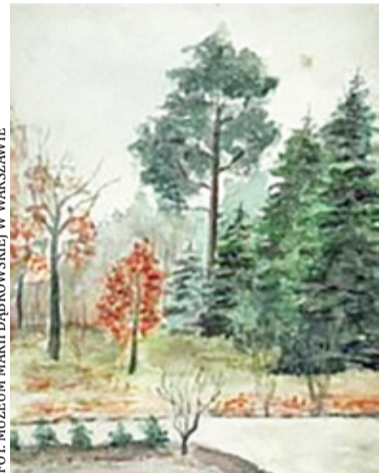
Dolne pejzaż jesienny 1938 malowany przez Marię Dąbrowską