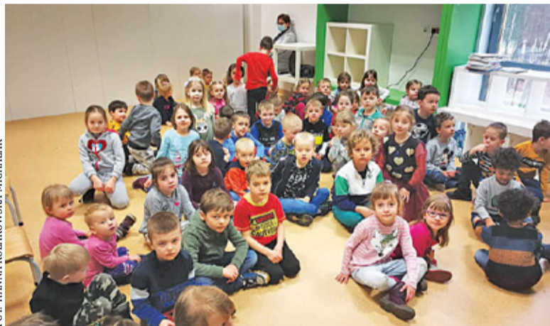
Ewakuowanym przedszkolakom z Zalesia Dolnego gościny użyczyła biblioteka publiczna

Każda ewakuacja budynku, w którym rzekomo ma być podłożony ładunek wybuchowy, dezorganizuje pracę, angażuje służby a niekiedy wiąże się też ze sporymi kosztami. Oczekiwaniem społecznym jest więc namierzenie „dowcipniświ” i ich przykładowe ukaranie. Zgodnie z art.224a kodeksu karnego, sprawcy fałszywego alarmu grozi kara od 6 miesięcy do 8 lat pozbawienia wolności oraz kara finansowa wyznaczona przez sąd. Jak często udaje się wykryć sprawców i ich ukarać? Policja przyznaje, że odkąd informacje o zagrożeniu są wysyłane drogą mailową, jest to znacznie trudniejsze. Autorzy alarmów korzystają między