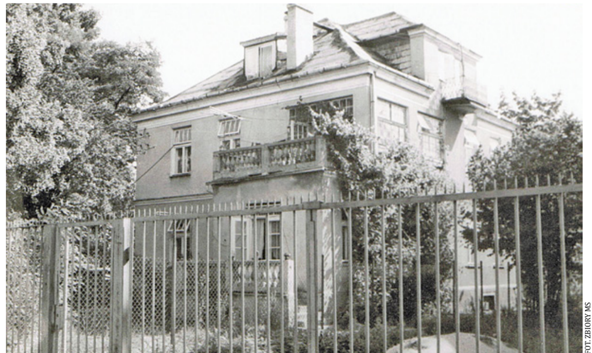
Dom przy ul. Mickiewicza 17 w latach 70. XX w.