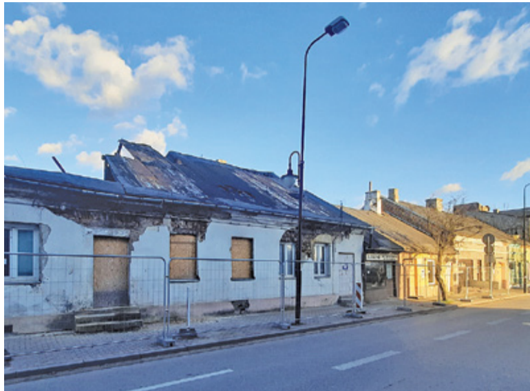
Pierzeja w obecnym stanie z pewnością nie jest wizytówką miasta

W poprzednim numerze „Przeładu Piaseczyńskiego” w artykule „Fotoradar stanie w Kawęczynie” błędnie podaliśmy nazwę miejscowości. Planowana lokalizacja fotoradaru to Brzeście, okolice ul. Wilanowskiej 34. Za pomyłkę przepraszamy.