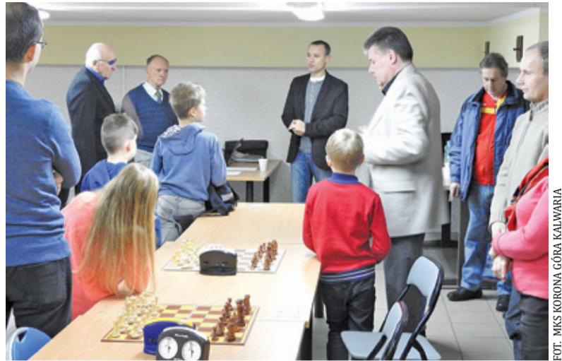
W Górze Kalwarii od lat odbywają się turnieje szachowe