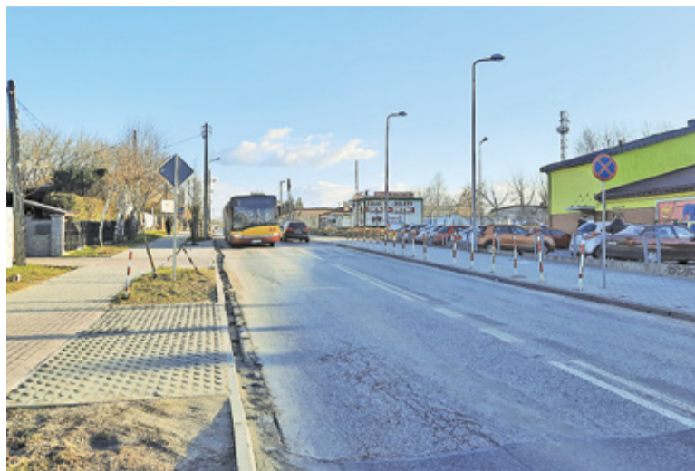
Gmina chciałaby prace na odcinku od ul. Nadarzyńskiej do al. Lotników zrealizować głównie w wakacje