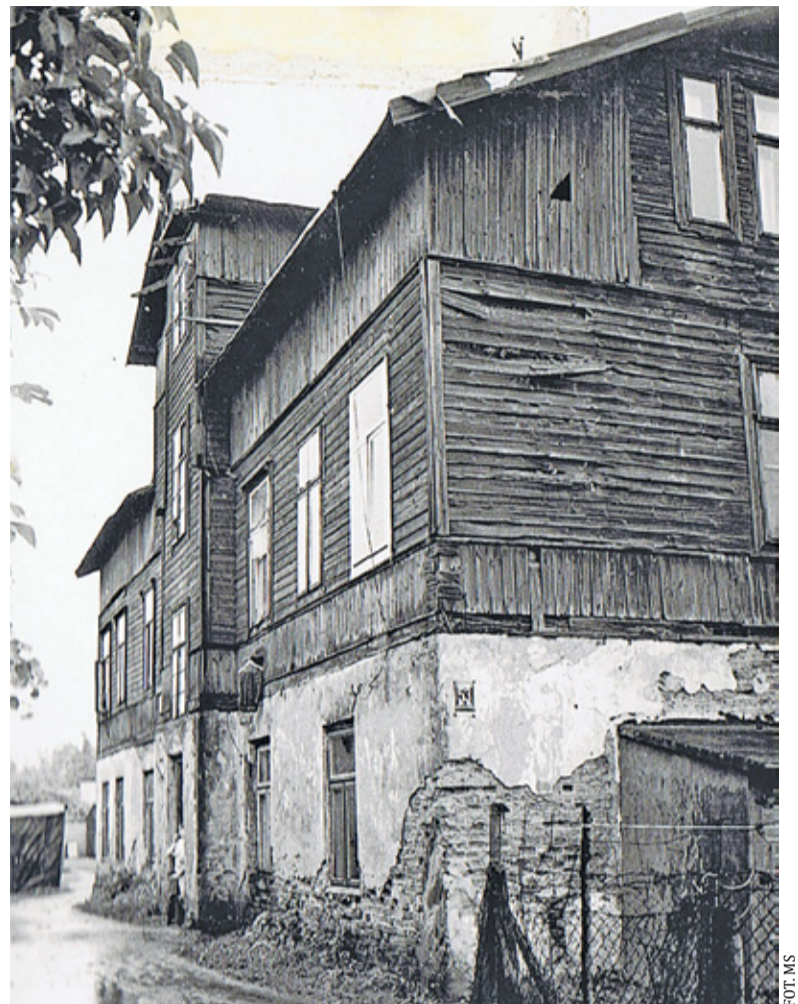
Dom przy ul. Czajewicza 53, z którego rozpoczęła się akcja