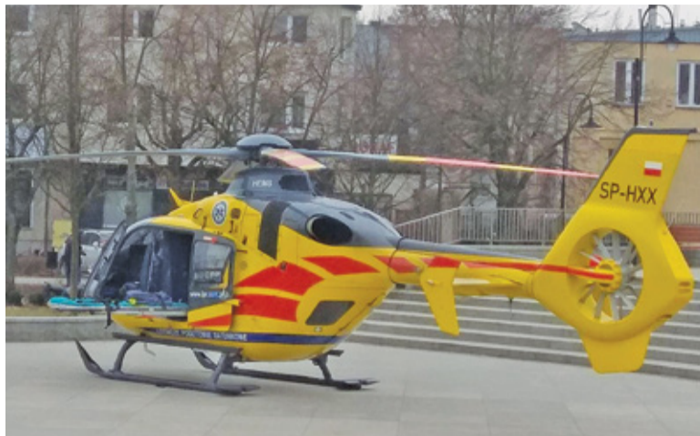
LPR interweniował niedawno w centrum Piaseczna

Śmigłowce Lotniczego Pogotowia Ratunkowego coraz częściej zastępują karetki w transporcie pacjentów. Jak się okazuje, wynika to z problemów z dostępnością ambulansów.