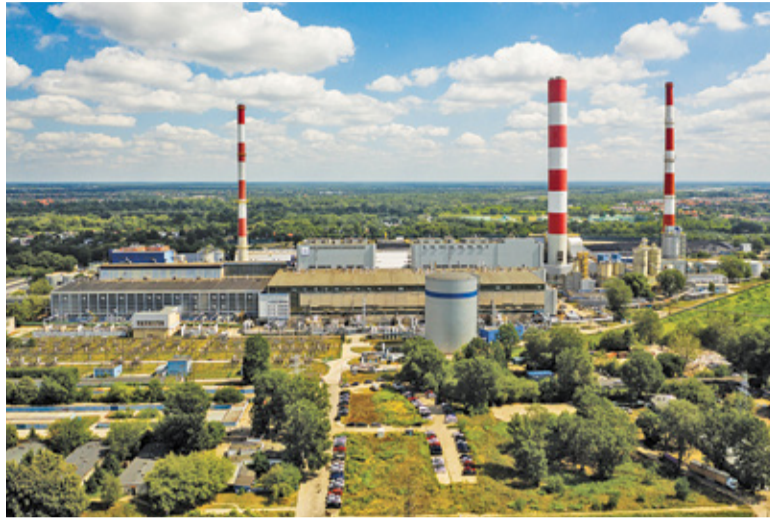
Budowa gazociągu będzie krokiem do konwersji elektrociepłowni z węgla na gaz ziemny

Według przygotowanej przez PGNiG Termika koncepcji trasa gazociągu ma rozpoczynać się w Gassach, następnie przebiegać przez Czernidła, Łęg, Ciszycę, Opacz, Obórki, Bielawę i Okrzeszyn i dalej w kierunku Powšina. Na całej długości gaz zostanie poprowadzony rurami o średnicy 70 cm, które zostaną wkopane w ziemię na głębokość min. 1,2 m. Po wybudowaniu gazociągu zostanie ustalona strefa kontrolowana wynosząca 12 m (po 6 m po obu stronach jego osi). Jako że instalacja będzie przebiegać przez tereny prywatnych nieruchomości, spółka przewiduje wypłatę odszkodowań dla mieszkań-