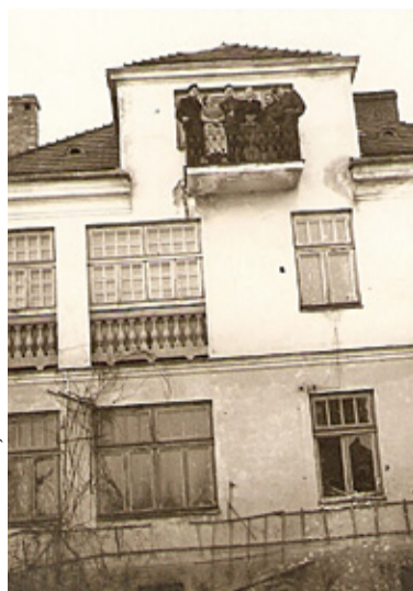
Dom Kołakowskiego przy ulicy Mickiewicza 17, w którym w czasie wojny mieściły się biura Arbeitsamtu, zdjęcie zrobione tuż po wojnie

napisz do autorki m.szturowska@przelegpiaseczynski.pl