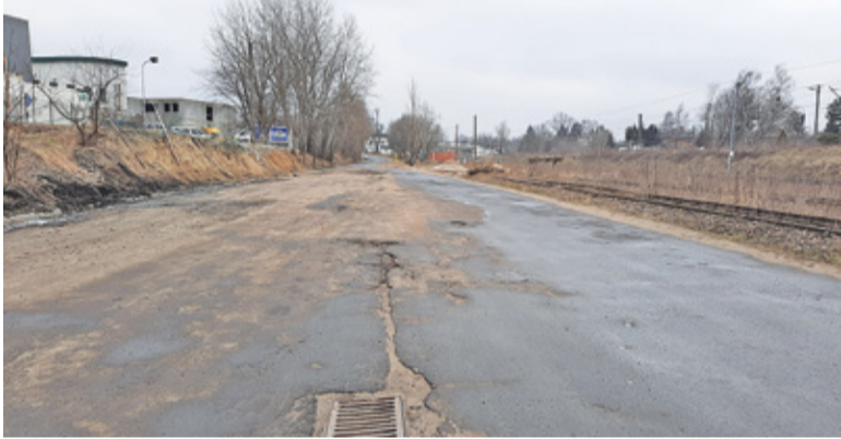
Nawierzchnia Towarowej w najbliższym czasie na pewno nie ulegnie znaczącej poprawie

– Jeśli uda nam się przejąć działki, chcielibyśmy kompleksowo przebu-