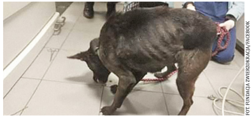
Na miejscu zabezpieczono zwierzęta w stanie skrajnego wyczerpania

Na wniosek inspektora OTOZ Animals ponownie zjawia się policja, w asyście której inspektorzy wchodzą