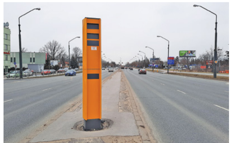
W powiecie piaseczyńskim staną dwa z 26 nowych fotoradarów ITD

– W analogicznym okresie w 2020 roku tych naruszeń urządzenia zare-