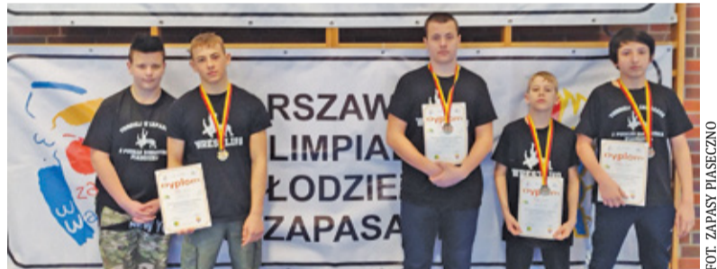
Zapaśnicy ekipy UKS Piątka Piaseczno znów na podium

Ostatnio na łamach Przeglądu Piaseczyńskiego informowaliśmy o niezwykle udanym weekendzie zapaśników drużyny UKS Piątka Piaseczno. Młodzi zawodnicy wywalczyli worek medali na Warszawskiej Olimpiadzie Młodzieży w stylu klasycznym, a zaledwie dzień później stawali na podium podczas Ogólnopolskiego Turnieju Zapaśniczego Białoleka Wrestling Cup. Minął tydzień i kolejny raz możemy pogratulować ekipie zapaśników z Piaseczna.