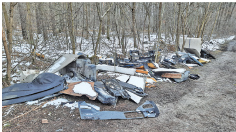
Przy leśnej drodze wylądowały fragmenty karoserii, tapicerki, ale też elementy mechaniczne

– Kolejny raz ktoś potraktował las jak wysypisko śmieci. Po rozbiórce samochodów części metalowe powędrowały na złom (lub jako części zapasowe do starych samochodów) zaś niepotrzebne plastiki, tapicerki itp. do lasu – zauważa Sławomir Fiedukowicz z Nadleśnictwa Chojnów. – Trudno przesądzić, czy sprawcami są złodzieje samochodów, czy też nielegalne „złomownie” oszczędzające na kosztach (wszak wywiezienie przyczepy na PSZOK kosztuje). O nielegalnym wysypisku wiadomość została lesznowlaska policja, która zajmie się namierzaniem sprawców. Na kolejne złomowisko samochodowych odpadów jeden z mieszkańców natrafił niedaleko budowanej szkoły w Zamieniu.