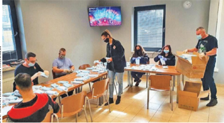
W Piasecznie dzieleniem maseczek zajęli się strażacy

– Wykonaliśmy szybkie testy 40 strażakom, którzy zgłosili się do pomocy, wszystkie były negatywne i wówczas osoby te podjęły się, oczywiście w