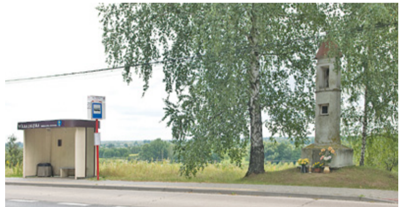
Konserwator odmawia zgody na przesunięcie kapliczki w Moczydłowie

– Na to będzie potrzeba około 28 miesięcy, włącznie z nową decyzją środowiskową – zapowiada Kandyba. Jego zdaniem przetarg na budowę nowego przebiegu drogi 724 mógłby zostać