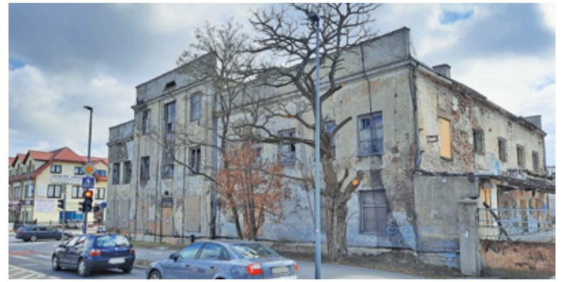
Na początku lutego gmina zabezpieczyła spijący się budynek siatką

– Są już wstępne pomysły na zagospodarowanie Starej Mleczarni, przygotowujemy się do konkursu, w którym wyłonimy projektanta dla tego obiektu