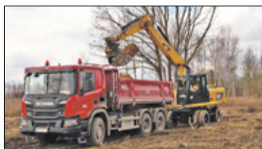
|| Konstancin-Jeziorna - Nowe miejsca parkingowe s. 5