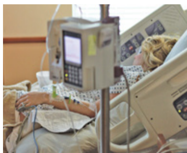
Do szpitala coraz częściej trafiają ludzie młodzi

Z danych piaseczyńskiego sanepidu wynika, że w pierwszym kwartale 2021 roku podwojona została już liczba zakażeń wirusem SARS-CoV-2 z całego roku 2020.