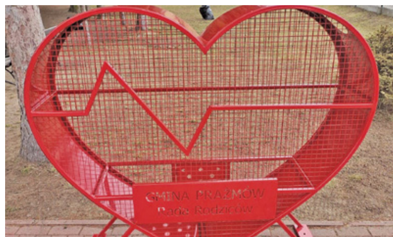
Pojemnik na plastikowe korki znajduje się przed głównym wejściem do budynku szkoły i jest dostępny w godzinach pracy placówki

Środki uzyskane dzięki zbiórce pomogą sfinansować rehabilitację 10-letniego Grzesia Jarosza, mieszkańca Krupiej Wólki. Kiedy chłopiec miał 6 miesięcy, zdiagnozowano u niego lekooporną padaczkę pod postacią zespołu Westa. W dalszej diagnostyce u chłopca stwierdzono też niedorozwój nerwu ocznego. Badania genetyczne wykazały duplikację ramienia chromosomu X, co najprawdopodobniej jest przyczyną wszystkich problemów. Ta wada występuje praktycznie wyłącznie u dziewczynek – do niedawna mały mieszkaniec gminy Prażmów był jedynym takim chłopcem w Polsce. Grześ przeszedł po-