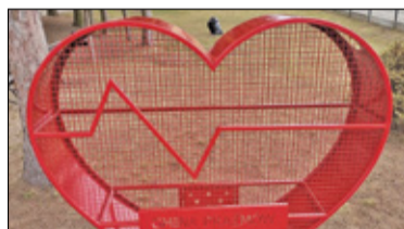
|| Uwieliń - Nakrętkowe serce s. 7