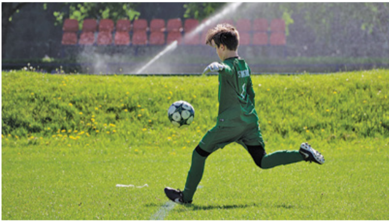
Młodzi zawodnicy będą musieli ćwiczyć w domach

W połowie marca Mazowiecki Związek Piłki Nożnej wydał komunikat, w którym poinformował kluby o zawieszeniu rozgrywek seniorskich w piłce nożnej. W początkowej wersji przerwa nie dotyczyła meczów dzieci i młodzieży od A1 do F2, które miały się odbywać zgodnie z terminami rundy wiosennej. Najnowsze ob-