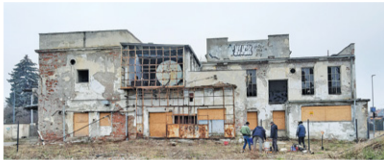
Teren wokół mleczarni został ogrodzony po tym, jak na początku grudnia w budynku znaleziono zwłoki mężczyzny

w oczy jeszcze bardziej niż wcześniej. Wpisany do ewidencji zabytków budynek dawnego Domu Ludowego musiał czekać na analizy architektoniczne i wytyczne konserwatora, ale też na