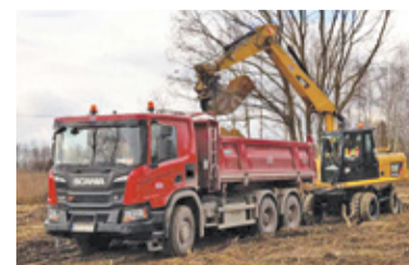
Gmina wybuduje 100 m nowej drogi

Rozpoczęła się rozbudowa ulicy J. Hlebowicza w Konstancinie-Jeziornie. Prace mają potrwać do połowy maja.