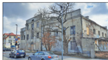
|| Piaseczno - Mleczarnia - czas na koncepcję s. 2