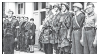
|| Historia - Akcja na Arbeitsamt w Piasecznie cz.2 s. 12