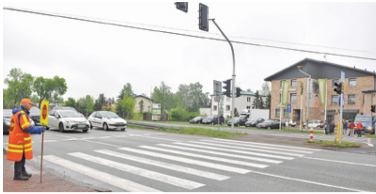
Sygnalizacja świetlna na skrzyżowaniu w Mrokwie pojawiła się dopiero po tym, jak samochód śmiertelnie potrafił nauczycielkę

Dane z zamontowanego przy skrzyżowaniu al. Krakowskiej z ulicami Szkolną i Rejonową urządzenia rejestrującego samochody przejeżdżające na czerwonym świetle są bardzo niepokojące. W lutym br. po raz kolejny padł tu rekord Polski – kierowcy zignorowali sygnalizację świetlną 300 razy. A i tak był to prawdopodobnie jeden z bardziej optymistycznych wyników. Jak dowiedzieliśmy się w Inspekcji Transportu Drogowego, w covidowym roku 2020, kiedy jednak wskaźniki ruchu na drogach zdecydowanie spadły, w Mrokwie odnotowano aż 8000 przypadków wjazdu na skrzyżowanie na czerwonym świetle. Daje to przeciętnie 666 pojazdów miesięcznie. I oznacza de facto, że średnio 22 razy dziennie na tym skrzyżowaniu zagrożone jest życie ludzkie. W