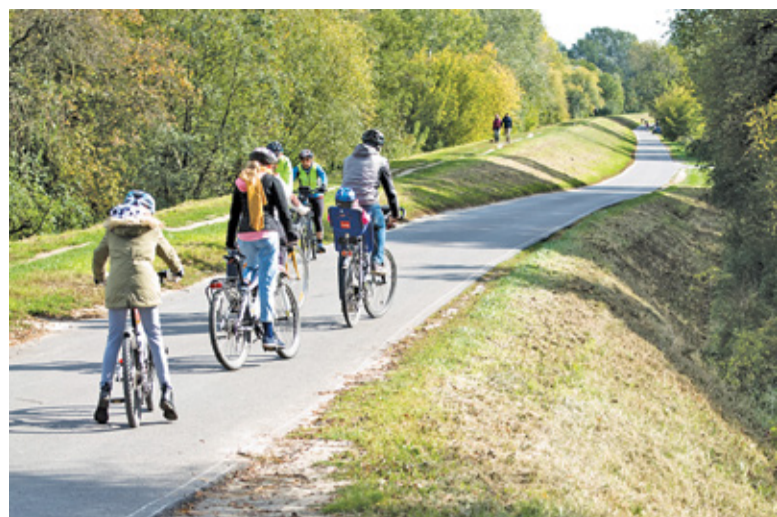
Trasa wzdłuż wałów wiślanych cieszy się ogromną popularnością wśród miłośników dwóch kółek

Przy okazji konsultacji wokół projektu wśród mieszkańców Konstancina rozwinęła się gorąca dyskusja na temat bezpieczeństwa rowerzystów i przestrzegania przez nich przepisów ruchu drogowego. Wiele osób zwracało uwagę na zachowanie cyklistów właśnie na trasie wzdłuż Wisły. Długa, prosta i asfaltowa droga zapewnia bowiem idealne warunki do bicia „życiówek”, stąd często można tu spotkać profesjonalnych (czy też quasi-profesjonalnych) kolarzy, rozpędzających się nawet do 60 km/h. Z trasy korzystają jednak również osoby, dla których wycieczka rowerowa jest