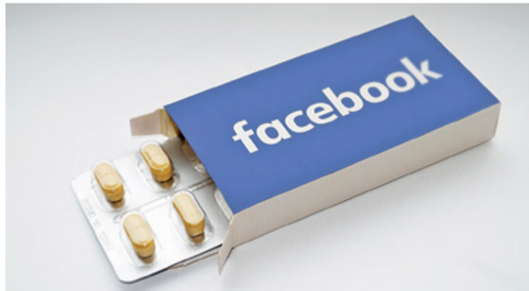
Facebook to lek czy raczej placebo?

Ten ostatni rodzaj może też mieć formę nie pytań, a dzielenia się swoimi uwagami, często pełnymi emocji. Nie brakuje postów wyrażających wściekłość, która – jak wynika z treści – gromadzi się od kilku dni czy tygodni. Najczęściej chodzi o usterki typu uszkodze-