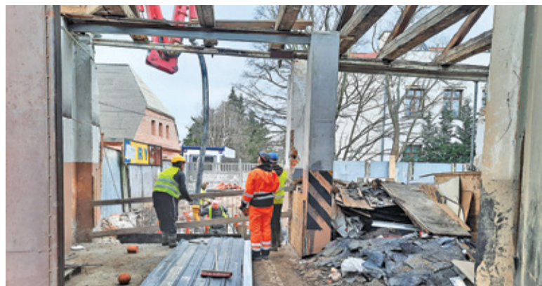
Dobudowane elementy, ale też spora część dachu, zostały już rozebrane. W ubiegłym tygodniu były wylane fundamenty pod nową część budynku