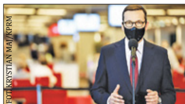
|| Kraj - Szczepienia ostro przyspieszają s. 4