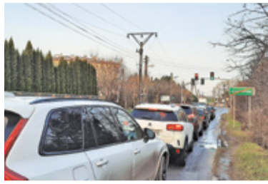
Wraz z postępującą zabudową Józefosławia narastała potrzeba pilnej przebudowy głównej drogi wylotowej do ul. Puławskiej

W przetargu złożono trzy oferty. Najniższa opieka na nieco ponad 39 mln zł, najwyższa na ponad 60 mln zł.