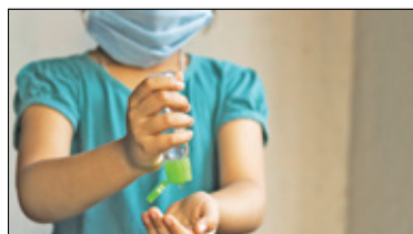
|| Powiat - Mniej chorób zakaźnych w pandemii s. 5