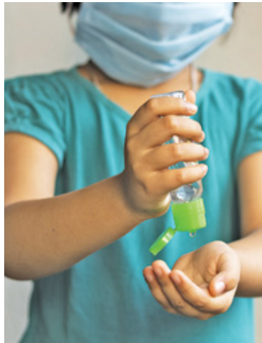
Obostrzenia sanitarne ograniczyły również inne zakażenia

Drastycznie spadła za to liczba zakażeń i zatrucí związanych z układem