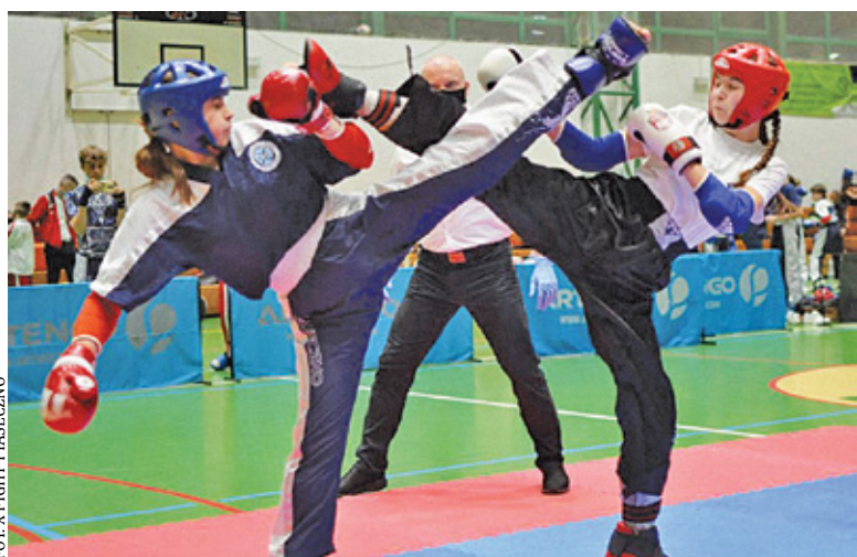
Coroczny turniej Piaseczno Open

Rywalizacja kadetów starszych należała do Piaseczna, a zawodnicy X-Fight w świetnym stylu wygrali w konkurencji drużyn i zdobyli wiele medali