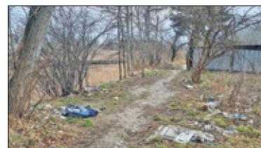
|| Góra Kalwaria - Brudno poza centrum? s. 6