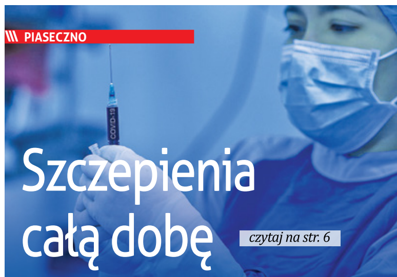
Władze gminy wyznaczyły już dwa punkty szczepień w centrum miasta

Gmina ogłosiła przetarg na projekt i budowę sygnalizacji świetlnej na skrzyżowaniu ulic Kościuszki i Nadarzyńskiej.