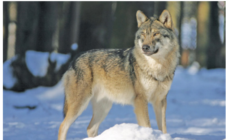
Obecności wilków w naszej okolicy nie zaobserwowano. Wyraźnie widać za to działalność puszczonego luzem psów

– To psy – mówi krótko Sławomir Fiedukowicz. – Kilukrotnie już natkną-