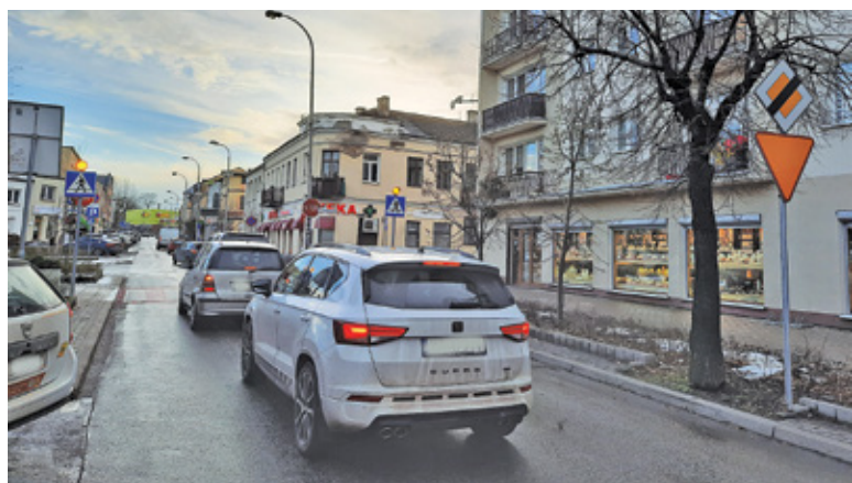
Kierowcy narzekają na korki w ul. Kościuszki

Jeśli uda się wyłonić wykonawcę, w ciągu 5 miesięcy od podpisania umowy przebudowane skrzyżowanie z sygnalizacją świetlną powinno być gotowe. To oznacza, że światła zostaną najprawdopodobniej uruchomione w okolicach