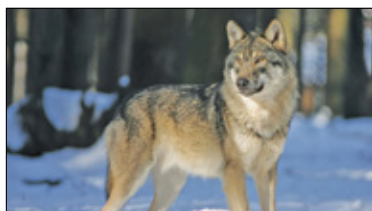
|| Region - Nie taki wilk straszny... s. 5