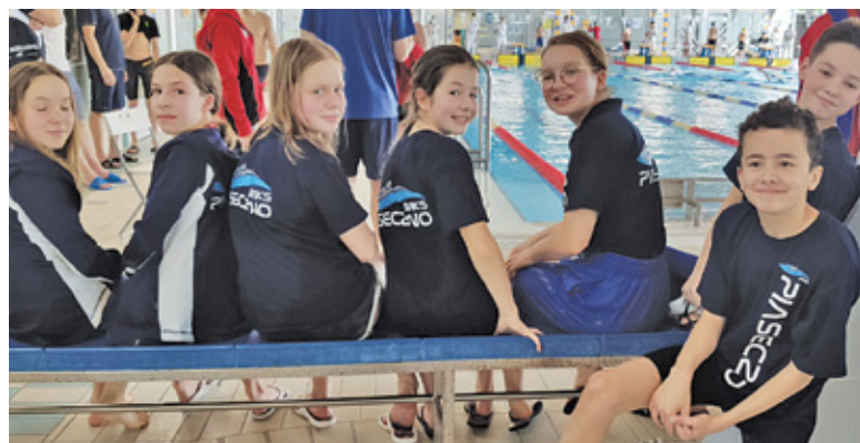
MKS Piaseczno na międzywojewódzkich zawodach

– Miejsce w rankingu ogólnopolskim będzie można oszacować po przeanalizowaniu wszystkich zawodów