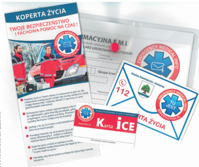
W skład koperty wchodzi formularz informacyjny, karta ICE i naklejka z numerem alarmowym

W takich właśnie przypadkach z pomocą przychodzi koperta życia. To pakiet zawierający najważniejsze dane na temat naszego stanu zdrowia. W skład koperty życia wchodzi karta informacyjna, w której obok podstawowych danych osobowych należy wpisać informacje o naszych chorobach, lekach, które przyjmujemy na stałe, czy alergiach na określone substancje. Ponadto w kopercie znajdziemy plastikową kartę ICE, na której wpisujemy numery