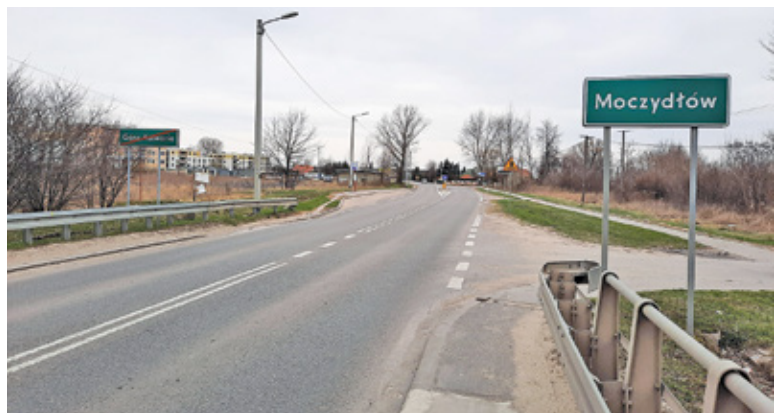
Miasto Góra Kalwaria obejmie między innymi przygraniczną część Moczydłowa

Moczydłów, zlokalizowanego między drogą krajową 79 a wojewódzką 724. Mieszkańcy Kalwaryjki od lat prosili o włączenie ich osady do miasta, podkreślając, że kilkanaście lat stanowili odrębne sołectwo, które zostało odgórnie włączone przez władze gminy do Krzaków Czaplinkowskich. Gmina dwukrotnie przeprowadziła konsul-