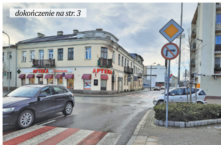
Ulica Nadarzyńska pozostanie drogą z pierwszeństwem przejazdu