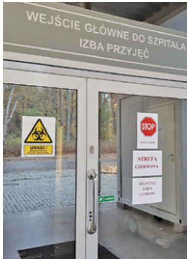
Jeden z punktów szczepień będzie funkcjonował w szpitalu

– Wszyscy pragniemy powrotu do normalności dlatego mobilizujemy nasze siły i zgłaszamy gotowość Piaseczna