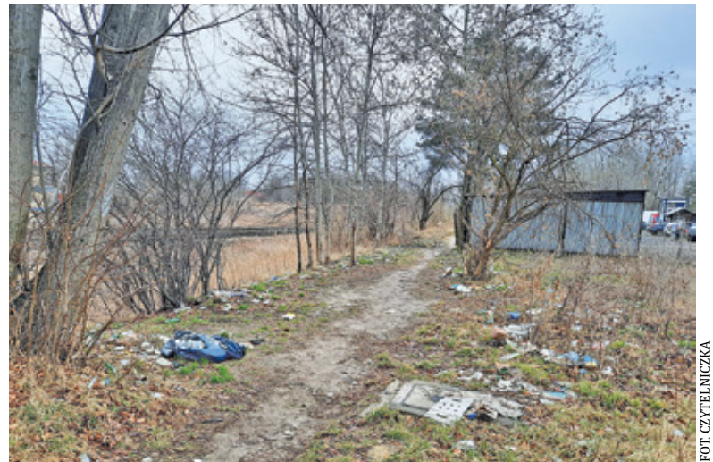
Teren przy stacji PKP jest notorycznie zaśmiecony

– W ubiegłym roku wymogliśmy na PKP, aby dokładnie wysprzątało ten