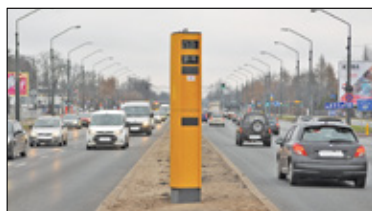
|| Mysiadło - Fotoradar straszak s. 4