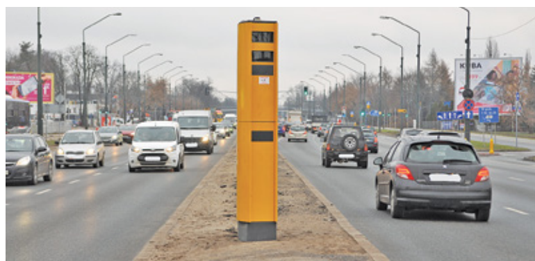
Większość kierowców przed fotoradarem zwalnia, często poniżej dopuszczalnej prędkości

Wygląda na to, że przyłącza nie udało się zrealizować od ponad dwóch lat. Na razie więc kosztownych fotek z fotoradaru na Puławskiej poczta nam