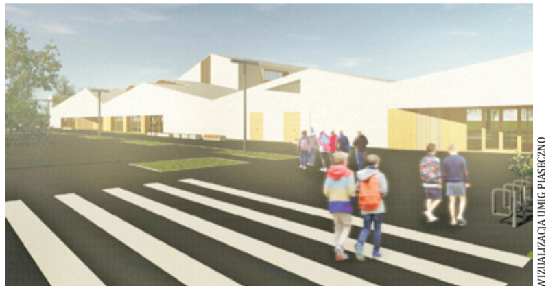
Szkoła w Julianowie powinna być gotowa w 2025 roku

złoty, z czego większość ma zostać wydana w latach 2024-2025. Dodatkowe środki w kwocie 6,3 mln zł zostały przeznaczone na obsługę komunikacyjną szkoły. W większości drogi mają być budowane w latach 2023-2024, ale wcześniej gmina planuje z kolei dokończyć przebudowę ulicy Urbanistów. Zmiany układu drogowego mają też objąć mniejsze uliczki na terenie Chyliczek. Część tych planów, wiążąca się z przejściem działek mieszkańców i zamianą funkcjonujących praktycznie jak wewnętrzne drogi uliczek w znacznie szersze utwardzone drogi, nie została przyjęta entuzjastycznie. Gmina część uwag mieszkańców uwzględniła.