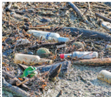
Gmina zachęca, by zgłaszać zaśmiecone miejsca. Oferuje też wsparcie w akcjach sprzątnięcia takich okolic

Już w najbliższy czwartek będziemy obchodzić Światowy Dzień Ziemi. Temu międzynarodowemu świętu tradycyjnie już towarzyszą akcje sprzątnięcia zaśmieconych miejsc. Niedawno furorę w mediach społecznościowych zrobił post aktorki Jolanty Fraszyńskiej, która