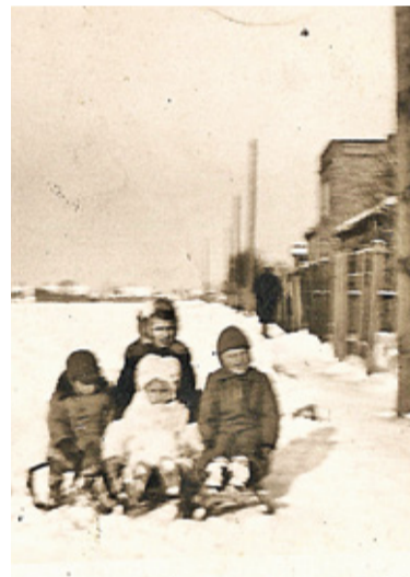
Zdjęcie z 1943 roku, dzieci z rodziny pochodzenia niemieckiego, ul. Bema

posażone we wszystko, co potrzebne w gospodarstwie domowym, bo zabrać ze sobą mogli niewiele. I wyruszyli