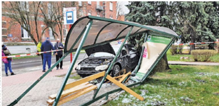
Na szczęście pasażerka oczekująca na autobus doznała tylko lekkich obrażeń

Okazało się, że sprawca ułatwił śledczym zadanie, ponieważ szaleńczą