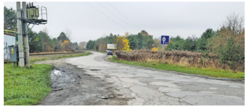
Burmistrz chciał zamknąć dla ruchu odcinek od ul. Głowackiego

– Nakazuję Burmistrzowi Miasta i Gminy Konstancin-Jeziorna wstrzymać roboty budowlane związane z realizacją obiektu liniowego tj. ulicy Działkowej na długości od skrzyżowania z ul. Wilanowską do skrzyżowania z ulicą Bartosza Głowackiego – czytamy w dokumencie PINB z końca lutego. W decyzji PINB mowa jest o pracach budowlanych, a nie remontowych czy wręcz bieżącym utrzymaniu drogi. Mimo to