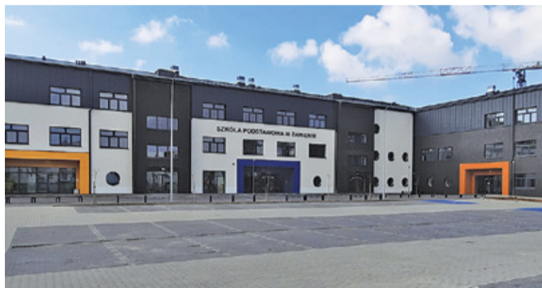
Imponujący budynek szkoły w Zamieniu czeka na uczniów

Rekrutację uczniów i pracowników do szkoły w Zamieniu prowadzi szkoła w Mysiadle. Od września naukę na Waniliowej rozpoczną na pewno uczniowie uczęszczający dotąd do filii przy ul.