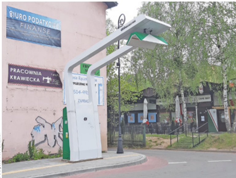
Ładowarka przy ul. Warszawskiej od dawna czeka na uruchomienie

Usterki udało się usunąć, pozostało zatem ustalić szczegóły dotyczące trasy elektrobusu. Tu pojawił się zgrzyt. ZTM chciał, by linia 251 nadal dojeżdżała do metra Wilanowska. Władze Konstancina wolały skrócić trasę do metra Kabaty. Pomysł gminy nie spodobał się mieszkańcom. Szczególnie tym, którzy pracują lub uczą się w Wilanowie. Skrócenie trasy jedyne autobusy dojeżdżające do metra Wilanowska oznaczał dla nich bowiem konieczność przesiadek.