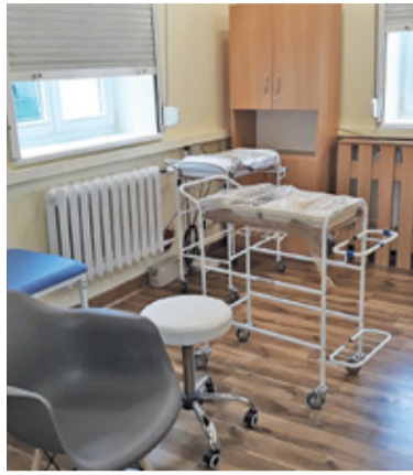
Gmina Piaseczno wyposażyła już gabinety i podpisała porozumienie w sprawie zapewnienia personelu do szczepień