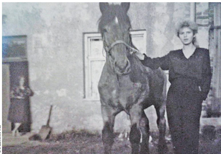
Podwórko u gospodarzy Faliszewskich, dom już nie istnieje

napisz do autorki m.szturowska@przekladpiaseczynski.pl