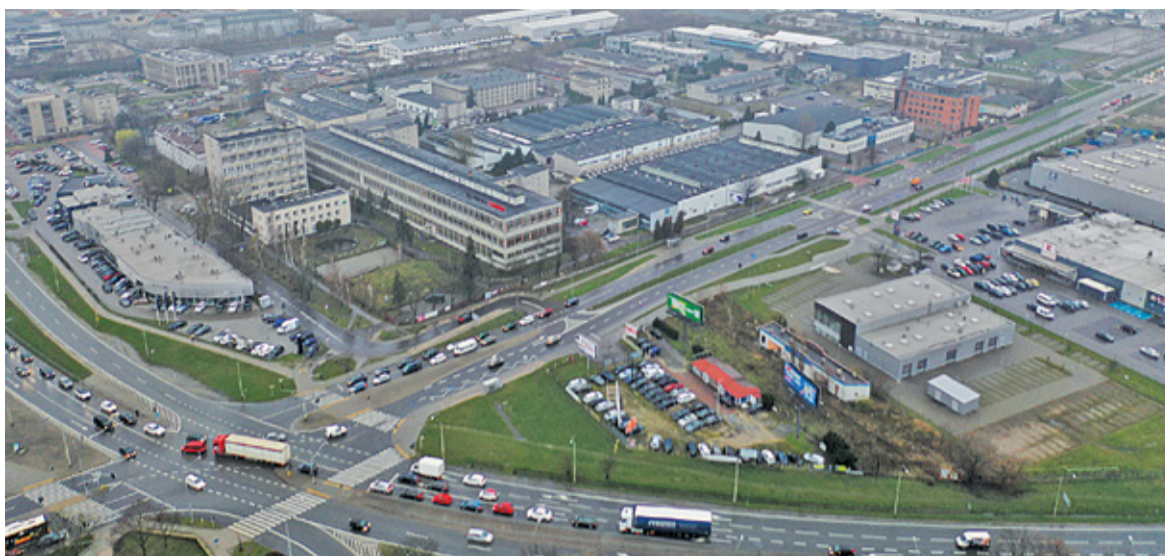
Nawet kilkaset tirów dziennie pojawiłoby się na skrzyżowaniu ulic Okulickiego, Puławskiej i Armii Krajowej

– Czy inwestor będzie chciał rozmawiać na temat swoich planów biznesowych – tego nie wiem, ale zastanówmy