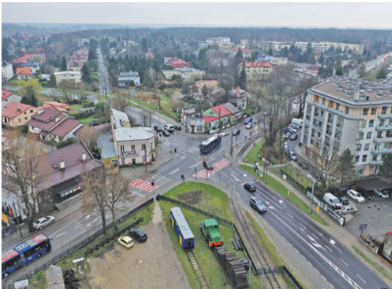
Zmiana organizacji ruchu obejmie nie tylko skrzyżowanie przy kolejce

Jest już gotowa koncepcja przebudowy drogi 722 na odcinku od ul. Kościuszki aż do przebudowanego w ubiegłym roku skrzyżowania z al. Kasz-