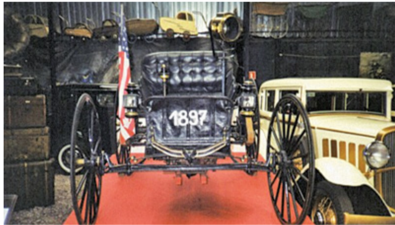
W zbiorach muzeum znajdziemy nawet najstarszy samochód w Polsce – JAG z 1897 roku!

Dla tych, którzy od pejzaży wolą bardziej industrialny krajobraz, ciekawą propozycją może być wizyta w powiecie przuszkowskim. Zaczniemy od powrotu do korzeni i zajrzyjmy do Muzeum Starożytnego Hutnictwa Mazowieckiego. Muzeum pozwoli nam przenieść się do starożytności. To właśnie na naszych ziemiach bowiem w czasach przed-