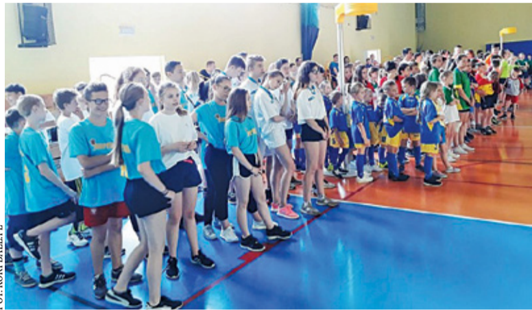
Korfball staje się coraz bardziej popularną dyscypliną sportu

W turnieju rozgrywanym w Szkole Podstawowej nr 3 przy ulicy Bielawskiej w Konstancinie-Jeziornie wzięło udział 20 drużyn z 5 kategorii wiekowych – klas: 0-I, II-III, IV-V, VI i VII-VIII. Poza zawodnikami gospodarzy pojawili