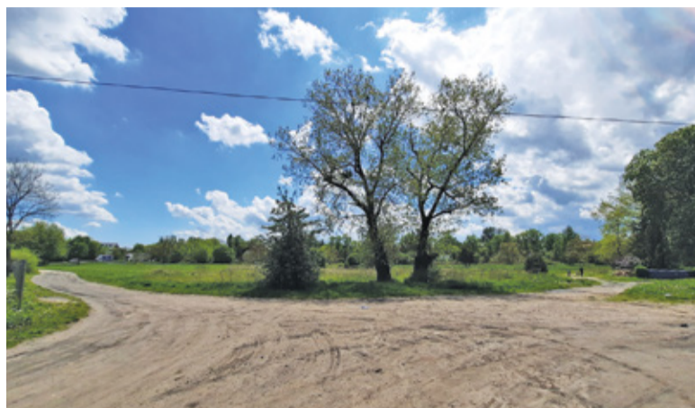
Radni są zdania, że ruch samochodowy powinien się kończyć na wysokości istniejącej zabudowy

Pomysł ten zdecydowanie nie spodobał się radnym z Komisji Promocji. Wizja przelotówki przez teren parku, równoległej do wiecznie zakorkowanej obwodnicy, jest ich zda-