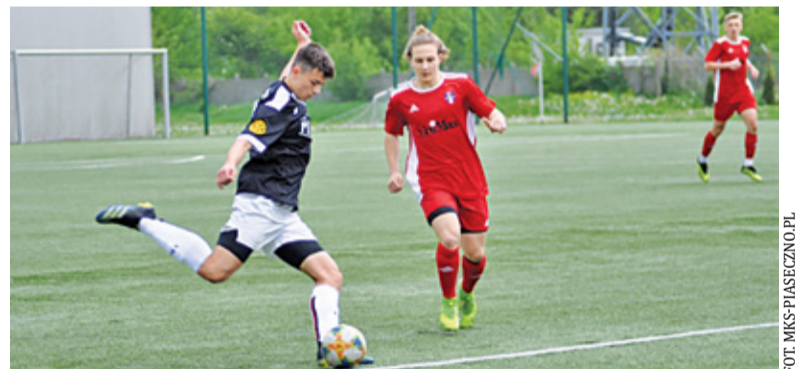
MKS Piaseczno i Polonia Warszawa to dwa kluby, które mogą wywalczyć awans do ligi okręgowej

W lidze okręgowej oczy kibiców zwrócone były na spotkanie Laury Chylice