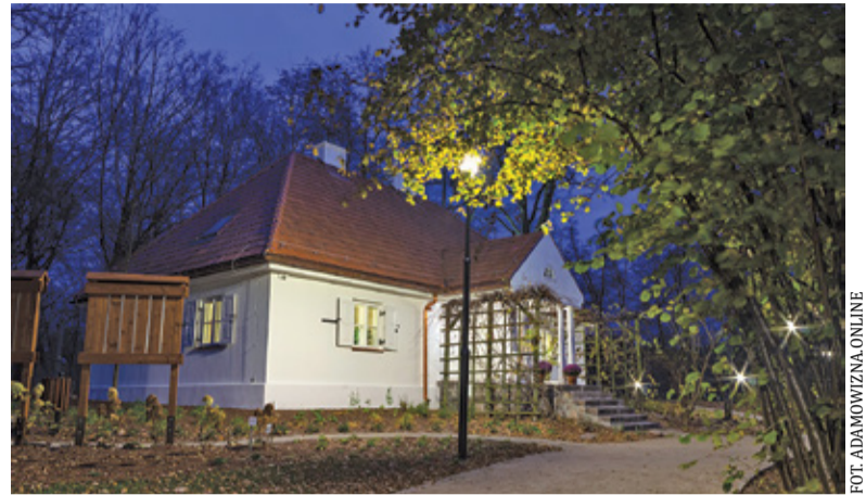
Niedawno odrestaurowany dworek Chełmońskich w Adamowiznie

Postać Józefa Chełmońskiego jest nierozdzielnie związana z Zachodnim Mazowszem. Proponujemy zatem wycieczkę po miejscach, w których autor „Babiego Lata” mieszkał... I których krajobrazy służyły mu za inspirację. Na początek odwiedzmy samego Mistrza – a właściwie jego pomnik na grodzickim deptaku. Kiedy już „przywitamy się” z artystą, ruszamy w kierunku Żabiej Woli