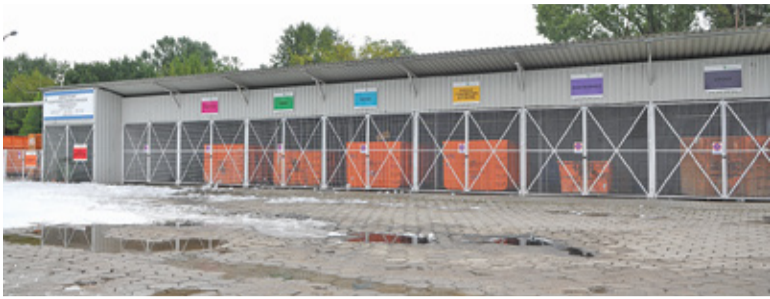
Konstanciński PSZOK odnotował spektakularny wzrost ilości przyjmowanych odpadów