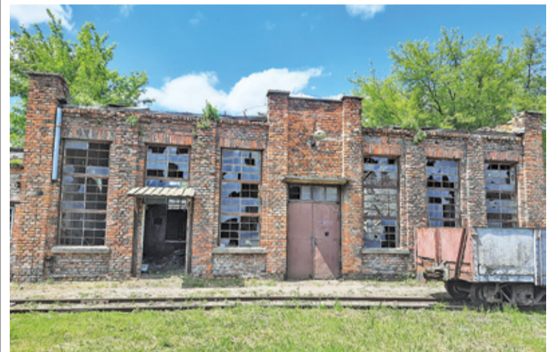
Ciekawy architektonicznie budynek tzw. kuźni wymaga pilnej modernizacji

W oparciu o ekspertyzę będzie dopiero można przystąpić do przygotowania konkretnej koncepcji modernizacji budynków i ich przeznaczenia. Magazyn WMD miałby być wykorzystany na cele muzealno-wystawiennicze. Przeznaczenie tzw. kuźni zależy przede wszystkim od oceny stanu budynku i zaleceń konserwatora dotyczących ewentualnej modernizacji.