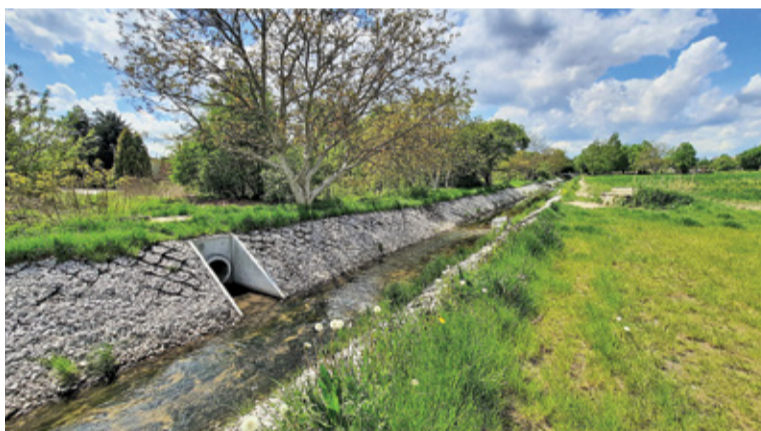
Koncepcja budowy nowej drogi zakładała wybudowanie mostku nad Peretką na wysokości ul. Orzeszkowej