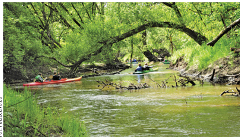
Na Jeziorce mamy do dyspozycji kilka spływów o różnym poziomie trudności

Choć Las Młochowski oferuje przyjemne otoczenie zieleni, na wypad bliżej natury warto wybrać powiat piaseczyński. Zaczynamy w Piasecznie, skąd drogą wojewódzką nr 722 docieramy do Zalesia Dolnego. Tu odbijamy w las i do-