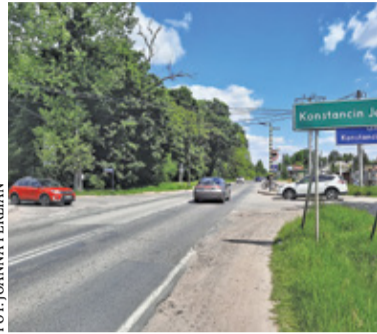
Wyjeżdżający z podporządkowanej ul. Śniadeckich kierowcy muszą liczyć na życzliwość kierowców jadących na DW721