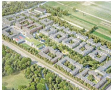
Osiedle przy Karczunkowskiej miało być największą inwestycją w ramach programu „Mieszkanie Plus”

Inwestycja przy ul. Karczunkowskiej w ramach programu „Mieszkanie Plus” miała rozpocząć się pod koniec 2018 roku. Ponad trzy tysiące mieszkań do tej pory powinny być więc dawno gotowe. Okazuje się jednak, że inwestycja w Nowych Jeziorkach może się nawet w ogóle nie rozpocząć. Jak informuje Radio dla Ciebie, plany osiedla trafiły do kosza. Projekt realizowany przez rządową spółkę PFR Nieruchomości