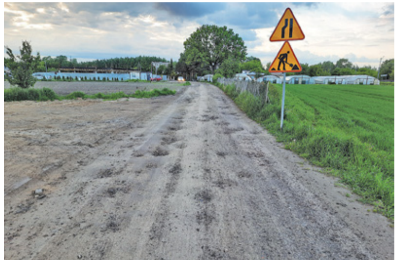
Stan lesznowolskiego odcinka ul. Gogolińskiej od lat jest fatalny, a kolejne inwestycje w okolicy tylko go pogarszają

Na problem ulicy Gogolińskiej zwrócili uwagę nasi czytelnicy. – Jestem kobietą w ciąży (nie jedyną), która mieszka na osiedlu, do którego można dojechać tylko ul. Gogolińską.