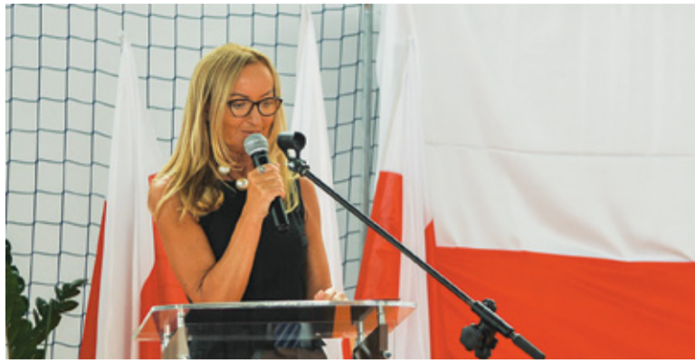
Większość wypowiadających się chwaliła samorząd