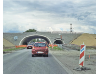
Ruch wahadłowy na ul. Słonecznej ma zostać wprowadzony 7 czerwca

Warto zauważyć, że ciągle trwają prace na ul. Szkolnej w Lesznowoli, co