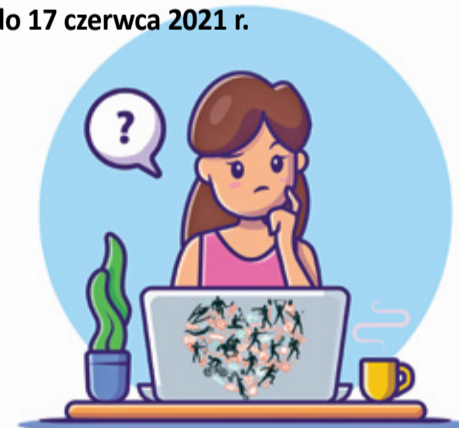
Zaprojektuj logo obchodów 100-lecia piaseczyńskiego sportu!

Te 100 lat to wspaniała sportowa historia i sukcesy wielu klubów i sekcji z terenu całej gminy Piaseczno, dlatego