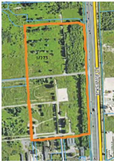
Na sprzedaż przeznaczona jest działka przylegająca do ul. Puławskiej po stronie zachodniej

Dodatkowo nieruchomości ta miała być, zgodnie z podjętą w styczniu br. uchwałą, obciążona hipoteką na rzecz spółki SETE w wysokości 14,7 mln zł. Chodziło o rozwiązanie umowy ze spółką na użytkowanie nieruchomości, która zgodnie z porozumieniem ze spadkobiercami miała stać się ich własnością. W chwili obecnej hipoteka działki 1/273 takiego obciążenia nie ujawnia. Poza wspomnianym obciążeniem