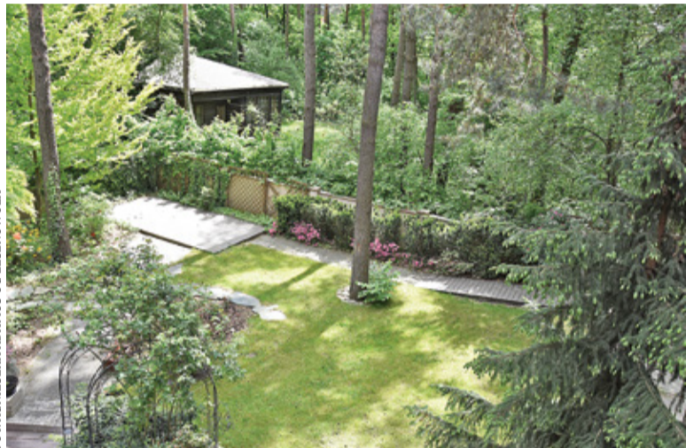
Tężnia ma stanąć w ogrodzie obok budynku Centrum Integracji Społecznej