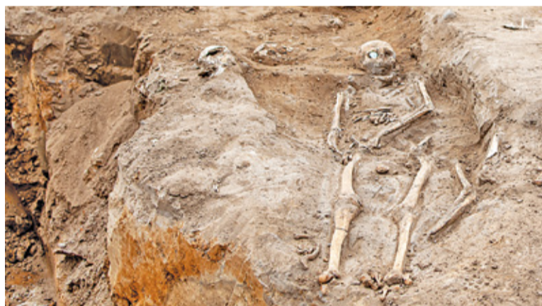
Znalezione kości, zwłaszcza stan uzębienia, wskazuje na młody wiek zmarłych

Ludzkie szczątki odkryto na budowie budynków komunalnych przy ul. Stępkowskiego kilka tygodni temu. Cmentarzysko ukazało się po rozbiórce starych domów. Jak dowiedzieliśmy się nieoficjalnie, pracujący na miejscu archeolodzy szacowali wiek najstarszych kości na około 300-400 lat. Z kolei z informacji, które uzyskaliśmy od policji wynika, że wiek poddanych badaniu fragmentów kości określono na około 100 lat. Ta informacja może się z kolei wydawać zaskakująca zważywszy na to, że zburzone budynki musiałyby powstać na świeżych grobach, co wydaje