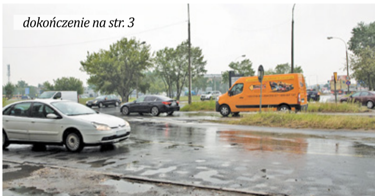
Na skrzyżowaniu ulic Okulickiego i Wojska Polskiego ma powstać sygnalizacja świetlna