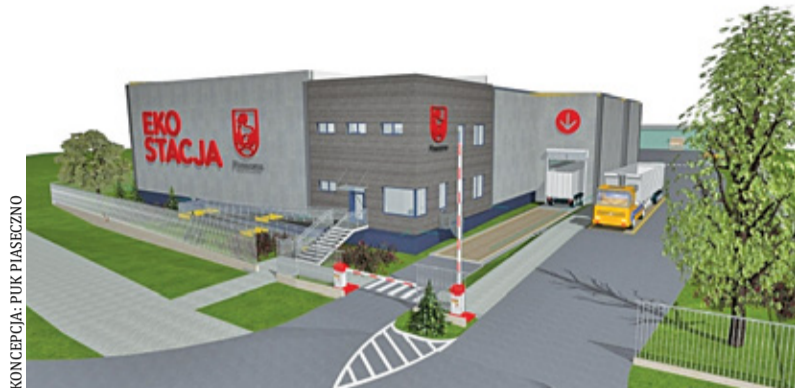
Hala przeładunkowa miała powstać w sąsiedztwie istniejącego PSZOK w Piasecznie