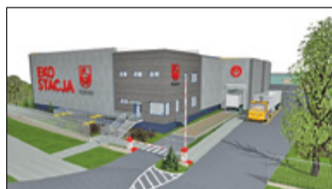
|| Piaseczno - Rozbudowa PSZOK przyniesie oszczędności? s. 6