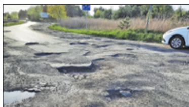
|| Kierszek - 10 km/h na Działkowej s. 2

PIASECZNO || GÓRA KALWARIA || KONSTANCIN-JEZIORNA || LESZNOWOLA || PRAŻMÓW || TARCZYN