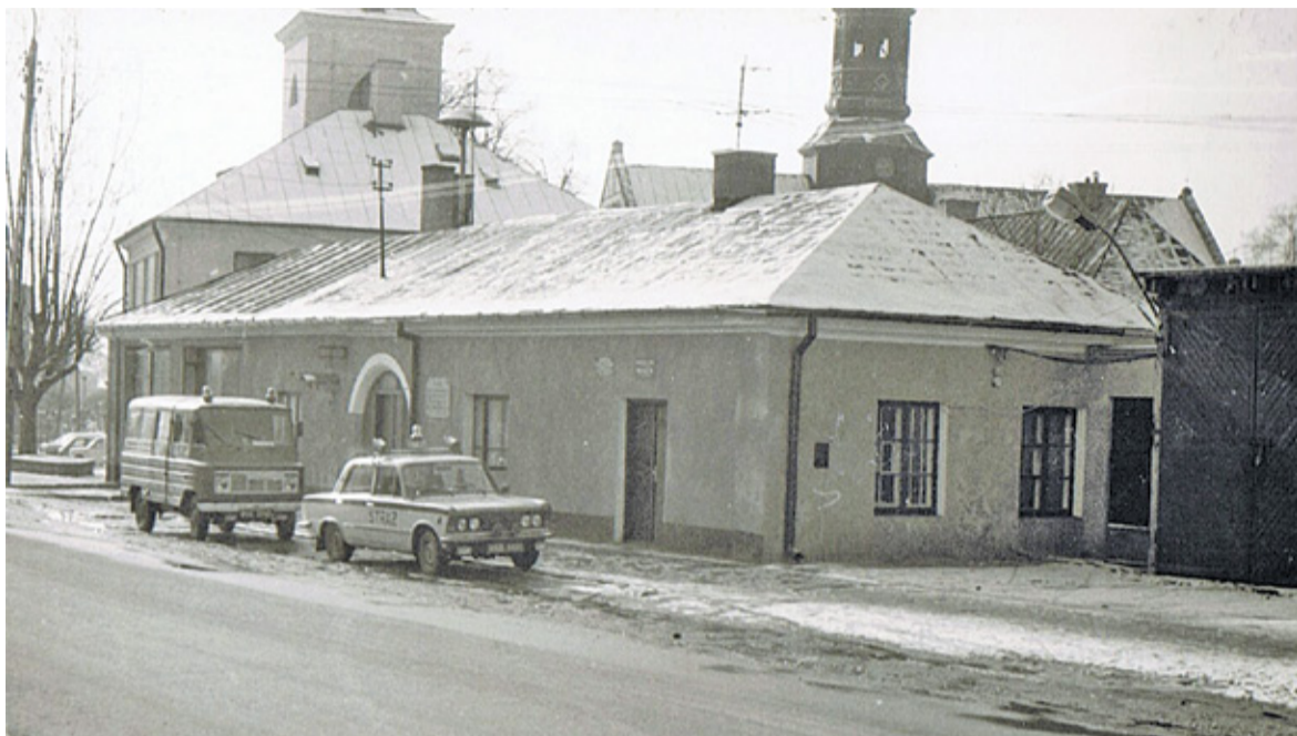
Remiza w 1988 r.

zyskali wygodną siedzibę. Lata jednak mijały, w Piasecznie przybywało mieszkańców. Z biegiem czasu potrzeby rosły i wkrótce okazało się, że remiza jest zbyt mała. Szczególnie dało się to odczuć w latach 30., kiedy do strażaków „wprowadził się” Związek Strzelecki. Ba – przez krótką chwilę (w 1932 roku) w jednym z pomieszczeń funkcjonowało nawet... przedszkole. W 1934 roku zarząd Ochotniczej Straży Pożarnej rozpoczął rozmowy z władzami miasta na temat rozbudowy strażnicy. Plany były ambitne – remiza miała zyskać drugą kondygnację, na której miały się znaleźć m.in. kuchnia, świetlica, a nawet sala ze sceną i kabina filmowa.