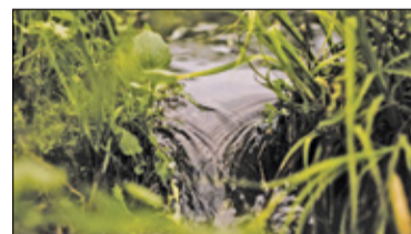
|| Konstancin-Jeziorna - Ścieki spłyną do Jeziorki? s. 11