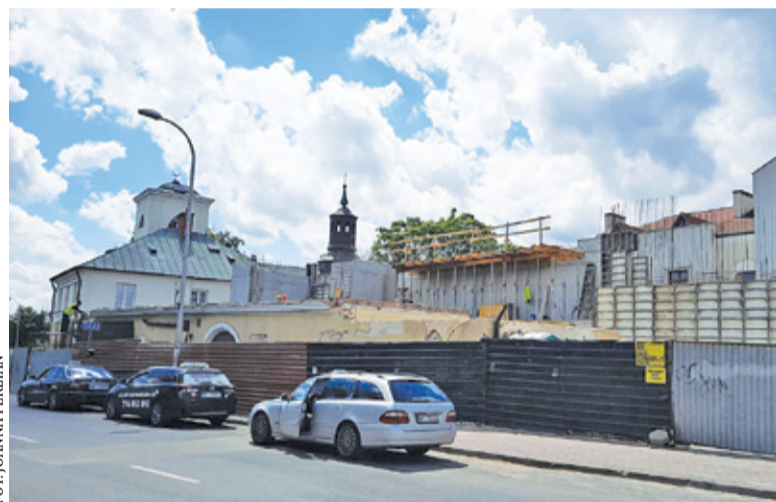
2021 r. Budynek zyskuje drugie życie

mieli łatwo. Na mundury musieli czekać ponad rok. Konie do ciągnięcia wozów z wodą i sprzętem pożyczali od mieszkańców jeszcze przez kilkanaście lat. Sprzęt magazynowano pierwotnie w drewnianej przybudówce na tyłach ratusza. Kto ufundował budowę murowanej strażnicy? Niestety nie zachowały się żadne dokumenty na temat zarówno projektu budynku, jak i środków finansujących jego powstanie.