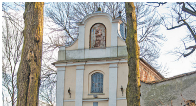
Wśród dotowanych zabytków znalazła się kaplica św. Antoniego, na remont której parafia otrzyma 80 tys. zł

Najwięcej środków trafi do gminy Góra Kalwaria. Tu dotację otrzymały dwa projekty na łączną kwotę 130 tys. zł. Pierwszym z nich jest wymiana stolarki okiennej w XIX-wiecznym klasycystycznym ratuszu, którą województwo wsparło kwotą 50 tys. zł. Pozostałe 80 tysięcy złotych otrzyma parafia pw. Wniebowzięcia NMP. Środki zostaną przeznaczone na prace konserwatorskie w kaplicy św. Antoniego. Warto również przypomnieć, że parafia po-