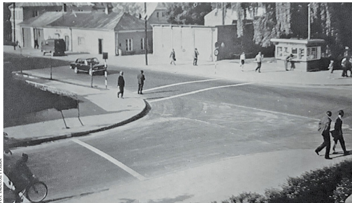
Remiza z dobudowanymi garażami, 1966 r.

obiecąc strażakom nową siedzibę na skrzyżowaniu ulic Warszawskiej i Młynarskiej. Ostatecznie jednak plany znów nie doczekały się realizacji, a strażacy