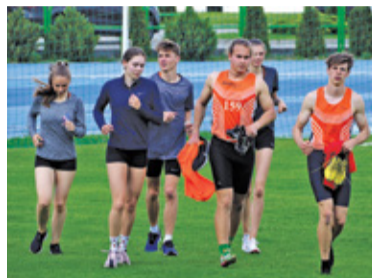
Rozgrzewka przed biegiem