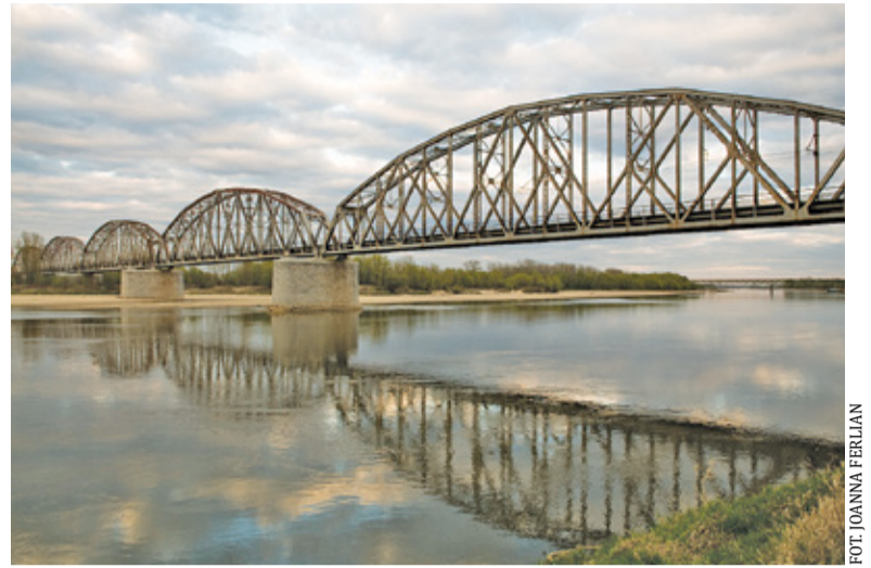
Na moście w Górze Kalwarii ma zostać położony drugi tor

– Burmistrz uzgodnił projekt w zakresie styku inwestycji z drogami gminnymi. W ramach przedsięwzięcia zaplanowano rozbiórkę i budowę od podstaw wiaduktów kolejowych nad ul. Lipkowską w Górze Kalwarii oraz