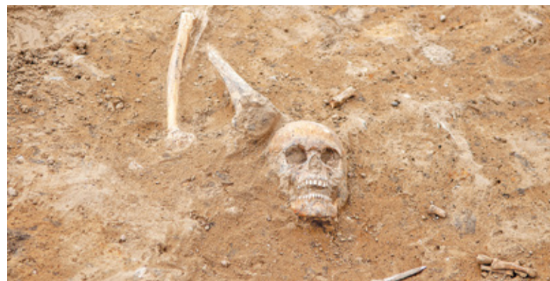
Odkryte przy budowie kości mają zostać ekshumowane i pochowane na cmentarzu w Tarczynie

– Badający szczątki specjaliści przedstawiają raport z badania i zobaczymy co w nim będzie – mówi burmistrz Tarczyna. Znalezienie odpowiedzi dotyczącej okoliczności powstania cmentarzyska