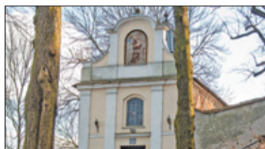
|| Powiat - Ratusz, kaplica i stara plebania s. 4