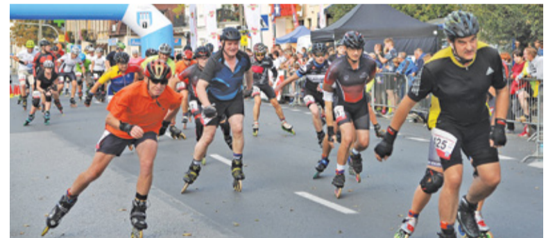
Jazdy na rolkach mogą się uczyć zarówno dzieci, jak i dorośli

na stadionie miejskim w Piasecznie. Na ostateczną realizację trzeba było trochę poczekać, ale właśnie rusza piaseczyńskie rolkowisko. Zimą tafla będzie służyła łyżwiarzom, a w cie-