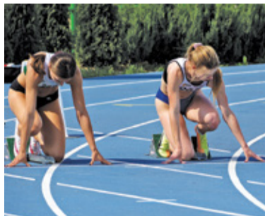
Ostatnie chwile przed startem