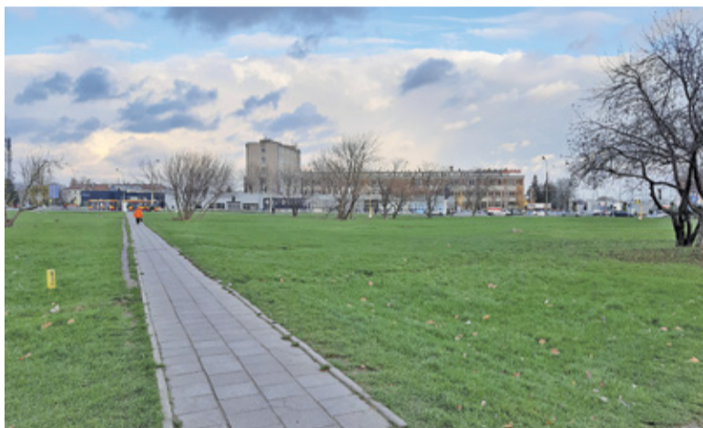
Łącznik między ulicami Puławską a Okulickiego miałby bieć w okolicy dzisiejszego chodnika do przystanku

Wyłoniony w przetargu wykonawca będzie miał rok na przygotowanie projektu i uzyskanie niezbędnych de-