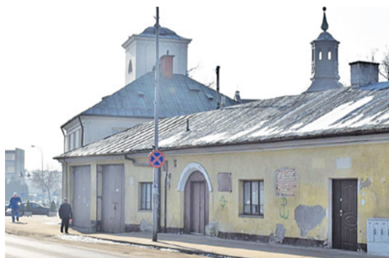
Opustoszały budynek straszył swym wyglądem. Rok 2017

życie strażnicy było kilka, ostatecznie jednak powstanie tu Galeria Strażnica. Remiza odzyska swój pierwotny kształt. Na tyłach budynku, od strony domu parafialnego, zostanie do niej dobudowana druga, dwukondygnacyjna część budynku. Na 600 metrach kwadratowych