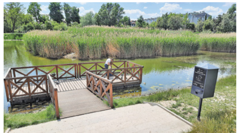
Kaczkomat wydaje karmę w godzinach od 10.00 do 18.00 – do 15 porcji na godzinę

W ostatnim czasie w mieście pojawiły się też kolejne domki dla owadów, między innymi na Skwerze Kisiela i w Zakątku Kultury. Domki dla owadów zapalających ustawione w sąsiedztwie te-