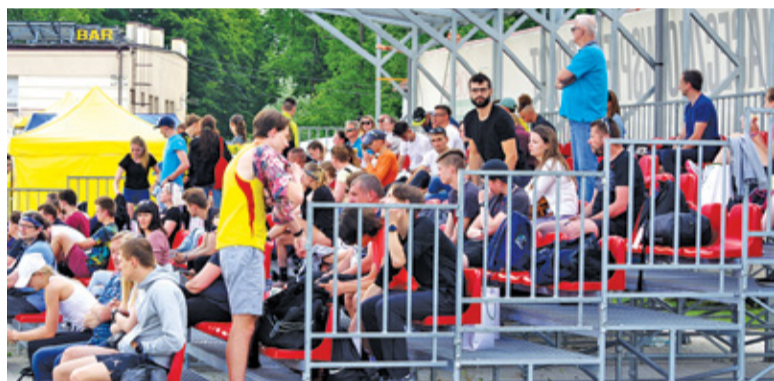
Uczestników tradycyjnie dopingowała fantastyczna publiczność