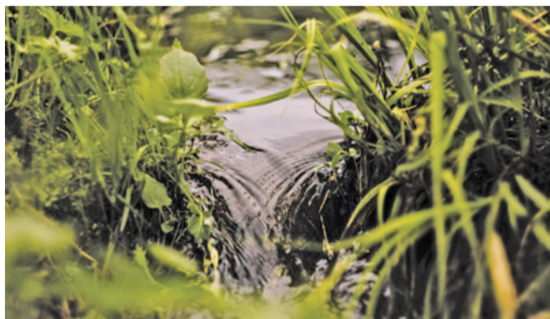
Pomysł odprowadzania oczyszczonych ścieków do dopływu Jeziorki niepokoi mieszkańców

Towarzystwo Miłośników Piękna i Zabytków Konstancina wystosowało do Wód Polskich petycję, w której protestują przeciwko odprowadzaniu ścieków do Rowu Jeziorki. Wskazują, że inwestor nie zawarł we wniosku