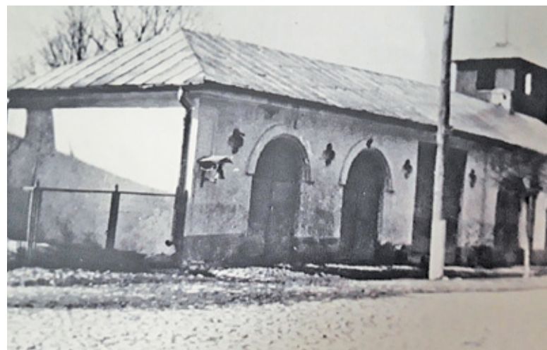
Remiza w latach 30.

obiecąc strażakom nową siedzibę na skrzyżowaniu ulic Warszawskiej i Młynarskiej. Ostatecznie jednak plany znów nie doczekały się realizacji, a strażacy