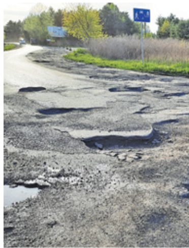
Na odcinku od ul. Głowackiego do pierwszych zabudowań ma obowiązywać ograniczenie prędkości do 10 km/h