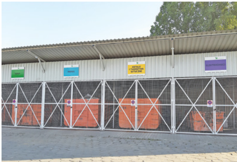
Konstanciński GPSZOK został zmodernizowany w ubiegłym roku

A co z GPSZOK, który odnotował spektakularny wzrost, jeśli chodzi o ilość odbieranych od mieszkańców odpadów? Jak wynika z analizy stanu gospodarki odpadami, w roku 2020 trafiło tu w sumie 1951 ton śmieci, podczas gdy w 2019 r. zaledwie 84 tony. Fakt, że