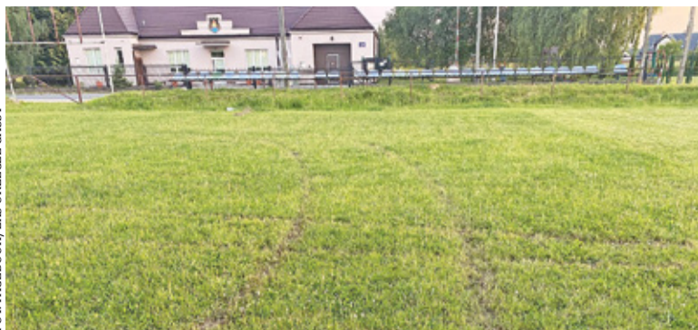
Zniszczona murawa klubu LKS Urzeczce Gassy

– Z wielkim smutkiem i rozgoryczeniem przyjęliśmy wiadomość o kolejnym akcie wandalizmu dotyczącym naszego boiska. W ostatnich dniach po raz kolejny nieznaną jeszcze osobą zdecydowała poćwiczyć drift na płycie boiska i zniszczyć murawę, co widać na zamieszczonych zdjęciach – poinformował na swojej stronie na Facebooku