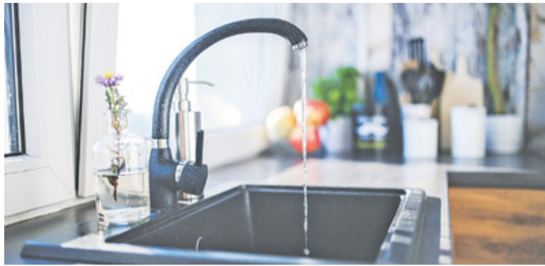
Najgorzej sytuacja wygląda latem w godzinach wieczornych

Tłumaczenie to nie satysfakcjonuje mieszkańców Józefosławia. Problem