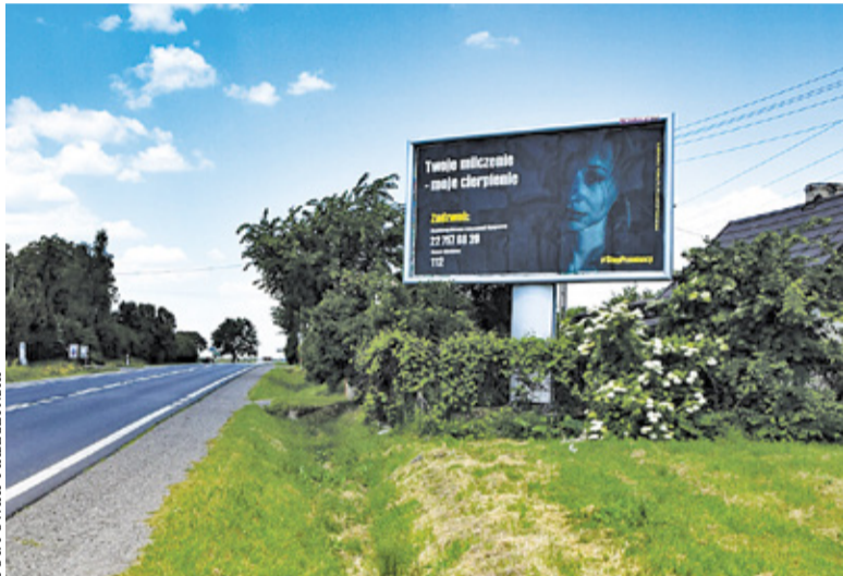
Billboardy kampanii antyprzemocowej pojawiły się w każdej z gmin powiatu

W ośrodku można uzyskać wsparcie także online, poprzez czat na stronie www.poikgorakalwaria.pl . Piaseczyński POIK w pierwszym kwartale 2021 roku