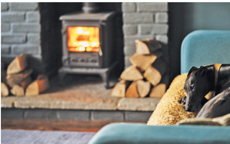
Najbliższe zimy mogą być ostatnimi, kiedy można jeszcze palić drewnem w kominku

dzinnych nie będzie chciało się pogodzić z tą decyzją. Część nieruchomości jest ogrzewana ciepłem rozproszonym z kominka, w innych kominek stanowi tylko uzupełnienie ogrzewania z innych źródeł. A przede wszystkim kominek i palący się w nim ogień często pełnią ważną rolę w tworzeniu atmosfery domu, dla wielu budujących swoje domy czy kupujących je od dewelopera, jest to element niezbędny. Palący się ogień przyciąga członków rodziny, towarzyszy spotkaniom z przyjaciółmi, oglądaniu