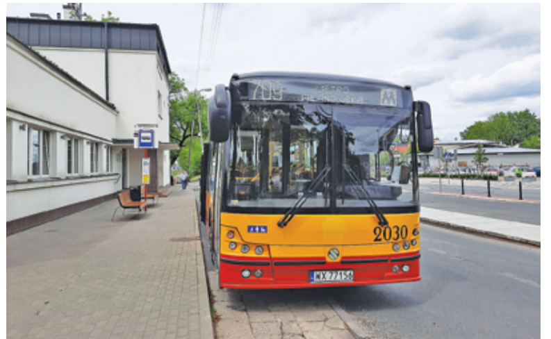
W najbliższych miesiącach linia 709 nie będzie dojeżdżała do dworca PKP

Na przełomie czerwca i lipca, w kolejnym etapie prac na Puławskiej czasowo zlikwidowany zostanie przystanek „Szkolna 01”.