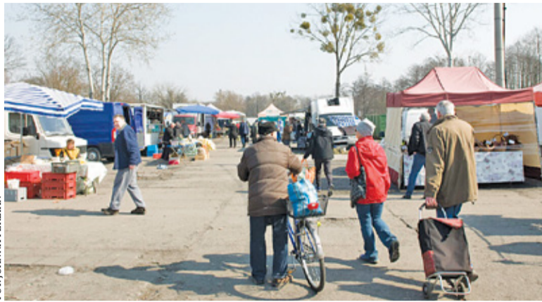
Mieszkańcy i kupcy od dawna skarżą się na złe warunki panujące na targowisku „Grapa”

Rozmowy o potrzebie utworzenia nowego targowiska trwają już od kilku lat. Obecny plac targowy gmina należy do prywatnego właściciela. Mieszkań-