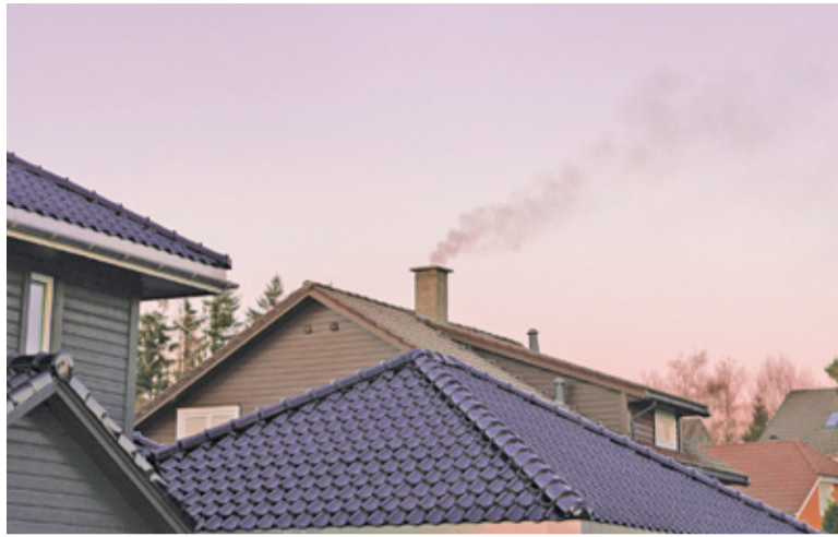
Im szybciej zdecydujemy się na wymianę pieca, tym wyższą dotację otrzymamy

Okazuje się jednak, że ta kwota może nie wystarczyć. Mieszkańcy sięgają bowiem po gminne środki na tyle chętnie, że wyczerpano już większość zabudżetowanej puli. Jak poinformował niedawno burmistrz Kazimierz Jańczuk, w tym roku rozdysponowano już 168