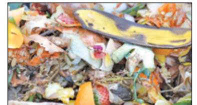
|| Kolonia Warszawska - „Koszmar powraca” s. 9