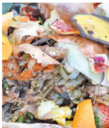
Szczegóły dotyczące wyglądu i funkcjonowania planowanej kompostowni nie zostały na razie upublicznione

Investor kilka lat temu zwracał się już z podobnym wnioskiem i w 2015 roku gmina wydała decyzję odmowną. Na pytanie czy – i w jakim zakresie – zmieniły dane dotyczące nowego wniosku, w tym regulacje prawne, które ewentualnie ułatwiają realizację tego przedsięwzięcia, nie uzyskaliśmy odpowiedzi ani od gminy, ani od inwestora. Gmina