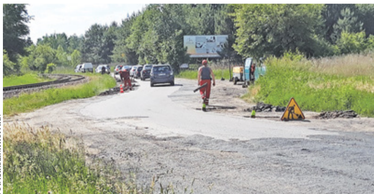
Wprawdzie jest to rozwiązanie doraźne, ale zdecydowanie poprawia komfort i bezpieczeństwo na tym fragmencie ulicy

W ubiegłą środę opublikowaliśmy artykuł o planowanych zmianach w organizacji ruchu na ul. Działkowej, w tym m.in. wprowadzeniu ogranicze-