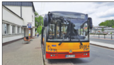
|| Piaseczno - Autobusy na nowych trasach s. 2