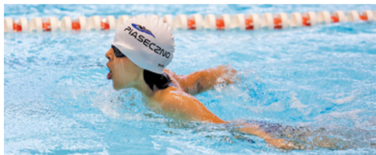
Walka reprezentantów MKS Piaseczno o medale podczas OMDO

– W czasie całego OMDO 2020/2021 MKS PIASECZNO repre-