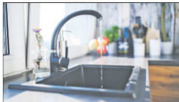
|| Józefosław - A woda ledwie kapie... s. 4