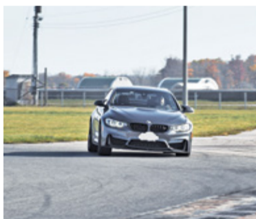
Wciskanie pedału gazu nie kończy się na parkingu

Rzeczywiście, parking obok parkowego placu zabaw zdradza ślady obecności „drifterów”. To wprawdzie niszczenie estetycznej nawierzchni położonej tu zaledwie kilka miesięcy temu, ale przynajmniej można mieć pewność,