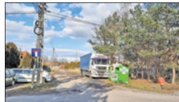
|| Góra Kalwaria - Ulica Papczyńskiego połączy miasto s. 6