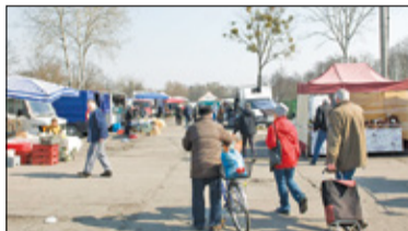
|| Konstancin-Jeziorna - Targ na „żeberku”? s. 2