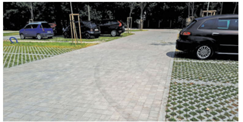
Część pseudodrifterów przeniosła się na nowy parking obok parku miejskiego

– Samochody pędzą głównymi ulicami miasta, Kościuszki, Jana Pawła II, Wojska Polskiego. Nocą ruch jest niewielki, ale jednak jest, to poważne zagrożenie – mówi nasza czytelniczka mieszkająca w centrum Piaseczna. – Dodatkowo jest to po prostu bardzo uciążliwe. Zwłaszcza teraz, gdy jest ciepło i