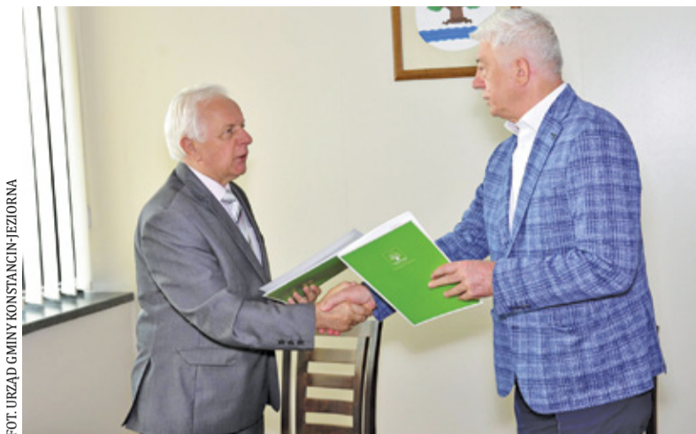
11 czerwca podpisano umowę na rozbudowę słomczyńskiej szkoły

W miniony piątek władze Konstancina podpisały umowę na realizację zadania. Wykonawcą będzie wyłoniona w przetargu firma Zab-Bud z Warszawy. – Ta informacja z pewnością ucieszy dyrekcję Czwórki, jej pracowników, uczniów oraz rodziców – wszelkie formalności związane z przebudową i rozbudową szkoły w Słomczynie zostały dopełnione – poinformował niedawno Urząd Gminy Konstancin-Jeziorna.