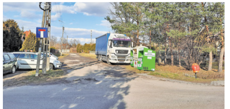
Ulica Papczyńskiego zostanie przedłużona od ul. Polnej aż do ul. Pijarskiej

Szczegóły projektu można obejrzeć na stronie internetowej gminy. Koszt projektu to ponad 376 tys. zł. Środki