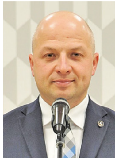
Większość radnych udzieliła burmistrzowi Piaseczna zarówno wotum zaufania, jak i absolutorium

– Pomimo zaplanowanego deficytu na poziomie ponad 50 mln zł, zwiększonego w trakcie roku nawet do 100 mln złotych, ostatecznie budżet zamknął się