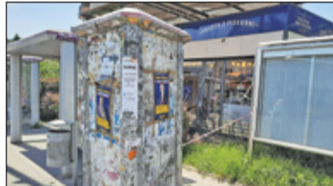
|| Piaseczno - Paskudny przeżytek s. 4