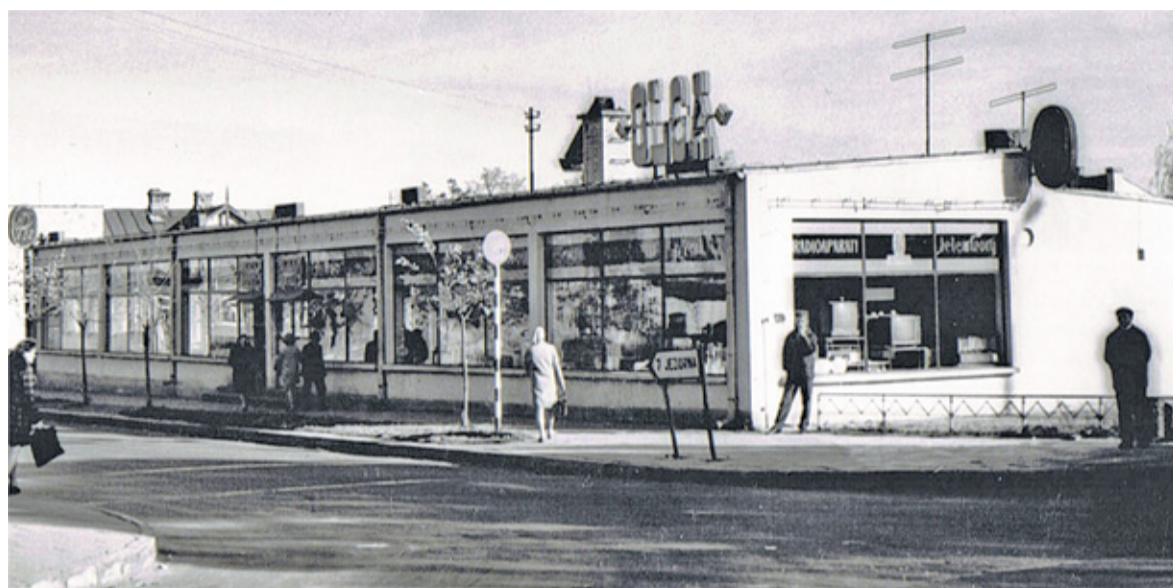
Sklep „Olga” w 1970 r.

PSS „Społem”, który wybudował tu pawilon handlowy. Tak w mieście pojawił się sklep „Olga”, w którym przez kilka