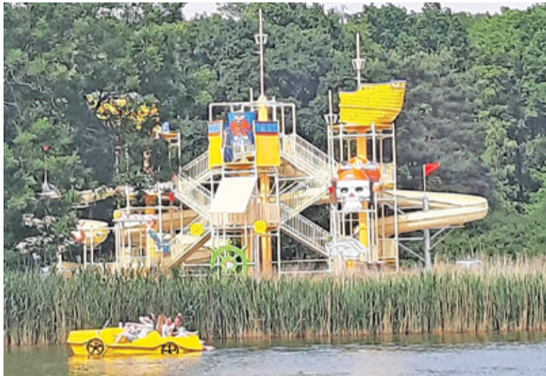
Park wodny był samowolą budowlaną, która została następnie zalegalizowana przez PINB w Piasecznie

– Nadto Rafałowi K. zarzucono posłużenie się podrobionymi dokumen-