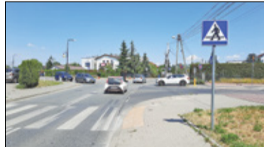
|| Józefosław - Skrzyżowanie do przebudowy s. 6