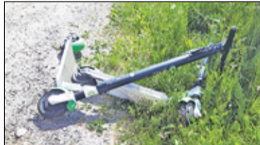
|| Konstancin-Jeziorna - Hulajnogi byle gdzie s. 6