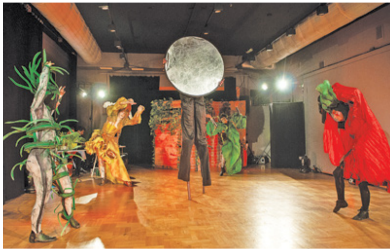
Ostatnio spektakl przeniesiony z pleneru został zagrany na widowni. Widzowie musieli przenieść się na scenę

Piaseczyńskie Centrum Kultury działa wyjątkowo prężnie. Oferta jest niezwykle bogata, często pojawiają się prawdziwe gwiazdy, choć mogłyby znacznie częściej. W przypadku gwiazd bilety znikają w ciągu kilku godzin, co powoduje frustrację wielu zainteresowanych. Niestety, widownia nie jest z gumy. Wielu artystów zaprosić się nie da, a powodów jest kilka. Po pierwsze wielkość sceny – raczej dedykowana kameralnemu zespołowi czy na monodram, bo zwyczajnie nie ma gdzie zmieścić więcej osób, sprzętu, scenografii. Po drugie wymagania artystów – nie każdy chce poświęcić czas na wy-