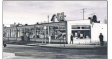
|| Tu zaszła zmiana - sklep „Olga” s. 9