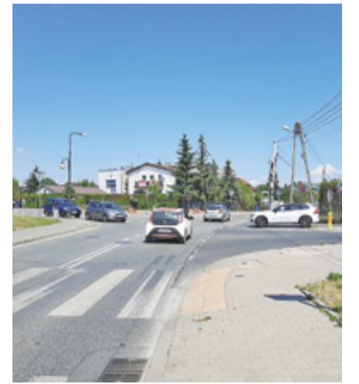
Na słabą widoczność narzekają zwłaszcza kierowcy wyjeżdżający ze wschodniej strony ul. Cyraneczki

Kierowcy narzekają na słabą widoczność na skrzyżowaniu ulic Julianowskiej i Cyraneczki. Zwłaszcza ci, którzy wyjeżdżają ze wschodniej nitki ul. Cyraneczki.