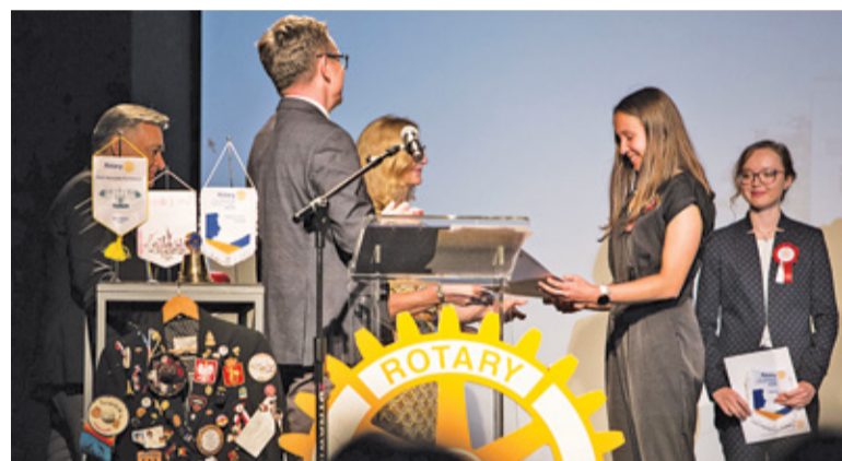
Wręczenie stypendiów ufundowanych przez kluby Rotary Warszawa Konstancin i Warszawa Fryderyk Chopin

Do akcji dołączył się również zaprzyjaźniony z oboma polskimi klubami Rotary Catania Est z Sycylii. Pieniądze będą zbierane przez cały następny rok. Jeśli się uda zebrać więcej niż koszt na-