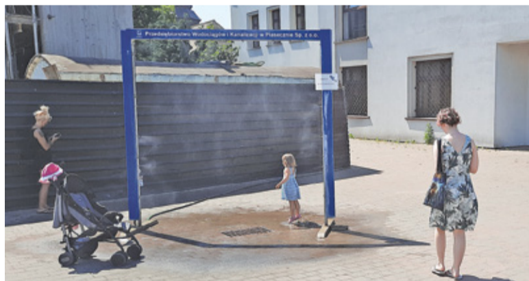
Delikatna mgiełka z kurtyn wodnych zachęca mieszkańców do skorzystania z ochłody

Zakazu uruchomienia dysz z wodą nie ma, ale po blisko dwuletniej przerwie okazało się, że są problemy techniczne z jej uruchomieniem.