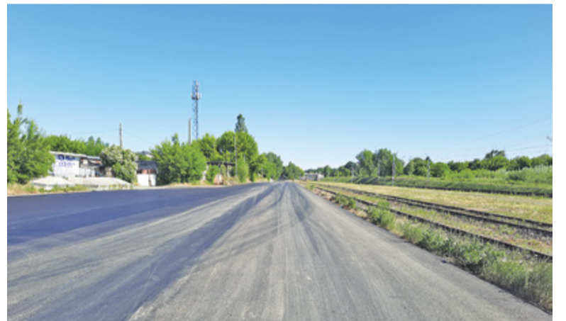
Ulica Towarowa zyskała nakładkę asfaltową na całej swej długości

Biegająca między dworcem PKP a miejskim targowiskiem ulica ma bowiem niebawem przejąć część ruchu z ul. Dworcowej.