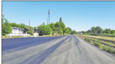
|| Piaseczno - Towarowa przejmie ruch z Dworcowej s. 2

PIASECZNO || GÓRA KALWARIA || KONSTANCIN-JEZIORNA || LESZNOWOLA || PRAŻMÓW || TARCZYN