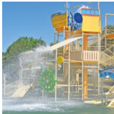
Zalesie Górne, ul. Wczasowa 1 tel. 222 905 120