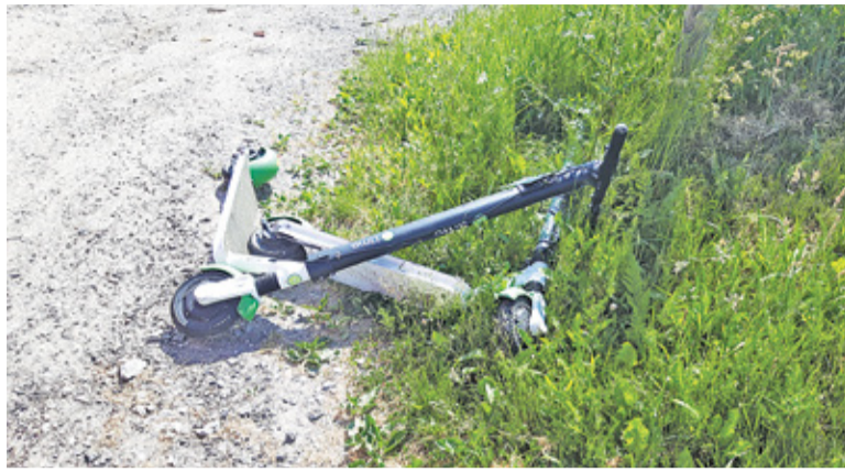
Do straży miejskiej wpływa coraz więcej zgłoszeń na bezmyślnie porzucone hulajnogi. Służby zapowiadają bardziej zdecydowane kroki

– To jest swoista nowość, wcześniej takich zgłoszeń nie mieliśmy. Teraz jest tego coraz więcej. Niemal na każdej ulicy trafia się porzucony pojazd. Dostajemy wiele zgłoszeń, że hulajnoga stoi na przykład w poprzek chodnika tak, że kobieta z wózkiem czy osoba niepełno-