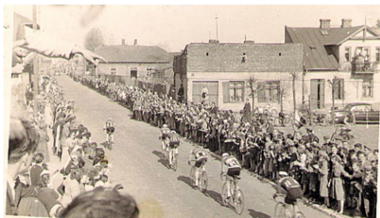
Wyścig Pokoju w 1958 roku. Kolarze jadą nowo rozbudowaną ul. Chylickowską. W tle zabudowania ul. Warszawskiej, po prawej plac, na którym za kilka lat powstanie „Olga”

z mlekiem zastąpiły kartony i butelki. Wystrój jednak wciąż trącił PRL-em. Gdy wokół zaczęła wyrastać nowocześniejsza (i estetyczniejsza) konkurencja,