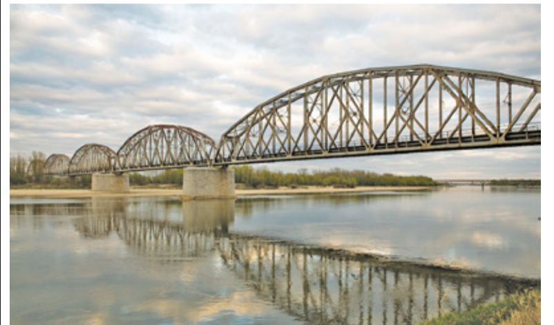
Most jest jednym z najbardziej znanych obiektów w Górze Kalwarii

Most kolejowy nad Wisłą na trasie Łuków-Skierniewice został zbudowany w 1954 roku. Posiada konstrukcję łukową ze stalową kratownicą. Składa