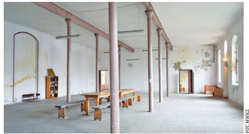
Wnętrze synagogi przez wiele lat pełniły rolę magazynu

Budynek dawnego domu modlitwy w 2016 roku odzyskała założona