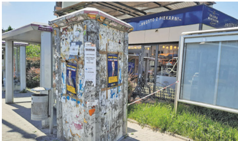
Wygląd słupów ogłoszeniowych zdecydowanie negatywnie wpływa na estetykę otoczenia

Obejrzelśmy słupy stojące przy przystankach na ul. Puławskiej, Chyliczkowskiej czy obok szkoły w Głoskowie.