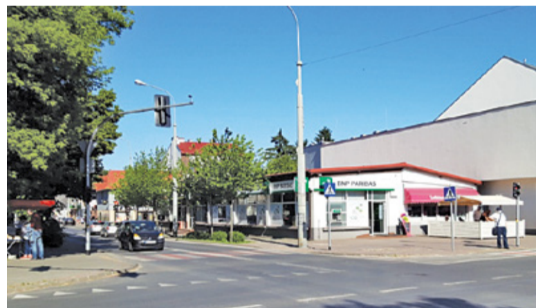
Dziś w miejscu „Olgi” znajduje się oddział banku

części, wydzielając w ten sposób nowy lokal pod sklep mięsny. I choć wiele osób jeszcze dziś z sentymentem wspomina „Olge”, nie sposób nie dostrzec jej mankamentów. Wchodząc do „Olgi” człowiek mógł bowiem odnieść wrażenie, że przeniósł się w czasie. Asortyment oczywiście się zmieniał, worki