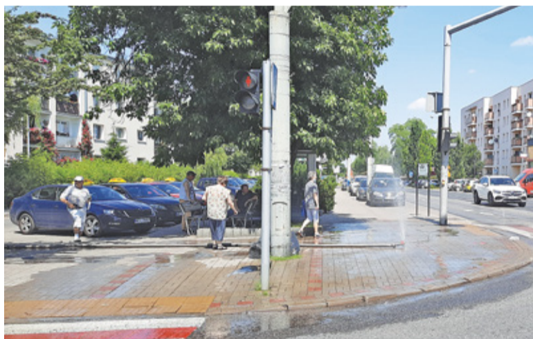
Strumień wody z kurtyn strażackich dla wielu jest zbyt intensywny

Temperatury przekraczające 30 stopni Celsjusza w dzień i sięgające 20 stopni w nocy dają się we znaki mieszkańcom od kilku dni. By ułatwić mieszkańcom ochłodzenie się w rozgrzanym mieście, w piątek 18 czerwca gmina uruchomiła pierwsze kurtyny wodne. Zazwyczaj w upalne lato mali i duzi mieszkańcy chętnie chłodzili się w fontannie na Rynku. Ta jednak na razie nie działa. Gmina zwróciła się z pytaniem o możliwość uruchomienia zarówno kurtyn jak i fontanny do sanepidu, wszak ciągle mamy stan epidemii.