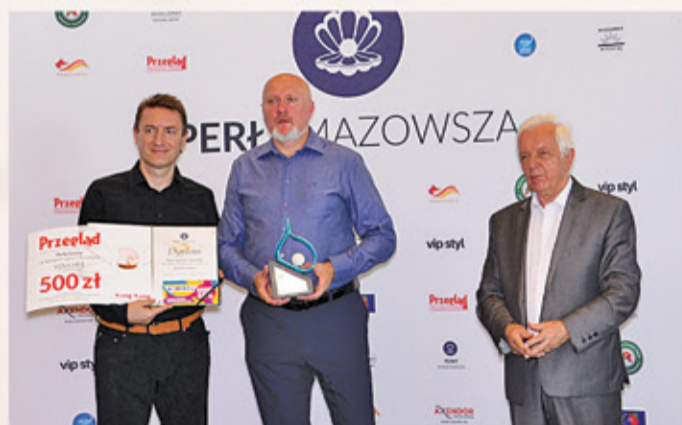
Turniej Piłki Plażowej – Perła Sportu Gminy Konstancin-Jeziorna