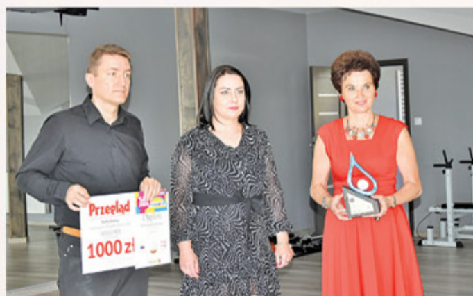
Strefa Kobiet – Perła Przedsiębiorczości Gminy Tarczyn