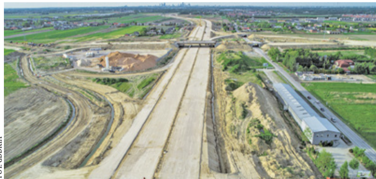
Nowy wykonawca ma połączyć wybudowany odcinek od Grójca do węzła Tarczyn Północ z budowanym właśnie węzłem w Lesznowoli

Czas realizacji zadania to 30 miesięcy od daty zawarcia umowy (z wyłączeniem okresów zimowych).