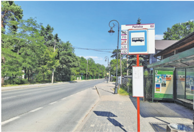
W grudniu 2020 r. ZTM podjął decyzję o zawieszeniu linii 200. Miało to związek ze spadkiem obłożenia linii w czasie pandemii

Temat przywrócenia zawieszonych linii pojawił się również podczas ubiegłotygodniowego posiedzenia Komisji Ładu Przestrzennego i Spraw Komunalnych. Zapytany o taką możliwość