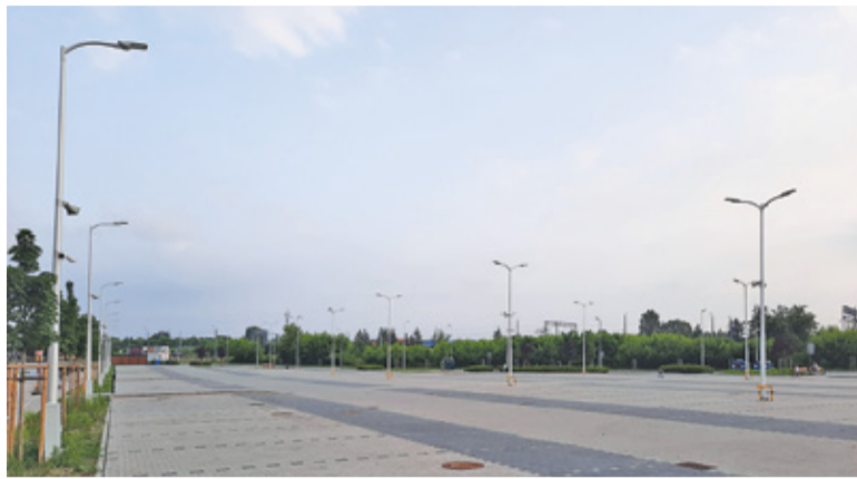
Kamery „obserwujące” plac targowy to blisko 20% wszystkich kamer w gminie Piaseczno

– Wszystkie kamery podłączone są siecią światłowodową do nowego Centrum Monitoringu Miejskiego, które