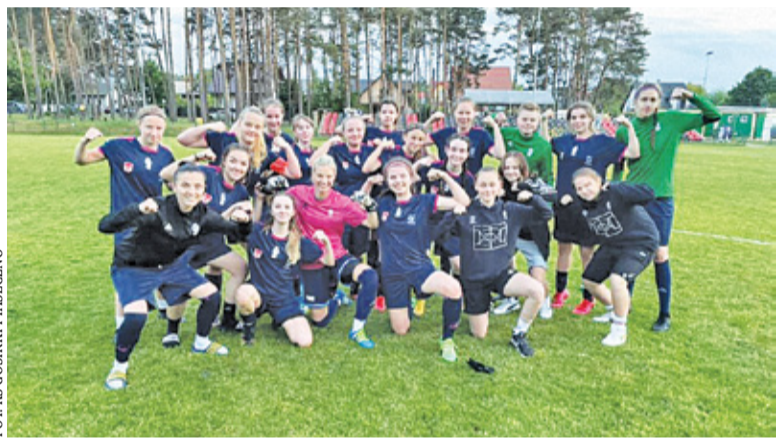
Gosirki Piaseczno zajęły 6. miejsce w tabeli IV ligi

Gosirki Piaseczno zdobyły łącznie w 18 ligowych meczach 25 punktów, strzelając 68 bramek przy 44 straconych. Ten wynik dał im 6. miejsce w tabeli IV ligi. Dobra postawa zawodniczek