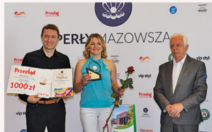
Farma Urody – Perła Przedsiębiorczości Gminy Konstancin-Jeziorna