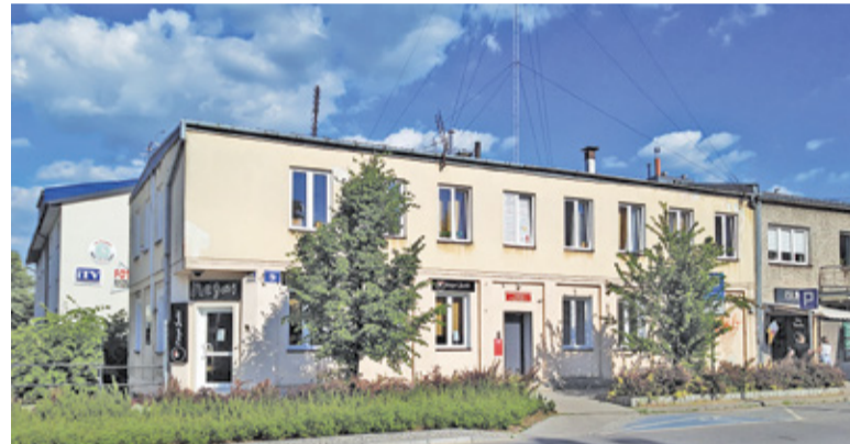
Kościuszki 9 współcześnie

W latach 60. budynek przeszedł gruntowną metamorfozę. Przebudowano parter i dobudowano piętro, upodabniając jego architekturę do nowo powstałego Domu Rzemiosł („Cech”). Wnętrze dostosowano na potrzeby służby zdrowia, która zajęła budynek na kolejne cztery dekady. Na dole działało pogotowie ratunkowe, piętro zajmowały gabinety przychodni lekarskiej. XXI wiek przyniósł kolejne zmiany. W miarę, jak Zespół Publicznych Zakładów Leczn-