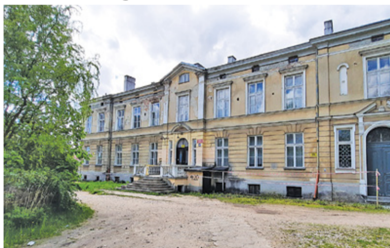
Budynek został wyłączony z użytkowania we wrześniu 2019 roku

Niszczący w parku zabytkowy budynek, zwany powszechnie pałacem, od 2015 roku jest własnością powiatu. Wcześniej w imieniu Skarbu Państwa zarządzał nim starosta piaseczyński. Jednak od lat dziewięćdziesiątych w budynku działa Katolickie Liceum Ogólnokształcące im. Cecylii Plater-Zyberkówny, prowadzone przez Stowarzyszenie Wychowanek Szkoły Gospodarstwa Wiejskiego w Chyliczkach „Chyliczanka”. Starostwo od kilku lat bezskutecznie stara się przejąć budy-