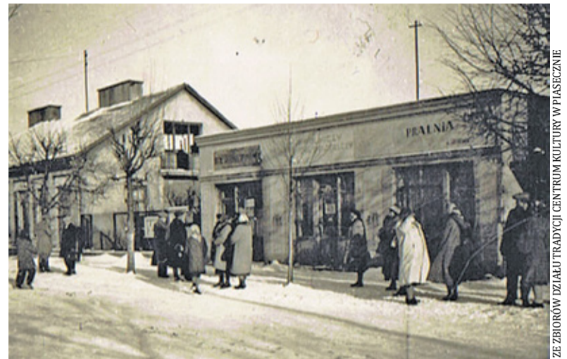
Ulica Kościuszki w 1953 r. Na pierwszym planie pralnia, na której miejscu stoi dziś Dom Rzemiosł „Cech”. W tle budynek przy Kościuszki 9, jeszcze parterowy i z dwuspadowym dachem

nictwa Otwartego w Piasecznie powiększała się o kolejne przychodnie, utrzymywanie niewielkiego punktu przy Kościuszki 9 traciło sens. Najpierw zniknęły gabinety na piętrze, pogotowie zmieniło