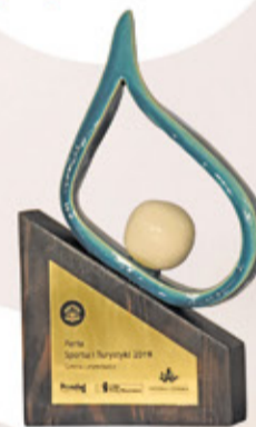
Statuetka Perły Mazowsza

Pełne relacje filmowe z wręczenia nagród Perły Mazowsza 2019 możecie Państwo zobaczyć na stronie perlymazowsza.pl