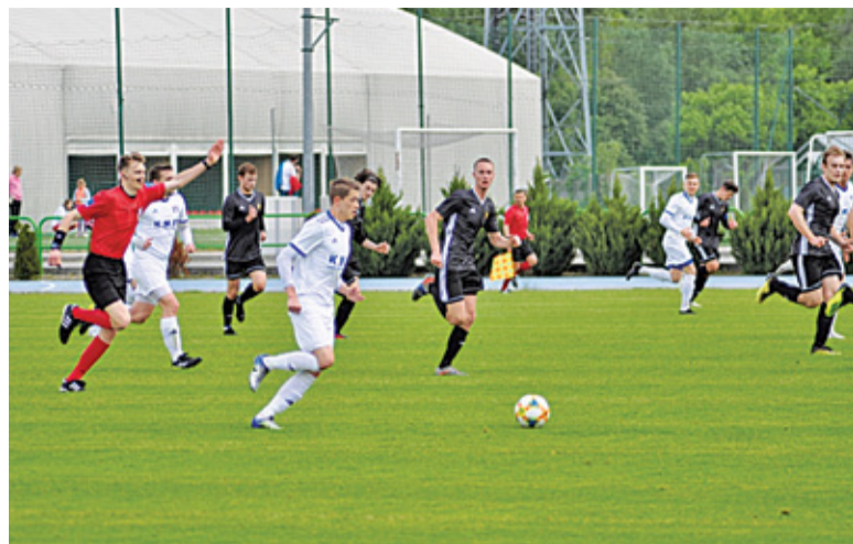
MKS Piaseczno w minionych rozgrywkach zanotował fantastyczną serię dziesięciu zwycięstw z rzędu

Kwiecień co prawda zaczął się od porażki z Żąbkovią (0:1), ale dalej MKS w każdym meczu oczarowywał swoją grą. Dziesięć zwycięstw z rzędu – to rezultat piłkarzy w biało-niebieskich trykotach po wznowieniu rozgrywek. Wśród nich takie triumfy jak 8:0 z Okęciem Warszawa, 3:2 na stadionie rywala z Victorią Sulejówką, 5:0 z Unią Warszawa, 4:1 ze Zniczem oraz 3:0 na zakończenie rozgrywek z innym zespo-