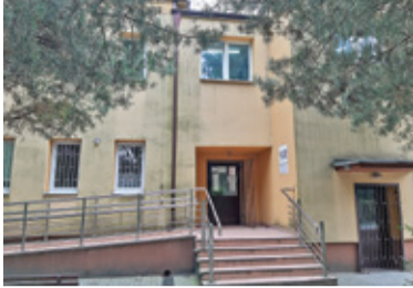
Poprawa warunków w przychodni również ma znaczenie