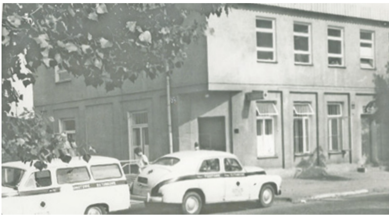
Budynek przy ul. Kościuszki 9, lata 60. lub 70.

W samym centrum miasta, na południowym rogu Skweru Kisiele, stoi niepozorny piętrowy budynek. Jego prosty kształt i całkiem nijaki kolor tynku czynią go niezbyt godnym uwagi. Są wszak w Piasecznie miejsca piękniejsze, bardziej charakterystyczne. Warto jednak zgłębić jego historię. Burzliwe dzieje budynku przy ul. Kościuszki 9 są bowiem doskonałą ilustracją zawirusowania minionego stulecia. Odtworzenie historii tego miejsca nie jest proste. Spróbujmy więc zebrać i podsumować to, co wiemy na pewno.