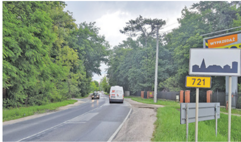
Droga zyska przede wszystkim chodnik i ścieżkę rowerową