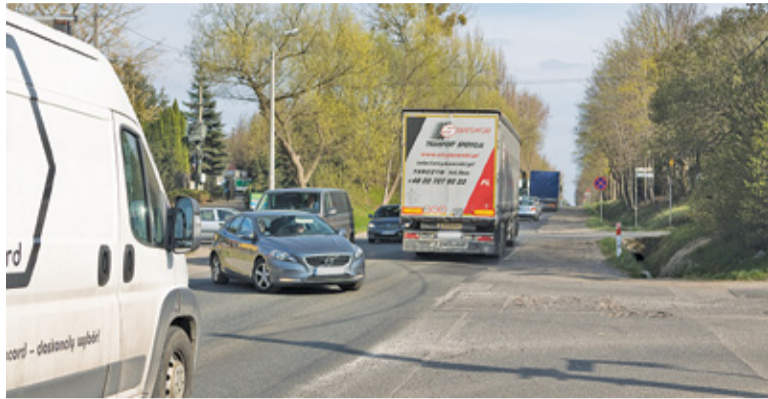
W przyszłym roku powinno zostać przebudowane skrzyżowanie w Żabieńcu

– Uzyskaliśmy finansowanie na prace przygotowawcze dla odcinka pomiędzy Piasecznem a Górą Kalwarią – poinformowała nas rzeczniczka warszawskiego oddziału GDDKiA Małgorzata Tarnowska. – Do połowy grudnia 2021 r. planujemy ogłosić przetarg na wybór projektanta, który przygotuje koncepcję programową wraz z uzyskaniem decyzji środowiskowej – zapowiada. Ile potrwa ten etap? Trudno powiedzieć. Kluczową kwestią będzie bowiem uzyskanie decyzji środowiskowej, a w tym wypadku po pierwsze nie ma określonych terminów