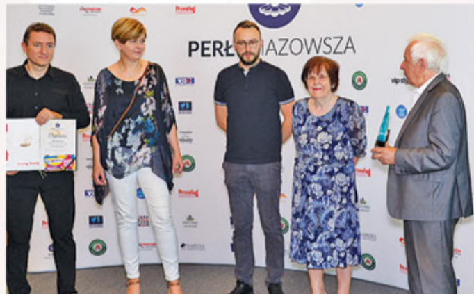
Festiwal Otwarte Ogrody – Perła Kultury Gminy Konstancin-Jeziorna