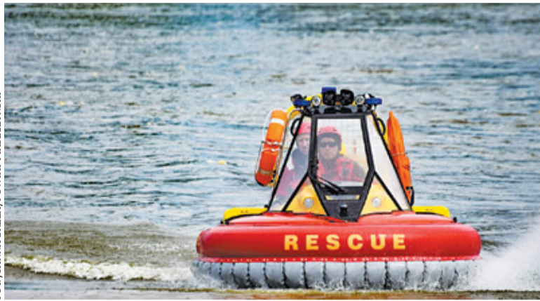
W ramach Budżetu Obywatelskiego udało się m.in. zakupić poduszkowiec ratowniczy, z którego korzysta piaseczyński WOPR

W ramach tych kwot mieszkańcy mogą teraz składać propozycje projektów. Nabór wniosków ruszył 25 czerwca. Zasady przy zgłaszaniu pomysłów są podobne do tych w latach ubiegłych. Istotną różnicą jest brak list poparcia