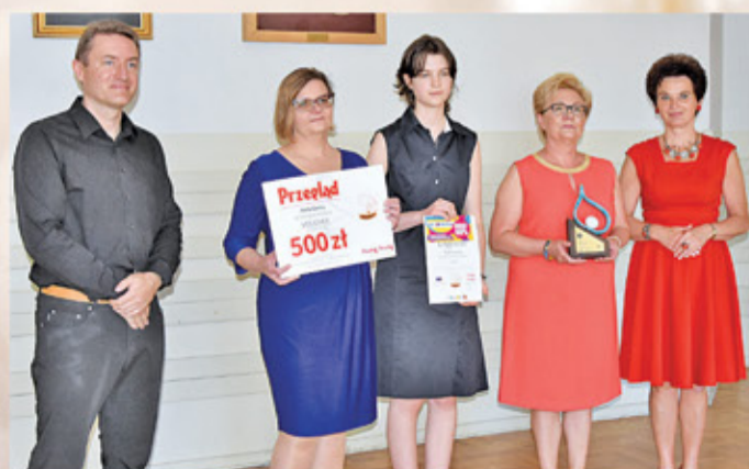
Festiwal Patriotyczny w Pamięćce – Perła Kultury Gminy Tarczyn