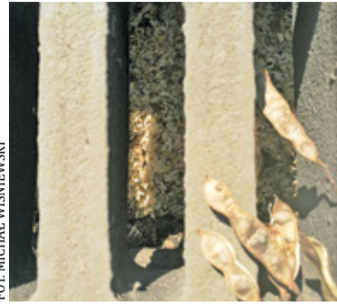
Wiele studzienek wciąż jest zasypanych piachem, liśćmi i igliwem