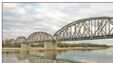
|| Góra Kalwaria - Zabytkowy most s. 5