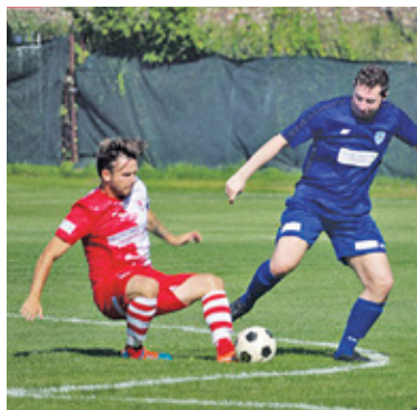
Bój o awans w Konstancinie

Bój o awans do wyższej ligi rozegrał się w Konstancinie. Zwycięsko wyszli z niego zawodnicy reaktywowanego RKS Mirków.