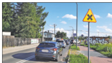
|| Piaseczno - Pierwszeństwo na Mleczarskiej? s. 2