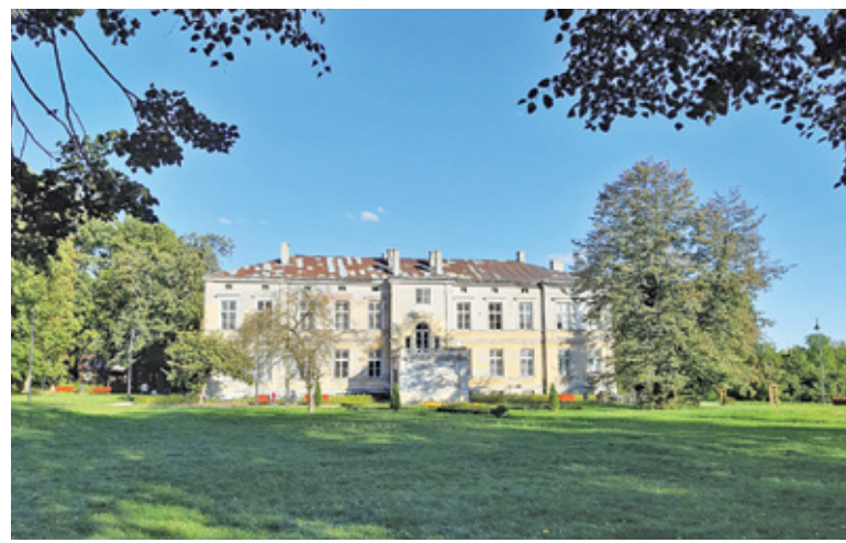
Choć budynek jest wyłączony z użytkowania od blisko dwóch lat, na stałe mieszkają w nim przynajmniej dwie osoby

– Od dwóch i pół roku staram się posuwać tę sprawę do przodu. 1 czerwca uzyskaliśmy decyzję sądu zezwalającą nam przejąć ten budynek. Nie możemy