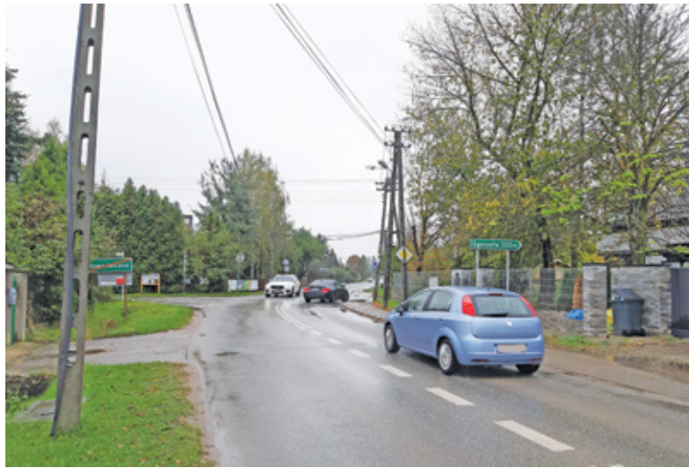
Na jednym z najbardziej niebezpiecznych miejsc – skrzyżowaniu z ul. Kielecką, ma powstać rondo. Tą inwestycją w ramach przebudowy ul. Kieleckiej ma się zająć gmina

Wobec tego powiat przygotowuje projekt przebudowy ulicy Krasickiego uwzględniając istniejący w jej przebiegu przejazd kolejowy z zaporami. Zgodnie z Wieloletnią Prognozą Finansową zadanie polegające na przebudowie całej drogi powiatowej – od ul. Szkolnej w Lesznawoli aż po ul. Raszyńską w