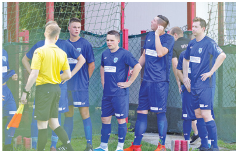
RKS Mirków wrócił na piłkarską mapę i awansował