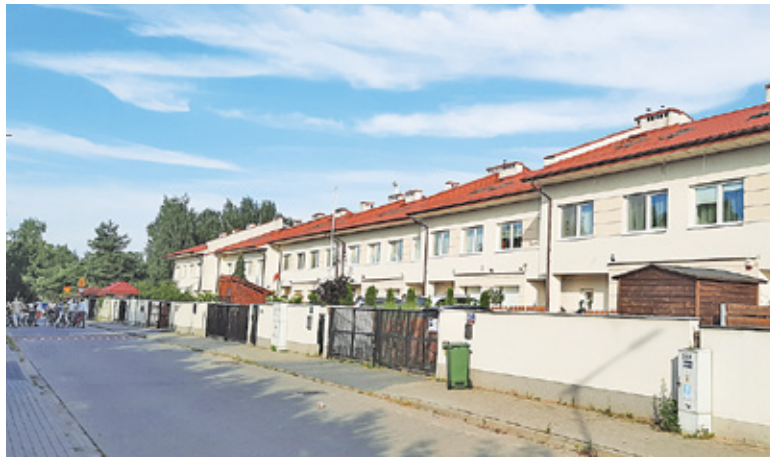
Obecni mieszkańcy Bobrowca chcieliby znacząco ograniczyć możliwość zabudowy szeregowcej

Trwają prace nad zmianą planu zagospodarowania dla Bobrowca. Obecni mieszkańcy są zaniepokojeni kolejnymi inwestycjami deweloperów, którzy w ich opinii naruszają zapisy mówiące o zabudowie jednorodzinnej.