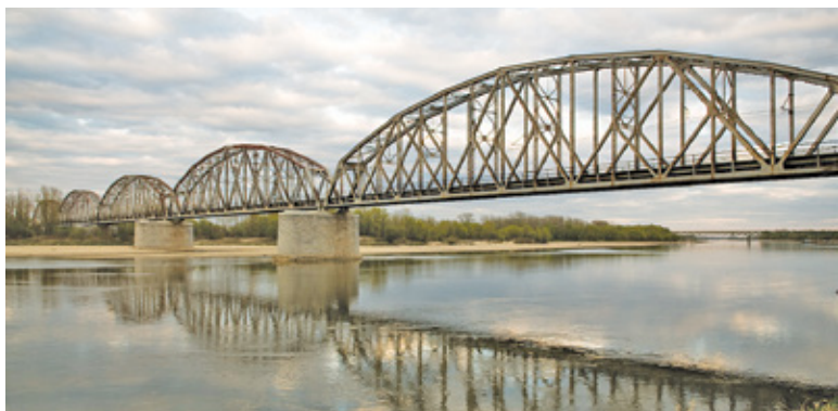
Most jest jednym z najbardziej znanych obiektów w Górze Kalwarii

Most kolejowy nad Wisłą na trasie Skierniewice – Łuków został zbudowa-