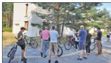
|| Bobrowiec - Zatrzymać szeregowce s. 6