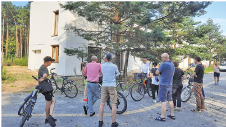
Na temat istniejącej i możliwej zabudowy Bobrowca mieszkańcy rozmawiali z urzędnikami również w terenie

Intensyfikacja zabudowy Bobrowca budzi również niepokój władz gminy, która zdaje sobie sprawę z potrzeb infrastrukturalnych związanych z gwałtownie rosnącym zaludnieniem danego obszaru. Dlatego też we wrześniu ub.r. gmina przystąpiła do zmiany zapisów w istniejącym mpzp, a w styczniu br.