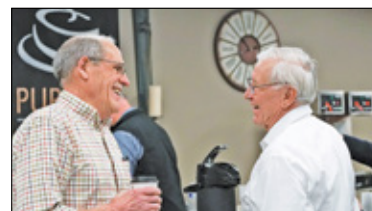
|| Konstancin-Jeziorna - Senior+ w Mirkowie s. 6