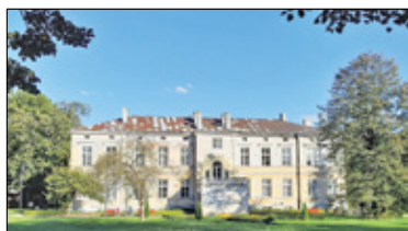
|| Piaseczno - Kontrowersyjna przeprowadzka s. 5