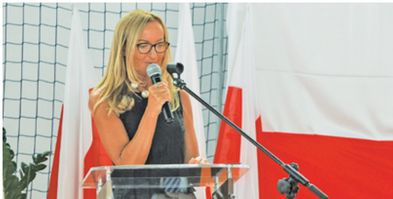
Sąd Okręgowy w Warszawie wydał nieprawomocny wyrok, orzekając o zadośćuczynieniu i odszkodowaniu od Skarbu Państwa