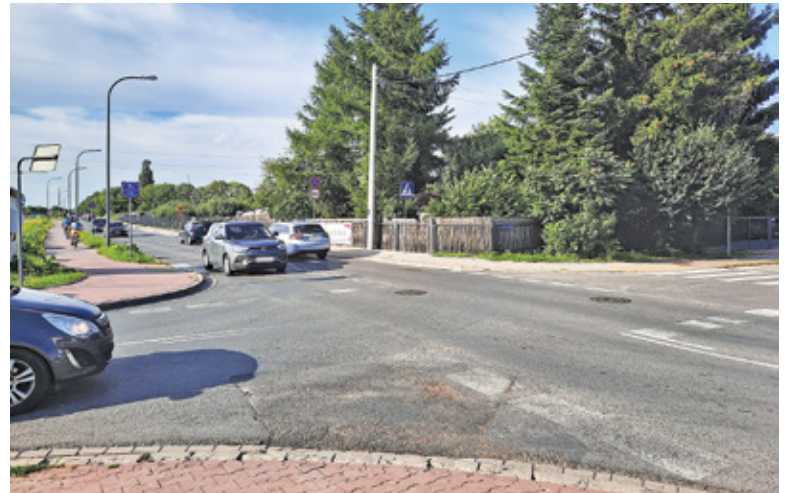
Obecnie kierowcy jadący od strony warszawy muszą ustąpić pierwszeństwa pojazdom jadącym ul. Słoneczną

– W piśmie z grudnia 2020 r. posiłem urząd o zmianę organizacji na pierwszeństwo dla ul. Mleczarskiej. W styczniu dostałem informację, że zmiana ta wymaga opracowania specjalnego projektu, który po uzgodnieniach zostanie wprowadzony w ciągu 3 miesięcy i od tej pory cisza – relacjonuje nasz