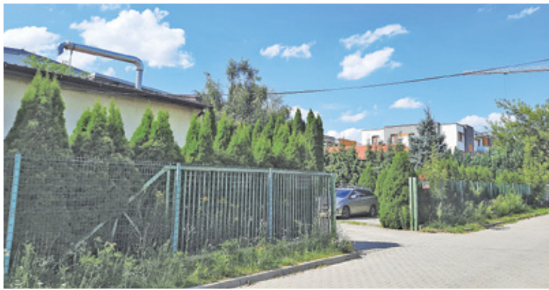
Norm hałasu firma nie przekracza, ale nie uregulowała kwestii emitowanych do środowiska gazów i pyłów

– Uregulowanie stanu formalno-prawnego (decyzja, zgłoszenie) w zakresie wprowadzania gazów lub pyłów do powietrza następuje na wniosek pro-