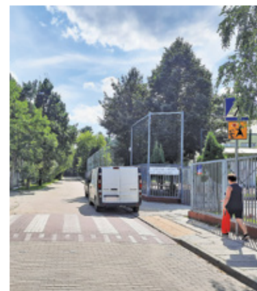
Przed początkiem roku szkolnego strefa „Kiss&Ride” powinna się pojawić przy szkole w Chylicach

Problem z rodzicami zatrzymującymi się na ulicy, by wypuścić dzieci z samochodu, czy parkującymi na chodniku ma większość szkół. W Chylicach problem jest tym większy, że zarówno jezdnie jak i chodnik na ulicy Dworskiej nie są na tym odcinku zbyt szerokie. Niewiele więc pomaga nawet to, że jest