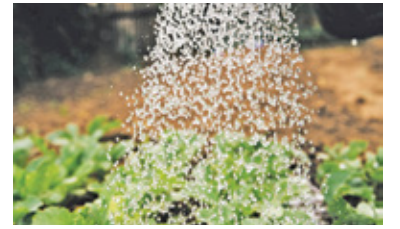
Projekt przewiduje m.in. instalacje do odzyskiwania wód opadowych

Powiat piaseczyński otrzymał blisko 2 mln zł dotacji na projekt zielono-niebieskiej infrastruktury dla szkół. Edukacja proekologiczna zostanie połączona ze zmianą otoczenia.