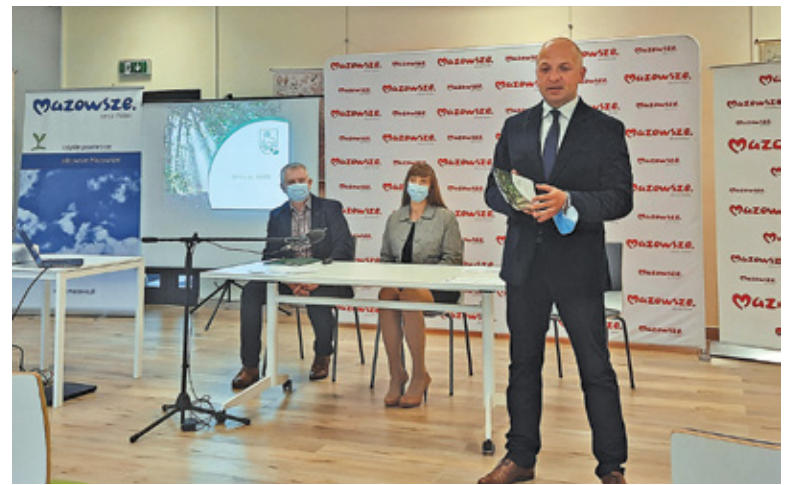
Szacuje się, że z powodu smogu każdego roku przedwcześnie umiera ok. 6 tysięcy mieszkańców Mazowsza

Samorządy lokalne we własnym zakresie podejmują różne działania, które mają na celu ograniczenie emisji szkodliwych substancji do atmosfery.