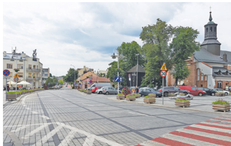
Główna ulica miasta ma przejść metamorfozę również na odcinku sąsiadującym z Rynkiem

Zgodnie z zapowiedziami przebudowa ulicy Puławskiej powinna się zakończyć we wrześniu. Władze miasta chcą od razu kontynuować prace na głównej ulicy biegnącej przez centrum. Chodzi przede wszystkim o przedłuże-