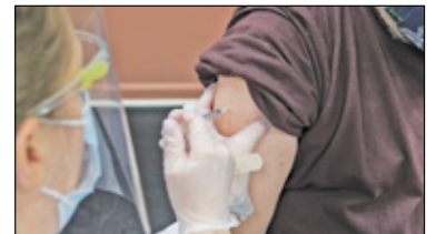
|| Powiat - W czołówce wyszczepionych s. 8