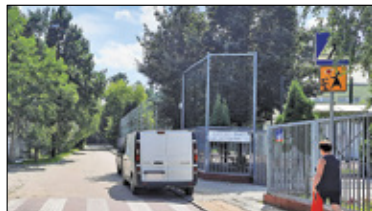
|| Piaseczno, Chylce - Kiss&Ride przy kolejnych szkołach s. 4