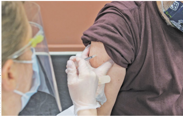
Konkurs dotyczy odsetka mieszkańców, którzy przyjęli pełną dawkę szczepienia przeciw COVID-19

Drugi konkurs – „Najbardziej Odporna Gmina” – jest podzielony na dwa elementy. Pierwszy z nich podzielono na trzy kategorie demograficzne: gminy do 30 tys. mieszkańców, od 30 do 100 tys. mieszkańców i powyżej 100 tys. mieszkańców. We wszystkich trzech kategoriach zwycięskie gminy otrzymają milion złotych. Co istotne, laureatami mogą zostać tylko gminy, które przekroczą 50% wyszczepialności. W drugiej części konkursu do wygrania będą 2 miliony złotych. Nagroda trafi do gminy, która osiągnie najwyższy odsetek wyszczepionych mieszkańców. Tu już nie obowiązuje podział demograficzny; w tym etapie biorą udział wszystkie gminy. W przypadku tego etapu również musi zostać przekroczony próg 50%.