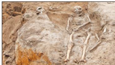
|| Tarczyn - Szczątki sprzed 500 lat s. 5