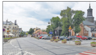
|| Piaseczno - Po Puławskiej czas na Kościuszki s. 7