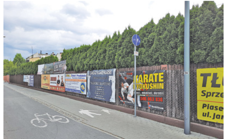
Zgodnie z przepisami wszelkie banery i reklamy z ogrodzeń powinny zniknąć już ponad rok temu

Jak wygląda sytuacja w rzeczywistości? Na razie dużych zmian nie widać. A właśnie uporządkowanie przestrzeni publicznej było głównym celem przyświecającym urzędnikom, którzy do-