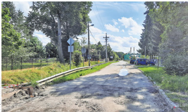
Ul. Dworska to ważny ciąg komunikacyjny Chylic, prowadzący m.in. do szkoły i stadionu KS Laura

Okazuje się jednak, że sprawa nie będzie prosta. Do ogłoszonego na początku lipca przetargu zgłosił się bo-