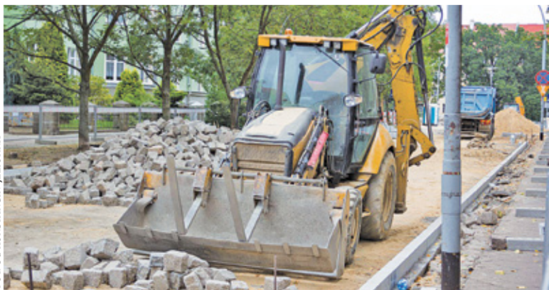
Magistrat zapowiada, że wszystkie prace zakończą się jeszcze w tym roku

Najkosztowniejszą inwestycją będzie przebudowa ulicy Mostowej. Obecnie fragment od skrzyżowania z ul. Przebieg do ul. Szpitalnej stanowi droga gruntowa. Gmina planuje utwardzić ten odcinek i wyłożyć go kostką brukową.