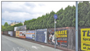
|| Piaseczno - Uchwała obowiązuje, kar na razie nie ma s. 2