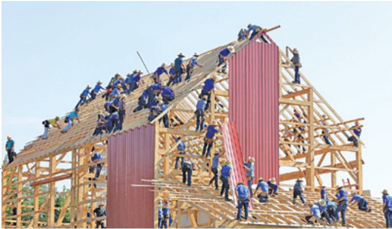
Oprócz budowy „domów bez pozwolenia” do Sejmu ma trafić również ustawa oferująca bon mieszkaniowy