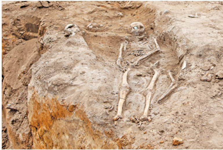
Znalezione na budowie szczątki zostaną poddane analizie antropologicznej

– W wyniku eksploracji pozyskano m.in. liczne fragmenty naczyń glinianych, dewocjonalia, guziki, monety, napastrki i inne przedmioty metalowe