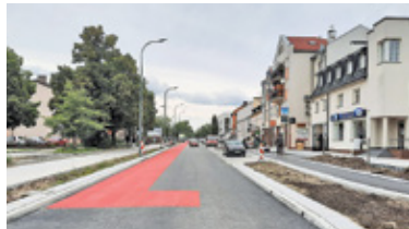
Po jezdni rowerzyści pojadą zgodnie z kierunkiem jazdy, na południe. W kierunku Warszawy zaś ruch będzie się odbywał ścieżką rowerową

Przebudowa ul. Puławskiej przebiega zgodnie z harmonogramem. Wykonawcy udało się zrealizować prace drogowe w lipcu i sierpniu, kiedy z racji wakacji natężenie ruchu jest znacznie mniejsze. Choć o tych planach samorząd mówił od dawna, a wiosną ubiegłego roku odbyły się konsultacje społeczne, w których przedstawiono różne warianty przebudowy, zaskoczonych i narzekających na zmiany nie brakowało. Główny powód to zmniejszenie liczby miejsc parkingowych. Takie rozwiązanie było niezbędne, aby na jezdni móc wyznaczyć pas rowerowy, a w przestrzeni chodnika wyodrębnić ścieżkę rowerową oddzieloną od ruchu pieszego pasem zieleni. Rowerzyści ży-