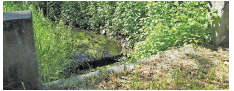
Ze złożonego przez inwestora wniosku wynika, że ścieki miałyby wpadać do Rowu Jeziorki na wysokości ul. Głowackiego

W maju inwestor złożył do Wód Polskich wniosek o zgodę na spuszczenie ścieków bytowych do kanału Jeziorki. Wniosek został oprotestowany przez mieszkańców i władze Konstancina. Tymczasem Wody Polskie nie uznają gminy za stronę postępowania.