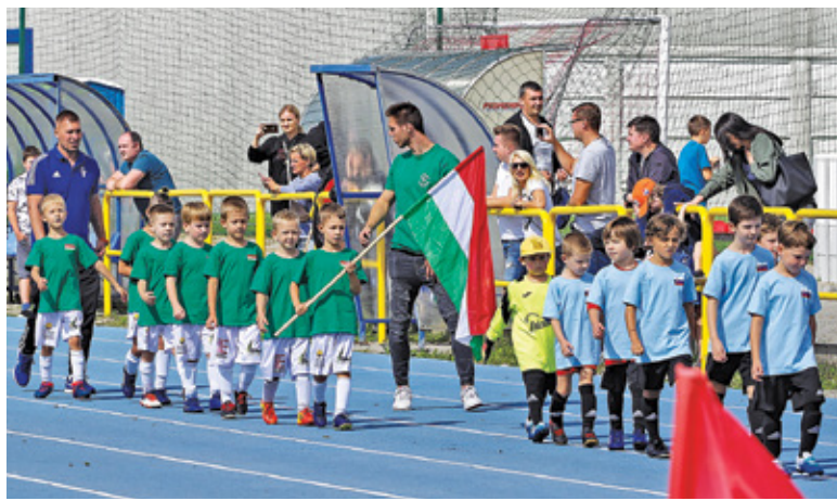
Zawodnicy reprezentowali różne kraje, które wzięły udział w tegorocznym Euro

W sobotę 21 sierpnia na Stadionie Miejskim przy ulicy 1 Maja w Piasecznie odbyła się duża impreza poświęcona futbolowi młodzieżowemu – Mini Mistrzostwa Europy. W zawodach wzięły udział drużyny z roczników 2014 i 2015, a wśród nich między innymi reprezentanci takich klubów jak: Żyrardowianka Żyrardów, Naprzód Stare Babice, Orzeł Baniocha, Polonia Warszawa i gospodarze, czyli MKS Piaseczno. Współorganizatorami wydarzenia były Gmina Piaseczno oraz GOSiR, a projekt został sfinansowa-