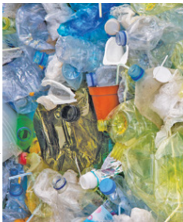
Polscy producenci odpadów plastikowych płacą 5 euro od każdej tony

Od wielu lat w Polsce mówiło się o ustawach wprowadzających Rozszerzoną Odpowiedzialność Producentów. W ostatnich latach jednak kończyły się to jedynie deklaracjami składanymi przez kolejnych ministrów. Wszystkie spotkania konsultacyjne w Ministerstwie Klimatu i Środowiska były najczęściej przyjmowane z rozczarowaniem i rezerwą.