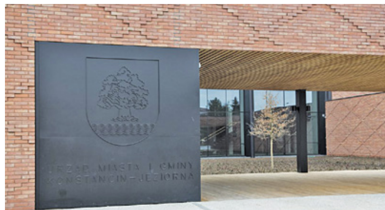
4 sierpnia zakończyła się kontrola wewnętrzna w urzędzie

Na koniec burmistrz odniósł się do oskarżeń, które od czasu naszej pierw-