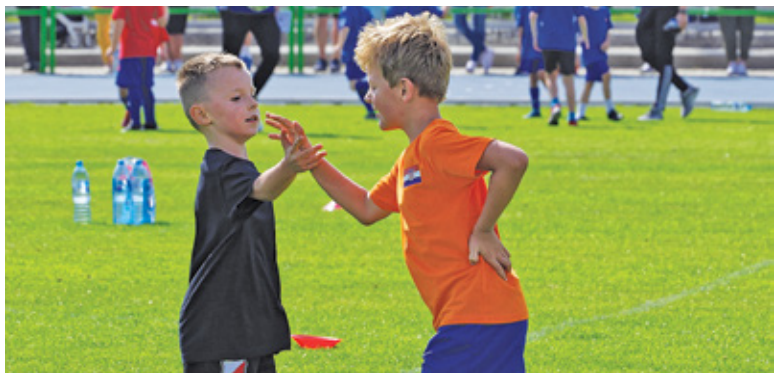
Na boisku ważna była gra w duchu fair play