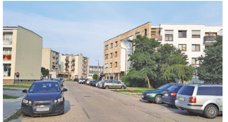
Strefa miałaby objąć również ulicę Fabryczną, gdzie znajduje się między innymi przychodnia publiczna

Na podstawie dotychczasowego doświadczenia w piaseczyńskiej strefy płatnego parkowania wiemy, że można osiągnąć poziom rotacji pojazdów na miejscach postojowych w wysokości od 8 do 10 pojazdów na jednym miejscu w ciągu 10 godzin funkcjonowania strefy – czytamy w uzasadnieniu. Rzeczywiście, odkąd wprowadzono SPP na ul. Kościuszki czy przy bazarku, ze znalezieniem miejsca parkingowego nie ma większego problemu o każdej porze dnia. Tymczasem zaparkowanie w po-