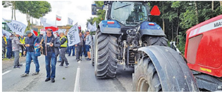
Rolnicy nie tylko zablokują DK50 w Czaplina, ale też kilkakrotnie przejadą odcinek między blokadą a Górą Kalwarią

Rolnicy chcą rozmów na temat trudnej sytuacji, w jakiej się znaleźli między