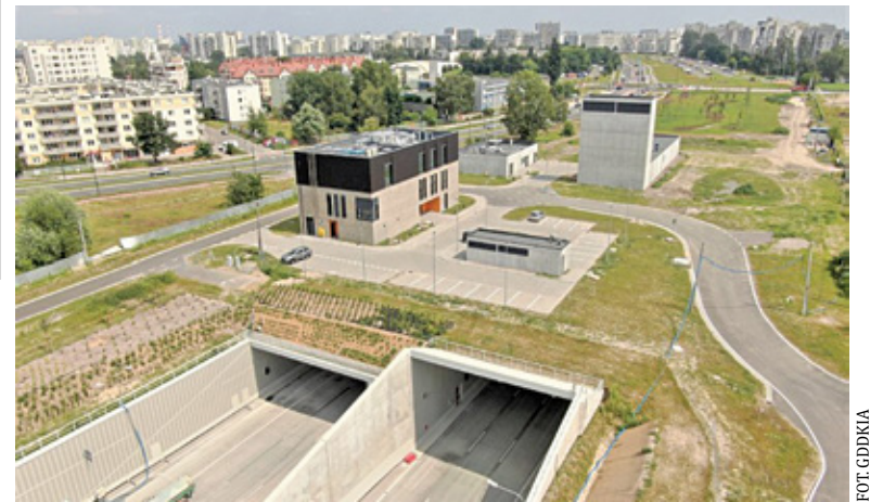
Tunel ma zostać oddany do użytku jesienią

od momentu, gdy pełna dokumentacja z wnioskiem o pozwolenie na użytkowanie trafi do WINB, organ nadzoru musi we własnym zakresie sprawdzić, czy obiekt jest bezpieczny, wykonany zgodnie z projektem i gotowy do użyt-