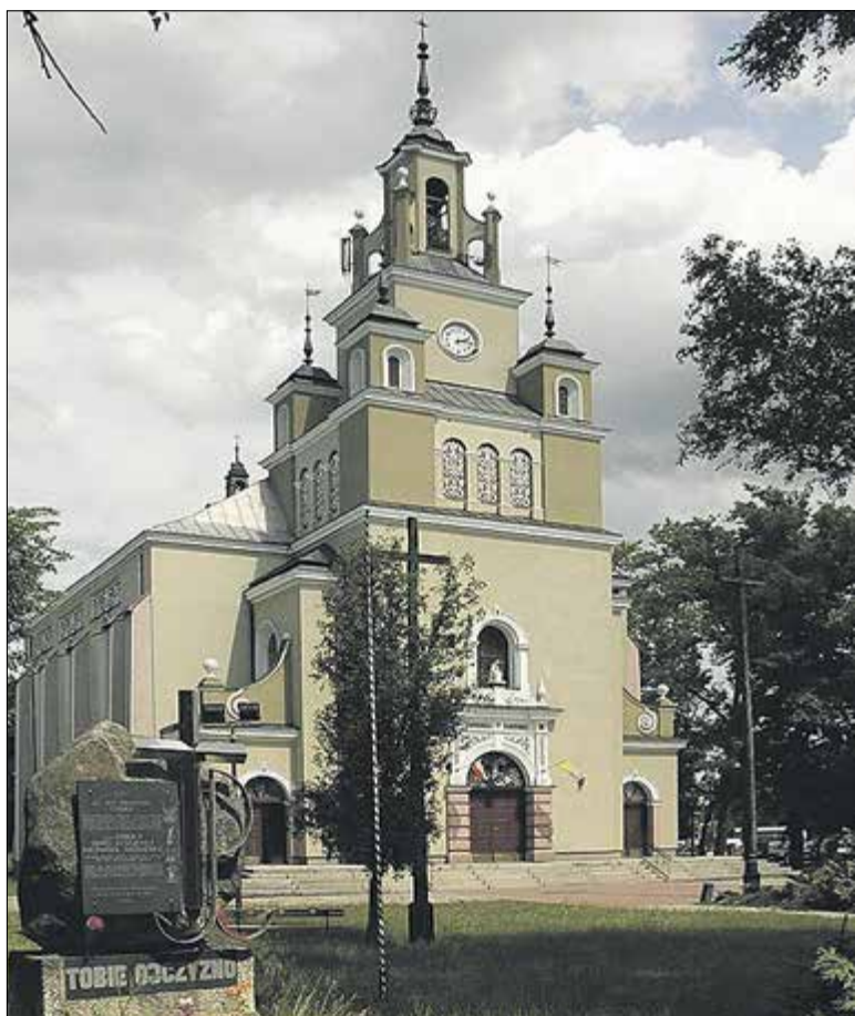
Białobrzegi, kościół pw. św. Trójcy

napisz do autora a.adamski@przeleczpiaseczynski.pl