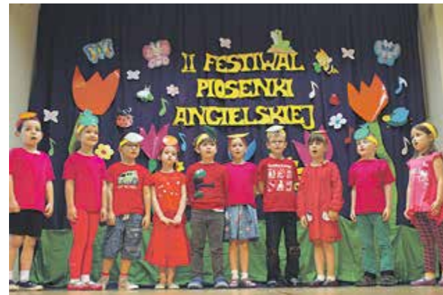
II Festiwal Piosenki Angielskiej

Nasze dzieci biorą również udział w licznych imprezach okolicznościowych, spotkaniach z ciekawymi gośćmi i wycieczkach. Mają regularny kontakt ze sztuką podczas spektakli teatralnych, koncertów Filharmonii Narodowej oraz koncertów egzotycznych. Tradycją w naszym przedszkolu są również spektakle teatralne