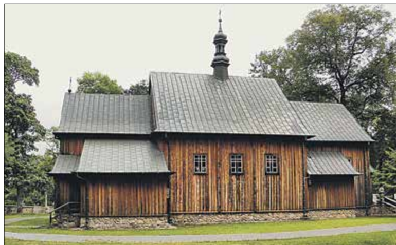
Jasionna, kościół pw. Zwiastowania Najświętszej Marii Panny