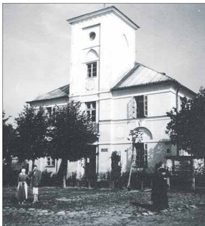
Ratusz, lata przedwojenne