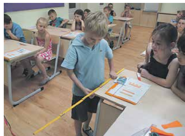
Edukacja matematyczna w Prywatnej Szkole Podstawowej „World School”

wystawiane przez rodziców naszych przedszkolaków, co dostarcza dzieciom wielu niezapomnianych wrażeń. Jesteśmy za to niezmiernie wdzięczni rodzicom, gdyż jest to ogromne zaangażowanie z ich strony. Wszystkie nasze dzieci same również prezentują programy artystyczne na przedszkolnej scenie podczas imprez okolicznościowych np. z okazji mamy i taty, dnia babci i dziadka, jasełek.