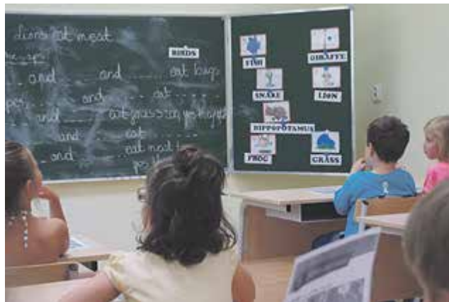
Muzyka w j.angielskim w Prywatnej Szkole Podstawowej „World School”

w sali z kulkami, bezpiecznie wspinają się na konstrukcje, pokonują przeszkody i „ruchomy most” oraz kąpią się w suchym basenie pełnym kolorowych piłeczek. Uczniowie Szkoły Podstawowej „World School” w ramach zajęć z wf-u będą jeździć na basen.