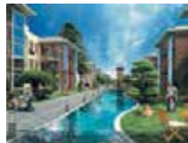
OSIEDLE SŁONECZNE, ul. Słoneczna Stara Iwiczna k/ Piaseczna