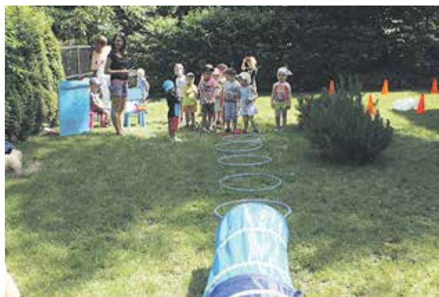
II Olimpiada Sportowa

Nauka języków obcych od najmłodszych lat otwiera przed dziećmi nowe perspektywy. Poznanie języka obcego w wieku przedszkolnym buduje mocne fundamenty do osiągnięcia w późniejszym wieku swobody w operowaniu i uczeniu się tego języka w szkole. Zarówno przedszkolaki jak i uczniowie naszej szkoły