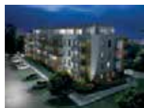
KSIECIA JÓZEFA PONIATOWSKIEGO Piaseczno, ul. Poniatowskiego