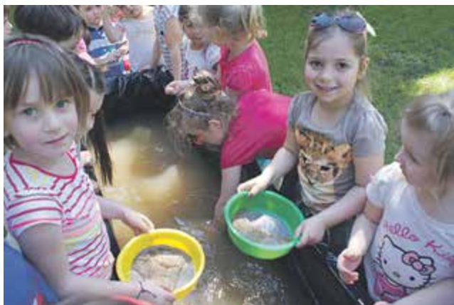
Ciekawe imprezy okolicznościowe - „Dziki zachód” i ptukanie złota

Nasze przedszkolaki, a od września także uczniowie klasy I mają stworzone doskonałe warunki do szybkiego rozwoju fizycznego, intelektualnego i emocjonalnego. Nauczyciele dbają o wszechstronny rozwój dzieci. Prowadzą edukację językową, matematyczną, przyrodniczo – ekologiczną, plastyczno – techniczną, fizyczną i muzyczną. Uczniowie w Szkole Podstawowej „World School” będą od września realizować w klasie pierwszej rozszerzony program edukacji wczesnoszkolnej. Edukacja wczesnoszkolna będzie prowadzona w oparciu o podręczniki wydawnictwa Nowa Era. Będziemy korzystać z podręczników takich jak dotychczas, o obszernej zawartości merytorycznej, które są oferowane szkołom prywatnym, chcąc zapewnić najwyższy poziom edukacji. Wysoki poziom nauczania oraz kwalifikacje nauczycieli w naszych placówkach gwarantuje stały nadzór Mazowieckiego Kuratorium Oświaty.