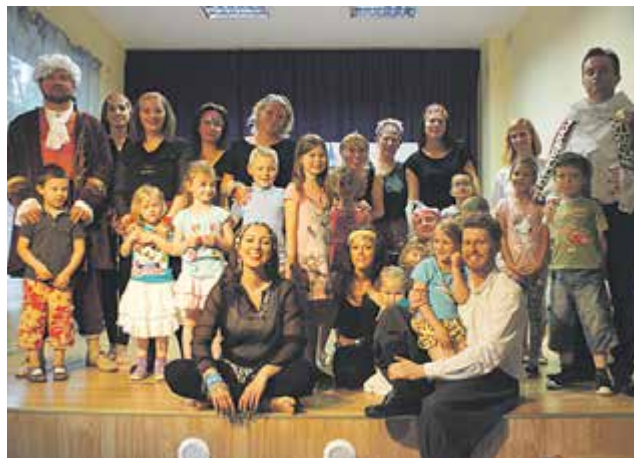
„Śpiąca Królowna” - spektakl teatralny w wykonaniu rodziców

mają zajęcia z j.angielskiego codziennie. Oprócz tradycyjnych lekcji jest również muzyka w języku angielskim. Uczniowie Szkoły „World School” mają też lekcje dwujęzyczne. Tak duża częstotliwość kontaktu z językiem angielskim w mowie i piśmie, stopniowo wprowadzanie elementów języka angielskiego w nauczaniu