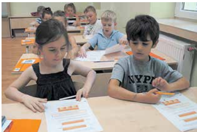
Edukacja matematyczna w Prywatnej Szkole Podstawowej „World School”

W Przedszkolu Bajka-Zalesie i Prywatnej Szkole Podstawowej „World School” dzieci się nie nudzą, ponieważ uczestniczą w różnego rodzaju w zajęciach dodatkowych w cenie czesnego. Przedszkolaki mają m. in. zajęcia z glottodydaktyki, ceramiki, integracji sensorycznej, gry na instrumentach, śpiewu, tańca, rytmiki, plastyki, origami, zajęcia teatralne, warsztaty kulinarne, informatyka,