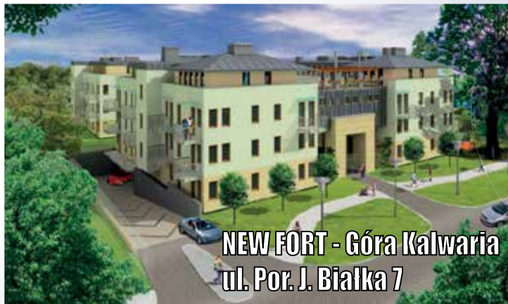
NEW FORT - Góra Kalwaria ul. Por. J. Białka 7