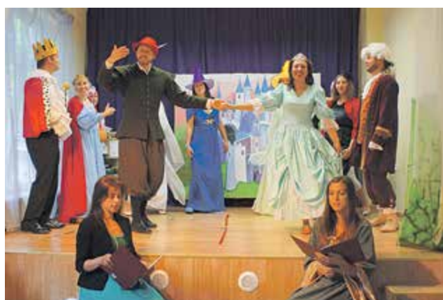
„Śpiąca Królowna” - spektakl teatralny w wykonaniu rodziców

mają zajęcia z j.angielskiego codziennie. Oprócz tradycyjnych lekcji jest również muzyka w języku angielskim. Uczniowie Szkoły „World School” mają też lekcje dwujęzyczne. Tak duża częstotliwość kontaktu z językiem angielskim w mowie i piśmie, stopniowo wprowadzanie elementów języka angielskiego w nauczaniu