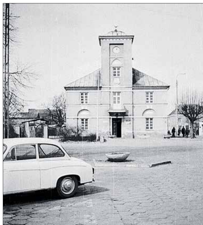
Ratusz, lata siedemdziesiąte