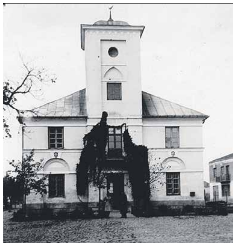
Ratusz, lata przedwojenne, zbiory