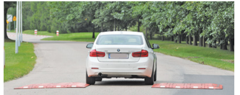
Większość kierowców przejeżdża pomiędzy wyspami w ogóle nie zwalniając

Kto odpowiada za tę drogę i umieszczone na niej spowalniacze? Okazuje się,