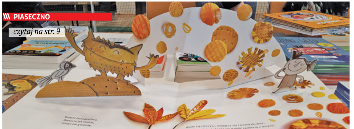
|| PIASECZNO czytaj na str. 9

Rokrocznie prezentowane są tytuły wyróżniające się estetyką i szatą edytorską, czyli krótko mówiąc: piękne