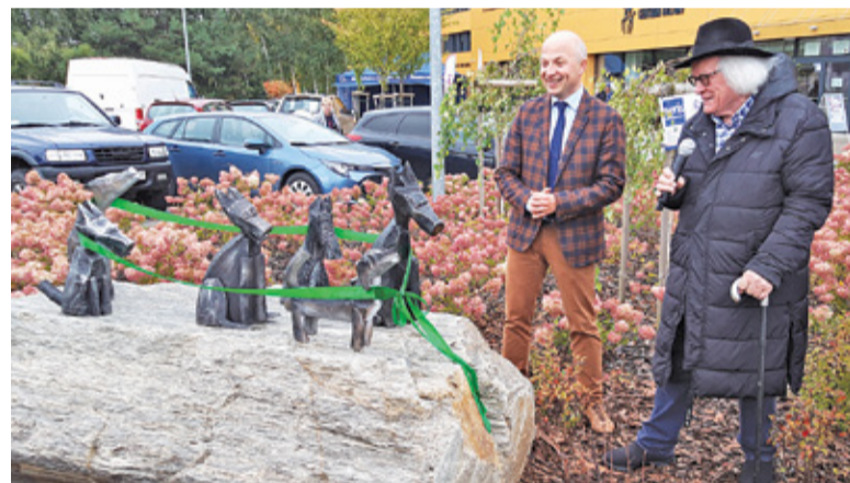
Podczas Festiwalu Pięknej Książki nastąpiło uroczyste odsłonięcie nowych rzeźb Józefa Wilkonია

W książce „Psie życie” Józef Wilkoń przypomina wszystkim, że powinniśmy być odpowiedzialni za to, co oswoiliśmy.