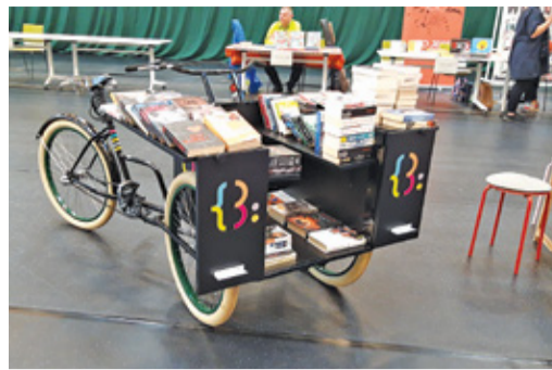
Spotkania z autorami i polowanie na nowe lektury – Festiwal Pięknej Książki to zawsze święto dla bibliofilii