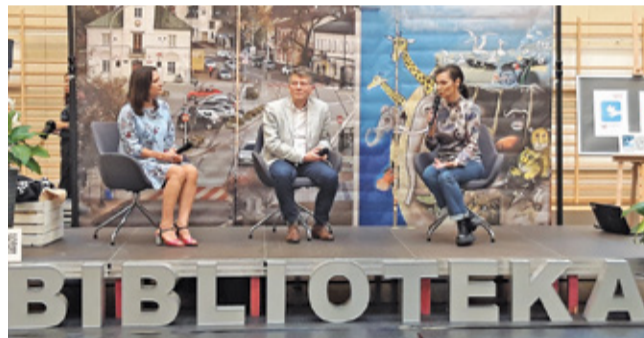
Z powodu złej pogody imprezę przeniesiono do wnętrza Centrum Edukacyjno-Multimedialnego