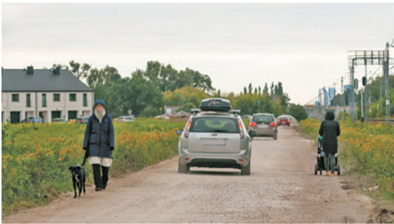
Ulicą Gogolińską między samochodami poruszają się również piesi

Jeszcze przed rozpoczęciem objazdów mieszkańcy zwrócili uwagę na fakt, że wyznaczonym objazdem trudno będzie się poruszać autobusom szkolnym. Fakt ten potwierdził się błyskawicznie i zaczęto organizować zmianę lokalizacji przystanków i rozkładu jazdy. Trasa autobusu, podobnie jak innych pojazdów,