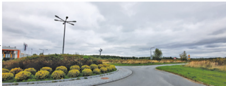
Gmina zamierza szukać nabywcy niezabudowanych działek nieopodal szkoły w Mysiadle

ostatnich latach środków było niewiele i zwykle były przesuwane na kolejne lata. Gmina wprowadza też do budżetu kolejne zadania, związane między innymi z odwodnieniem czy budową dróg. Oczywiście na razie środki ze sprzedaży nieruchomości nie są brane pod uwagę po stronie dochodów. Na działkę 1/273, którą radni zgodzili się przeznaczyć na sprzedaż pod koniec maja, dotąd nie ogłoszono przetargu. Niewykluczone,