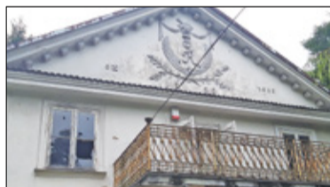
|| Prażmów - A dwór dalej niszczeje... s. 6