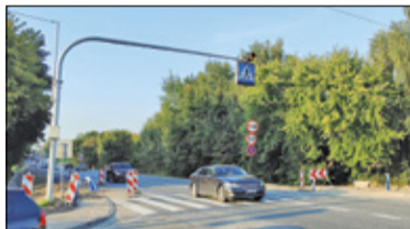
|| Piaseczno - Światła na obwodnicy s. 2

PIASECZNO || GÓRA KALWARIA || KONSTANCIN-JEZIORNA || LESZNOWOLA || PRAŻMÓW || TARCZYN