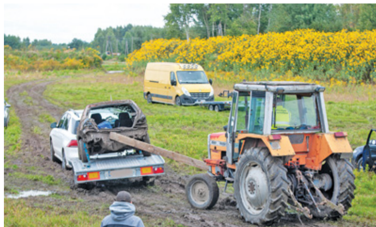
Obecnie część wału jest porośnięta wysokimi kwiatami