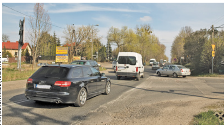
Przebudowa skrzyżowań ma poprawić bezpieczeństwo na DK79, zwanej czasem „drogą śmierci”

Sytuacja poprawiła się nieco po oddaniu do użytku obwodnicy Góry Kalwarii. Wciąż jednak daleko jej do ideału. Praktycznie nie ma tygodnia, by nie doszło tu przynajmniej do stłuczki. GDDKiA od lat zapowiada rozbudowę drogi, jednak do tej pory nie udało się nawet