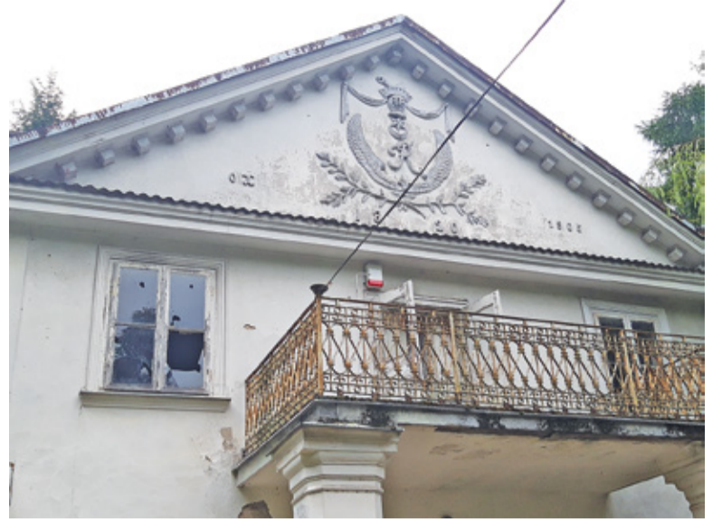
Opustoszały od ponad dekady dwór jest w coraz gorszym stanie

Niepokojący jest także fakt, że na terenie dworku nie widać śladów po bieżących naprawach. Owszem, okalający posiadłość trawnik jest koszony dość regularnie. Trudno jednak nazwać to „naprawą”. Kiedy w lipcu tego roku odwiedziliśmy dworek, drzwi posiadłości stały otworem, szyby na piętrze były powybijane, a elewację szpeciło pokaźnych rozmiarów graffiti. Dodatko-