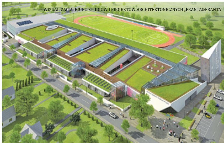
Mieszkańcy liczą na realizację drugiego etapu budowy CEiS

W uzasadnieniu uchwały czytamy, że decyzja o sprzedaży podyktowana jest potrzebą pozyskania środków finansowych do budżetu gminy na rok 2021 „w celu realizacji między innymi zadań inwestycyjnych”. Na te bowiem w