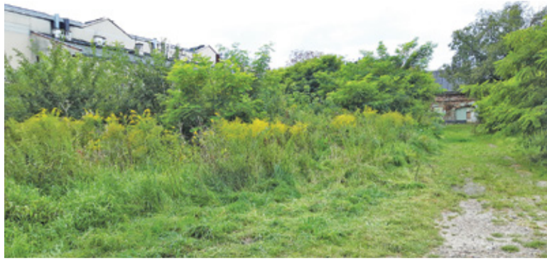
Działki bezpośrednio graniczą z terenami już należącymi do gminy

Na najbliższej sesji radni mają upoważnić burmistrza do zakupu dwóch działek w centrum miasta. W przyszłości gmina chce zagospodarować te tereny.