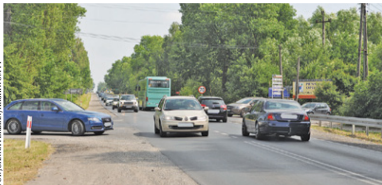
Na skrzyżowaniu w Baniosze regularnie dochodzi do wypadków, również śmiertelnych

ogłosić przetargu na projekt inwestycji. GDDKiA zapowiada, że powinno to nastąpić w grudniu bieżącego roku. Terminy były już jednak wielokrotnie przekładane, nie ma więc gwarancji, że tym razem postępowanie dojdzie do skutku.