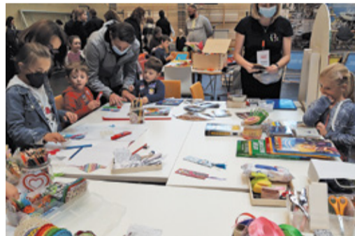
Organizatorzy zadbałi o atrakcje dla tych młodszych i tych nieco starszych uczestników