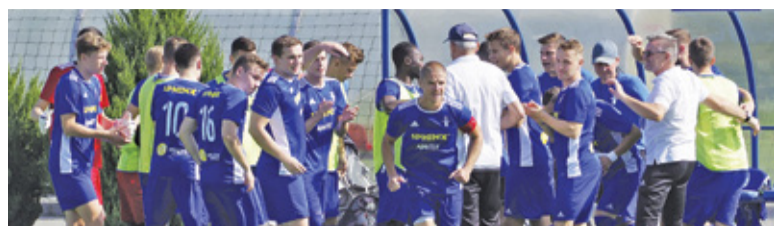
Piaseczno na czele ligowej tabeli

Dzięki wygranej „Biało-Niebiescy” objęli fotel lidera IV ligi. Tuż za Piasecznem mający tyle samo punktów, ale gorszy bilans bramkowy, Oskar Przysucha i właśnie Victoria Sulejówek. W sobotę 25 września o godzinie 11.00 na stadionie w Piasecznie MKS zagra z Milanem Milanówką.