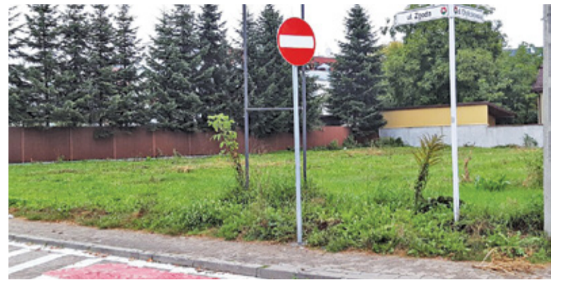
Ulicę zwężono do jednego pasa, wytyczając jednocześnie 14 nowych miejsc postojowych

Jak informuje Urząd Gminy, zmiana jest następstwem rozszerzenia Strefy Płatnego Parkowania. SPP obejmie teraz bowiem ul. Warszawską na odcinku od skrzyżowania z ul. Chyliczkowską do ul. Młynarskiej. Jednocześnie zli-