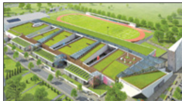
|| Mysiadło - Kolejne działki na sprzedaż s. 4