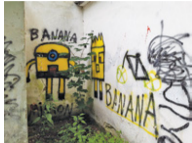
Wbrew deklaracjom wójta, zabytek nie został zabezpieczony przed wandalami

zumienia – przygotowanie koncepcji – już okazał się problematyczny. Zgodnie z listem intencyjnym gmina miała na to bowiem 9 miesięcy. Projekt powinien więc być gotowy jesienią ubiegłego roku. Tymczasem prace opóźniły się o rok. W międzyczasie między władzami obu samorządów doszło do poważnych zgrzytów. Pod koniec 2020 roku, w czasie prac nad rocznymi budżetami, wójt Prażmowa zawnioskował do starostwa o zabezpieczenie kwoty 600 tysięcy złotych na prace remontowe. Władze powiatu odrzuciły wniosek argumentu-