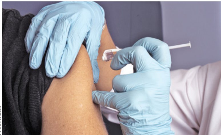
W przypadku osób dorosłych wystarczy jedna dawka szczepionki

Od września osoby w wieku 50+ mieszkające w województwie mazowieckim mogą się zgłaszać do wybranych placówek realizujących program.