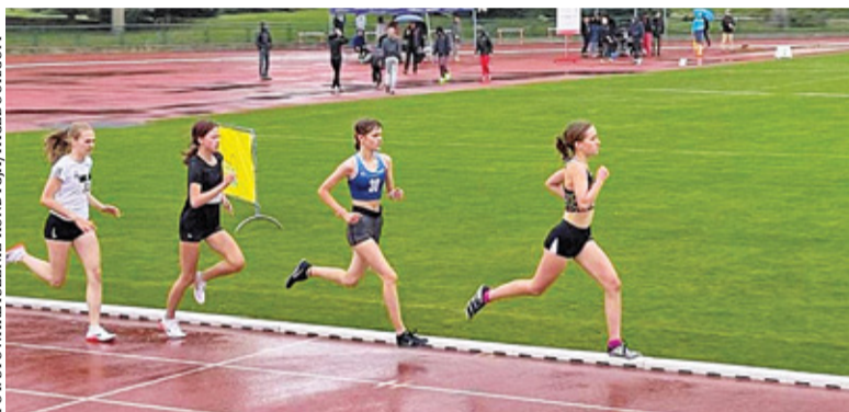
Rywalizacja odbyła się w Ciechanowie

W sobotę 18 września w Ciechanowie odbyły się Mistrzostwa Mazowsza do lat 16 w lekkiej atletyce.