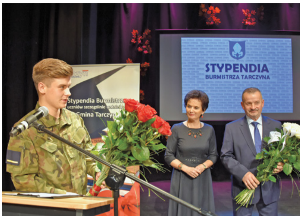
Podziękowania dla władz samorządowych