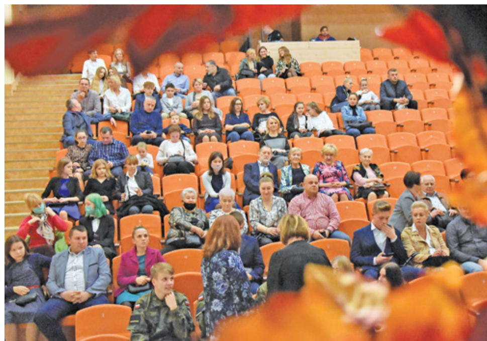
Rodzice świętowali wraz ze swoimi pociechami