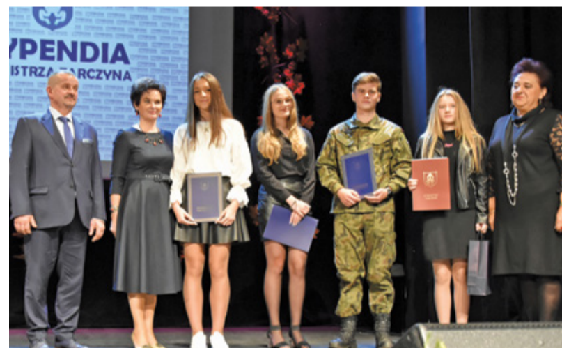
Nagrodzeni Stypendyści Liceum Ogólnokształcącego im. Szarych Szeregów w Tarczynie