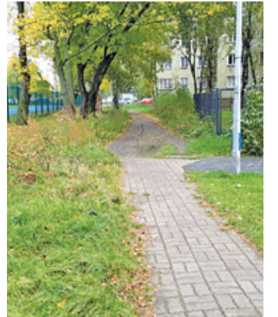
Po wykonanych wiosną pracach praktycznie nie ma tu śladu

Prace przy budowie osiedlowej ul. Marusarzówny kilka miesięcy stanęły w miejscu. Problemem okazały się drzewa kolidujące z projektem odwodnienia drogi.