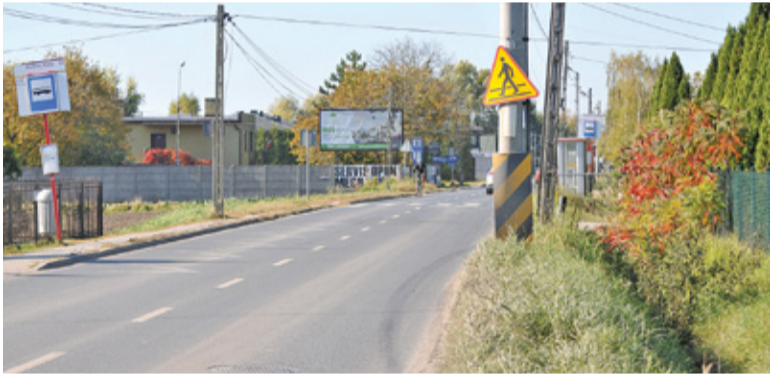
Ulica miałyby zyskać chodnik, ścieżkę rowerową i odwodnienie na całej długości

– Realizacja tej inwestycji zależy od budżetu – podkreśla starosta. Inwestycję tę zgłosił do programu Polski Ład. – Jeśli otrzymamy dofinansowanie,