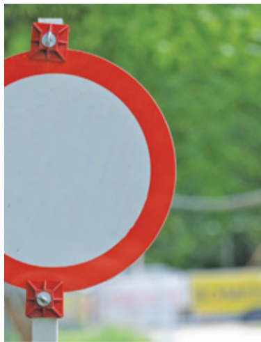
Prace mają potrwać do końca tygodnia

Trwa przebudowa skrzyżowań w ciągu ulicy 3 Maja w Henrykowie-Uroczu i Złotokłose. Remont ma na celu uspokojenie ruchu na tej drodze.