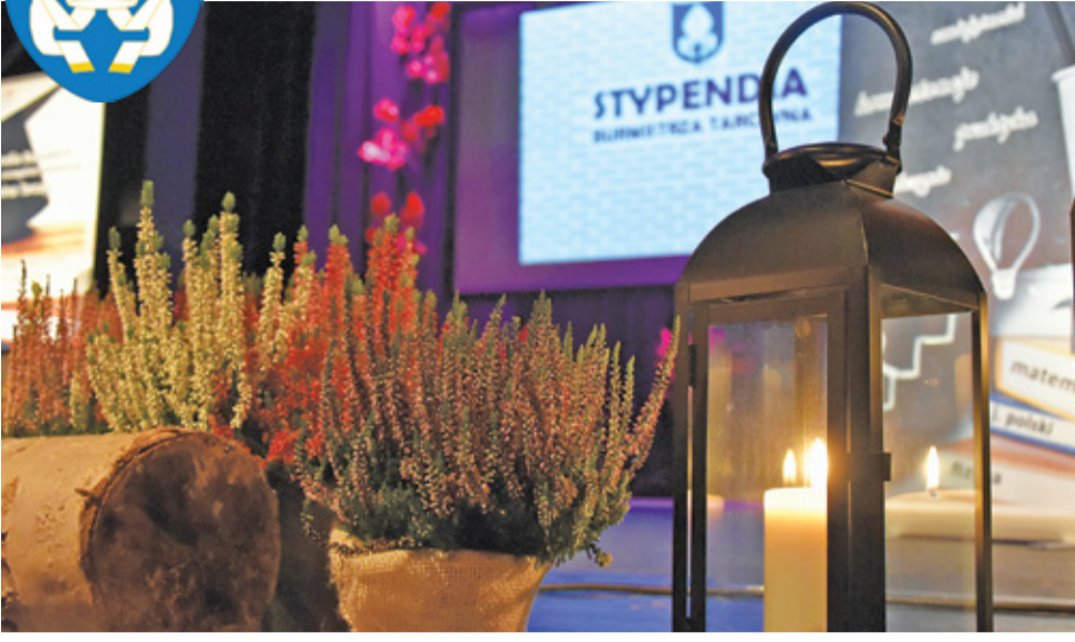
Jesienna sceneria towarzyszyła nagrodzonym