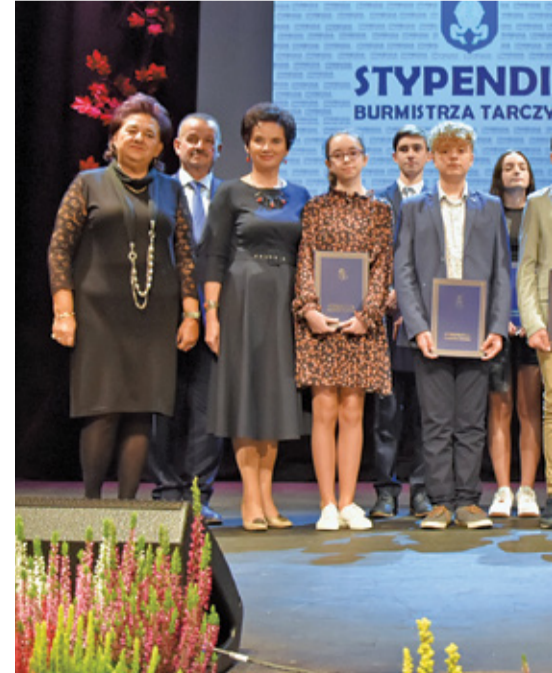
Nagrodzeni Stypendyści Szkoły Podstawowej im. J. Stępkowskiego w Tarczynie