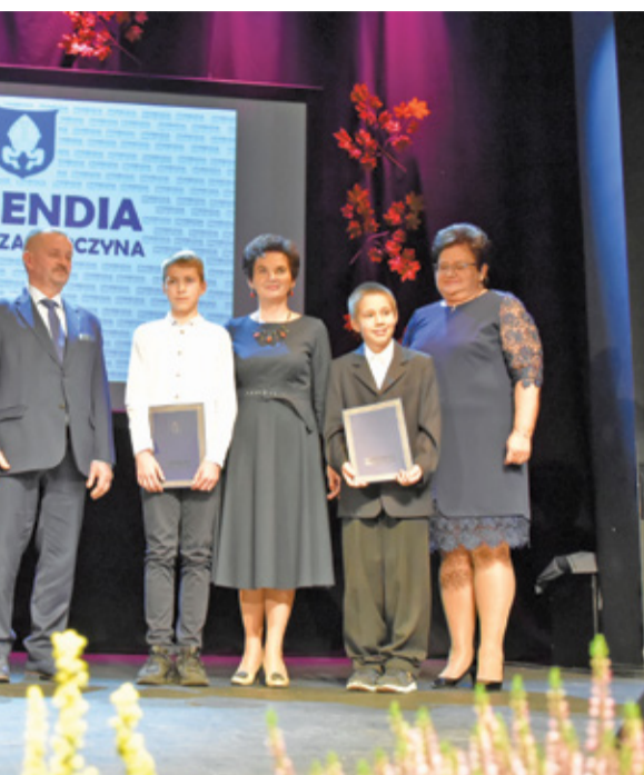
Stypendyści Szkoły Podstawowej im. M. Kaczyńskiego w Pracach Małych