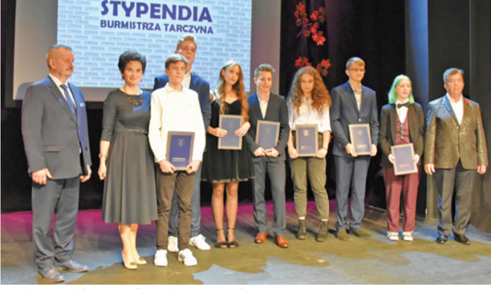
Nagrodzeni Stypendyści Liceum Ogólnokształcącego im. I. Sendlerowej w Tarczynie