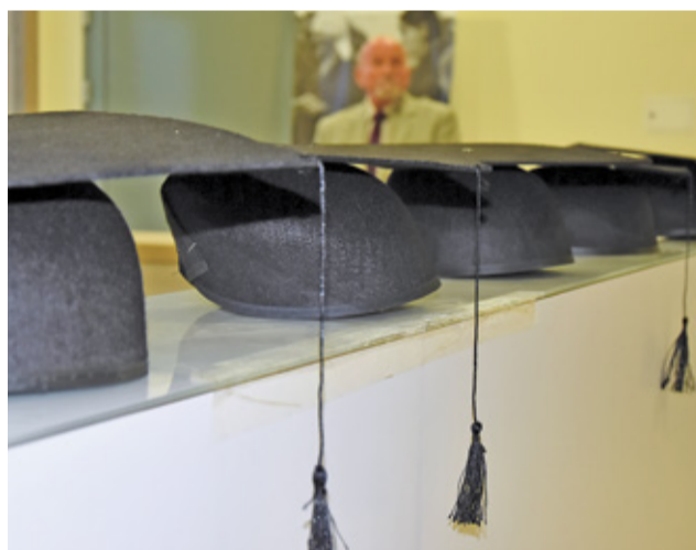
Studenckie birety czekały na najlepszych uczniów

Wręczenie stypendiów uświetniła część artystyczna, w której wystąpili uczestnicy zajęć muzycznych pod kierunkiem Agaty Klimczak-Kołąkowskiej.