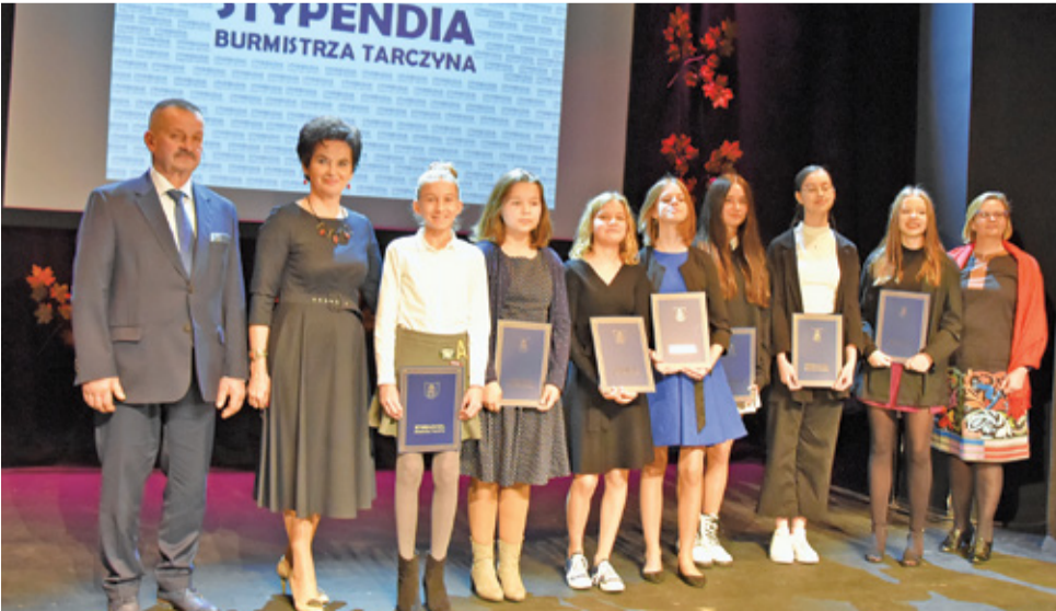
Nagrodzeni Stypendyści Szkoły Podstawowej im. W. Górskiego w Pamiętce