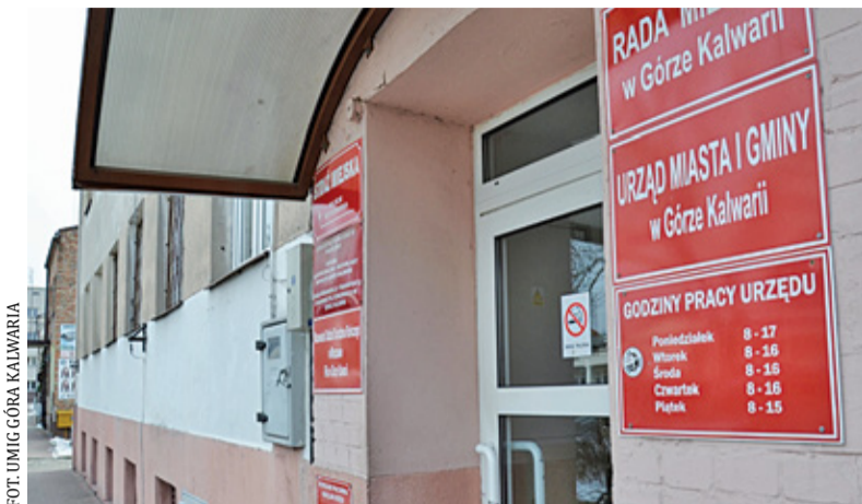
Budynek zostanie ocieplony, zyska też m.in. nową elewację i rampę dla osób poruszających się na wózku inwalidzkim

Wśród beneficjentów znalazła się również Góra Kalwaria, która otrzyma