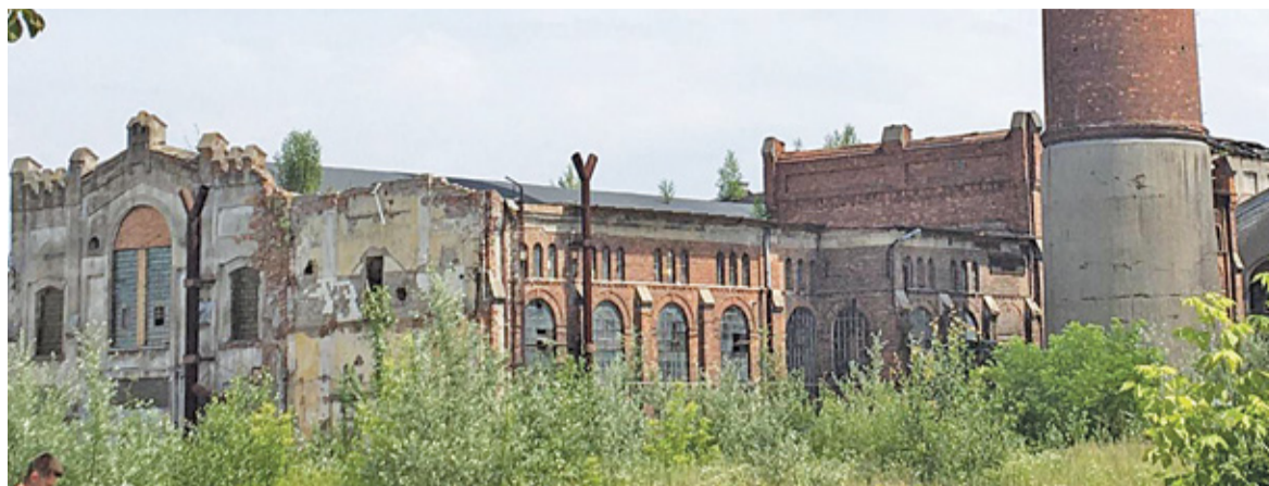
Tak dziś wyglądają ruiny dolnej papierni

Mirkowska Fabryka Papieru znajdowała się pod Wieruszowem. Takie położenie było dość problematyczne – po pierwsze zakłady znajdowały się