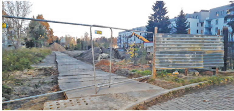
Deweloper wykorzystał wydzierżawiony teren, by ułatwić ciężkim pojazdom poruszanie się po terenie budowy

Gmina wykupiła fragment działki położonej w zbiegu ulic Jasińskiego i Krassowskiego. Chce urządzić tu miejską zieleń. Tymczasem wąski pas gminnego terenu został wyłożony betonowymi płytami. Sprawdziliśmy więc, o co chodzi.