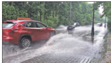
||| Konstancin-Jeziorna - Długa doczeka się odwodnienia s. 7