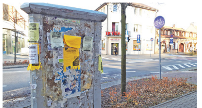
Obecność zeszłorocznych plakatów wyborczych przeczy deklaracjom urzędników

Pod koniec czerwca nasza czytelniczka zwróciła uwagę na straszące w centrum miasta (i nie tylko) słupy ogłoszeniowe. – Próbowalam na różne sposoby zwrócić uwagę gminie, że te słupy są brudne, umazane starym klejem,