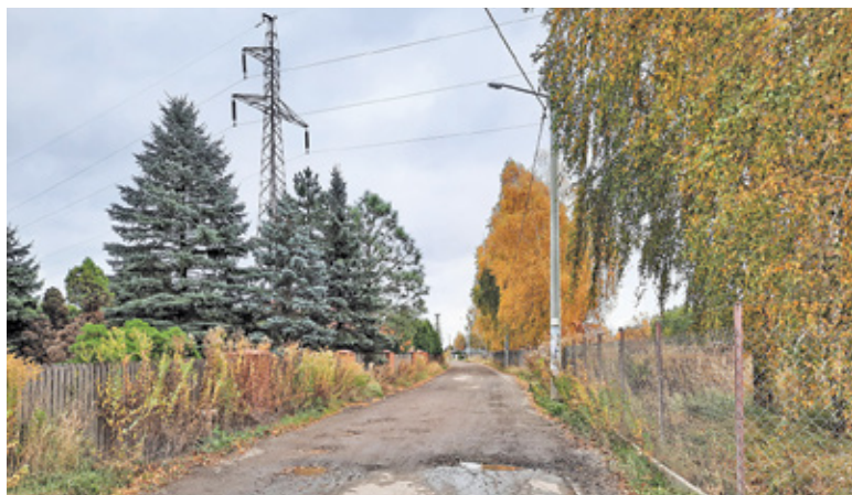
Asfalt ma się pojawić na gruntowym odcinku ul. Fabrycznej

Na fatalny stan ulicy Fabrycznej mieszkańcy skarżą się od lat. Korzystają z niej nie tylko mieszkańcy kolejnych pojawiających się obok osiedli czy domów, ale i sporo kierowców, którzy wybierają równoległą do ul. Słonecznej drogę, by uniknąć stania w korkach. Zwłaszcza wtedy, gdy w okolicy prowadzone są inwestycje drogowe, tak jak teraz na ul. Postępu. Tymczasem sfatygowana asfaltowa nakładka kończy się kawałek za skrzyżowaniem z ul. Konika Polnego, a dalej, prawie do skrzyżowania z ul. Postępu, trzeba jechać drogą gruntową. Wprawdzie w 2016 roku gmina Lesznowola rozpoczęła projektowanie ul. Fabrycznej wraz z odwodnieniem i budową ścieżki pieszo-rowerowej, jednak ze względu na szacowane bardzo wysokie koszty tej inwestycji, realizacja została odłożona na bliżej nieokreśloną przyszłość. Blisko trzy lata temu gmina wyceniła