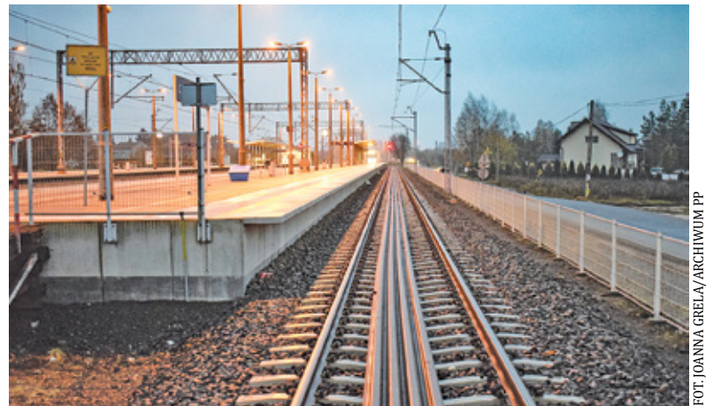
Podróż z Warszawy do Radomia skróci się o kilka minut

Od 7 listopada oba te pociągi wrócą na linię radomską i będą kursować również przez Warkę. Oznacza to, że czas przejazdu ulegnie skróceniu. – Średni czas przejazdu między stacją Radom a Warszawą Zachodnią wyniesie po 7 listopada 1 godzinę i 15 minut. Około 7 minut dłużej potrwa dojazd do Warszawy Śródmieście (w związku z przebudową linii średnicowej i Warszawy Zachodniej większość pociągów z Radomia zatrzymuje się właśnie tu, a nie na Dworcu Centralnym). Najszybszy z po-