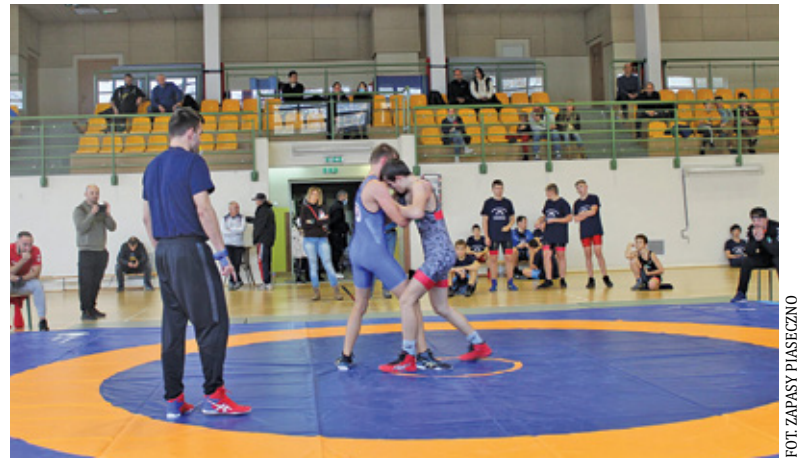
Zapaśnicy prezentowali wysoki poziom walk

W hali sportowej przy ulicy Szkolnej pojawiły się takie drużyny, jak UKS Talent Białoleka, RCSZ Olimpijczyk Radom, występujący w roli gospodarzy UKS Piątka Piaseczno oraz zaprzyjaźniona z nimi Akademia Sportu Baniacha. Rywalizacja toczyła się w rodzinnym gronie, a sam poziom walk stał na wysokim poziomie i był bardzo wyrównany. Po złoto sięgnęli reprezentanci Olimpijczyka Radom, srebro zdobyli