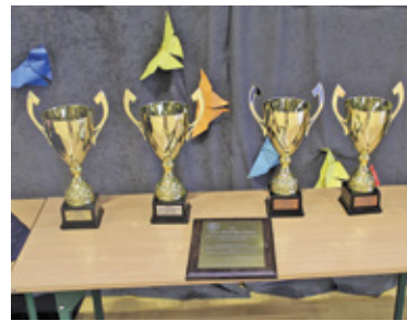
Puchary dla najlepszych drużyn

W niedzielę 24 października w Szkole Podstawowej nr 5 w Piasecznie odbył się Drużynowy Turniej o Puchar Starosty Powiatu Piaseczyńskiego w zapasach w stylu klasycznym. W zawodach walczyli sportowcy będący w kategorii młodzików. Impreza została zorganizowana w ramach środków z Budżetu Obywatelskiego Powiatu Piaseczyńskiego.