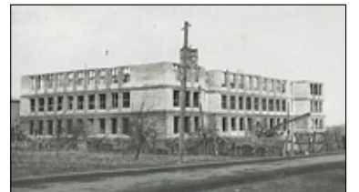
||| Tu zaszła zmiana - Liceum przy Chyliczkowskiej s. 8