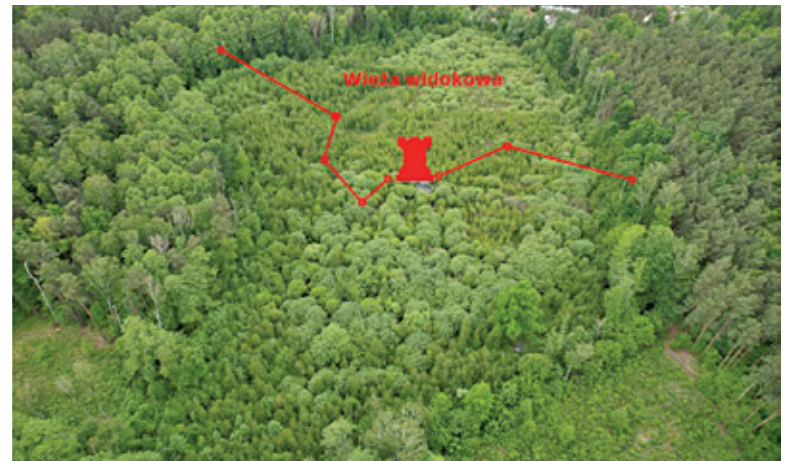
Mieszkańcy chcieliby, aby rosnące wzdłuż ściany lasu dęby stały się pomnikiem przyrody jako Aleja Dębów Magdaleńskich

– Chroniąc środowisko i lasy, Leśna Grupa Robocza planuje podejmować