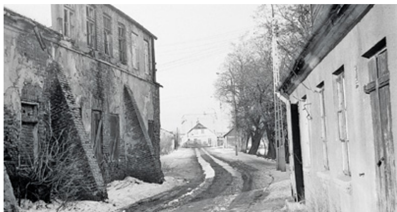
Ulica Zgoda w latach 70. XX w. w tle szkoła