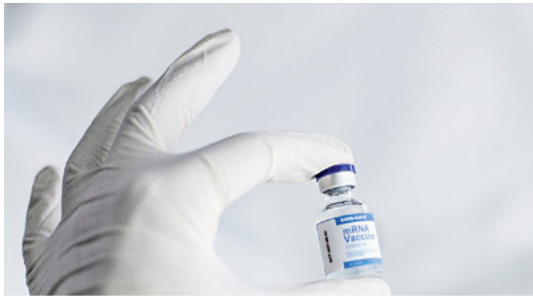
Obecnie zalecane jest przyjęcie dawki przypominającej szczepionki przeciw COVID-19

W powiecie piaseczyńskim zaszczepionych przeciwko COVID-19 jest zdecydowana większość mieszkańców. Różnice poziomu wyszczepialności między najbardziej i najmniej odporną gminą wynoszą około 7,5%. Najwyższym odsetkiem zaszczepionych mieszkańców może się pochwalić Konstancin-Jeziorna, gdzie aż 65,2% mieszkańców przyjęło pełny cykl szczepień. Przy okazji Konstancin-Jeziorna znalazł się w pierwszej dziesiątce gmin w Polsce z najwyższym odsetkiem zaszczepionych. Z kolei Piaseczno utrzymuje 1. pozycję w kategorii średnich gmin. Na dzień 26 października w pełni zaszczepionych jest 64,8% mieszkańców. Wszystko wskazuje więc na to, że gmina Piaseczno otrzyma nagrodę w rządowym konkursie „Najbardziej Odporna Gmina”. Nagrodą jest 1 mln złotych, który samorząd może jednak wydać na ściśle określony cel – działania związane z przeciwdziałaniem COVID-19. „Zgodnie z art. 2 ust. 2 Ustawy COVID-19, mogą być to wszelkie czynności związane ze zwalczaniem za-