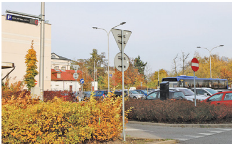
Obecnie na parkingach w centrum miasta często nie ma ani jednego miejsca wolnego

Z dniem 2 listopada 2021 r. uruchomiony zostanie System Miejskich Parkingów Płatnych. Odpłatność zostanie wprowadzona na trzech parkingach w ścisłym centrum Piaseczna: ul. Zgoda/Sierakowskiego, ul. Kościelna (za sądem) oraz Puławska 5. Miejsca postojowe przy ul. Nadarzyńskiej nadal pozostają bezpłatne.