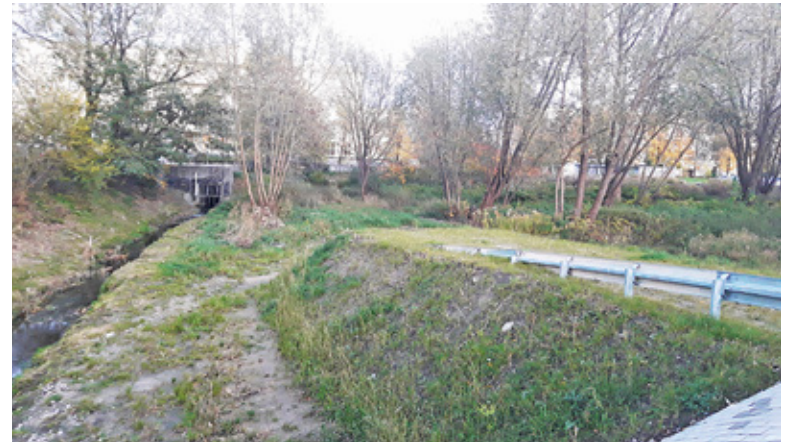
Nowy odcinek traktu ma liczyć ok. 160 metrów

Pierwotnie władze gminy chciały wybudować ten fragment Traktu już w zeszłym roku. Inwestycji nie udało się