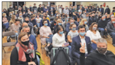
||| Zgorzała - Zmiana władzy s. 6