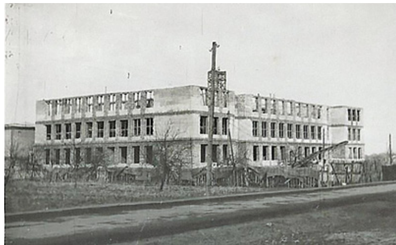
Budowa nowej szkoły przy ul. Chyliczkowskiej, II połowa lat 50.