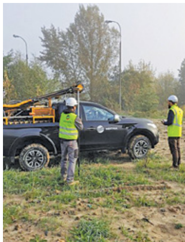
Trwa remediacja gruntów, na których składowano kiedyś szkodliwe dla środowiska substancje

Planach zagospodarowania terenów wzdłuż ul. Puławskiej mówi się od roku. Chodzi dokładnie o 11 hektarów gruntów położonych w kwartale ograniczonym ulicami Puławską, Mleczarską, Energetyczną i Sękocińską. Wcześniej funkcjonowała tu zajezdnia trolejbusowa, a po likwidacji linii w 1995 r. działał w tym miejscu tor Imola. Od kilku lat teren stoi pusty. Wkrótce jednak ma się to zmienić. – Na terenie dawnej zajezdni trolejbusowej powstanie nowa wielofunkcyjna inwestycja otoczona zielenią i terenami rekreacyjnymi. Nowoczesny projekt będzie łączył funkcje mieszkaniowe, biurowe, rozrywkowe, gastronomiczne i handlowe – zapowiada inwestor, firma Auchan, która realizuje inwestycję przez podległą spółkę Nhood Pol-