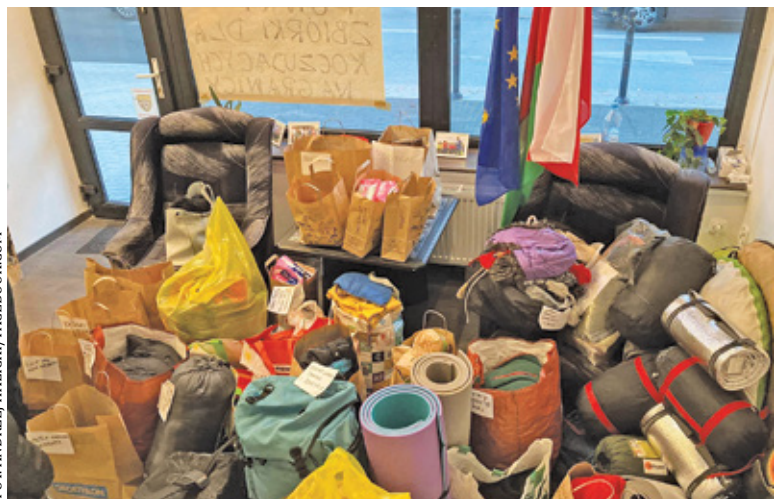
Dary dla uchodźców można było przynosić do biura Platformy Obywatelskiej w Piasecznie

Dary trafiły już do Białegostoku, gdzie zostaną rozdysponowane między potrzebujących. – Dziękujemy wszystkim, którzy wsparli akcję, rzeczowo lub finansowo. Tym którzy sortowali i pakowali ubrania, byli na dyżurach, udostępnili swoje biura, samochody, tym którzy deklaruwali i dalej dekla-