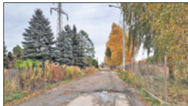
||| Łoziska - Na razie tylko nakładka s. 5