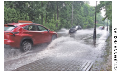
Kałuże tworzą się tu nie tylko po intensywnych opadach

Gmina i powiat mają się w końcu porozumieć w kwestii odwodnienia ul. Długiej. Szanse na szybką realizację tej inwestycji zwiększa również dotacja z rządowego Programu Inwestycji Strategicznych „Polski Ład”.