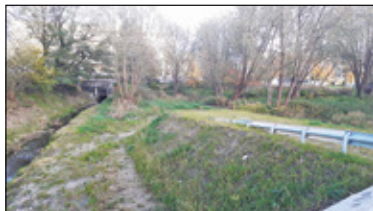
||| Piaseczno - Trakt za sądem s. 2