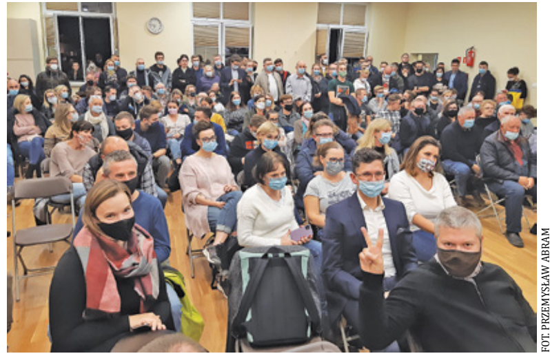
Frekwencja na zebraniu była naprawdę duża

– Transparentność – od tej pory zamierzamy nagrywać wszystkie spotkania publiczne, aby każdy mieszkaniec naszego sołectwa mógł sobie odtworzyć i zobaczyć jak to było. „Watch dog”, czyli kontrolować, w jaki sposób gmina, powiat i województwo realizują