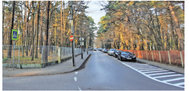
Nowe sanatorium miałyby powstać na rogu ulic Wierzejewskiego i Piasta

– Nie spełniamy wymogu wystarczającej liczby miejsc lecznictwa uzdrawiskowego. Za chwilę może się okazać, że jesteśmy uzdrawiskiem tylko z nazwy – zauważył burmistrz Ka-