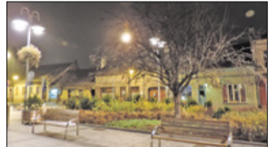
|| Historia - Kamieniczki przy rynku s. 8