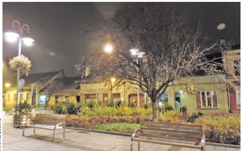
Rynek w Piasecznie, pierzeja wschodnia rynku kamieniczki z pos. 43, 44, 45