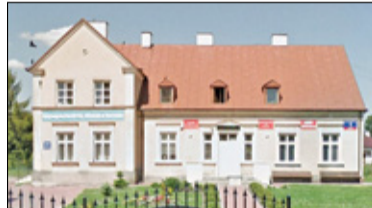
|| Tarczyn - Szkoła tak, basen może kiedyś s. 6