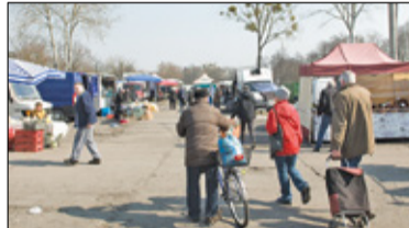
|| Konstancin-Jeziorna - Gdzie powinno i może powstać targowisko? s. 4