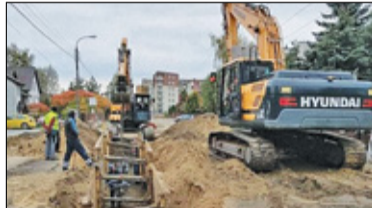
|| Piaseczno - Zmiany na Geodetów s. 5