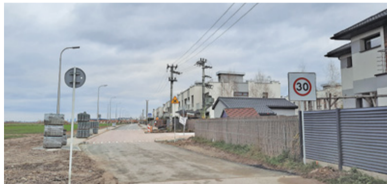
Stan i szerokość drogi różnią się na kolejnych odcinkach

Budowa zaplanowanego na ten rok fragmentu ul. Plonowej dobiega końca. Trwają też prace projektowe dla utwardzonego kilka lat temu odcinka. Środkowy fragment drogi jednak na razie nie ma szans na ucywilizowanie.