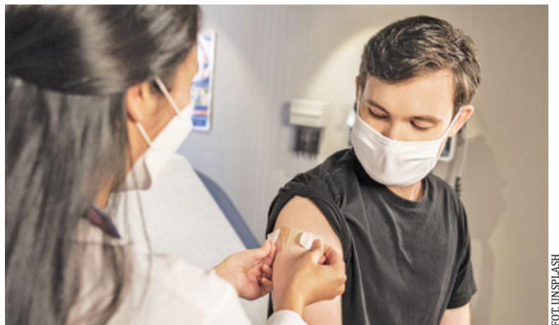
Trzecią dawkę można przyjąć minimum 6 miesięcy od pełnego cyklu szczepienia podstawowego przeciwko COVID-19

Gmina Piaseczno od ogłoszenia konkursu „Najbardziej Odporna Gmina” utrzymała pierwszą pozycję w grupie gmin średniej wielkości (30-100 tys. mieszkańców). W związku z tym z wynikiem 65,16% zaszczepionych miesz-