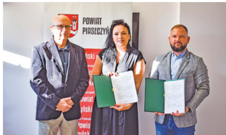
Dofinansowanie pokryje 100% kosztów związanych z realizacją inwestycji

– W środę 10 listopada podpisaliśmy umowę na sfinansowanie projektu, dzięki któremu na terenie naszych czterech szkół powstanie błękitno-zielona infrastruktura mająca na celu odzysk wody deszczowej, w tym zielone ściany, suche strumienie, oczka wodne, ogrody