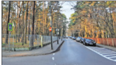
|| Konstancin-Jeziorna - Sanatorium na leśnej działce s. 2

PIASECZNO || GÓRA KALWARIA || KONSTANCIN-JEZIORNA || LESZNOWOLA || PRAŻMÓW || TARCZYN