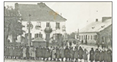
|| Historia - Kamieniczki przy rynku cz. 2 s. 8