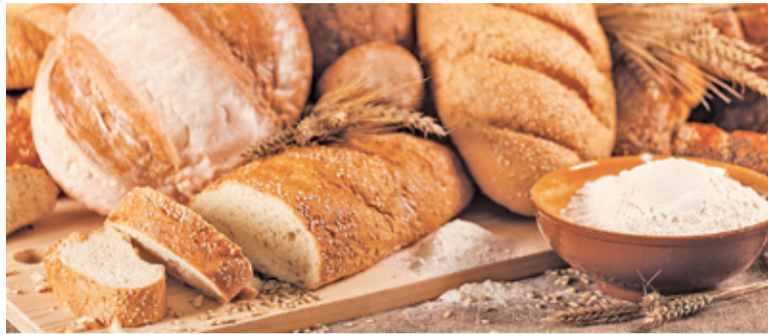
Musimy się przygotować na kolejne wzrosty cen chleba i innych wyrobów piekarniczych

W ostatnim czasie w Polsce coraz więcej piekarni wprowadza opłaty za krojenie chleba na miejscu. Zapytaliśmy kilka firm z Piaseczna, czy u nich obowiązują takie stawki.