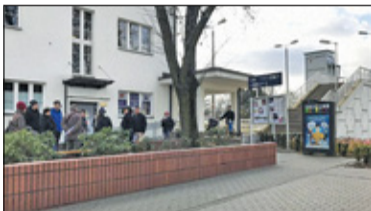
|| Piaseczno - Dworzec w nowej odśnie s. 2