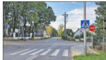
|| Głusków - Rondo do wakacji? s. 6