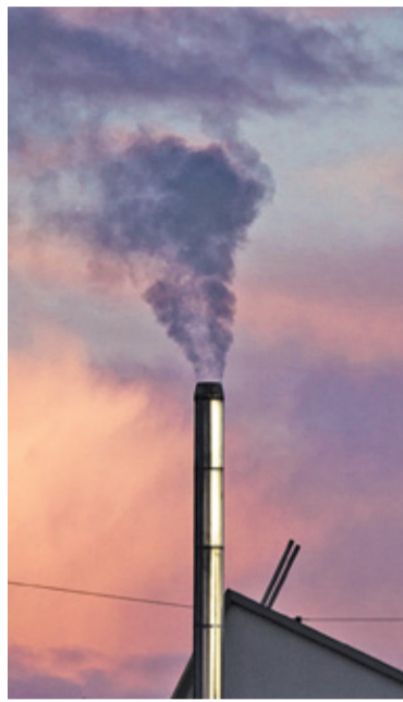
Platforma do pomiaru stanu powietrza została przez gminę wynajęta do końca listopada

Podczas dzisiejszej sesji Rada Miejska ma podjąć uchwałę w sprawie przyjęcia nowego programu dotacyjnego. Zakłada on przyznanie dofinansowania do wymiany pieca w wysokości 75% kosztów nieprzekraczających określonej kwoty. A kwota ta ma się każdego roku zmniejszać, co ma być zachętą dla jak najszybszego podjęcia decyzji o modernizacji sposobu ogrzewania. W 2022 r. mieszkańcy mogliby otrzymać nawet 12 tys. złotych dopłaty, w 2023 r. 10 tys. zł, a od 2024 r. już tylko 5 tys. zł. Dofinansowaniu podlegać będzie koszt zakupu nowego źródła ciepła, materiałów