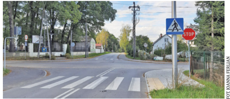
Ze względu na układ skrzyżowania często dochodzi tu do kolizji

tecznie wybór padł na rondo zamiast sygnalizacji, jako rozwiązanie nie tylko skuteczne, jeśli chodzi o poprawę bezpieczeństwa, ale przy okazji niepowodujące takich utrudnień w płynnej jeździe jak sygnalizacja świetlna. Na początku listopada powiat ogłosił przetarg na budowę ronda obok kościoła w Głoskowie. Swoje ofertę złożyło pięciu wykonawców. Najniższą mieści się w zakładanym budżecie, więc jeśli tylko kwestie formalne nie będą budzić wątpliwości, powinno się udać podpisać umowę na realizację tego ważnego dla bezpieczeństwa kierowców, pieszych i rowerzystów skrzyżowania. Budowa