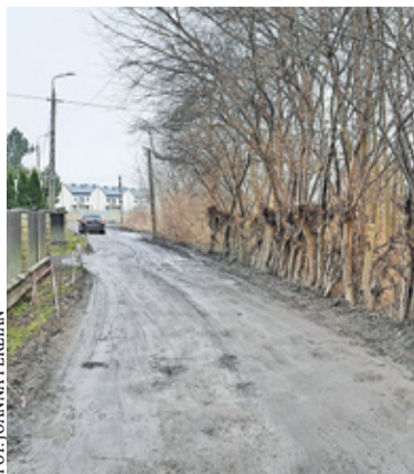
Na liście dróg czekających na decyzje ZRID jest m.in. ul. Gogolińska

Jak wynika z odpowiedzi przekazanej radnym, w sumie Lesznowola otrzymała 41 decyzji ZRID od roku 2009, z czego większość w ostatnich pięciu latach. W zestawieniu tym są zarówno budowy zupełnie nowych dróg, istniejących jedynie w miejscowych planach zagospodarowania, jak i przebudowy dróg istniejących, zarówno tych utwardzonych, jak i gruntowych. Są to ulice położone w różnych częś-