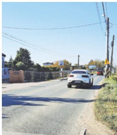
Mieszkańcom zależy przede wszystkim na poprawie bezpieczeństwa pieszych i rowerzystów

– Obecnie wielu rodziców w obawie o bezpieczeństwo poruszania się wąskim chodnikiem (pieszo, hulajnogą, rowerem), rezygnuje z umożliwienia dzieciom samodzielnego dotarcia do szkół – przekonują autorzy petycji. Dorośli i młodzież z kolei będą mogli