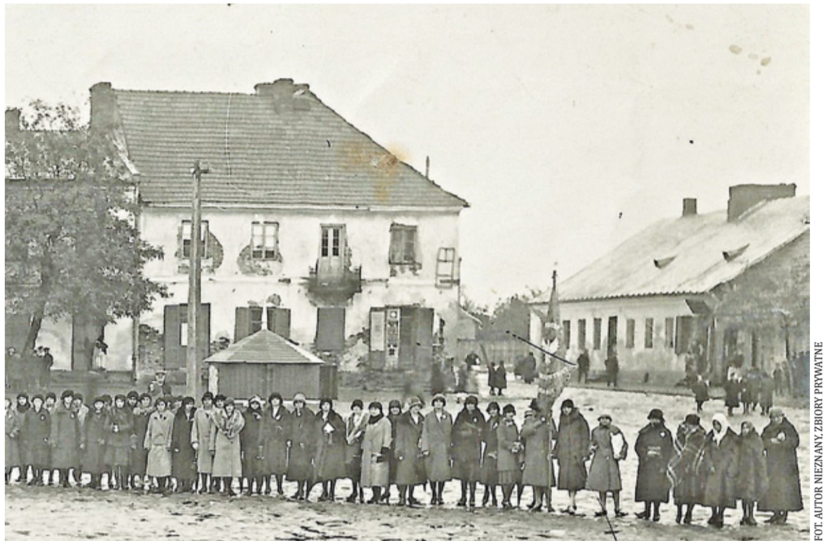
Kamienice przy rynku z posesji 43. oraz 8.i 7. z ul. Warszawskiej 1. i 2. w 1926 r.