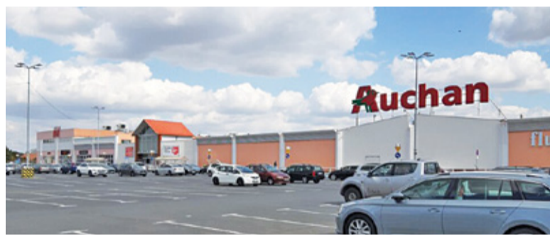
W piaseczyńskim Auchan postawiono specjalne automaty, w których można pozbyć się plastikowych butelek i nakrętek

Dzięki nowemu urządzeniu konsumentom mogą nie tylko dbać o naszą planetę i przyczynić się do zwiększenia świadomości w zakresie segregacji odpadów, ale również zaoszczędzić pieniądze. Każda oddana butelka w sklepie to 6 dodatkowych groszy na kartce lojalnościowej Skarbonka w aplikacji Auchan.