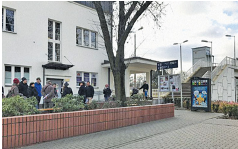
Mieszkańcy Piaseczna biorą udział w konsultacjach w sprawie zagospodarowania okolic dworca PKP

W ubiegłym tygodniu odbył się cykl spotkań z mieszkańcami Piaseczna. Wydarzenie miało charakter otwarty, lokalna społeczność podjęła dyskusję na temat miejsc wokół dworca, które powinny ulec zmianie, ewentualnej