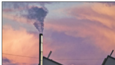
|| Konstancin-Jeziorna - Kolejne narzędzia do walki ze smogiem s. 5