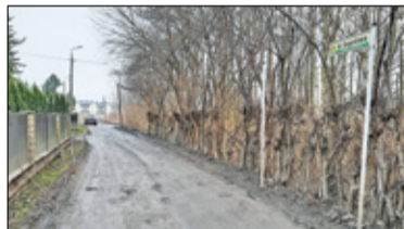
|| Lesznowola - Długa lista i co dalej? s. 4