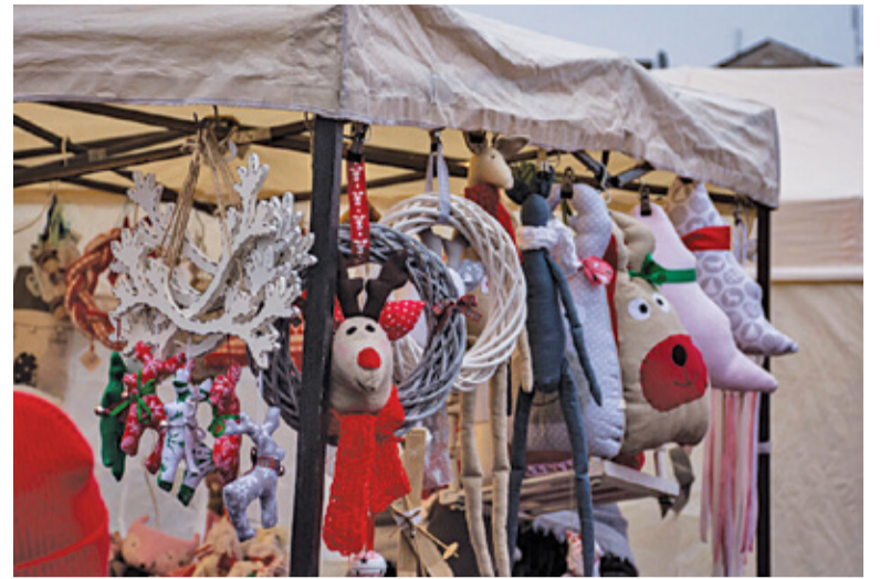
Podczas kiermaszu mieszkańcy mogli kupić ręcznie robione ozdoby świąteczne

Między godziną 11.00 a 16.00 na placu Piłsudskiego rozstawiono kramy z wyrobami rękodzielniczymi oraz świątecznymi smakołykami. To był idealny moment na zdobycie naprawdę wyjątkowych i niepowtarzalnych prezentów świątecznych. Można było kupić ręcznie robione ozdoby choinkowe, stroiki na