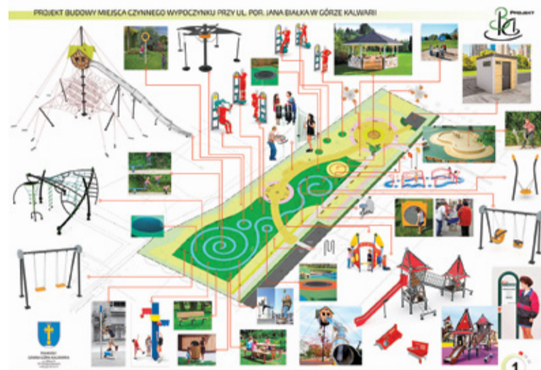
FOT. WIZUALIZACJA UMIG GÓRA KALWARIA

Na placu stanie między innymi wielka, dwunastometrowa wieża, na czubku której znajdzie się domek dla dzieci ze zjeżdżalnią. Całość będzie podtrzymywana stalowymi linami, które mają zabezpieczać konstrukcję i utrzymywać ją w pionie. Wysoka wieża z przeplotnią zapewni miejsce dla 60 osób bawiących się jednocześnie. Pod pajakiem znajdzie się bezpieczna nawierzchnia, przeznaczona na plac zabaw.