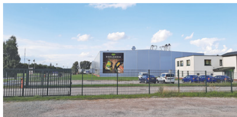
Okoliczni mieszkańcy skarżą się przede wszystkim na uciążliwość ruchu samochodowego związanego z działalnością firmy