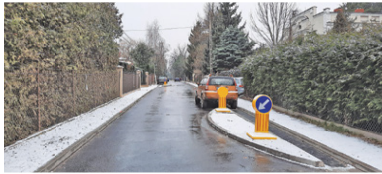
Na Anhellego stanęły szykany, których zadaniem jest spowolnienie ruchu na ulicy