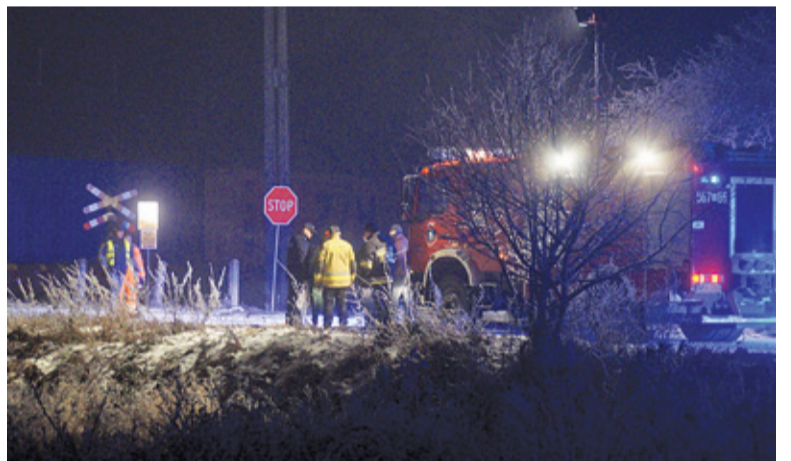
Przejazd kolejowy jest niestrzeżony i znajduje się przy nieoświetlonej drodze