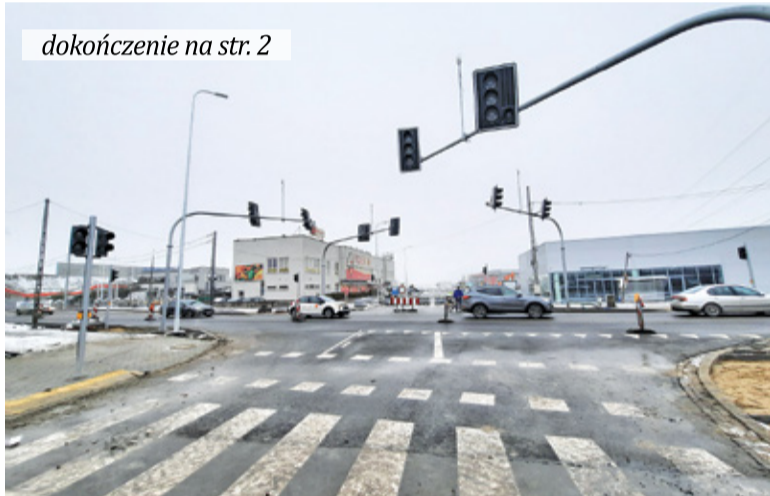
Skrzyżowanie ma być bezpieczne, a ruch bardziej płynny dzięki lewoskrętom