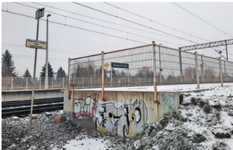
Dojście na peron od strony północnej to jedno z ustaleń gminy, PKP i projektantów

PKP PLK, sołtysi Nowej Iwicznej, Nowej Woli i Zgorzały wspierani przez radnego Grzegorza Gonsowskiego, poprosili o pilne podjęcie rozmów na temat