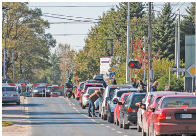
Tunel lub wiadukt przy ulicy Krasickiego to marzenie wielu stojących w korkach, a także właścicieli domów zlokalizowanych przy tej ulicy