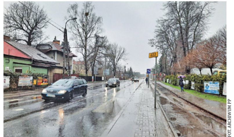
Wzdłuż torów wąskotorówki w przyszłości będzie biegła ścieżka rowerowa

Ponadto, droga rowerowa może pojawić się na ulicy Nadarzyńskiej od ulicy Towarowej do ulicy Kilińskiego. Zostanie także przedłużony ciąg rowe-