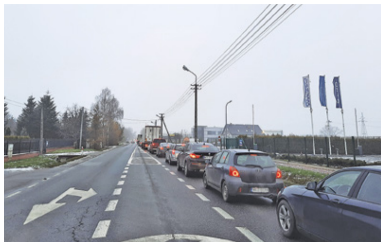
Kierowcy i mieszkańcy z utęsknieniem czekają na budowę nowej, dwupasmowej obwodnicy Lesznówoli