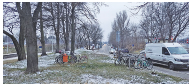
Uczestnicy konsultacji proponowali umieszczenie przy dworcu parkingu rowerowego

Uczestnicy zwrócili również uwagę na potrzebę budowy nowych przejść przez tory kolejowe – czy to w postaci tunelu czy kładki. Na przedłużeniu ul. Nadarzyńskiej mieszkańcy chętnie wi-