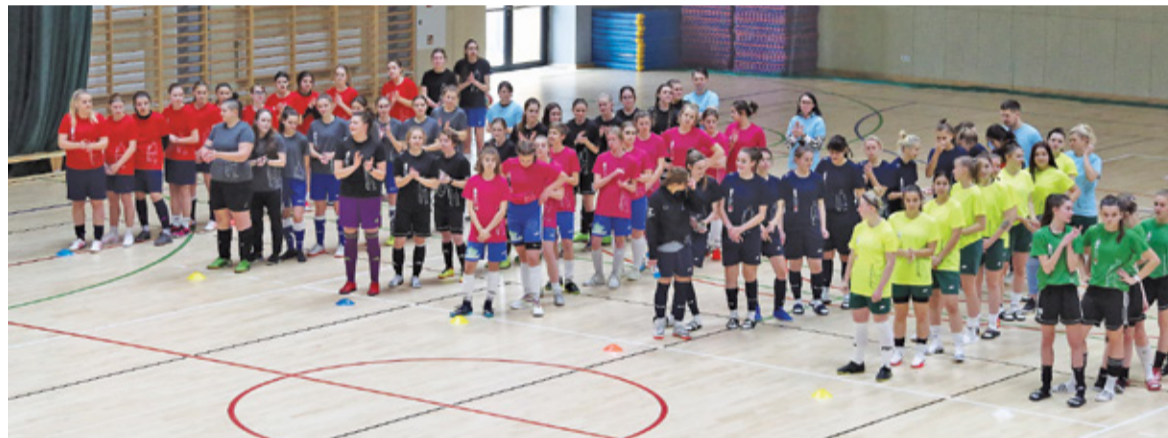
W zawodach wzięło udział 10 klubów piłkarskich

– Wszyscy spotkaliśmy się tu z powodu Tomka, który w pewien sposób