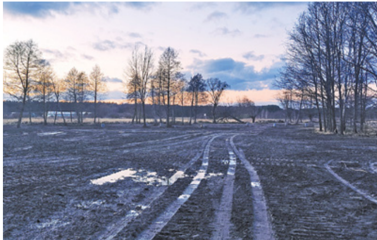
Obszar znajdujący się w sąsiedztwie rzeki Małej został przygotowany pod budowę nowego osiedla

– Obecnie analizujemy to zgłoszenie. Nie wykluczamy konieczności