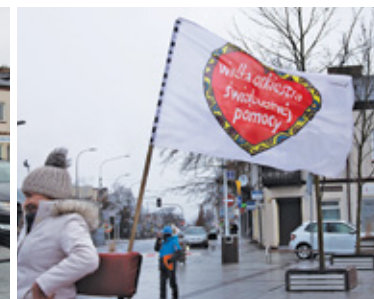
Mimo złej pogody, udało się zorganizować większość zaplanowanych atrakcji