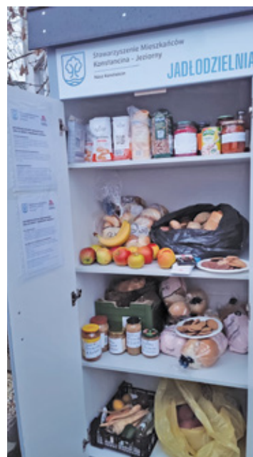
Już pierwszego dnia lodówka i półki zapełniły się różnymi produktami

Pierwotnie druga Jadalnia miała stanąć w Mirkowie, ale ostatecznie wymagania postawione przez władze gminy wolontariuszom, uniemożliwiły realizację tego pomysłu. Idea postawienia drugiej lodówki, w której można podzielić się jedzeniem z innymi, pojawiła się ponownie jesienią