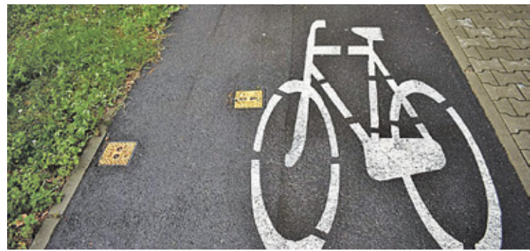
Na ul. Wiślanej ma pojawić się ciąg pieszko-rowerowy (zdjęcie ilustracyjne)

– Inwestycja ma na celu poprawę stanu technicznego i użytkowego ulicy poprzez poprawę stanu technicznego nawierzchni jezdni, budowę ścieżki pieszko-rowerowej, chodnika oraz budowę elementów uspokojenia ruchu w postaci wyniesionych skrzyżowań i progów zwalniających. – informuje starostwo. Wspomniane wyniesione skrzyżowanie ma się pojawić na przecięciu z ul. Osiedlową.