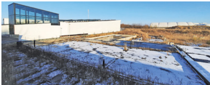
Wątpliwe wydaje się wykorzystanie po tylu latach fundamentów wylanych pod drugi etap budowy CEiS

Gmina zrobiła pierwszy krok do dokończenia budowy CEiS w Mysiadle. Zamierza jednak przygotować nowy projekt.