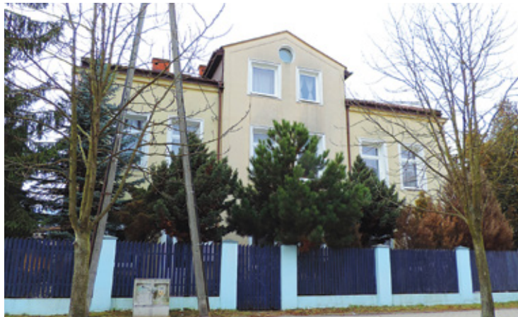
W tym domu w Piasecznie przy ul. Świętojańskiej był posterunek policji i przez krótki czas sztab dowodzenia policjantów ścigających bandę Zielińskiego

Ilość ofiar Zielińskiego zdumiewa, zdumiewa też opis obław, bo było ich