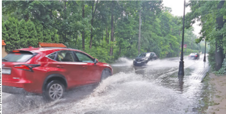
Gigantyczna kałuża to stały krajobraz na drodze prowadzącej z Piaseczna do Konstancina

Na tę inwestycję mieszkańcy czekali od lat. Wielka kałuża, która tworzy się na ulicy Długiej między ulicami Parkową a Leśną nawet po niezbyt intensywnych opadach deszczu, jest