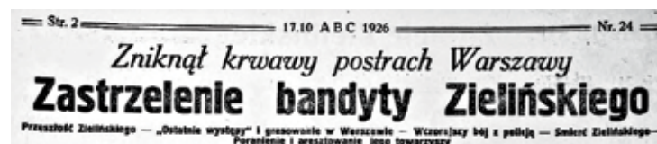
Tytuł z dziennika „ABC” z 1926 roku