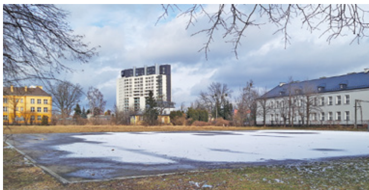
Namiot, który stanie w tym miejscu, ma pełnić funkcję doraźnej sali widowiskowej

Niedawno narodził się pomysł dożąnego rozwiązania tych problemów. W parku miejskim, na pustym placu między stadionem i Zespołem Szkół nr 3, ma stanąć namiot koncertowy na ok. 300 miejsc. Obecnie trwają formalności związane z wynajmem tego terenu