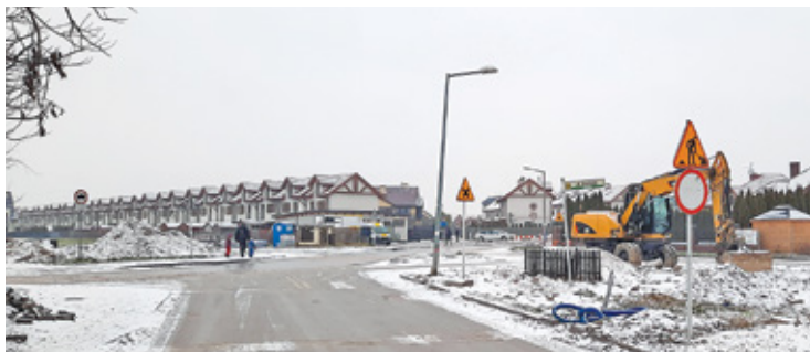
Skrzyżowanie jest obecnie przejezdne, ale oficjalnie to wciąż plac budowy

Budowa ronda w Zgorzale zamieniła się w wieloodcinkową powieść. Irytację mieszkańców, poza przedłużającą się inwestycją, potęgują tłumaczenia władz gminy dotyczące powodów opieszałości wykonawcy oraz terminu zakończenia prac.