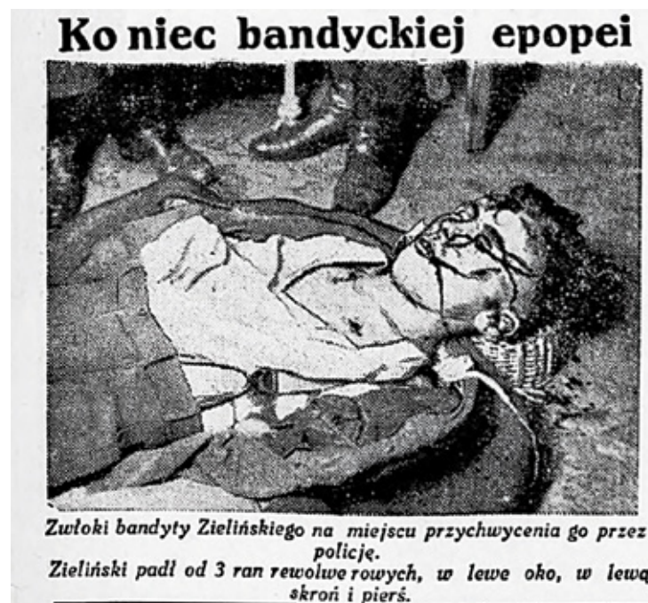
Zdjęcie z dziennika „ABC” z 1926 roku