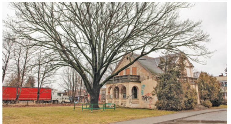
Kościół w Mysiadle miałby powstać na działce leżącej za niszczącym dworkiem przy ul. Osiedlowej

Transakcja tego typu zwykle budzi sporo emocji. W przypadku Lesznowoli potęguje je fakt, że gmina jest zadłużona na 160 mln złotych i od dobrych kilku lat brakuje pieniędzy na ważne dla