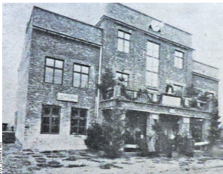
Dom Ludowy (Stara Mleczarnia) w 1928 r.