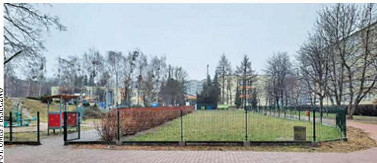
Wybieg miałby stanąć w sąsiedztwie placu zabaw

P lan utworzenia w tym miejscu wybiegu dla psów powstał na wniosek mieszkańców. Chodzi o fragment parku leżący w bezpośrednim sąsiedztwie placu zabaw. – Obecnie, dzięki przesunięciu ogrodzenia placu zabaw, za ławkami i żywopłotem powstał plac, który zdaniem wnioskodawców można by przeznaczyć na teren przeznaczony na specjalny wybieg dla psów. Oczywiście skwer ten zostałby wygradzony również od strony placu zabaw, w miejscu dawnego ogrodzenia, tuż za ławkami oraz żywopłotem. Ogólnodostępny, zamknięty teren umożliwiłby psom swobodne bieganie. Zgodnie z przepisami właściciele nie mogą puszczać bowiem swobodnie psów na terenie parku czy osiedla – opisują pomysł urzędnicy. I proszą mieszkańców o opinię na temat takiego rozwiązania.