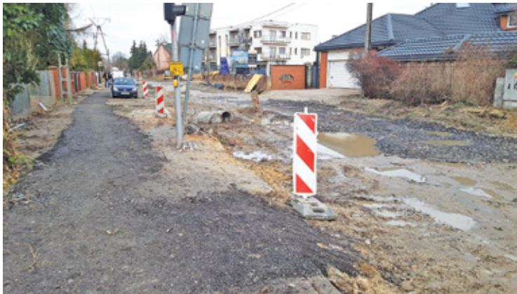
Wykonawca doraźnie utwardził kruszywem ścieżkę dla pieszych. Na komfortowy przejazd musimy jeszcze poczekać

Rzeczywiście, wzdłuż ulicy pojawił się niedawno utwardzony kruszywem, doraźny ciąg pieszy. Na komfortowy dojazd trzeba będzie jeszcze poczekać. – Po zakończeniu prac przy budowie kanalizacji deszczowej, Wykonawca cofnie się w kierunku ul. Rubinowej