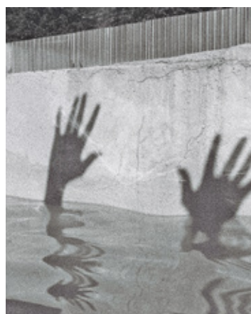
W styczniu 2022 roku piaseczyńska policja odnotowała już 4 próby samobójcze. Przeżył jedynie 14-latek

Wyjątkowo niepokojąco wyglądają dane dla powiatu piaseczyńskiego. Jak informuje Komenda Powiatowa Policji w Piasecznie w 2021 r. prób samobójczych odnotowano 62. Dla porównania w roku 2020 było ich 37, w 2019 – 19, w 2018 – 29 i w 2017 – 33. Oznacza to, że statystycznie w ubiegłym roku decyzję o zakończeniu swojego życia mieszkańcy podejmowali dwukrotnie częściej niż zwykle. Na szczęście w większości przypadków próby te