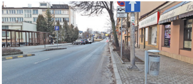
Władze gminy chcą, by remont zakończył się jeszcze w pierwszym półroczu br.

R emont fragmentu ul. Puławskiej na odcinku od ul. Chyliczkowskiej do Rynku oraz odcinka ul. Kościuszki od Rynku do Skweru Kisiela to kolejny etap flagowej inwestycji władz gminy obecnej kadencji. W ubiegłym roku wyremontowano już ul. Puławską od wlotu do miasta do skrzyżowania z ul. Chyliczkowską. Efekty nie spodobały się części mieszkańców. Głównym argumentem było zlikwidowanie znacznej części miejsc postojowych wzdłuż ulicy. Przedsiębiorcy skarżyli się, że spadają im obroty, w dodatku pojawiły się problemy z dostawami zaopatrzenia do sklepów. Podobne obawy wyrazili przedsiębiorcy prowadzący lokale przy ul. Kościuszki, która ma być remontowana w następnym etapie projektu. Jesienią gmina zorganizowała