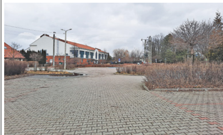
Parking w Łazach poza godzinami pracy szkoły świeci pustkami

to, czy ktoś z Urzędu Gminy sprawdził liczbę miejsc dla nauczycieli i ustalił, czy jest ona wystarczająca. Każda ze szkół ma ponad 100 pracowników. W Nowej Iwicznej po dobudowaniu nowego skrzydła szkoły „za bramą” rzeczywiście jest całkiem sporo, ale nie wiadomo, czy wystarczy dla wszystkich. Z kolei w Łazach parking dla pracowników na terenie szkoły z pewnością jest za mały. Może tam stanąć około 20 samochodów. Gmina przekonywała, że nauczyciele za parkowanie nie