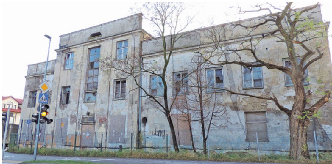
Stara Mleczarnia w 2022 r.

Nowa Iwiczna była jedną z najmniejszych gmin powiatu warszawskiego, zajmowała 4612 ha powierzch-