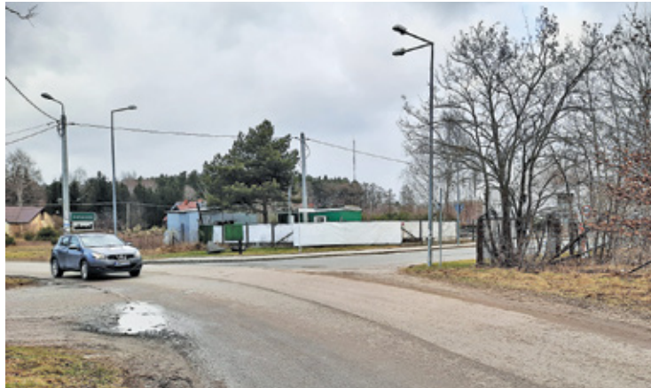
Jeśli uda się rozstrzygnąć przetarg, rondo na skrzyżowaniu powinno być gotowe po wakacjach

P rowadząca do al. Krakowskiej ulica Ułanów w Stefanowie cieszy się dużym zainteresowaniem kierowców i to nie tylko tych, którzy chcą dotrzeć do Wólki Kosowskiej. Drogę tę wybiera również sporo mieszkańców dojeżdżających do Warszawy obwodnicą czy wybierających się „siódemką” na południe, w kierunku Radomia. Jest to także droga dojazdowa do Cmentarza Południowego w Antoninowie. Zwłaszcza w ostatnim czasie, kiedy powiat poprawił nawierzchnię ul. Ułanów i przebudował ulicę Żółtych Piasków, nie tylko zwiększyło się zainteresowanie tą trasą, ale również natężenie ruchu na poszczególnych wlotach skrzyżowania. Wcześniej dominujący był ruch prostopadły między ulicą Graniczną (od strony cmentarza) a Ułanów, a pozostałe wloty obsługiwały niewielki ruch lokalny. Przebudowa ul. Żółtych Piasków, zwłaszcza w obliczu zamontowania spawalniczych na ulicy biegnącej wokół cmentarza, spowodowała, że zdecydowanie wzrosła popularność