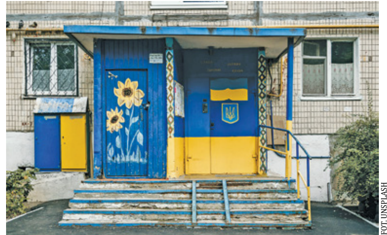
Z terenów Ukrainy przed wojną uciekło już ponad pół miliona ludzi

Z granicy przyjechała bussem, z obcymi. Nie była nawet pewna, gdzie jedzie. Trafiła do Piaseczna. Tu wolno-