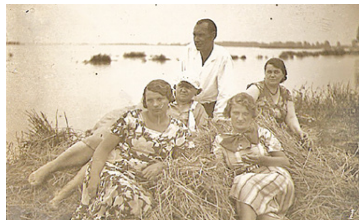
Nad Wisłą w Piaskach

do ojca i pana Laferego, gdyż tylko oni mogą pomóc w zdobyciu odpowiednich dokumentów upoważniających do zwolnienia z obozu. Sprawa się ciągnie, przychodzi ciężka zima. Pola nie dostaje wiadomości od męża, cały czas