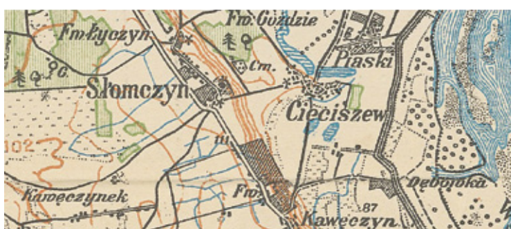
Mapa okolic, w których znajduje się Słomczyn, Cieciszew i Piaski