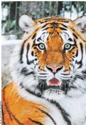
Mieszkańcy obawiają się m.in. ryzyka ucieczki niebezpiecznych zwierząt z terenu azylu

Ustawa ma na celu utworzenie Centralnego Azylu jako odrębnej jednostki budżetowej finansowanej z budżetu państwa, a konkretnie części, którą dysponuje Ministerstwo Środowiska. Rzecz w tym, że w projekcie ustawy mowa jest już o konkretnej lokalizacji – na terenie dawnej radiostacji