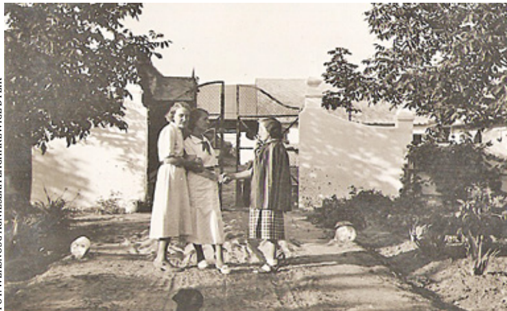
Brama wjazdowa na dziedzińcu dworu w Piaskach