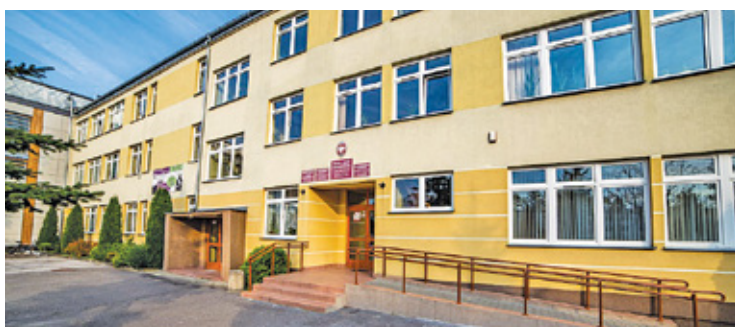
Od września uczniowie będą mogli również wybrać kierunek ogólnokształcący

Rada Powiatu jednogłośnie przyjęła uchwałę powołującą do życia nową szkołę – Liceum Ogólnokształcące w Górze Kalwarii. Placówka będzie częścią Zespołu Szkół Zawodowych im. ppor. E. Gierczak.