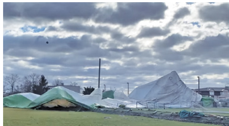
Całkowicie zniszczony balon Akademii Piłkarskiej Green Piaseczno

W 2019 roku obiekt akademii składał się z dwóch boisk trawiastych i jednego boiska ze sztuczną nawierzchnią. Właściciele z własnych środków wyposażyli AP Green w zadaszenie sztucz-