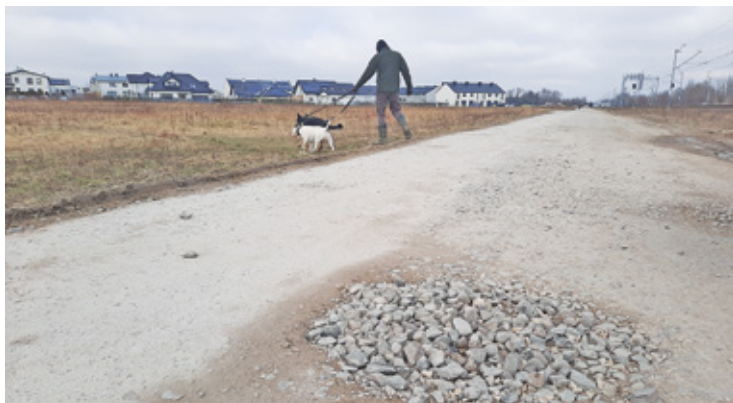
Ulicą spacerują też piesi, w tym z dziećmi oraz psami

Na stan infrastruktury drogowej w sołectwie mieszkańcy narzekają od dawna. Przez cały czas na dawnych polach uprawnych wyrastają kolejne osiedla, przybywa mieszkańców i samochodów, a drogi, którymi codziennie przejeżdżają setki samochodów, poza pojedynczymi wyjątkami, są nieutwardzone. W tym ulica Gogolińska – jedyna prowadząca z tzw. Nowej Zgorzały w kierunku ulicy Karczunkowskiej oraz stacji kolejowej Jeziorki. – Od wielu lat zwracamy uwagę na absurdalne i nieracjonalne niedoinwestowanie obszaru