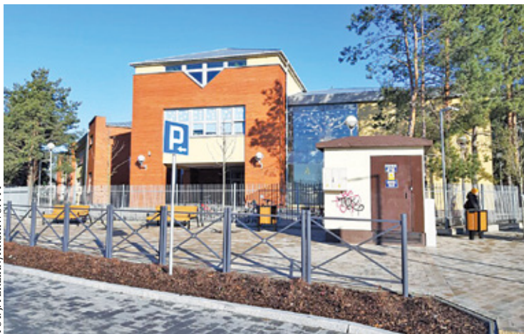
Gmina nie ma już możliwości dalszej rozbudowy szkoły w Józefostawiu

Rzeczywiście, od czasu budowy placówki przy ul. Kameralnej zarówno w Józefostawiu, jak i w Julianowie znacznie wzrosła liczba mieszkańców.