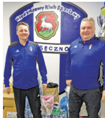
Kluby piłkarskie pomagają Ukrainie

Piłkarski MKS Piaseczno postanowił zorganizować wielką zbiórkę potrzebnych rzeczy. Jeszcze do najbliższego piątku 4 marca do biura klubu przy ul. 1 Maja 16, Piaseczno można przynosić dary dla mieszkańców Ukrainy, między innymi: wodę w zgrzewkach, plastry opatrunkowe, bandaże, maseczki,