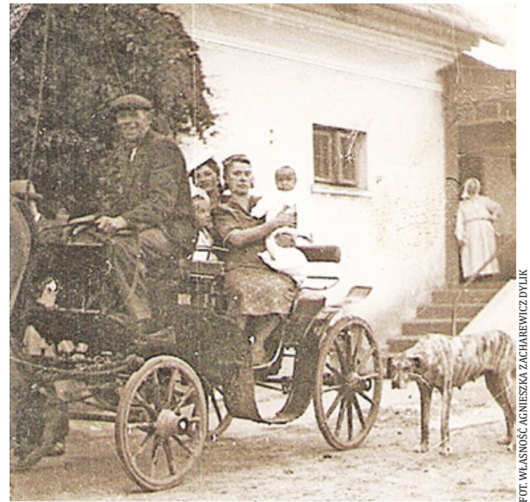
Na dziedzińcu dworu w Piaskach