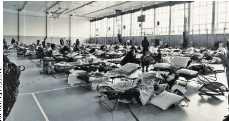
Sala gimnastyczna w Medyce. Tu ci, którzy ostatnie dni spędzili w kolejce do granicy, mogą chwilę odpocząć przed dalszą podróżą

dali odpór. Mężczyźni poszli na wojnę – każdy w przedziale wiekowym 18-60 lat został objęty obowiązkiem