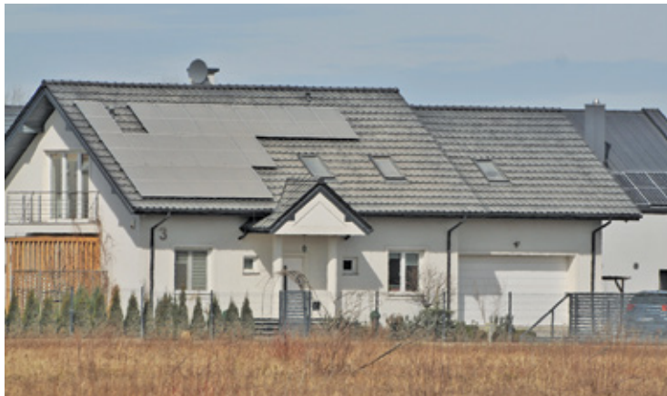
Zakurzone elewacje, okna czy panele fotowoltaiczne martwią mieszkańców mniej niż oddziaływanie pyłu na ich zdrowie

Kolejne utwardzenie ulic Gogolińskiej i Kormoranów w Zgorzale wywołało kolejną lawinę złości wśród mieszkańców sąsiadujących z nimi osiedli. Gmina ponownie rozkłada ręce i tłumaczy, że drogi są gruntowe, a pogoda bezdeszczowa i... blokuje mieszkańcom możliwość komentowania.