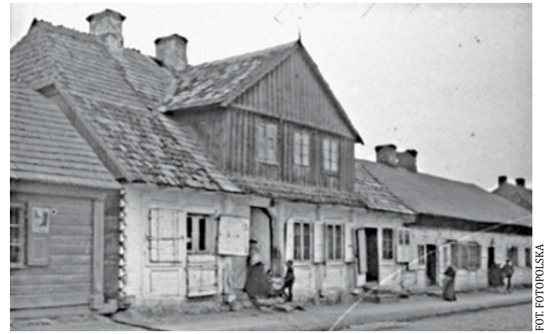
Piaseczno centrum miasta na początku XX w.

Ważne w tym czasie było zaopatrzenie regionu w mięso, a był problem z piaseczyńskimi handlarzami i rzeźnikami. Tu wołę powołać się na notatkę