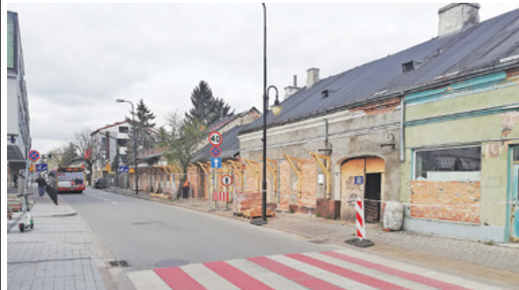
Gmina zabezpiecza budynki przy ul. Warszawskiej

O pracach nad zmianą MPZP dla centrum Piaseczna mówi przedstawiony przez gminę projekt „Piaseczno odNowa”. Zgodnie z nim, ratusz planuje nową zabudowę na terenie między ulicami Sierakowskiego i Warszawską a ulicą Zgoda. Na obecnym parkingu pomiędzy ul. Zgoda i ul. Sierakowskiego planowana jest budowa sali kinowo-teatralnej, obok w przyszłości miałyby powstać nowa siedziba Urzędu Miasta. W kwartale między ulicą Rynkową, Warszawską i ulicą Zgoda konserwator dopuszcza zabudowę mieszkaniową. Gmina bierze pod uwagę taką zabudowę, z usługami zlokalizowanymi na parterze. Jednocześnie miałyby zostać