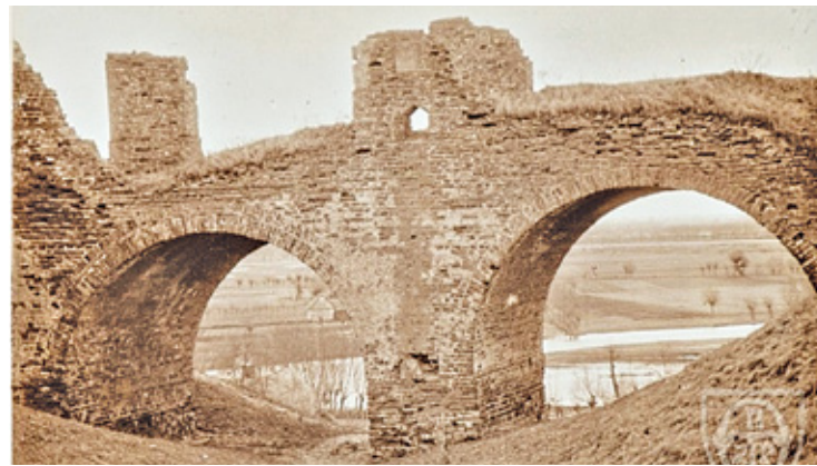
Czersk. Ruiny zamku w około 1900 r.