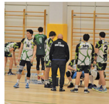
SPS Konstancin-Jeziorna, mimo prowadzenia 2:0, przegrał mecz z Olympem Błonie

– Taki rezultat oznacza, że przegraliśmy walkę o 8 miejsce w tabeli. Można