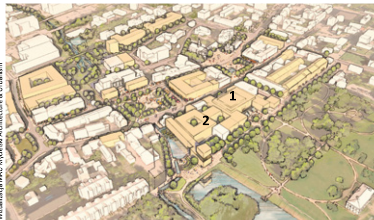
1 – lokalizacja sali kinowo-teatralnej

Polityka parkingowa prowadzona przez gminę Piaseczno służy zapewnieniu dostępności do handlu i usług w śródmieściu