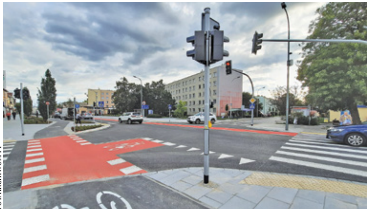
Nie wszyscy rowerzyści wiedzą, jak korzystać z nowej infrastruktury rowerowej

Na stronie urzędu www.piaseczno.eu można też znaleźć broszurę przypominającą zasady ruchu obowiązujące rowerzystów, wyjaśniającą nowe