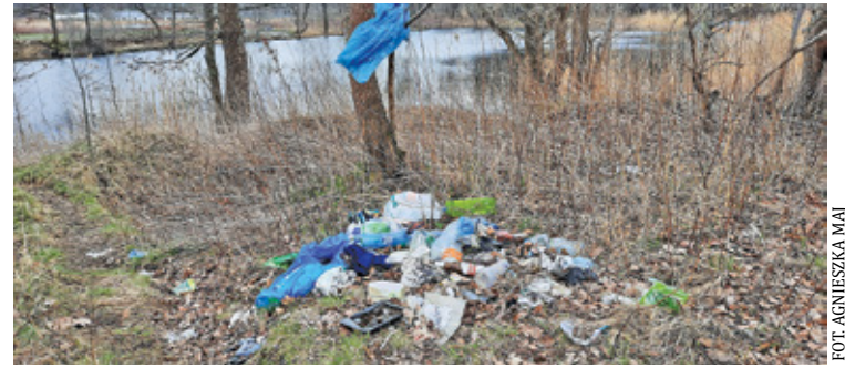
Niestety w naszych lasach, na skwerach czy przy ulicach, jest co sprzątać

– Wszystkie trasy zaprowadzą nas w jedno miejsce: do obozowiska harcerskiego pod skarpy przy ul. Litera-