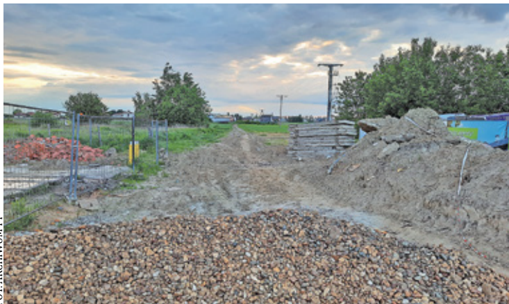
Utwardzona nawierzchnia ulicy Wilgi kończy się na wysokości ostatnich budynków

– Tym samym osiągnęliśmy kamień milowy w procedurze zmierzającej do budowy ważnego i niezbędne-