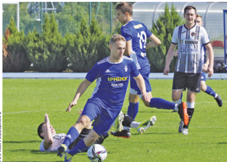
Obecny tydzień w IV lidze będzie mieć duże znaczenie dla układu tabeli