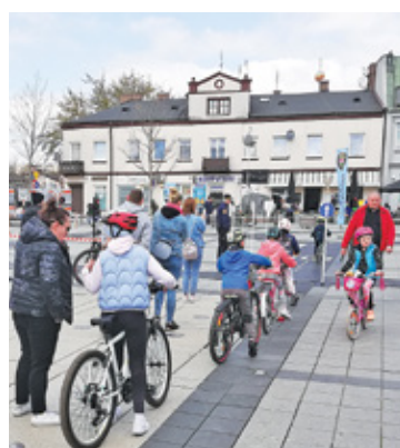
Najmłodszy sprawdzali swoje umiejętności w miasteczku ruchu drogowego

nym okiem policjantów i strażników miejskich, organizatorów i oczywiście