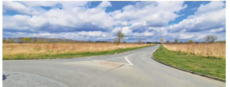
Na działki położone w sąsiedztwie CEiS nie znaleźli się na razie chętni

Przetarg na sprzedaż trzech pierwszych działek, z odzyskanych przez gminę Lesznowola terenów po byłym KPGO Mysiadło, został ogłoszony w lutym br. Trzy działki o kolejnych numerach 246, 247, 248 leżą po północnej stronie ulicy biegnącej od Puławskiej do Centrum Edukacji i Sportu