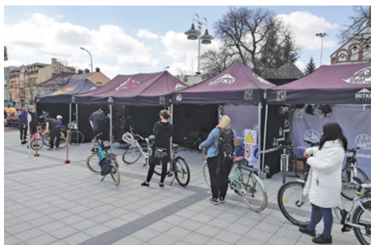
Miłośnicy dwóch kółek ustawili się w kolejce, aby sprawdzić stan techniczny roweru

Można było oznakować swój rower, dopompować koła, naprawić drobne usterki i wyregulować mechanizmy napędu. Młodzi amatorzy cyklingu prezentowali się świetnie w pełnym rynsztunku rowerowym – koniecznie w kaskach. Również na miejscu można było wypożyczyć zarówno rower, jak i kask. Ciekawostką była możliwość