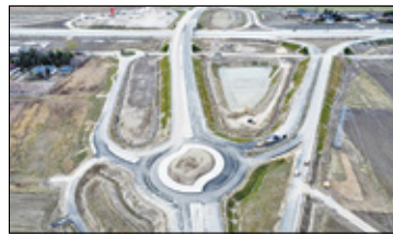
||| Lesznowola - Do węzła Lesznowola - nową ul. Postępu s. 5