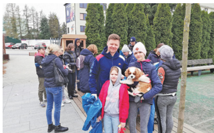
Niestety ze względu na kiepską pogodę frekwencja była słabsza niż w roku poprzednim