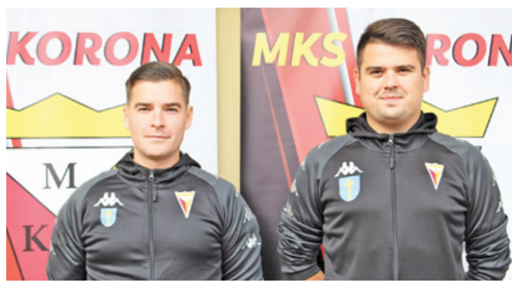
Poprzednio nowy trener RKS-u z seniorami pracował jako asystent w Koronie Góra Kalwaria

Do tej pory byłeś znany głównie z trenowania młodzieży. Kiedy uznałeś, że chcesz zacząć pracować z seniorami?