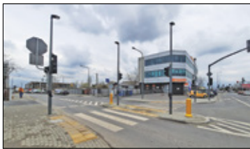
||| Piaseczno - Pierwszy etap przebudowy s. 4