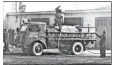
||| Historia - Pali się! Czyli o strażakach s. 9