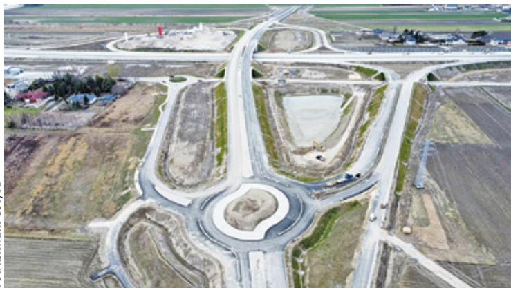
Do czasu wybudowania nowego przebiegu drogi 72, ruch z węzła Lesznowola będzie prowadził na ul. Postępu

– Trasa S7 ma być przejezdna jesienią tego roku. Dlatego od kilku lat sukcesywnie remontujemy wszystkie drogi powiatowe, którymi do niej dojeżdżemy – podkreśla starosta Ksawery