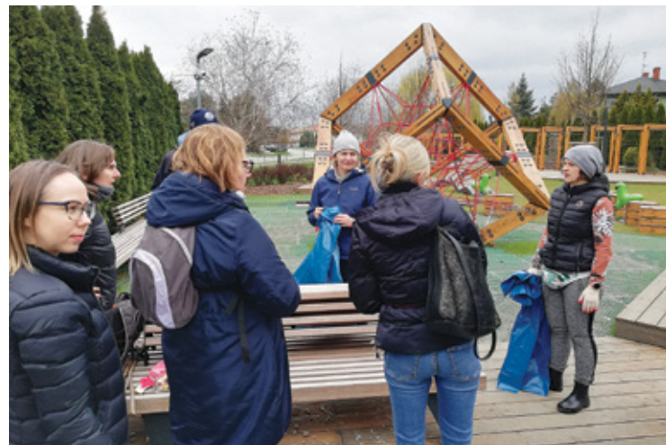
Uczestnicy przed udaniem się do zaproponowanych miejsc, odbierali worki na śmieci

Tak też było w Józefostawiu. 23 kwietnia o godz. 10.00 na skwerze