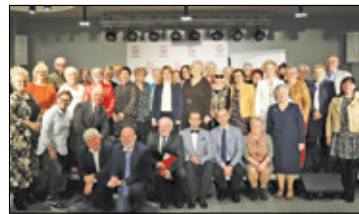
||| Piaseczno - Piaseczyńska Rada Seniorów s. 6