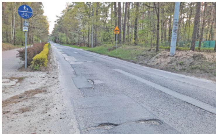
Droga jest doraźnie łataną od wielu lat, co doskonale widać, kiedy się nią przejeżdża