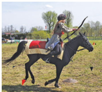
Niesamowite wrażenie robił pokaz strzelania z łuku w czasie galopu

w strojach tatarskich, przy oryginalnej altajskiej muzyce, z precyzją trafiały w tarcze. Emocji było co niemiara.