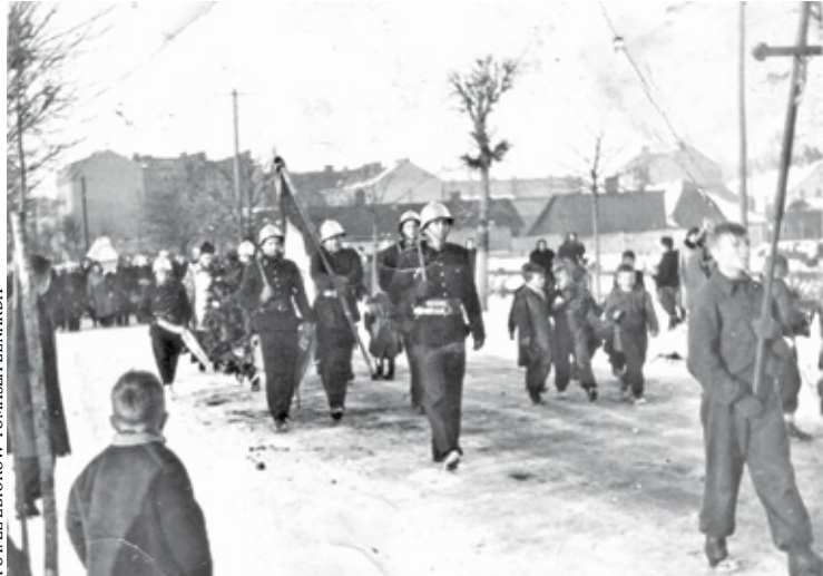
Pogrzeb strażaka, który zginął w akcji

Jak ważna jest praca strażaków, ich umiejętności, sprawność i przede wszystkim wiedza, nie trzeba udowadniać. Ile istnień ludzkich uratowali od śmierci w płomieniach, tego nikt nie zliczy. Dnia 4 maja, jak co roku przypada święto strażaków i obchodzone jest w wielu krajach, a patronem strażaków jest św. Florian.