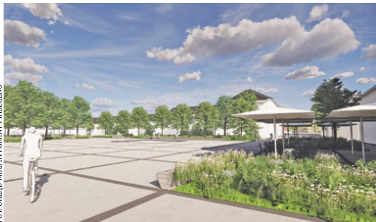
Wstępna koncepcja nowej zieleni na rynku

M oda na betonozę rozkwitła na przełomie pierwszej i drugiej dekady XXI wieku, a uległo jej nie tylko Piaseczno. Tak zwana choroba współczesnych miast dotknęła też m.in.: Kielce, Kutno, Lublin, Łódź, Chorzów,