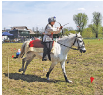
Oryginalne stroje amazoнок i altajska muzyka towarzyszyła pokazowi łucznicztwa