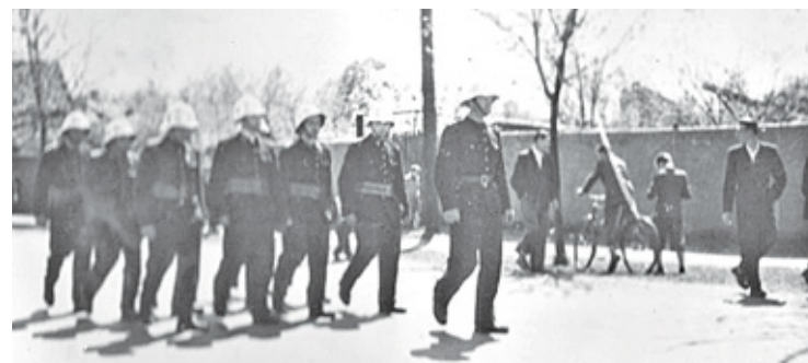
OSP Piaseczno oddział strażaków przy ul. Zgoda