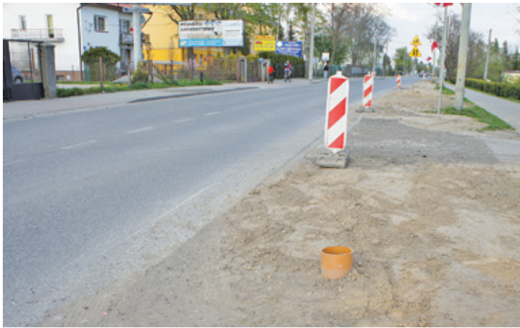
Zgodnie z umową remont zakończy się w połowie października

Rozpoczęty w marcu remont ul. Chyliczkowskiej do tej pory przynosił pewne utrudnienia – głównie pieszym. Po weekendzie sytuacja zmieniła się diametralnie. Biorąc pod uwagę, że zamknięty jest już odcinek ul. Puławskiej i fragment ul. Kościuszki, należy spodziewać się ogromnych utrudnień na miejskich drogach.