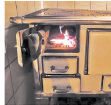
W Warszawie zakaz palenia węglem będzie obowiązywał od 1 października 2023 r.

W przygotowanej propozycji znalazł się zakaz spalania węgla na terenie Warszawy. Ma on zacząć obowiązywać od 1 października 2023 roku. Taki przepis, od 1 stycznia 2028 zostanie wprowadzony także w powiatach grodziskim, legionowskim, mińskim, nowodworskim, piaseczyńskim, pruszkowskim, otwockim, warszawskim zachodnim i wołomińskim. W uchwale zapisano również zakaz instalowania