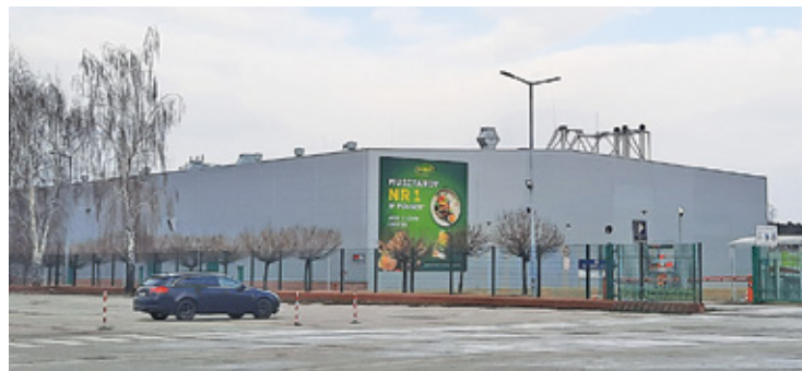
Inwestor dostał zielone światło dla zwiększonej produkcji w fabryce w Stefanowie

– Zgodnie z oczekiwaniami mieszkańców, inwestor zobowiązał się zrealizować przedsięwzięcie polegające na wykonaniu ekranów akustycznych wzdłuż wschodniej granicy terenu zabudowanego budynkami fabryki McCormick – napisała.