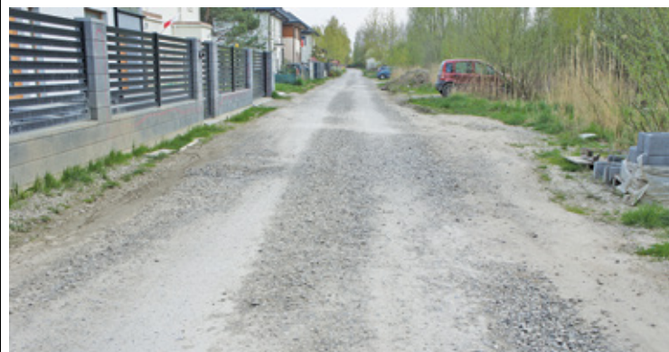
Zamiast nowej drogi mieszkańcy woleliby poprawę jakości nawierzchni na istniejących drogach