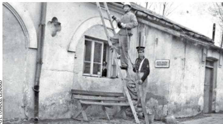
Strażacy przed remizą OSP w Piasecznie