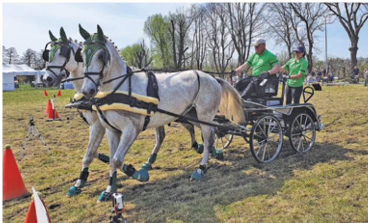
Właściciele maskotki zawodów, psa Kaliego na swoim okazałym zaprzęgu