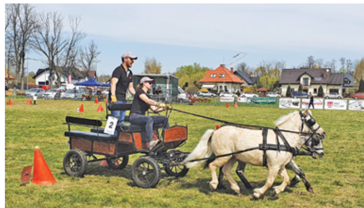
W zawodach brały także udział zaprzęgi kucyków