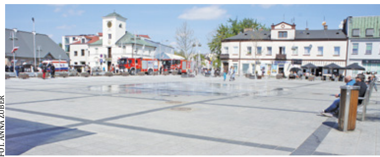
Od kilkunastu lat na piaseczyńskim rynku dominuje beton

zieleni do przestrzeni publicznej. Koncepcję zazieleniania rynku, który został przebudowany wcale nie tak dawno, bo w 2010 r., wykonuje właśnie Piaseczno. Urząd Miasta i Gminy pracuje nad