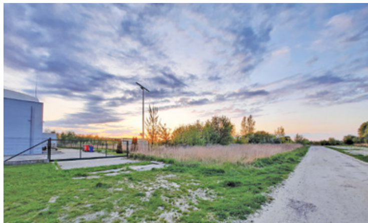
Licząca 0,8 ha działka sąsiaduje z terenem szkoły w Mysiadle

P odczas ostatniej sesji rada gminy Lesznówola podjęła decyzję o sprzedaży kolejnej nieruchomości z terenu KPGO Mysiadło. Chodzi o liczącą zaledwie 0,8 ha działkę nr 1/281, sąsiadującą z kortami i szkołą. Nieruchomość ta nie ma żadnych obciążeń hipotecznych i ma zostać sprzedana w drodze przetargu ustnego nieograniczonego. W uzasadnieniu decyzji o sprzedaży kolejnej gminnej nieruchomości czytamy o potrzebie pozyskania środków finansowych do budżetu gminy na rok 2022, w celu realizacji między innymi nowych zadań inwestycyjnych. Na tej samej sesji radni podjęli też uchwałę, w której zgodzili się na złożenie przez wójta gminy oświadczenia w akcie notarialnym o dobrowolnym poddaniu się przez gminę Lesznówola egzekucji do kwoty 13,97 mln zł. Ma to związek z koniecznością zwrotu spółce SENA Spółka z o.o. z siedzibą w Jabłonowie, kwoty zapłaconej w 2014