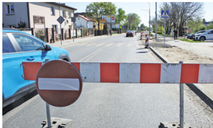
Na ul. Chyliczkowskiej prace drogowe rozkręcają się, co wpływa na sytuację na innych ulicach miasta

Kierowcom puszczają nerwy, co chwilę słychać dźwięk klaksonów. Nie-