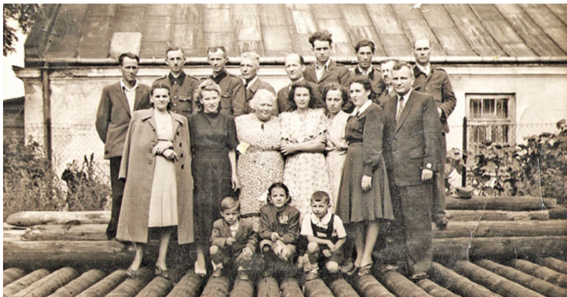
Pracownicy poczty w Piasecznie, zdjęcie z lat przełomu 40. i 50., zrobione na tyłach budynku poczty przy ul. Kościuszki

Niewątpliwą atrakcją było sąsiedztwo pracowni fotografa Renau. Samo robienie zdjęcia przez pana Renau seniora to było misterium – najpierw trzeba było być ustawionym, to trwało długo, bo fotograf sprawdzał ułożenie każdego szczegółu ubrania, potem kazał odpowiednio wysunąć brodę i zwilżyć językiem usta, na koniec podchodził do aparatu, ustawiał go, podnosił do góry rękę i wołał – Tu leci ptaszek, tu leci ptaszek! I trzeba było patrzeć w to miejsce. Pan Renau wywoływał też klisze z wakacji i uroczystości rodzinnych. Zdjęcia zawsze wychodziły znakomicie, wszyscy byli zadowoleni, nie to co teraz. Co zdjęcie do dowodu to