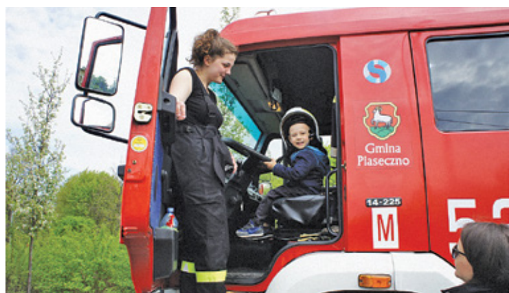
Podczas pikniku chętni mogli usiąść za sterami wozów strażackich