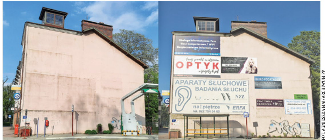
Odkąd przepisy uchwały krajobrazowej zaczęły obowiązywać, wygląd niektórych przestrzeni znacząco się zmienił

Na początku marca przewodnicząca RM zwróciła się do Komitetu w sprawie konieczności uzupełnienia braków formalnych (ich nieuzupełnienie w ciągu 14 dni skutkuje nieprzy-