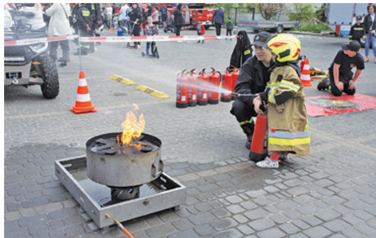
Dzieci chętnie gasiły pozorowany pożar, nierzadko oblewając przy tym widownię

W Piasecznie mieści się Komenda Powiatowa Państwowej Straży Pożar-