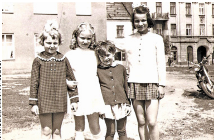
Dziewczeta stoją na podwórku domu przy ul. Sienkiewicza. Lata 60.

zrobić sobie ślubną fotografię. Jak się skończył spektakl u fotografa, to trzeba było pobiec do cukierni Bińkowskich.