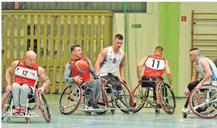
Koszykarze IKS GTM Konstancin walczą o finał rozgrywek

Pod koniec kwietnia koszykarze drużyny IKS GTM Konstancin rozegrali ostatni mecz rundy zasadniczej Polskiej Ligi Koszykówki na Wózkach. Ich przeciwnikiem był zespół Górnik Toyota Wałbrzych. W tym zaległym spotkaniu ligowym to rywale okazali się lepsi, wygrywając