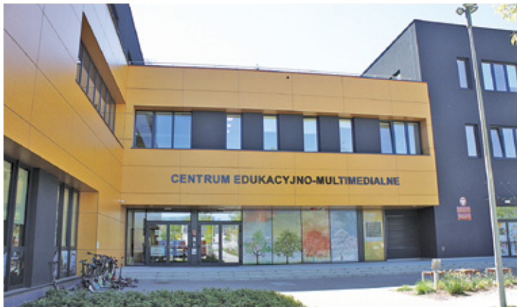
Prokuratura, policja i rzecznik dyscyplinarny dla nauczycieli wyjaśniają, co wydarzyło się w szkole przy ul. Jana Pawła II 55

Prokuratura wyjaśnia, czy w Zespole Szkolno-Przedszkolnym w Piasecznie przy ul. Jana Pawła II 55 doszło do naruszenia nietykalności cielesnej ze strony nauczyciela. Niepokojące zachowania zgłosiło kilkanaście uczennic placówki. Zdaniem jednego z rodziców, dyrekcja szkoły nie zareagowała adekwatnie do gwałtu.