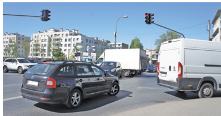
Chaos na skrzyżowaniu ul. Jana Pawła II z ul. Wojska Polskiego

stety wielu z nich łamie przepisy. Na jednokierunkowej ul. Sierakowskiego samochody omijają korek ścieżką rowerową. Tu wykorzystują ją nawet do cofania przez kilkadziesiąt metrów do skrzyżowania z ul. Nadarzyńską, nie zwracając przy tym uwagi na innych użytkowników drogi.