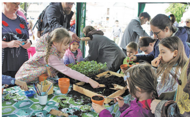
Dużym zainteresowaniem cieszyły się warsztaty ekologiczne

w przyrodzie, a chętni mogli wziąć udział w doświadczeniach w zakresie filtrowania, oczyszczania i uzdatniania wody. Ponadto można było się dowiedzieć, jak oszczędzać wodę na co dzień. Było też koło fortuny z nagrodami oraz drobne upominki. Z kolei urząd gminy przeprowadził warsztaty „Myśl globalnie i segreguj lokalnie”.