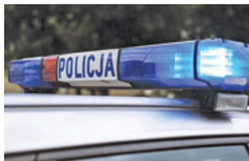
Ubezpieczyciele dostaną dane o mandatach. Pędzisz na drodze – płacisz więcej

System ma jednak duże braki. Wiele osób na co dzień prowadzi pojazdy służbowe. Nie są one ubezpieczone przez kierujące nimi osoby, ale przez firmę. W takiej sytuacji system nie zadziała. Podobnie będzie w przypadku zarejestrowania pojazdu na członka rodziny. W praktyce często robią tak młodzi kierowcy, którzy chcą w ten sposób uniknąć wysokich stawek OC.