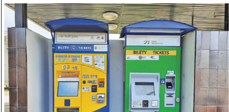
Bilety długookresowe ze zniżką będzie można już zakodować w biletomatach

Bilet Metropolitalny jest ofertą skierowaną do osób mieszkających w gminach, które podpisały z warszawskim ZTM odpowiednie porozumienia o współfinansowaniu kosztów przejazdu mieszkańców. Na podstawie stosownego porozumienia i zasad ustalonych w danej gminie (czyli najczęściej dzięki Kartce Mieszkańca, którą można zdobyć płacąc podatki w miejscu swojego zamieszkania), mieszkańcy płacą mniej za bilety długookresowe ZTM, a różnicę w ich cenie samorząd pokrywa z własnego budżetu. Przykładowo w Piasecznie, posiadacze Piaseczyńskiej Karty Mieszkańca płacą 120 zł w przy-