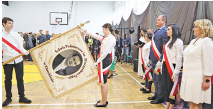
Podczas uroczystości zaprezentowano sztandar szkoły