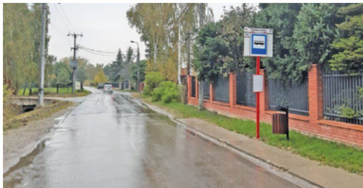
Najwięcej kontrowersji od lat budził pomysł poszerzenia ulicy Kołobrzeskiej do 12 metrów

Większość terenu objętego planem przeznaczona jest pod niezbyt intensywną zabudowę mieszkaniową – jednorodzinna wolnostojąca lub bliźniacza. Nowo wydzielane działki nie mogą być mniejsze niż 1500, 1600 i 2000 m 2 , a wysokość zabudowy wynosi w najmniej restrykcyjnym obsza-