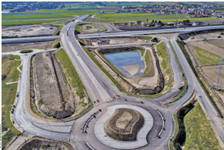
Na razie jedyne istniejące elementy 721 bis, to te wybudowane przez GDDKiA przy okazji budowy trasy S7

– Przed nami jeszcze parę spotkań, ale widać, że wszystkim z zebranych zależy na budowie tej drogi – komentował. Wcześniej pisał, że wniosek o ZRID powinien być składany na przełomie 2021/2022, a szacowany początek budowy drogi powinien nastąpić w połowie 2023 r. Dwupasmówka miałyby być gotowa w 2025 roku. Czyli de