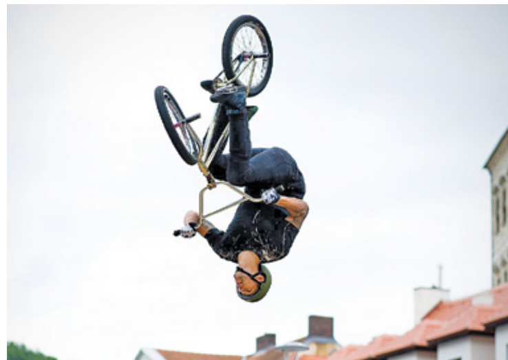
Z toru rowerowego będą mogli korzystać dzieci, młodzież, wszyscy miłośnicy rowerów

Pumptrack to tor pełen muld i zakrętów do zbiorowej rekreacji na rowerach, zarówno dla profesjonalistów, jak i miłośników dwóch kółek, w tym całych rodzin. Na jego budowę, w ra-