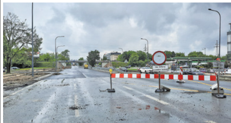
GDDKiA w tej chwili nie chce podawać terminu zakończenia prac

– Należy zaznaczyć, że laboratorium GDDKiA przed ułożeniem nawierzchni wykona badania sprawdzające parametry mieszanki nawierzchni. Jeśli będą się mieściły w normie, wykonawca będzie mógł przystąpić do dalszej realizacji prac. Ponadto musi jeszcze wykonać oznakowanie pionowe. Na koniec odbędą się odbiory i po ich pozytywnym zakończeniu będzie można przebudowany odcinek w pełni