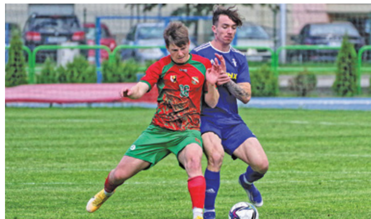
MKS Piaseczno wywalczył baraże w III lidze