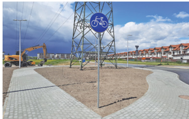
Ścieżka rowerowa wokół słupa budzi dużo „radości” wśród mieszkańców

Mieszkańcom trudno zrozumieć, że projektując rondo gmina zatroszczy-