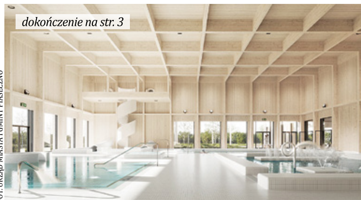
Wizualizacja planowanego basenu w Piasecznie przy ul. Chyliczkowskiej