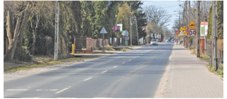
Przetarg na przebudowę ulicy Krasickiego planowany jest jesienią br.

W pierwszej kolejności powiat zamierza bowiem przebudować kolejny fragment ul. Postępu, która będzie musiała już za kilka miesięcy przyjąć ruch z węzła Lesznówola na trasie S7. Wprawdzie starosta deklaruje utrzymanie przejeźdźności drogi, a zwłaszcza zaplanowanego do wybudowania u zbiegu Krasickiego i Postępu ronda, jednak bez wątpliwości prace drogowe w tym rejonie spowodują spore utrudnienia drogowe. Tymczasem dla wielu mieszkańców Nowej Iwicznej, Zgorzały czy Nowej Woli, ulica Krasickiego jest to główna droga w kierunku Warszawy. W sytuacji, kiedy równocześnie trwałaby