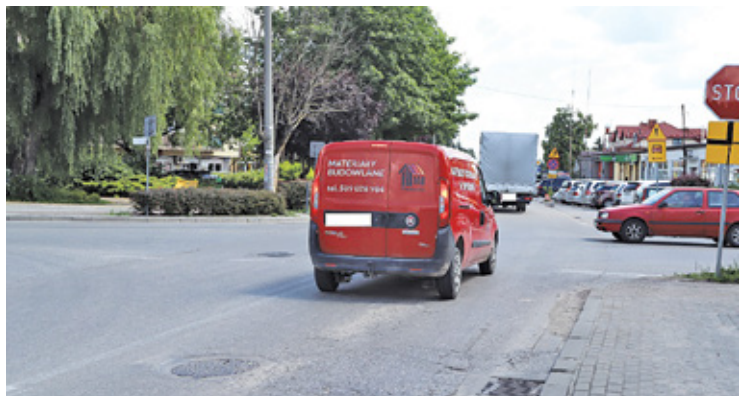
Rondo u zbiegu ulic 1 Maja, Komornickiej oraz Grójeckiej powinno uspokoić i udroźnić ruch

W środę, 3 sierpnia około godz. 7 na skrzyżowaniu w centrum miasta doszło do kolizji. Do zdarzenia doprowadził 38-letni kierowca forda pick-up'a, który nie ustąpił pierwszeństwa prawidłowo jadącej toyocie, kierowanej przez 50-latkę.