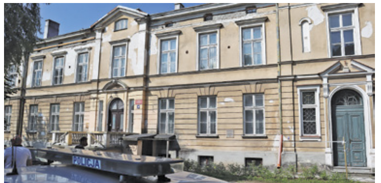
Pałac został wyłączony z użytkowania przez PINB w 2019 roku

N a mocy postanowienia sądu, który zdecydował o wprowadzeniu powiatu piaseczyńskiego w zarząd nieruchomością, komornik zażądał od stowarzyszenia Wychowanek Szkoły