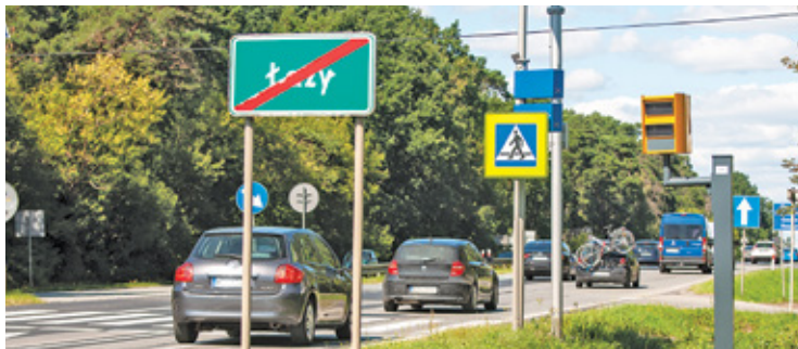
Fotoradar w rejonie przejścia na skrzyżowaniu al. Krakowskiej i ul. Podleśnej stanął jesienią 2021 roku

W pierwszej połowie 2022 roku fotoradary pracujące w systemie CANARD zarejestrowały ponad pół miliona przypadków przekroczenia dozwolonej prędkości. Ten w Łazach... żadnego, bo wciąż nie działa.