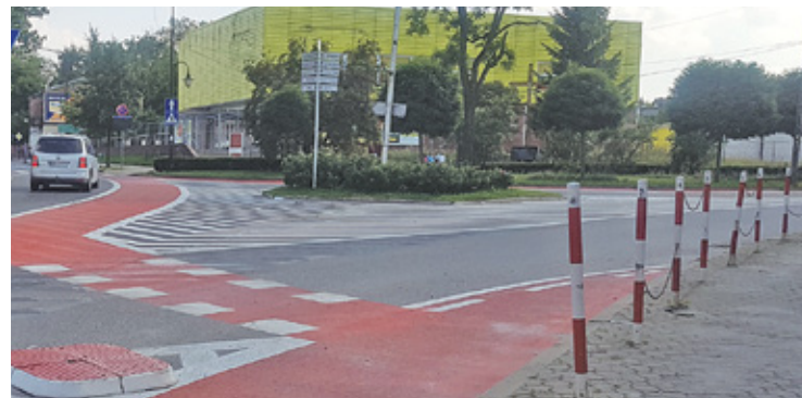
Droga rowerowa tuż po oddaniu do użytku

Najwięcej kontrowersji po wybudowaniu nowego pasa rowerowego w Piasecznie wzbudza przejazd dla cyklistów na rozwidleniu ul. Kościuszki i Sienkiewicza, gdyż przecina on drogę samochodom. W tej części miasta samochody obowiązują ograniczenie prędkości do 50 km/h. Kierowcy, przed przejechaniem przez niego, mają obowiązek ustąpić pierwszeństwa przejazdu rowerzystom, poruszającym się ul. Kościuszki w stronę ul. Wschodniej. Co z tym związane, kierujący muszą zmniejszyć prędkość, a gdy zachodzi konieczność prze-