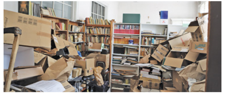
Biblioteka w szkole, która od kilku lat nie może prowadzić nauczania w niszczącym budynku

w celu dokonania analizy jego stanu technicznego. Chcemy sprawdzić stan ścian, przegród, drzwi, okien i wówczas podejmiemy decyzję o kompleksowym remoncie obiektu. Szacujemy, że koszty