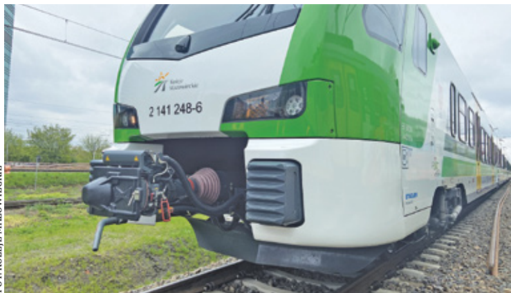
Pociągi Flirt to pojazdy lekkie i energooszczędne