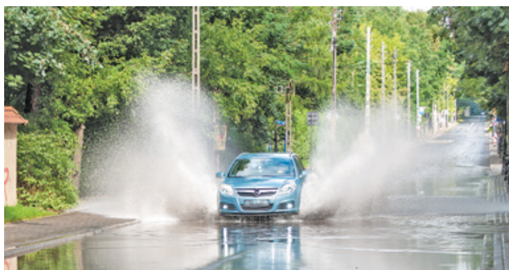
Na razie przejazd czy przejście ulicą Długą po deszczu nadal jest wyzwaniem

mimo, że nie było gigantycznej ulewy, a deszcz padał zaledwie kilka godzin. W mediach społecznościowych błyskawicznie pojawiły się filmiki i fala krytyki. Zdaniem mieszkańców, zaledwie kilka dni wcześniej zakończyła się przecież inwestycja, polegająca na modernizacji kłopotliwego odcinka po-