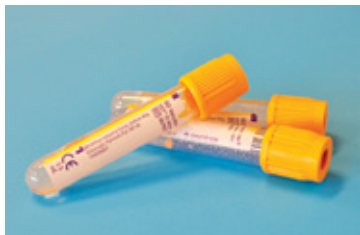
Laboratorium przyjmuje jedynie mocz w specjalnej próbkówce

– Uwielbiam komedie Stanisława Barei, ale nie przypuszczałem, że sceny rodem z „Misia” będę musiał odegrać samemu, na czczo, w sobotę rano – mówi rozbawiony pacjent z Piaseczna.