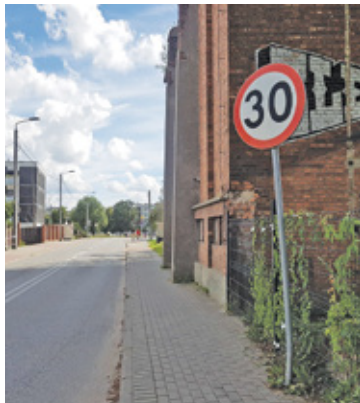
Ograniczenie prędkości do 30 km/h obowiązuje już w niektórych częściach Piaseczna

Za przekroczenie dopuszczalnej prędkości o 10 km/h grozi mandat