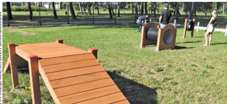
Wybieg dla psów w Górze Kalwarii otwarto pod koniec lipca