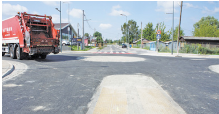
Prace na skrzyżowaniu ul. Dworcowej i Nadarzyńskiej dobiegają końca

Inwestycja dziwi niektórych mieszkańców, gdyż ul. Dworcowa przeszła gruntowny remont kilka lat temu. Mia-