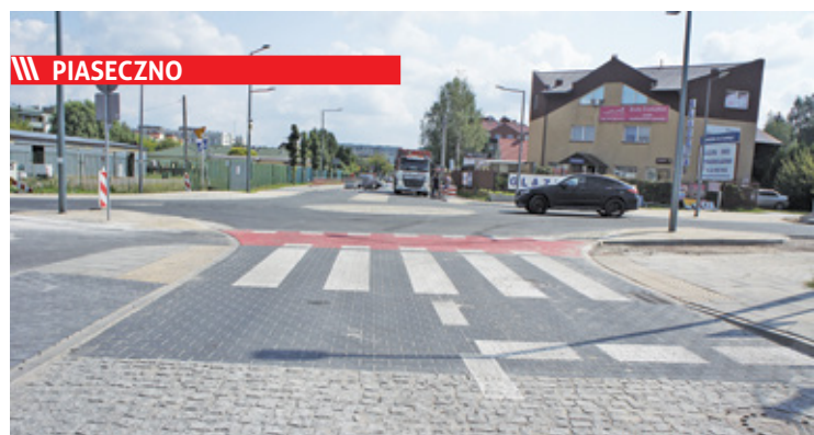
U zbiegu ul. Dworcowej i Nadarzyńskiej regularnie dochodziło do stłuczek i wypadków