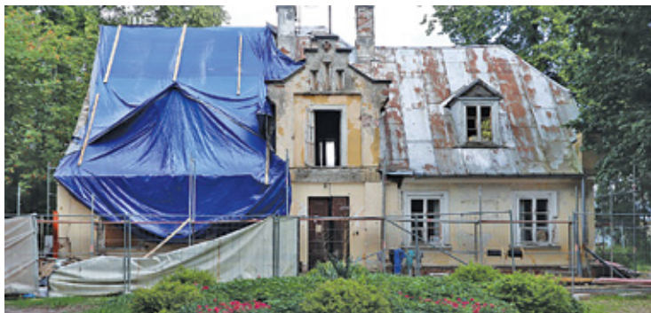
Obecnie istniejący budynek wybudowany został w stylu romantycznym prawdopodobnie na początku XIX wieku

Rewitalizacja „Poniatówki” musi być prowadzona według wytycznych Mazowieckiego Wojewódzkiego Konserwatora Zabytków. Wśród nich jest zachowanie w maksymalnym stopniu istniejących elementów budynku, a tak-