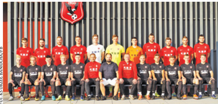
Orzeł Baniocza pokonał wysoko Mazovię Mińsk Mazowiecki