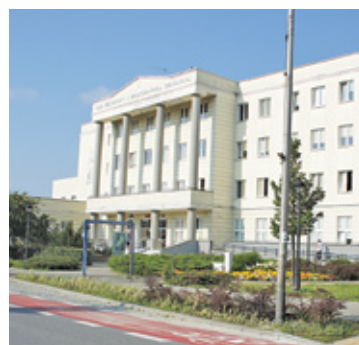
Sąd Rejonowy w Piasecznie

Wolne tempo rozpatrywania wniosków to problem dla kupujących oraz deweloperów, ale dotyczy on wielu sądów w kraju. Nabycie nieruchomości