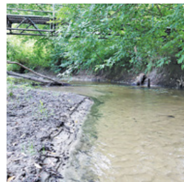
Poziom wody na Jeziorce przy ulicy Świętojańskiej może niepokoić

Projekt zakłada też budowę małych i dużych zbiorników retencyjnych, odtwarzanie terenów podmokłych, zalesienia, tworzenie niebiesko-zielonej infrastruktury w miastach. Już 11