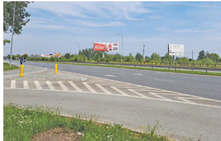
Nowy park handlowy miałby powstać między Selgrosem, Obi i Budokruszem przy ul. Puławskiej

Informacja o planach budowy parku handlowego na działce między Selgrosem i Obi, a Budokruszem