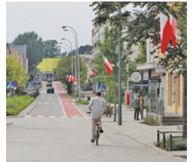
Żółty budynek jest dominującym punktem w głównej osi miasta

– Celem prac remontowych jest podniesienie komfortu zakupów oraz dostosowanie placówki do standardu 3.0, obowiązującego w sieci Biedronka – poinformowało nas biuro prasowe Jeronimo Martins. – Oznacza to ekologiczne rozwiązania wewnątrz sklepu, wyeksponowane strefy promocji, kwiatów oraz przejrzyste ustawienie wysp na owoce i warzywa. Nowoczesny i przestronny wygląd placówka zyska dzięki zupełnie nowym systemom regałów i półek. Na miejscu można będzie kupić świeżo wypiekane pieczywo oraz produkty piekarnicze od lokalnych dostawców. Dla wygody klientów wprowadzony zostanie podział stanowisk na owocowe, warzywne oraz produkty delikatne, czyli wymagające przechowywania w niskiej temperaturze. Placówka posiadać będzie także ladę mięsna, przy której klienci kupią swoje ulubione wędliny, mięsa i sery na wagę