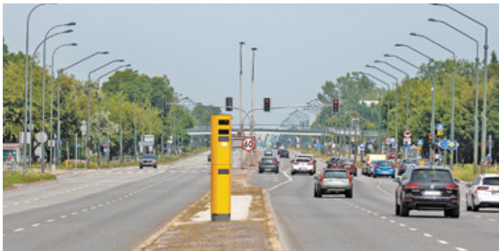
Urządzenie na Puławskiej jedynie „udaje” fotoradar

Urządzenie, które ma za zadanie mobilizować kierowców do zdjęcia nogi z gazu przy ul. Puławskiej, kawałek za granicą naszego powiatu, nie działa, odkąd zostało ulokowane w nowym miejscu – między ulicami Kuropatwy a Karczunkowską. Wcześniej fotoradar stał bliżej granicy, między