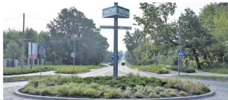
Tablice z nazwą pojawiły się w 102. rocznicę bitwy, w której wojska polskie pokonały Armię Czerwoną

O losach bitwy z 1920 roku, zwanej też bitwą na przedpolach Warszawy, przesądziły m.in. doskonała taktyka