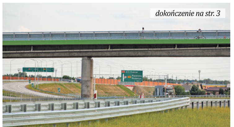
dokończenie na str. 3

C hoć budowa liczącego niespełna 30 km fragmentu trasy S7 między Grójcem a Warszawą napotkała po drodze sporo trudności, a termin najpierw rozpoczęcia, a potem planowanego zakończenia inwestycji był kilkakrotnie zmieniany, dwa z trzech odcinków są już gotowe. Od ubiegłego roku kierowcy korzystają z odcinka C – między obwodnicą Grójca a węzłem Tarczyn