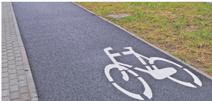
Aktywiści rowerowi mają nadzieję, że drogi dla rowerów zachęcą kolejne osoby do korzystania z tego środka transportu

Gmina ogłosiła przetarg na projekt budowy infrastruktury rowerowej w rejonie Szkoły Podstawowej nr 2. Bezpieczeństwo rowerzystów ma się poprawić również przy GOSiR-ze.