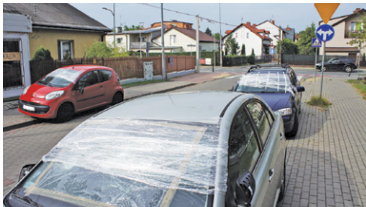
Sprawca uszkodzeń usłyszał już zarzut

❖ Konstancin-Jeziorna - Pierwszy krok do ścieżek s. 6