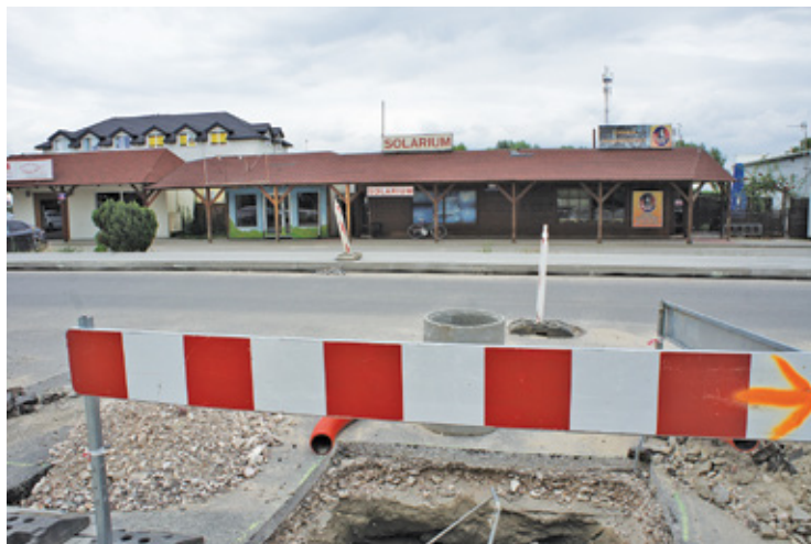
Mieszkańcy apelują o odwiedzanie wciąż trudno dostępnych lokali handlowych

W trudnej sytuacji znalazły się także m.in. lokale z ul. Słowiczej w Mysiadle. W mediach społecznościowych pojawiły się apele do mieszkańców, zachęcające ich do korzystania z usług lokalnych przedsiębiorstw. – Taki apel do sąsiadów: już jest wygodny dojazd asfaltem (od strony Józefosławia), ratujmy te biznesy, co jeszcze zostały [...].