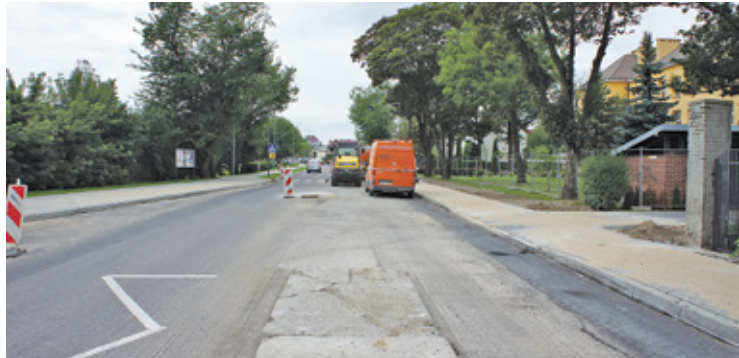
Starostwo zapewnia, że do końca sierpnia ulica będzie gotowa

azyłu dla pieszych pomiędzy szkołami, budowę nowych chodników, wyznaczenie dróg rowerowych. Dla kierowców ułatwieniem powinno być