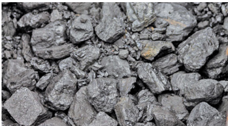
Dla gospodarstw, wykorzystujących węgiel do ogrzewania domów problemem jest nie tylko cena węgla, ale także jego dostępność

W ostatnim kroku musimy złożyć podpis pod oświadczeniem, że podane w formularzu dane są prawdziwe. Należy pamiętać, że informacje przedsta-