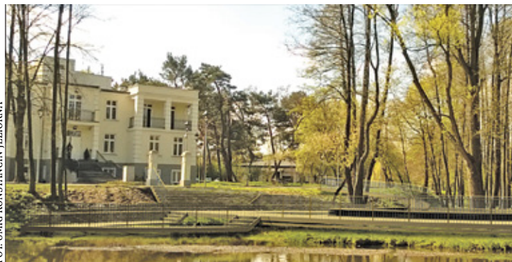
Zejsście na pomost ma prowadzić przez zachowane filary obok „Hugonówki”

Informacja o pozyskaniu przez KDK blisko 845 tysięcy zł dofinansowania na budowę pomostu nad Jeziorką, bardzo ucieszyła mieszkańców Konstancina. Na tę inwestycję czekają bowiem od co najmniej od kilku lat. Drewniana konstrukcja miała się po-