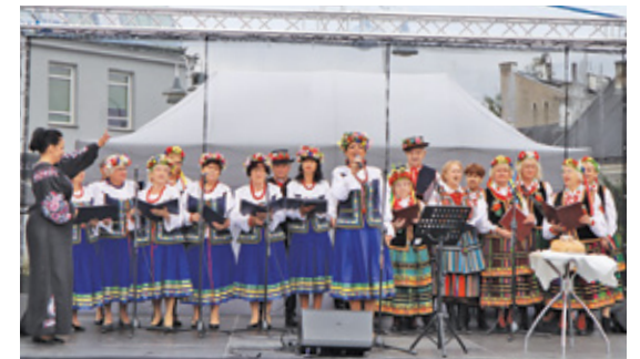
Liczne kramy rozstawione na rynku i wzdłuż głównej ulicy oferowały jedyne w swoim rodzaju rękodzieła. Na Skwerze Kisiela odbywały się pokazy tańców dawnych, a na scenie występy zespołów ludowych