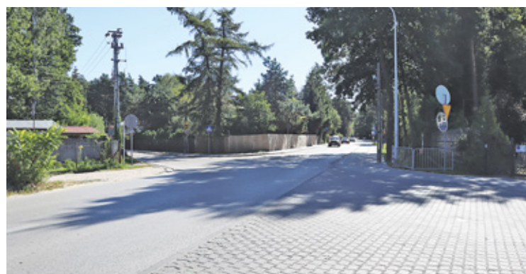
Ul. Droga Dzików to skomplikowane skrzyżowanie na zakręcie, na którym również dochodziło do poważnych zdarzeń drogowych