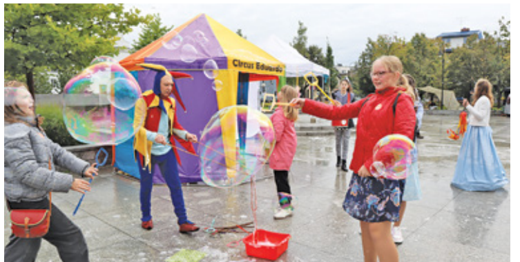
Podczas imprezy odbyły się zabawy i animacje dla dzieci

D oroczne jarmarki w Piaseczno to powrót do dawnych czasów i przywołanie tradycji organizowania w mieście wielkich targów – jarmarków.