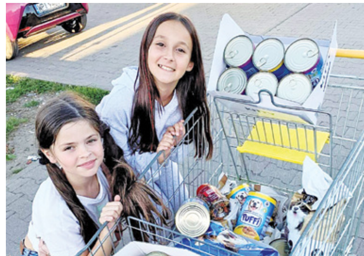
Dziewczynki, aby zakupić karmę dla zwierząt, sprzedawały w wakacje borówki oraz własnoręcznie robioną biżuterię

na wolontariuszkami w schronisku w Czaplunku i wzruszają się za każdym razem, kiedy tam są – napisał. – A wszystko to zaczęło się od własnoręcznie robionej biżuterii i borówek, które