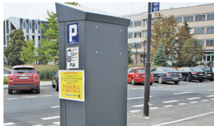
Strefa Płatnego Parkowania (SPP) uruchomiona została na przełomie 2017 i 2018 roku

– Po raz pierwszy od niepamiętnych czasów za każdym razem, gdy potrzebuję coś załatwić w centrum (na ul. Puławskiej), a jestem samochodem – mam gdzie zaparkować i nie tracę 20 minut na szukanie miejsca – to jeden z głosów poparcia dla systemu w mediach społecznościowych. Sporo jest jednak osób niezadowolonych z jego działania. – Idę do piekarni po chleb. Dłużej zajmie mi opłacenie postoi, niż same zakupy – denerwowała się