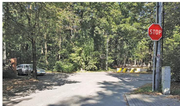
Ul. Jesionowa to jedyna droga wyjazdowa dla osiedla liczącego ok. 1000 mieszkańców

Poprawy bezpieczeństwa chcieliby też mieszkańcy Zalesia Górnego z drugiej strony torów oraz mieszkańcy Jesówki i Wólki Kozodawskiej. Skrzyżowanie ul. Pionierów z ul. Droga Dzików również nie należy do bezpiecznych, a jego geometria jest jeszcze bardziej skomplikowana. Tu także niejednokrotnie dochodziło do wypadków. – Ulica Pionierów jest drogą wojewódzką, niemniej gmina jeszcze w tym roku zleci opracowanie koncepcji poprawy bezpieczeństwa na skrzyżowaniach