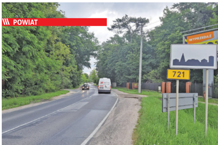
Po przebudowie droga ma być bezpieczniejsza i bardziej komfortowa

❖ Czaplinek - Wolontariuszki na medal s. 9