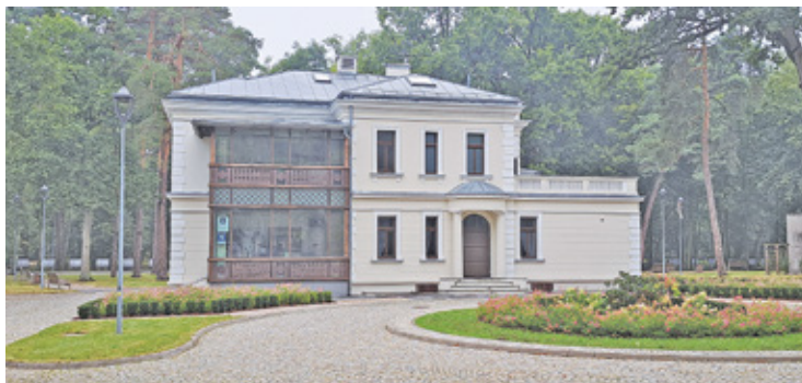
Modernizacja zabytkowej willi kosztowała 4,5 mln zł