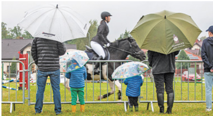
Mimo deszczu jeźdźcy mogli też liczyć na doping kibiców

Deszczowa pogoda nie odstraszyła młodych miłośników jazdy konnej. Większość zapisanych na kolejną edycję zawodów Mazowiecki Talent Jeździecki zawodników przyjechała w niedzielę 11 września do Tarczyna, aby sprawdzić się w rywalizacji z innymi jeźdźcami. W serii konkursów przed-sportowych dla zawodników w wieku od 6 do 15 lat organizatorzy umożliwiają udział w konkursach ujeżdżania,