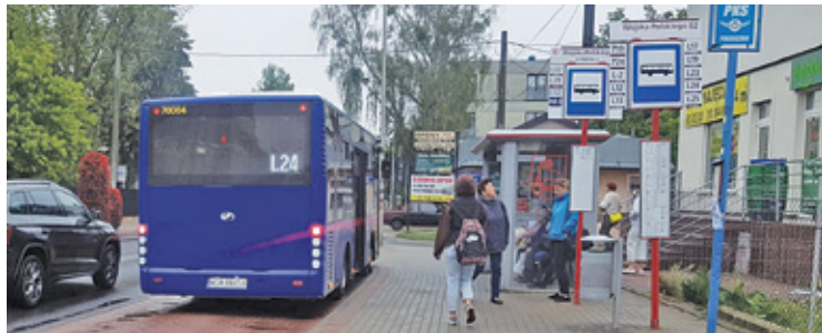
Ile autobusów w rzeczywistości wypadło z rozkładów jazdy, najlepiej wiedzą mieszkańcy

P roblemy z realizacją kursów, mimo wakacyjnych wciąż rozkładów jazdy, dotyczą głównie linii L-2 i L-12, dlatego gmina zaapelowała do Zarządu Transportu Miejskiego o ograniczenie kursów międzyszczytowych. To ma zapewnić transport w godzinach szczytu.