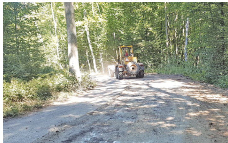
Gościńca Warecki jest nie tylko pięknym turystycznym szlakiem ze starodrzewem, ale także miejscem bytu chronionych gatunków zwierząt

W drugiej petycji jedna z mieszkanki przypominała, że w ten rejon gminy można dojechać przez Orzeszyn i apelowała do starosty o „zminimalizowanie