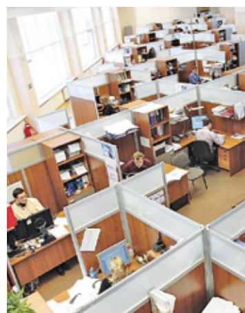
Nie ważne, czy jesteś pracownikiem biurowym, czy fizycznym – każdemu zatrudnionemu na umowę o pracę należy się odpoczynek

Jeśli mamy zaległy urlop za poprzedni rok, należy wykorzystać go do końca września kolejnego roku. Zatem jeśli zostały nam dni wolne z 2021 roku, musi pójść na urlop do 30 września bieżącego roku. Jeśli tego nie zrobimy, dni urlopowe nam nie przepadają. Zgodnie z prawem pracy roszczenia ze stosunku pracy ulegają