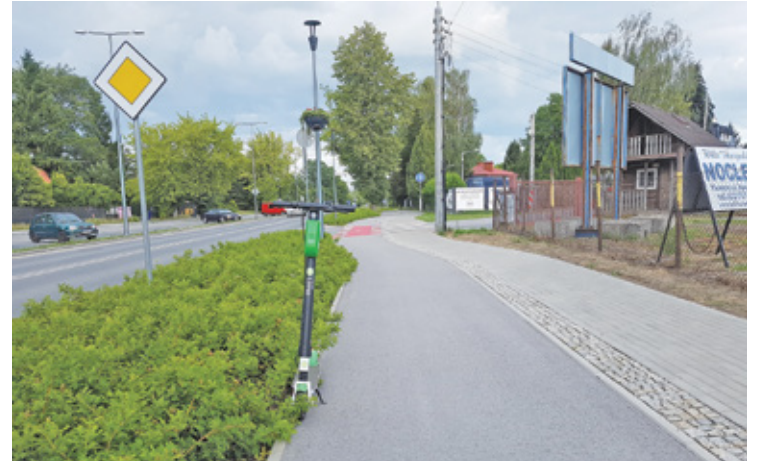
Za niewłaściwe zaparkowanie hulajnogi można dostać 500 zł mandatu