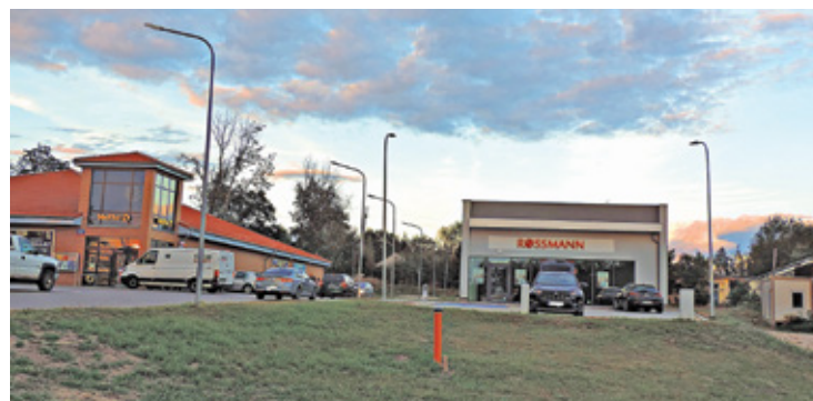
Widok miejsca, w którym stał pałac. Zdjęcie z 2022 r.