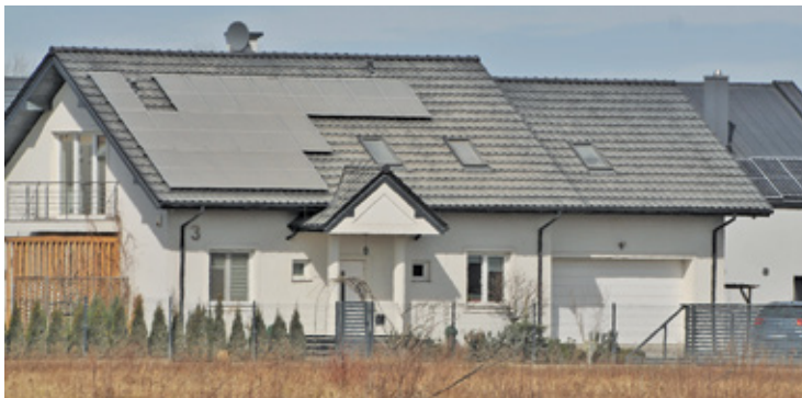
Zakurzone elewacje, okna czy panele fotowoltaiczne martwią mieszkańców mniej niż oddziaływanie pyłu na ich zdrowie

Na stan obu dróg mieszkańcy Zgorzały narzekają od lat, ale związane z nim uciążliwości dały się im szczególnie we znaki podczas budowy ronda. Poprowadzony Gogolińską i Kormoranów objazd sprawił, że ulicami tymi poruszało się znacznie więcej samochodów, a zwirowa nawierzchnia błyskawicznie się pogarszała. Mieszkańcy, sołtys, rada sołecka czy radni co jakiś czas interweniowali w gminie, prosząc o poprawę nawierzchni, czy wprowadzenie ograniczeń dla pojazdów ciężarowych, a następnie ich egzekwowanie. Prawdziwe apogeum nastąpiło jednak na wiosnę, kiedy ulice Gogolińska i Kormoranów zostały wysypane wyjątkowo pyłącym kruszywem. Unoszący się w powietrzu pył nie