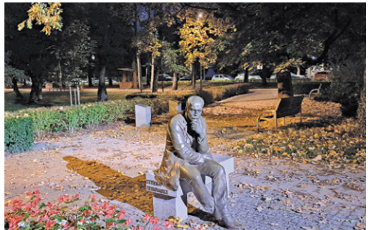
Latarnie w Parku Zdrojowym będą świecić tylko od zmierzchu do północy

Jeszcze kilka dni temu burmistrz Kazimierz Jańczuk informował radnych, że sytuacja finansowa gminy nie jest tak dramatyczna, jak próbują przedstawiać niektórzy mieszkańcy, ale w sytuacji wzrostów cen, trzeba będzie myśleć o szukaniu oszczędności. Zapytany podczas ostatniej sesji rady miejskiej o to, czy będą wprowadzane jakieś rozwiązania związane z oszczędzaniem energii, zapowiedział, że pomysły zostaną przedstawione w październiku. Tymczasem już 27 września na stronie internetowej gminy pojawiła się informacja o zamiarze wyłączenia oświetlenia ulicznego.