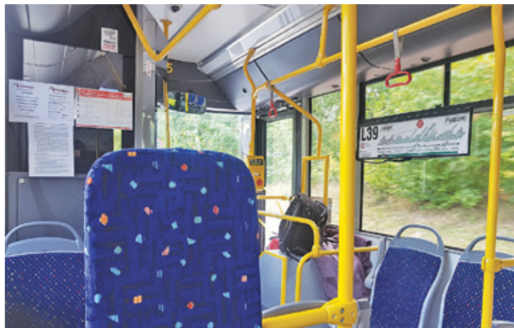
Autobusy jeździć będą co 40 minut w dni robocze

Z powodu niewystarczającej liczby kierowców, mieszkańcy borykają się z poważnymi utrudnieniami. Szczególnie dotkliwie jest dla nich jeżdżąca wciąż według wakacyjnego rozkładu linia L39, kursująca dotąd na trasie wiodącej od szpitala w Piasecznie,