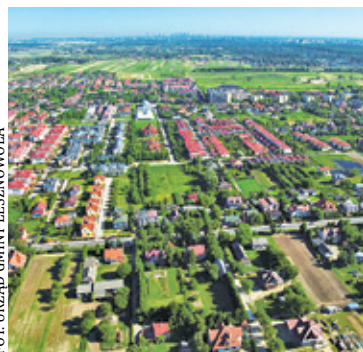
Lesznówolę wyróżnia również jej wielokulturowość – zamieszkują ją przedstawiciele aż 60 narodowości

Na koniec 2020 roku średni wiek mieszkańca gminy Lesznówola wynosił 35,2 lat i był znacznie niższy od średniego wieku dla Mazowsza i Polski. Liczba Mieszkańców gminy według kryterium produktywności na koniec 2021 roku przedstawiała się następująco: wiek przedprodukcyjny – 29,0% (8 248 osób), wiek produkcyjny – 58,3% (16 555 osób) oraz wiek poprodukcyjny – 12,7% (3 620 osób).