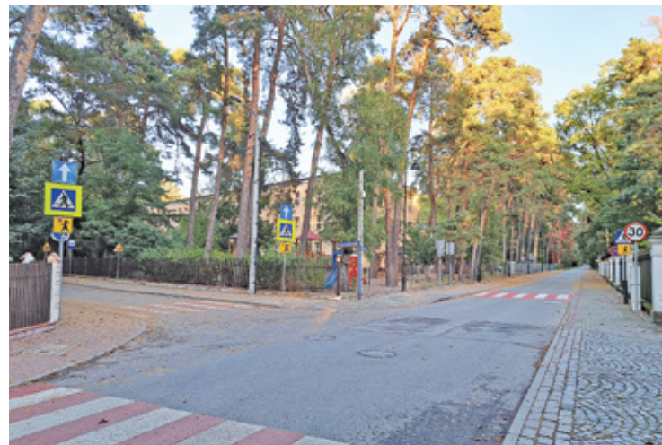
Drogi dla rowerów mają zostać wyznaczone w pierwszej kolejności w sąsiedztwie SP2 oraz GOSiR

Gmina ogłosiła niedawno dwa przetargi na projekt budowy infrastruktury rowerowej w rejonie dwóch szkół podstawowych – nr 2 przy ul. Żeromskiego oraz nr 3 przy ul. Bielawskiej. W przypadku „dwójki” chodzi o przebudowę lub rozbudowę ulic: Sobieskiego, Żeromskiego, Jagiellońskiej, Piasta i Batorego. Inwestycja ma