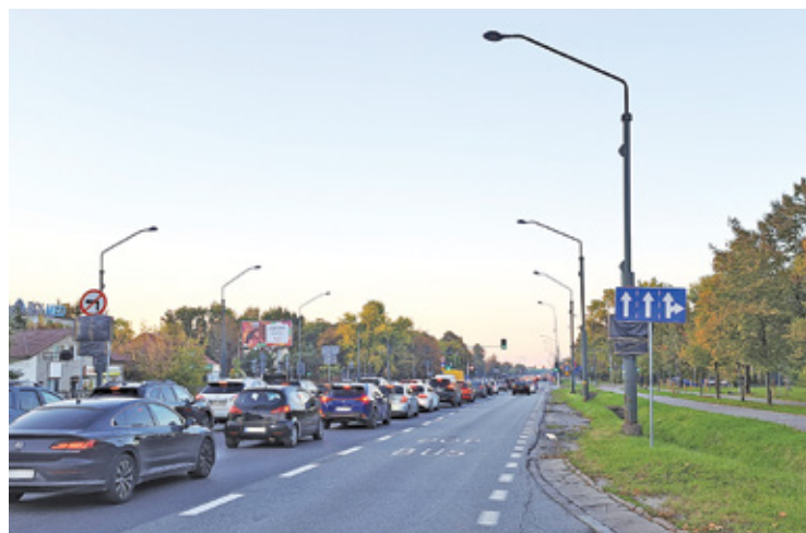
Buspas świeci pustkami, a samochody stoją w korku nawet wieczorami i w weekendy

– Jeździ nią 8 linii autobusowych (209, 709, 715, 727, 737, 739, 809, 815). W ciągu godziny w godzinach szczytu na przystankach zatrzymują się 24 autobusy, które codziennie przewożą niemal 140 tys. osób – pisał w sierpniu ZTM. Czy te dane są realne? Autobus przegubowy (a nie wszyst-