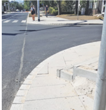
Schody wchodzące w chodnik na rogu ul. Chyliczkowskiej i Warszawskiej zlikwidowano, ale z przejścia i tak nie można korzystać