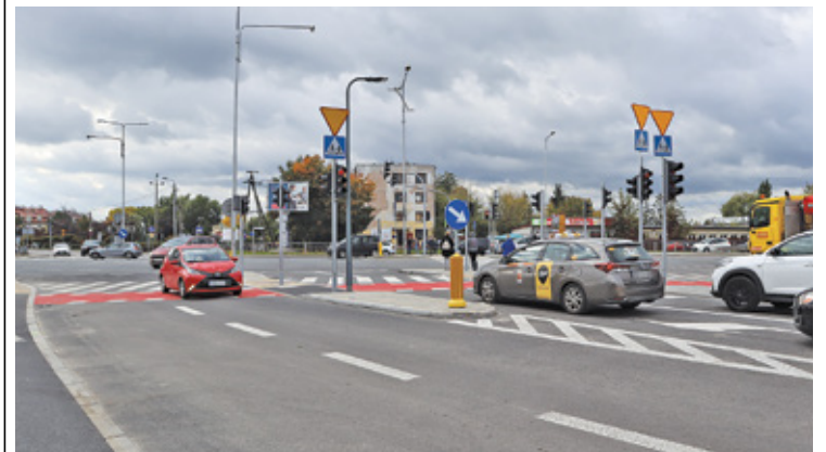
Ulica Geodetów jest w końcu przejezdna

739 pojazdów ulicami Geodetów, Wilanowską, Kameralną i Julianowską, do krańca przy Cmentarzu Komunalnym. Trasa L39 będzie wiodła ul. Energetyczną (kraniec przy ul. Rubinowej i zawrotka na rondzie przy Designer Outlet) i dalej przez Rondo Praw Kobiet ulicami Geodetów, Ogrodową, Cyraneczki, Wilanowską, Kameralną, Ju-