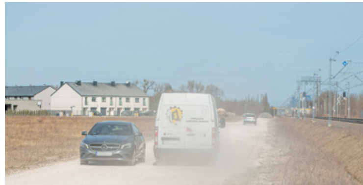
Sprawą pyłącego kruszywa zajmuje się WIOŚ oraz PINB

tylko osiadał na samochodach, dachach i elewacjach położonych w sąsiedztwie domów, ale wpadał również do wnętrza, powodując nie tylko zanieczyszczenie różnych powierzchni, ale też utrud-