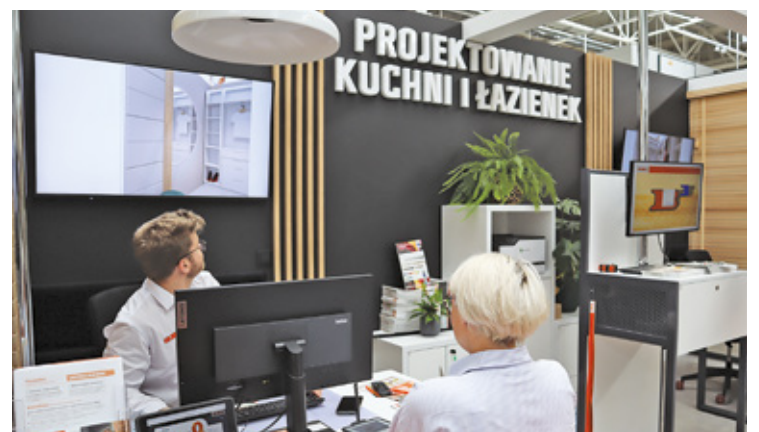
Punkt projektowania kuchni, łazienek i garderoby