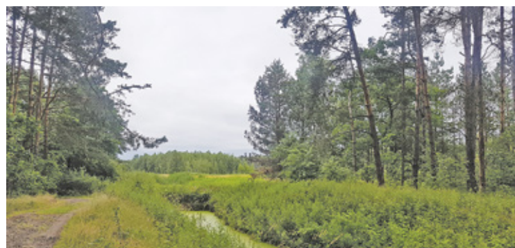
Współpraca z nadleśnictwem ma przyczynić się do zwiększenia efektów resocjalizacyjnych i readaptacyjnych skazanych

Nadleśnictwo Chojnów obejmuje teren aż sześciu powiatów. Oprócz wszystkich gmin powiatu piaseczyńskiego (Góra Kalwaria, Konstancin-Jeziorna, Lesznowola, Piaseczno, Prażmów, Tarczyn), są to także: powiat grodziski (gmina Grodzisk Mazowiecki, miasta: Milanówek, Podkowa Leśna),