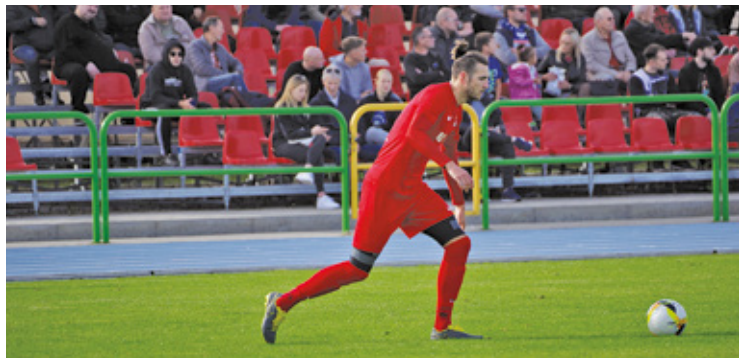
Piłkarze Orła Baniocha pokonali lidera

W sobotę 8 października rozegrana została 11. kolejka piłkarskiej IV ligi. Miniona seria gier była udana dla reprezentantów powiatu piaseczyńskiego, którzy sięgnęli po pełną pulę punktów.