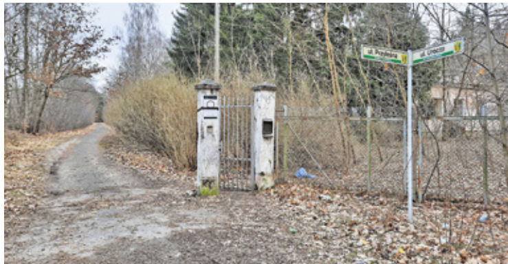
Obecnie teren planowanego ośrodka jest opuszczony i zaniedbany

Bliskie sąsiedztwo drogi krajowej i Warszawy to jeden z argumentów przemawiających na korzyść lokalizacji. Do azylu trafiałyby bowiem przede wszystkim zwierzęta pochodzące z przemytu. Przedstawiciele rządu podkreślają, że brak systemowych