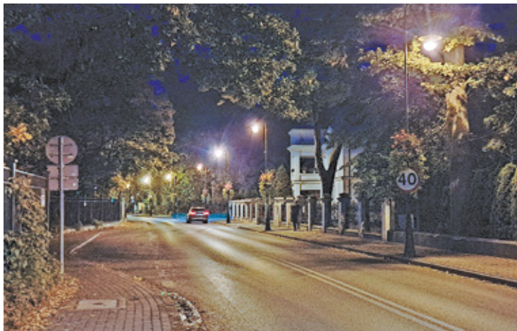
Co druga latarnia zgaśnie m.in. na ul. Piłsudskiego

Informacja o kolejnym etapie wdrażania „planu oszczędnościowego obejmującego czasowe ograniczenia w oświetleniu miejskich ulic” gmina poinformowała zaledwie tydzień później. Kolejna część miejsc będzie oświetlana krócej, w innych zapalana będzie tylko