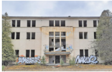
Istniejące budynki będą wymagały generalnego remontu lub wyburzenia

Sejm uchwalił ustawę w sprawie utworzenia Centralnego Azylu dla Zwierząt. Mimo protestów mieszkańców gminy i wystąpienia radnych, ma on działać na leśnym terenie w Warszawiance.