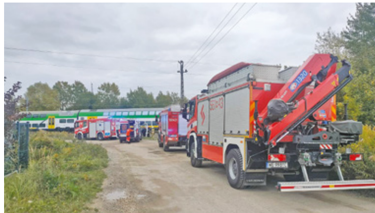
6 października pod przejeżdżającym pociągiem zginęła kobieta

T ragedia do jakiej doszło na torach kolejowych na odcinku między Zgorzałą a Mysiadłem w czwartek 6 października po raz kolejny przywołała temat utworzenia w tym miejscu bezpiecznego przejścia dla pieszych czy przejazdu dla rowerzystów. Ze względu na odległość i brak komfortowej drogi prowadzącej do Nowej Iwicznej czy Mysiadła ze Zgorzałą, wiele osób decyduje się na pokonywanie torów kolejowych na przedłużeniu ulicy Gra-