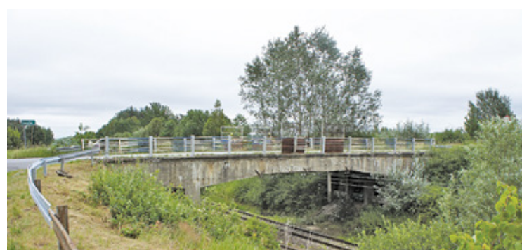
Wiadukt zostanie zamknięty w czwartek 13 października, a kilka dni później rozpocznie się jego wyburzanie

Wiadukt nad torami PKP prawdopodobnie pochodzi z lat 50., czyli z okresu budowy linii kolejowej Skierniewice – Łuków, a jego stan techniczny i wizualny pozostawia wiele do życzenia. Na jego remont, a właściwie budowę nowego obiektu, starostwo powiatowe uzyskało 2 mln dofinansowania z rezerwy subwencji ogólnej Ministerstwa Infrastruktury. Prace obejmą także rozbudowę fragmentów drogi powiatowej, a ich łączny koszt to blisko 4 mln zł.