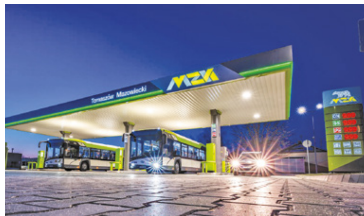
10 groszy tańsze paliwo za litr i bony na usługi – tym zachęca do korzystania z Samoobsługowej Stacji Paliw Miejski Zakład Komunikacyjny w Tomaszowie Mazowieckim