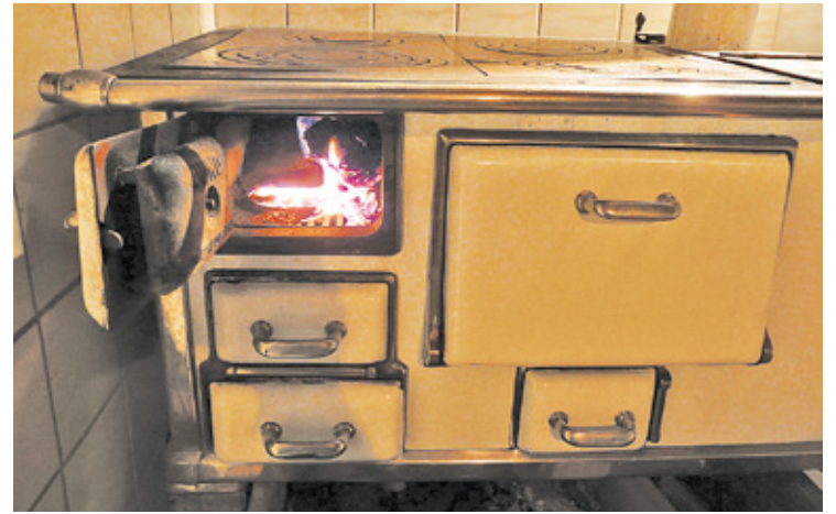
Niemal każdy system ogrzewania może emitować tlenek węgla

Czujnik czadu powinien być stosowany wszędzie tam, gdzie przebywają ludzie i są urządzenia grzewcze, takie jak różnego rodzaju piece, piecyki oraz przewody kominowe. Czujnik należy zamontować w pobliżu potencjalnego źródła emisji czadu, ale nie dalej niż 6 m od niego. Nie wolno stawiać