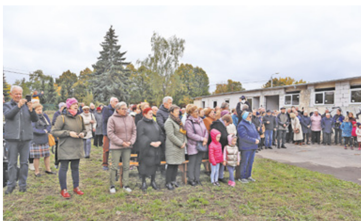
W uroczystości wzięło udział ok. 200 wiernych

Na pierwsze nabożeństwo w nowo tworzącej się wspólnocie parafialnej zaproszono księży i wiernych z okolicznych parafii. W uroczystości wzięło udział ok. 200 osób, a wydarzeniu przewodniczył kardynał Kazimierz Nycz, który poświęcił krzyż. Następnie