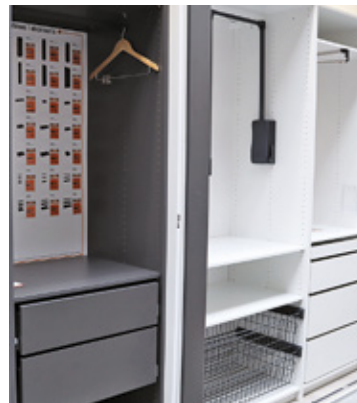
Przykładowa zabudowa szafy

Elementy można wypinać, przekładać, a w razie potrzeby dokupić w innym wymiarze, dopasowanym do naszych aktualnych potrzeb. Każdy moduł wykonany w systemie elementów wytrzyma obciążenie do 200 kg.