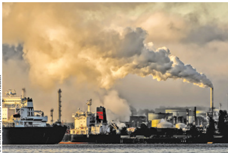
Na razie, mieszkańcy gminy Góra Kalwaria i Piaseczno nie skarżą się na brak węgla