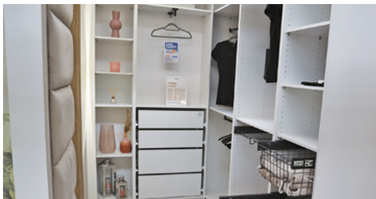
Przykładowa zabudowa garderoby

Dla maksymalnego skrócenia czasu obsługi zlecenia umów się z naszymi specjalistami, dzwoniąc pod numer tel.: +48 800 624 624 lub za pośrednictwem strony internetowej www.obl.pl .