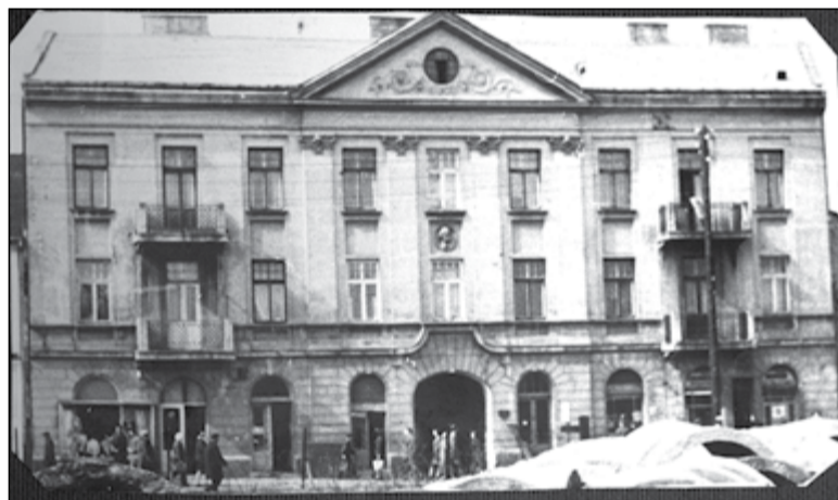
Kamienica Rowińskich lata 70. XX wieku

napisz do autorki m.szturowska@przegladpiaseczynski.pl