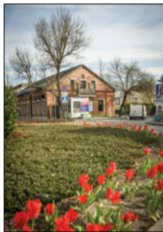
Kwitnące Piaseczno w obiektywie Przemka Peaka