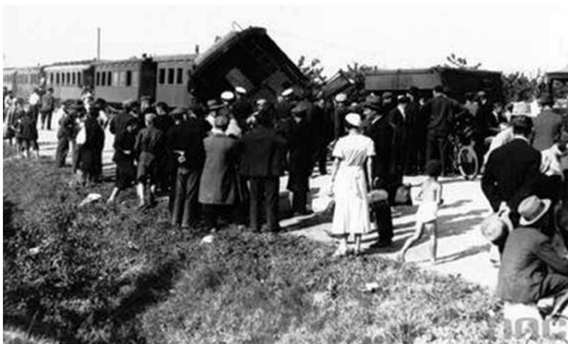
Wykolejony wagon linii grójeckiej. Czas międzywojenny XX w.

W Pyrach był rozjazd, mijanka, ale okazało się, że pociąg, który wyruszył z Góry Kalwarii, blokuje szyny