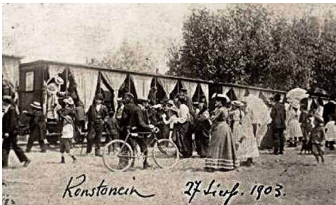
Wagony letnie kolejki wilanowskiej – rok 1903