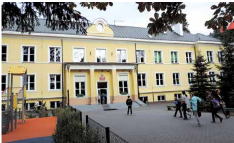
szkoła nr 2 w Zalesiu Dolnym

Skąd ten boom, skąd te rosnące potrzeby? Gołym okiem widać, że