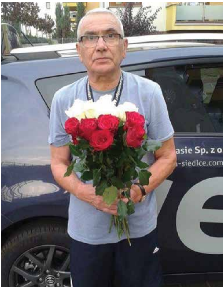
FOT. TEODOR MOLLOV