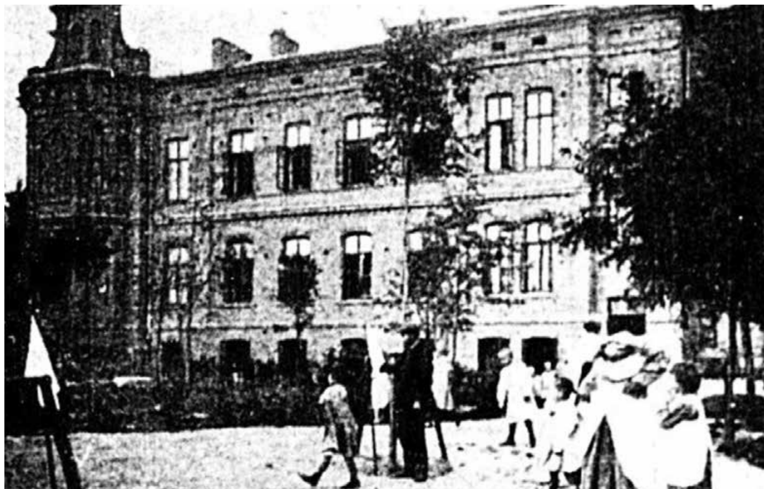
Piaseczno, schronisko św. Małgorzaty

Warszawski dom schronienia św. Małgorzaty