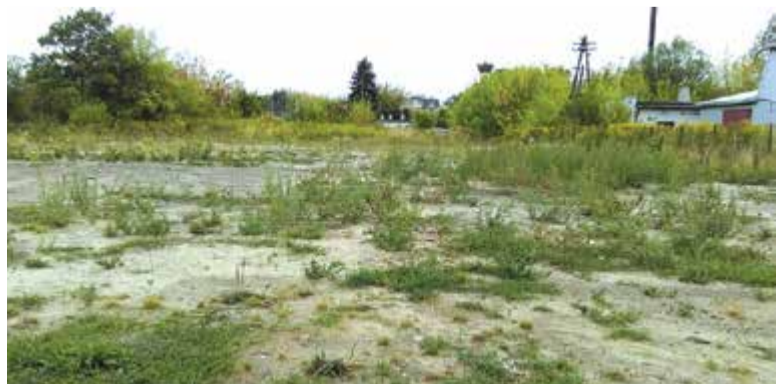
Tu na razie jest ściernisko... A w przyszłości ma powstać nowoczesne centrum edukacji multimedialnej