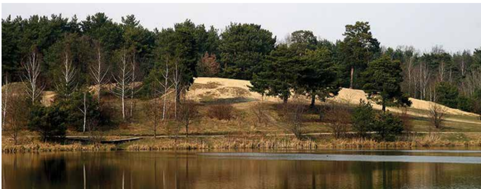
Górki Szymona