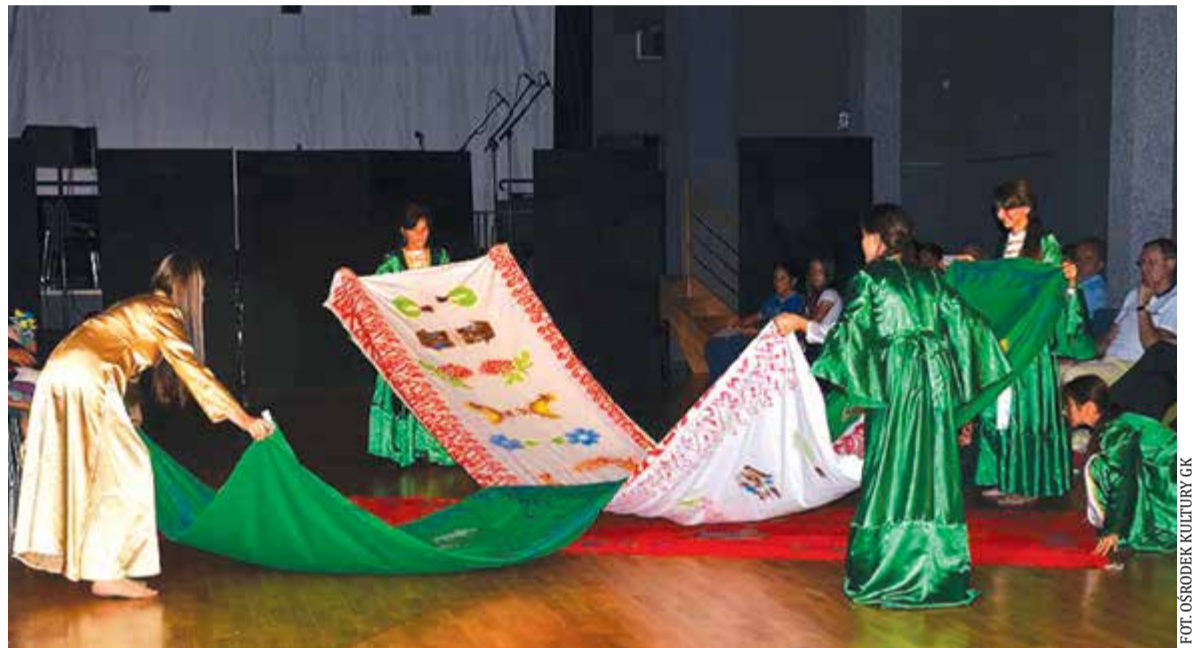
Spektakl „Losy wędrowek” zagrany przez młodzież – mieszkańców Linina podczas Dnia Różnorodności Kulturowej w Górze Kalwarii