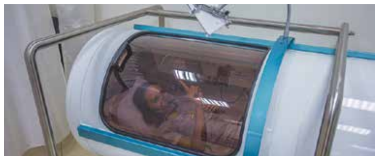
Seans w komorze hiperbarycznej w CRH ATAméd w Warszawie

cywilizacyjnych ponieważ oferują jedną z najskuteczniejszych obecnie form terapii. Korzystne efekty działania terapii są odczuwalne już po 10 sesjach!