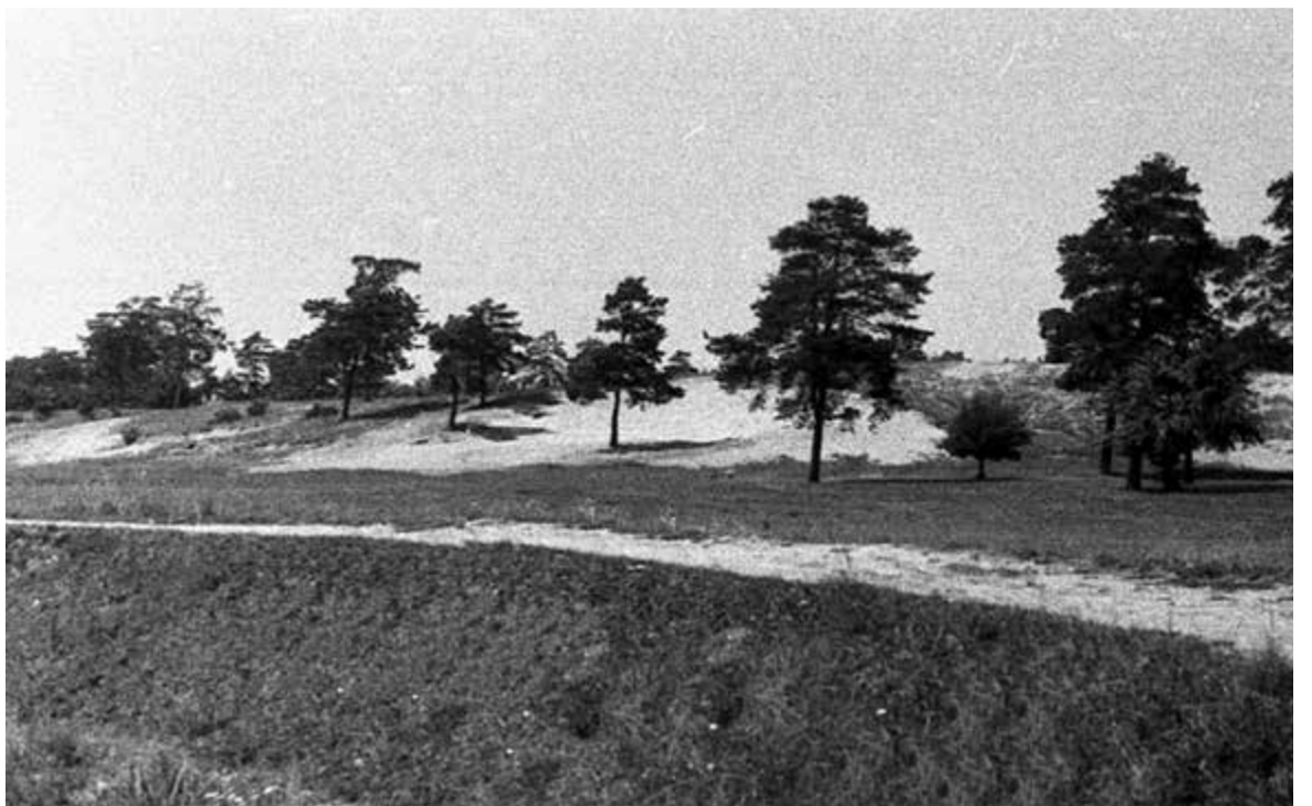
Górki Szymona