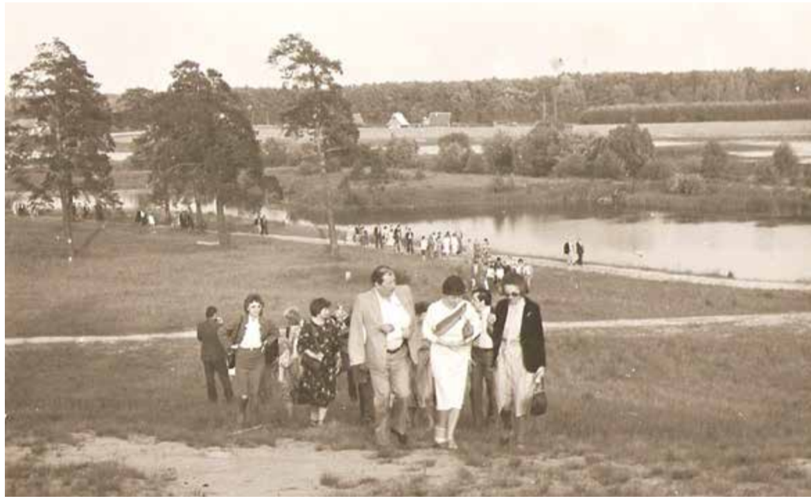
Zjazd Absolwentów w 1984 roku (pierwszy po latach)