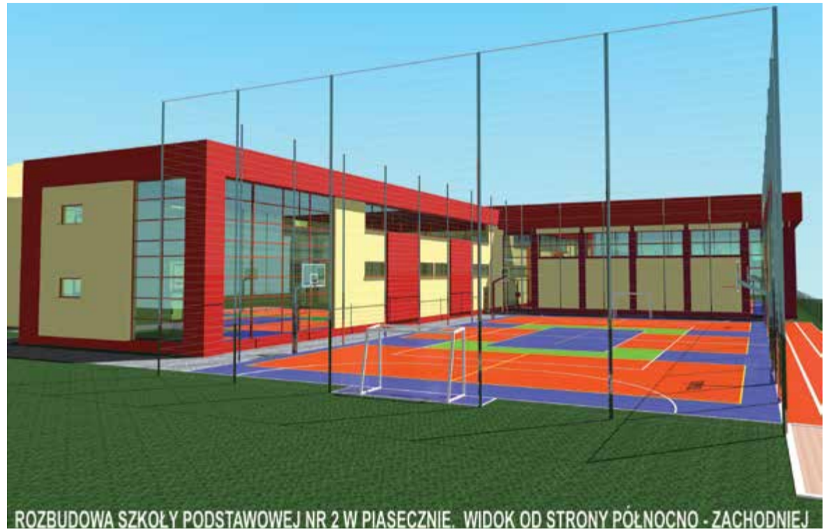
ROZBUDOWA SZKOŁY PODSTAWOWEJ NR 2 W PIASECZNIE. WIDOK OD STRONY PÓŁNOCNO-ZACHODNIEJ

2017. Nikt nas o tym nie informował, poczuliśmy się zlekceważeni.