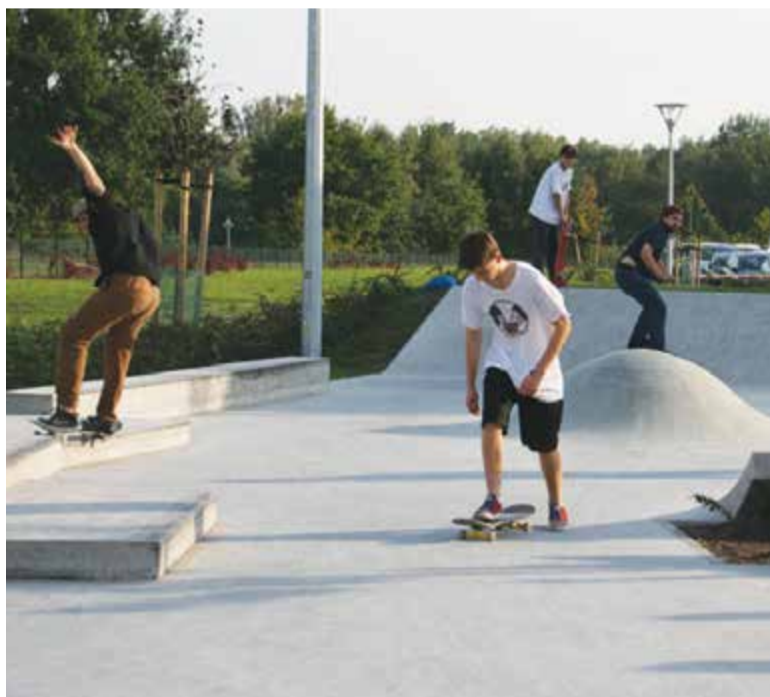
FOT. ALBERT ANIS