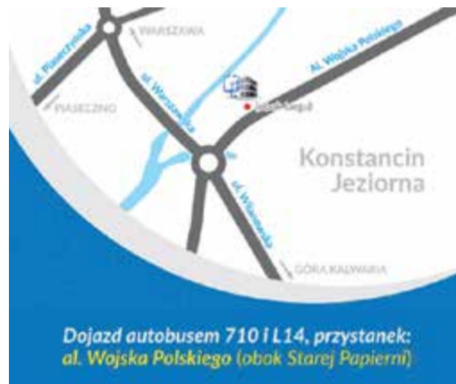
Dojazd autobusem 710 i L14, przystanek: al. Wojska Polskiego (obok Starej Papierni)

Doppler żył i tętnic. Z zakresu kardiologii poza konsultacjami wykonujemy badania HOLTER EKG i CIŚNIENIOWY. Zachęcam do skorzystania z Holtera EKG wszystkich, którzy odczuwają zaburzenia rytmu serca (np. kołatania serca, przyspieszone bicie), oraz tych,