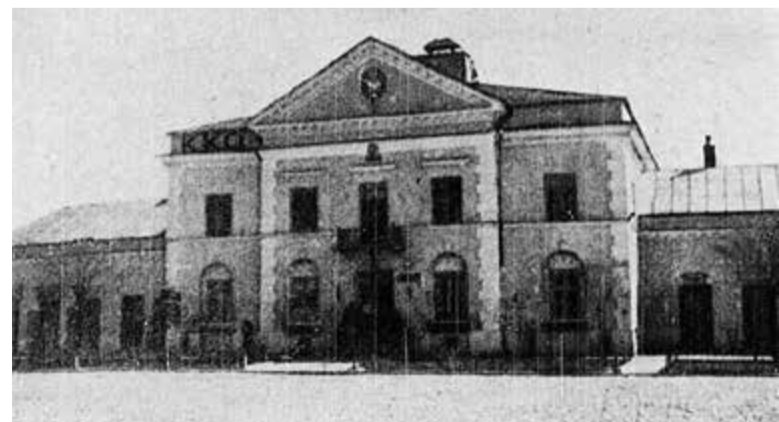
Góra Kalwaria – Tygodnik Ilustrowany z 1939 roku