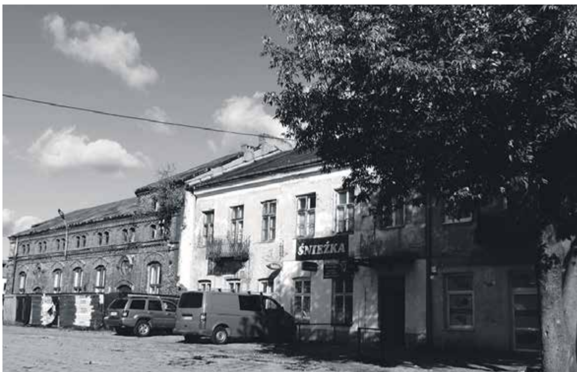
Dwór cadyka, stan z 2015 roku

Dzień ślubu jest okazją do spotkania z Rabinem Abrahamem Mordechajem Alterem (1866–1948). Jest on czwartym rabinem z dynastii Ger. Dynastię założył Wielki Rabin Icchak