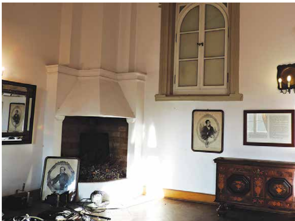
Salon, Pałac w Oborach

✍ napisz do autorki m.szturowska@przekladpiaseczynski.pl