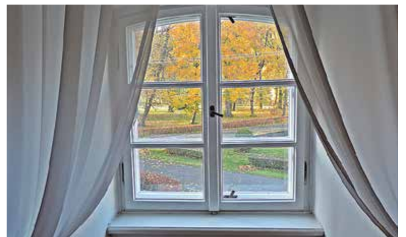
Okno w oficynie, Pałac w Oborach