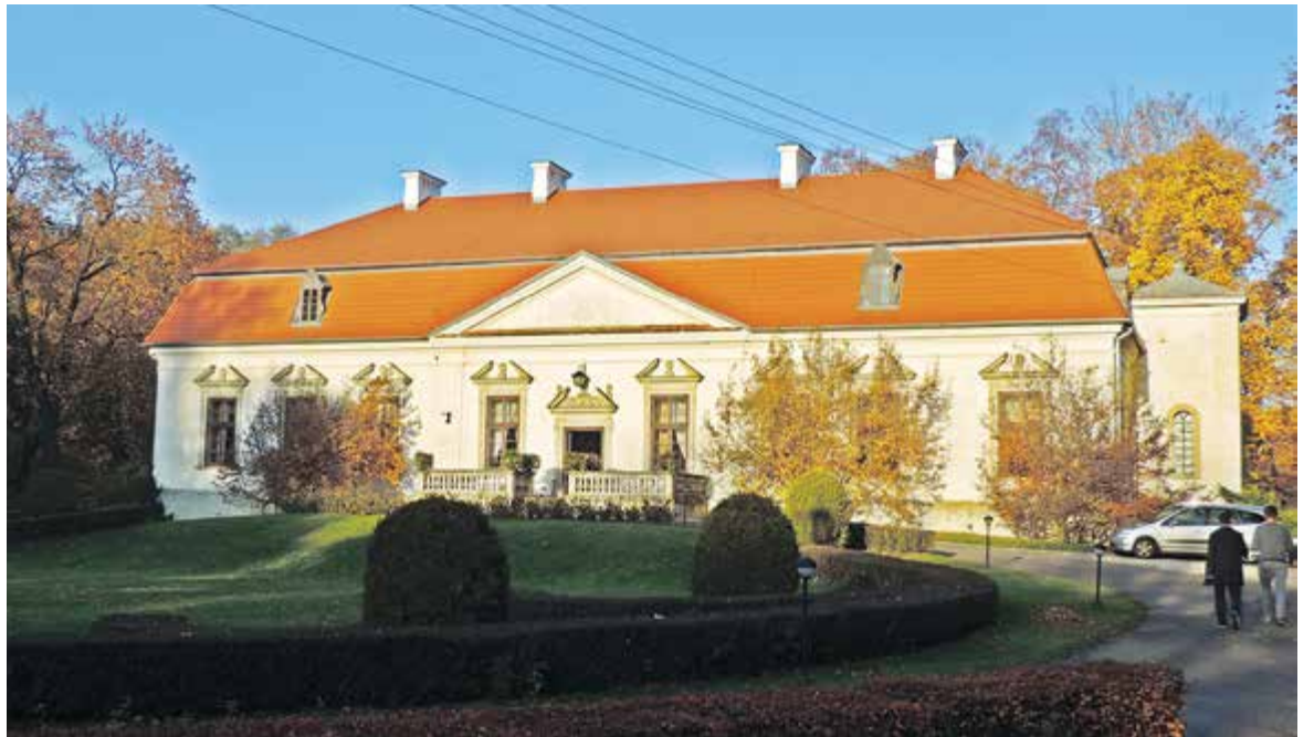
Pałac w Oborach