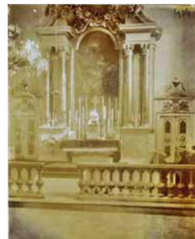
Zdjęcie kościoła św. Anny z początku wieku XX.