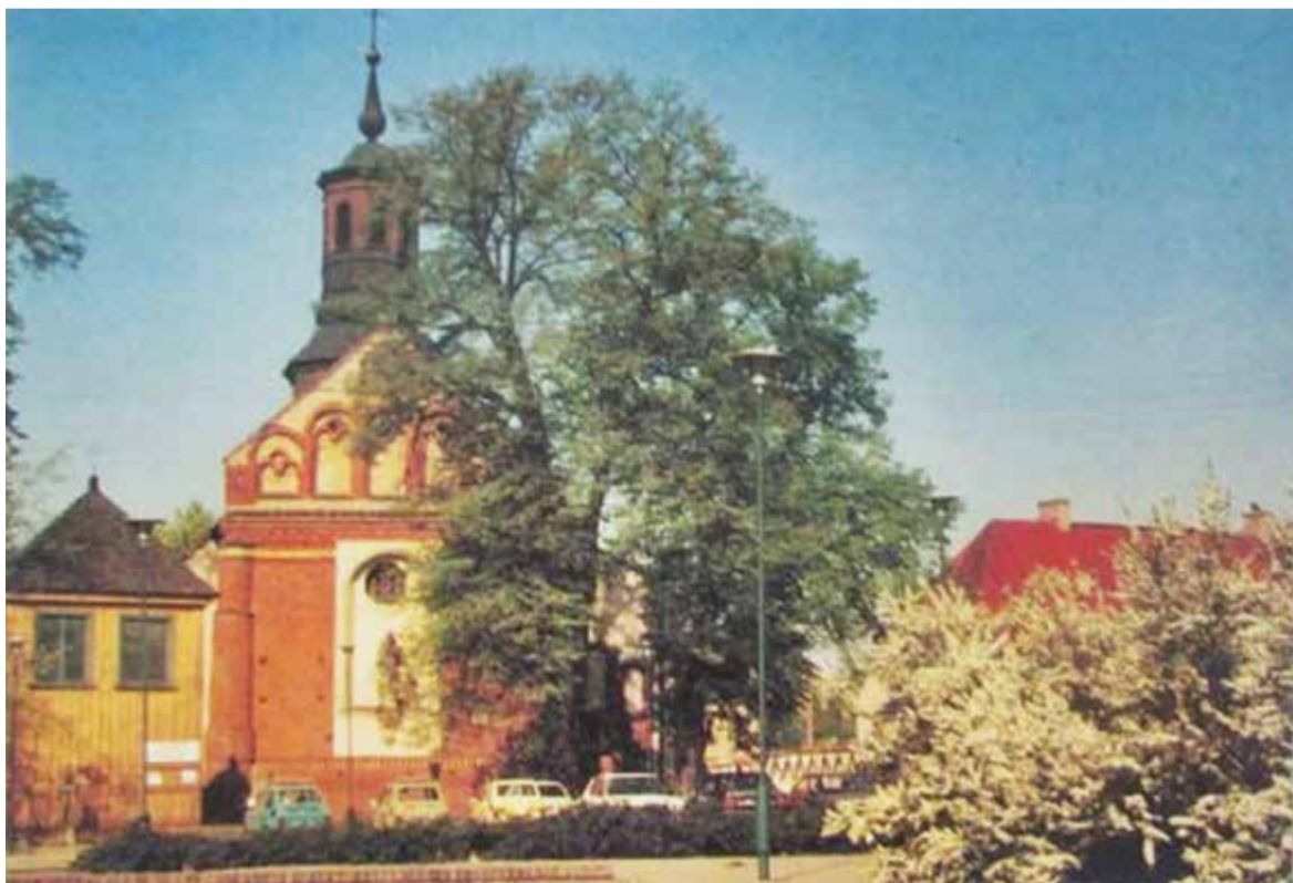
Pocztówka z Piaseczna – lata 70/80. XX w.