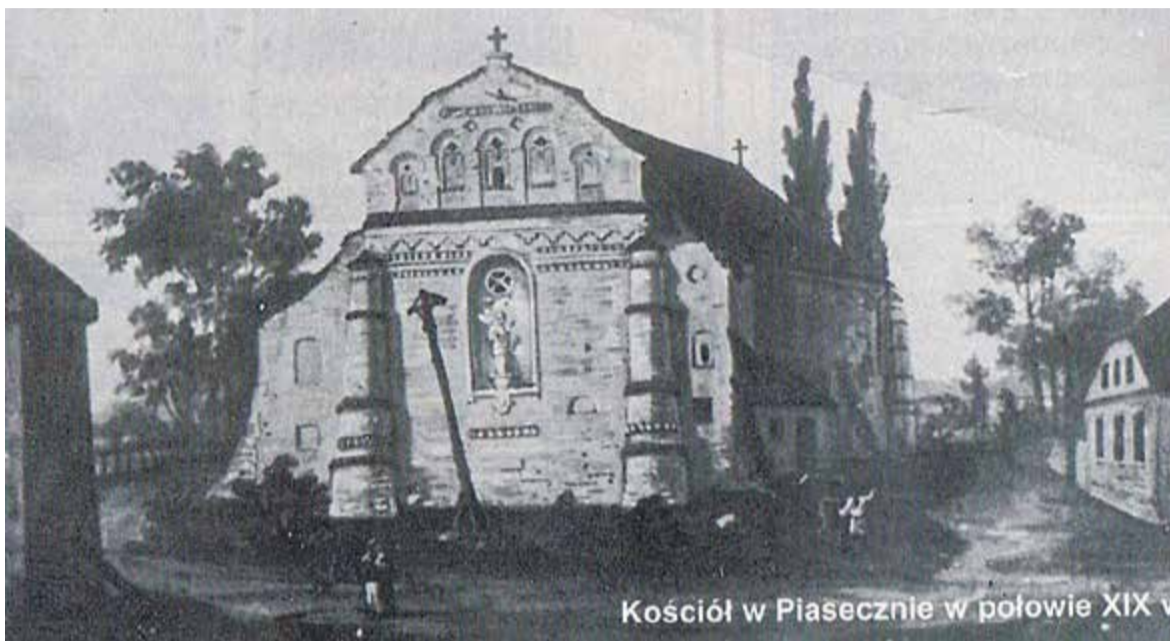
Kościół w XIX wieku. Rycina nieznanego autora

W 1730 roku odwiedził Piaseczno wielki pożar. Spłonęły wówczas archiwa miasta, domy mieszkalne i częściowo kościół. I jak to się plecie w życiu, na szczęście dla Piaseczna, w tym czasie starostwo piaseczyńskie obejmuje z nadania króla Augusta II Mocnego człowiek o dużej wiedzy, światowy i mądry Józef Aleksander Sułkowski. Postanawia wybudować w Piasecznie zespół pałacowy wraz z kościołem. Na zlecenie starosty architekt Pöppelmann stworzył projekt przebudowy istniejącego kościoła, nadając wnętrzu styl barokowy poprzez podwyższenie ścian budynku i powiększenie okien. Polegający także na całkowitym przebudowaniu prezbiterium i stworzeniu nowego ołtarza głównego. Obraz ołtarza głównego przedstawiający Trójcę Świętą i późnobarokowa konstrukcja ołtarza, ołtarze boczne, rokokowa ambona i chrzcielnica pochodzą także z XVIII w. Chrzcielnica oryginalna fundowana przez Sułkowskiego, znajduje się obecnie w starej plebanii w Muzeum Regionalnym Piaseczna, w kościele można zobaczyć jej replikę. Dlaczego oryginał nie stoi w kościele? Nie wiem. Niejasna jest też sprawa z sygnaturką – wieżą. Twierdzi się (Wikipedia), że podczas tej przebudowy (1736)