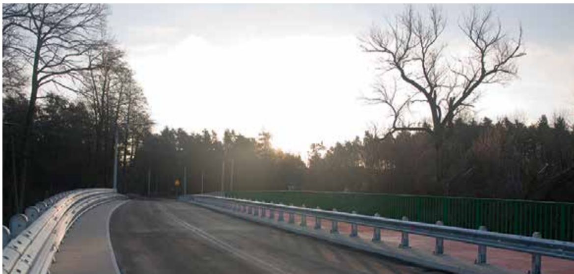
Na razie z mostu korzystają lokalni mieszkańcy