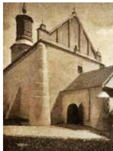
Zdjęcie kościoła św. Anny z 1914 roku