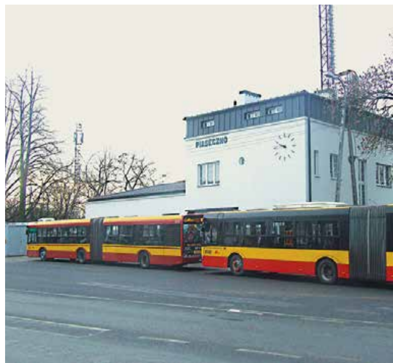
Autobusy linii 709 przy dworcu w Piasecznie