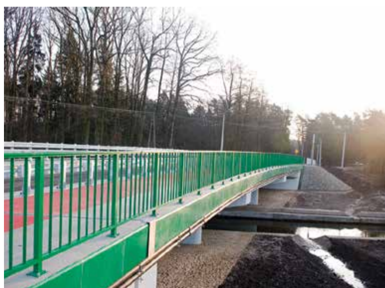
Niewielki mostek nad Jeziorką zamienił się w nowoczesną przeprawę

Czy tak kosztowna inwestycja miałaby zaspokoić potrzeby niewielkiego lokalnego ruchu? Most leży na drodze, którą można dojechać od trasy prowadzącej z Piaseczna do Tarczyna do drogi nr 722 prowadzącej z Piaseczna do Prażmowa. Obie drogi łączą się przy wyjątkowo uciążliwym skrzyżowaniu w Gołkowie, gdzie spotykają się ulice Główna, Pułku IV