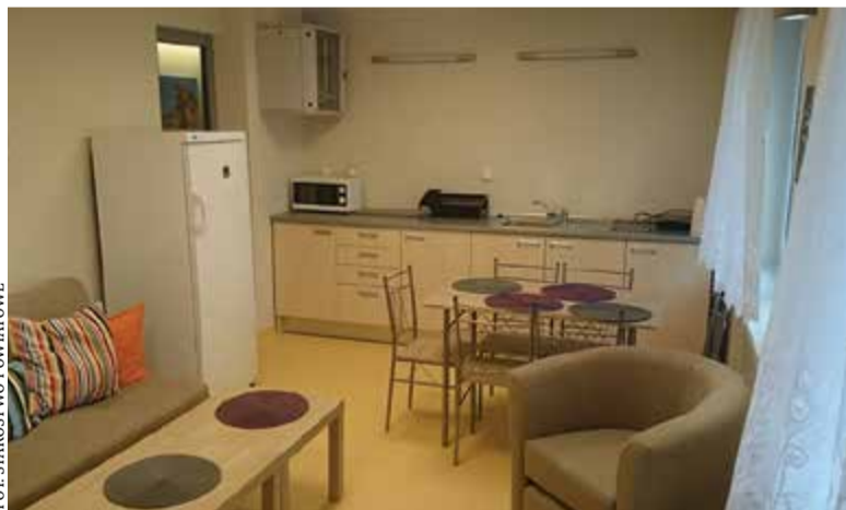
Mieszkańcy internatu mają do dyspozycji m.in. spory aneks kuchenny

Powiat przywrócił po 12 latach do istnienia internat w Zespole Szkół Zawodowych im. Marszałka Franciszka Bielińskiego przy ul. Budowlanych 14 w Górze Kalwarii.