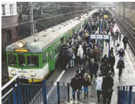
Pociąg do Warszawy na stacji Piaseczno

Podróżuję przy drzwiach, mogę więc obserwować remont torów. Tor faktycznie jest zamknięty niemal od