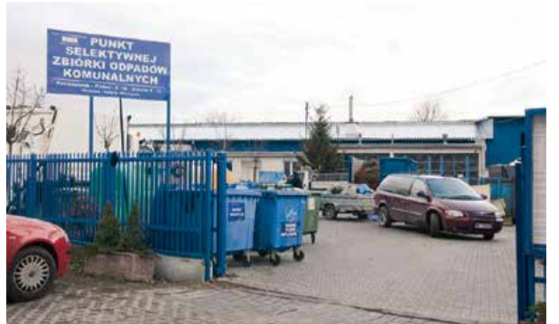
PSZOK zostaje przy ul. Technicznej, ma być jednak zmodernizowany

Burmistrz Zdzisław Lis uległ presji mieszkańców. Punkt Selektywnej Zbiórki Odpadów Komunalnych nadal będzie funkcjonował w obecnej lokalizacji.