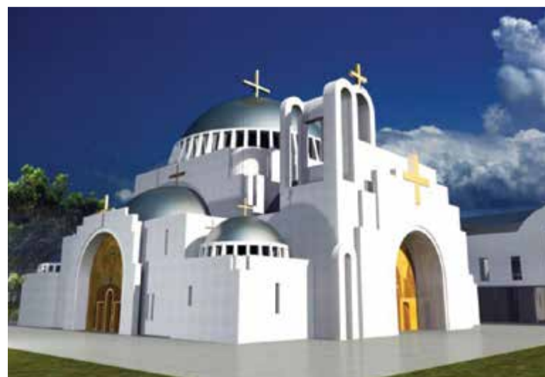
Projekt cerkwi przy ulicy Puławskiej Źródło materiały prasowe APA Markowski Architekci