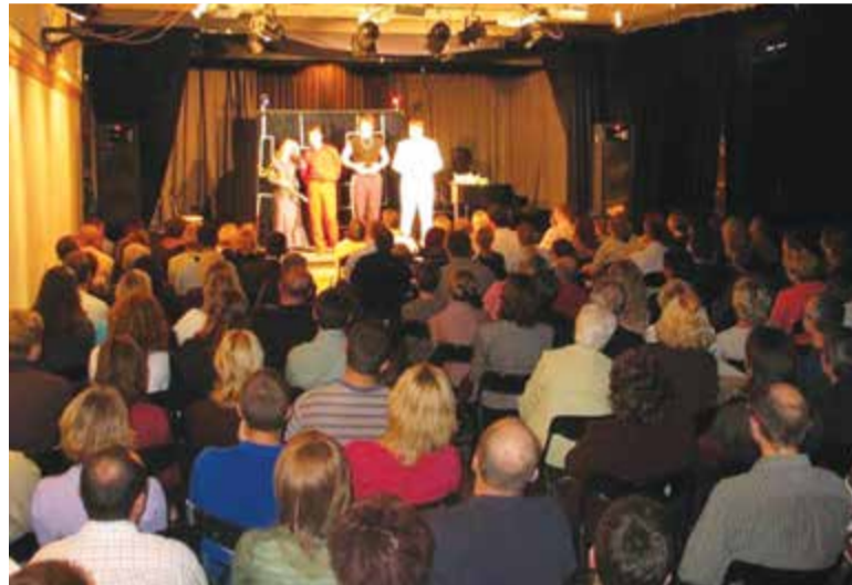
Sala w Ośrodku Kultury w Piasecznie