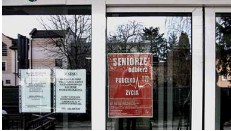
Plakat na drzwiach wejściowych do przychodni przy ulicy Fabrycznej 1

Organizatorzy akcji jako miejsce trzymania pudełka wskazują lodówkę. Tę ma niemal każdy, do tego łatwo ją znaleźć – prawie zawsze znajduje się w kuchni. Poza kartą informacyjną wraz z pudełkiem otrzymujemy naklejkę, którą należy nakleić na drzwiach lo-