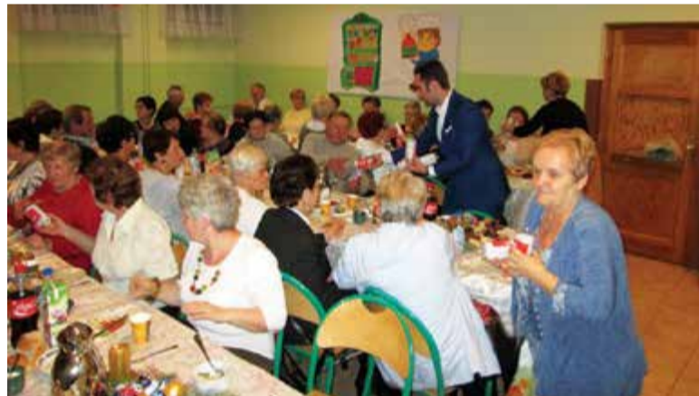
Wigilia Klubu Emerytów i Rencistów w Gołkowie

Biuro Promocji informowało o akcji za pomocą mediów (PP również o niej pisał) oraz swojej strony internetowej. Pod koniec września, kiedy akcja startowała, przekazano seniorom 100 sztuk pudełek podczas inauguracji Uniwersytetu Trzeciego