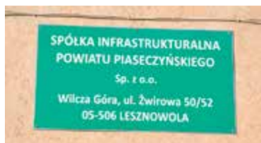
Szyld Spółki wciąż widnieje na budynku przy ul. Żwirowej 50/52 w Wilczej Górze

– I jak to się ma do informacji, że miały one wynieść 2 tys. złotych? – czytamy w interpelacji. Taką bowiem