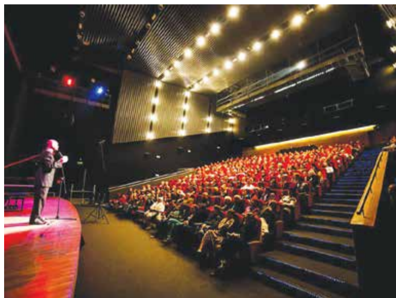
Sala widowiskowa w Centrum Kultury w Grodzisku Mazowieckim.