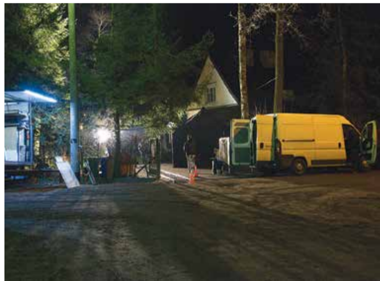
Hałas agregatu i mocne światło przeszkadzają okolicznym mieszkańcom szczególnie wieczorem i w nocy

– Przez 4 lata na miejscu były tylko 4 interwencje policji, w tym jeden raz wzywał ją kierownik produkcji – ripostuje Rasiński.