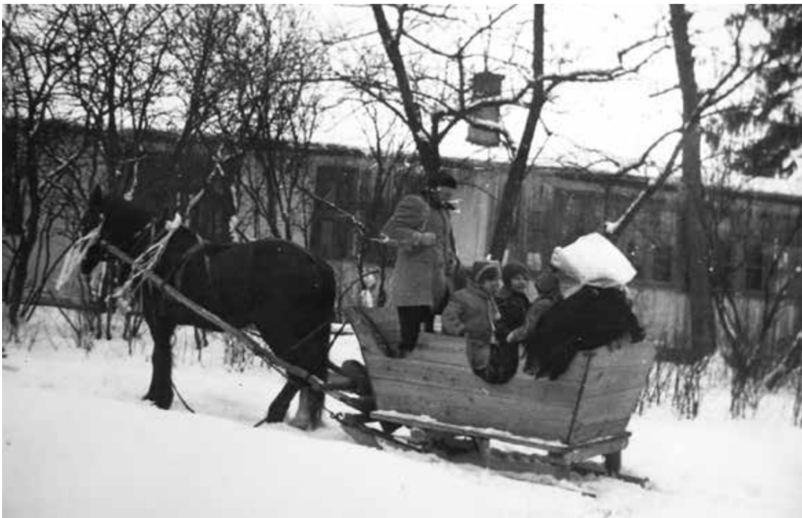
Łbiska w 1923 roku