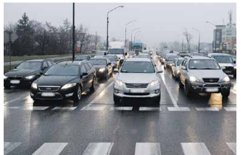
Na mniejsze korki na ul. Puławskiej w najbliższej przyszłości się raczej nie zanoszą