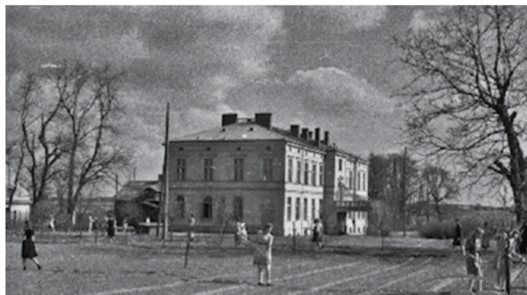
Gospodarstwo Chyliczki – zdjęcie z zasobów historii szkoły. Rok nieustalony