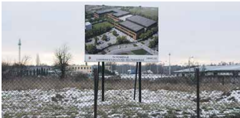
Budowa CEM to najdroższa inwestycja zaplanowana przez gminę w 2016 roku