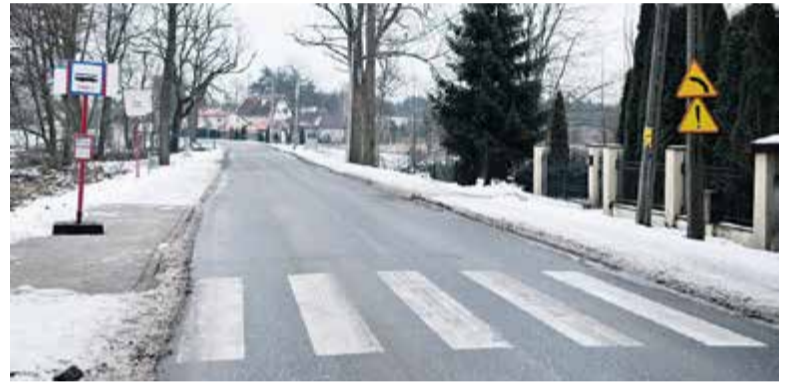
Piesi w końcu mogą bezpiecznie poruszać się ulicą Lipową