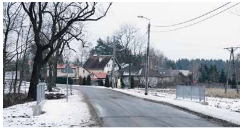
Niezbędną do dokończenia chodnika przebudowę mostu również udało się wykonać przed końcem 2014 roku