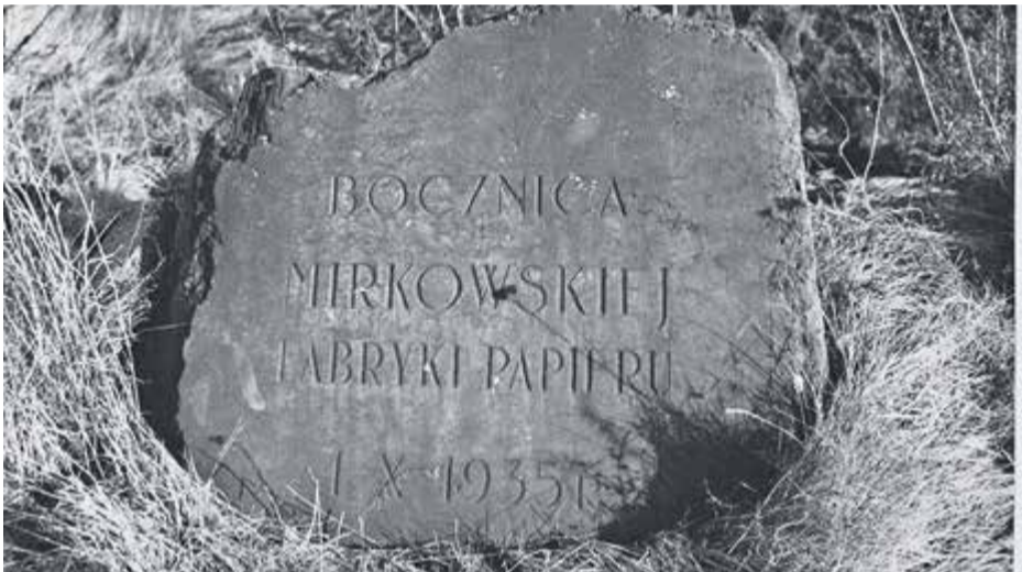
Zdjęcie sprzed 20 lat. Od tego czasu kamień zmieniał miejsce już dwukrotnie