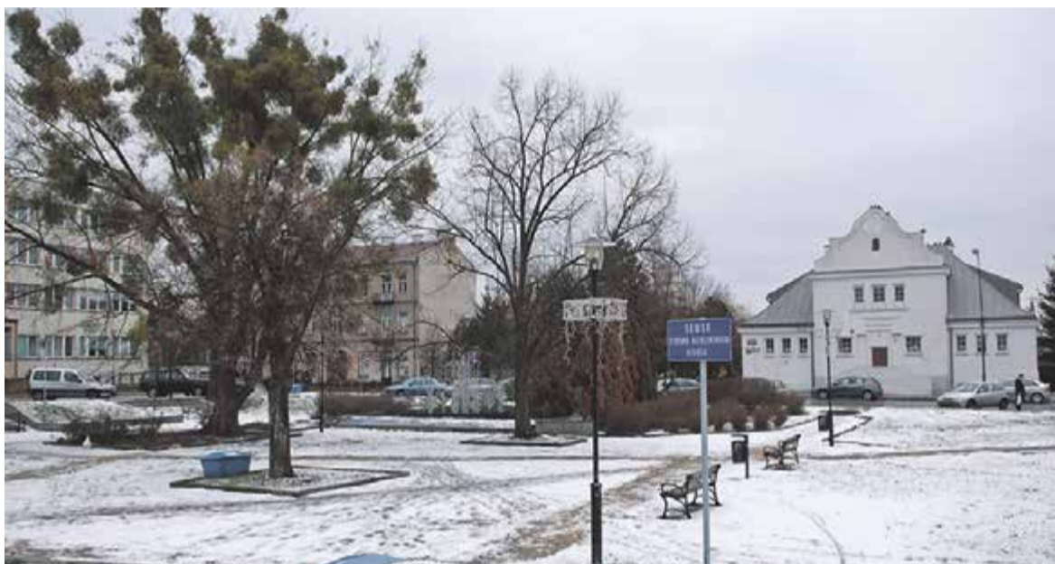
Projekt i pieniądze na rewitalizację Placu Kisiela miasto posiada. Pytanie czy w 2016 roku uda się w końcu wykonać to zadanie?

Na zadania inwestycyjne radni przeznaczyli 52 mln złotych. Dwie trzecie tej sumy pochłoną inwestycje w oświatę. Podobnie jak w roku ubiegłym najdroższą piaseczyńską