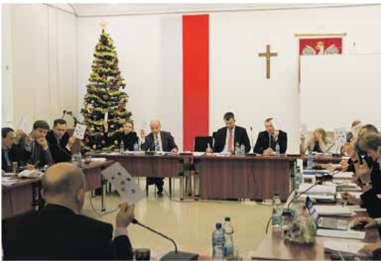
Powiatowy budżet udało się przyjąć jeszcze przed świętami