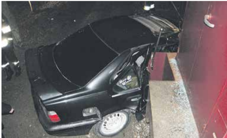
BMW, które zderzyło się z pociągiem sylwestrowym