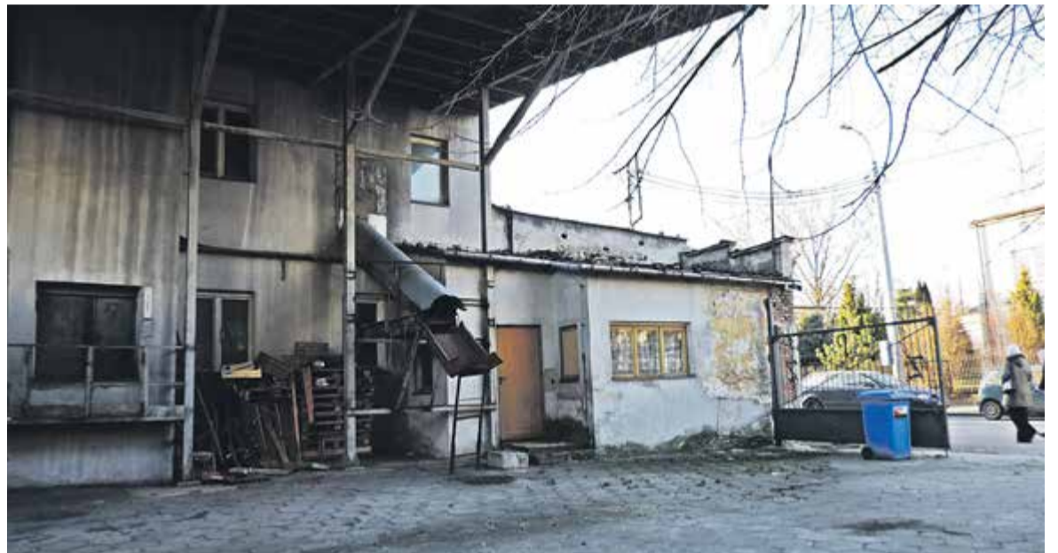
Młyn Parowy w Piasecznie przy ul. Ks. Czajewicza

Urządnik skarbowy kontrolujący młyn zauważa, że rolnicy przywożący zboże do przemiału nie odbierają go od razu, tylko po pewnym czasie. Urządnik zaszereguje ten sposób