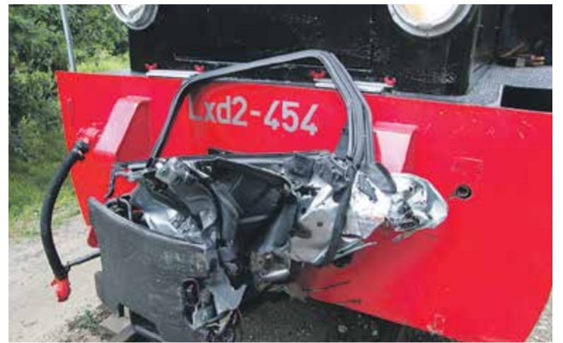
Zderzak lokomotywy, który wbił się w samochód