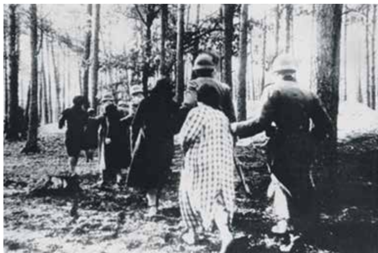
Zdjęcie z archiwum Gestapo. Las palmirski 20 czerwca 1940 roku

napisz do autorki m.szturowska@przeładpiaseczynski.pl