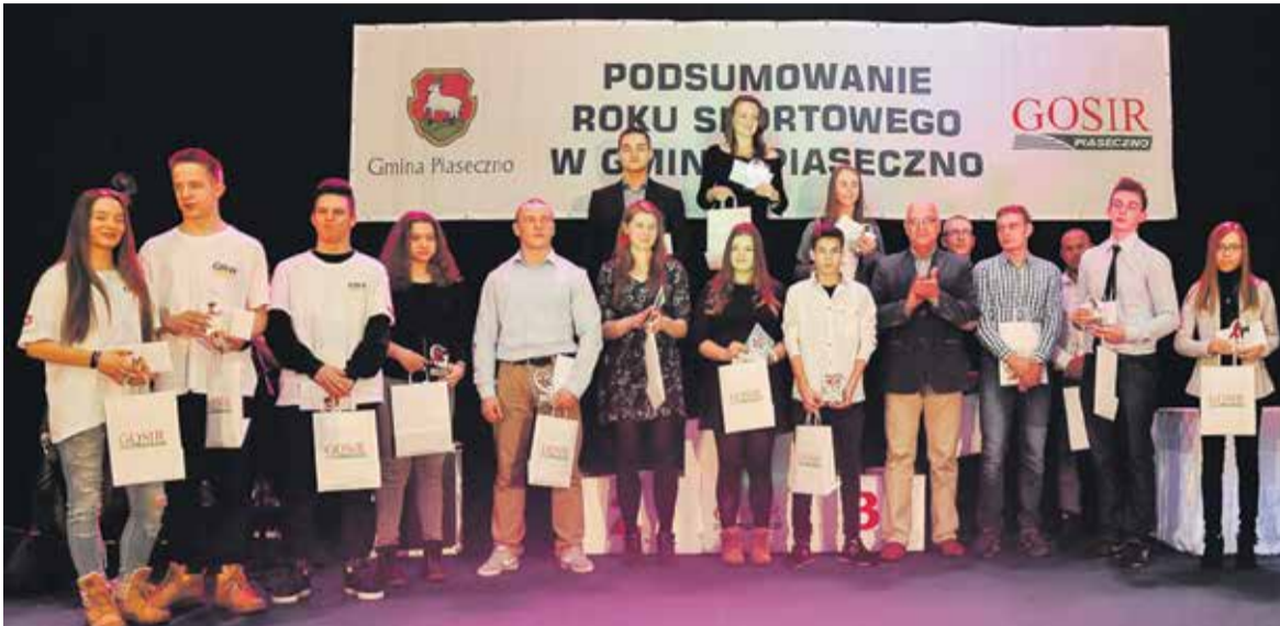
Nagrodzeni za wysokie wyniki sportowe w 2015 roku w kategorii „Zawodnik”

W piątek 22 stycznia na Stadionie Miejskim GOSiR w Piasecznie odbyła się gala, podczas której wyróżnieni zostali najlepsi sportowcy, trenerzy oraz działacze sportowi Gminy Piaseczno.