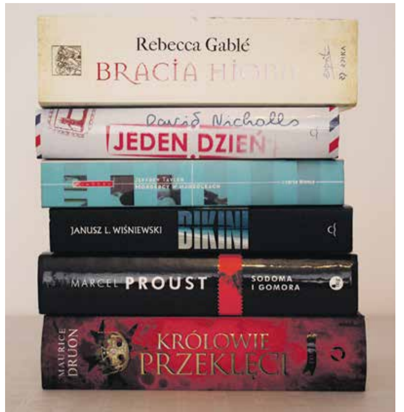
Lektury omawiane podczas spotkań DKK pochodzą z różnych gatunków i dobierane są do gustów danej grupy

– Wydaje mi się, że uczestnictwo w Klubie uwrażliwia uczestników na