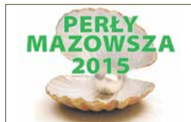
Głosuj i wygrywaj s. 12-13