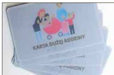
Przeгляд gminnych KDR s. 6