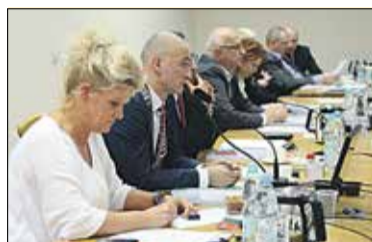
Dawid pisze do Goliata s. 2