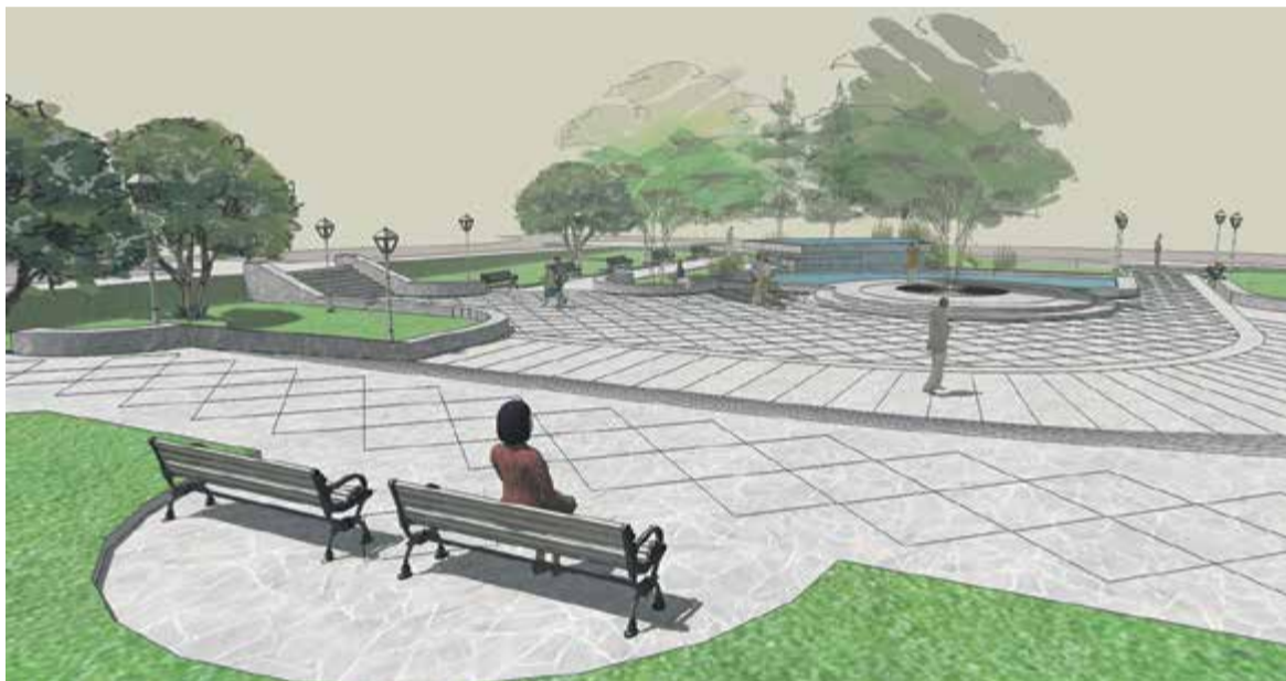
Wizualizacja Skweru Kisiela, widok ogólny na scenę. Firma Remprojekt