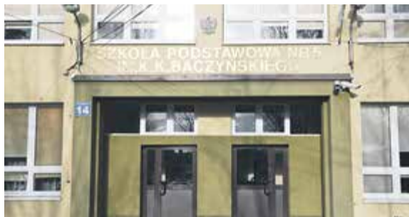
Szkoła podstawowa nr 5 przy ul. Szkolnej

w sposób kluczowy powinny wpływać na ostateczny wybór: dojrzałość szkolna dziecka, warunki panujące w placówce oraz gotowość rodziców do „wypuszczenia dziecka z gniazda”. Zdaniem pani burmistrz większość dzieci, które odbyły już roczne przygotowanie przedszkolne czy to w szkole czy w przedszkolu, jest gotowa do podjęcia nauki szkolnej.