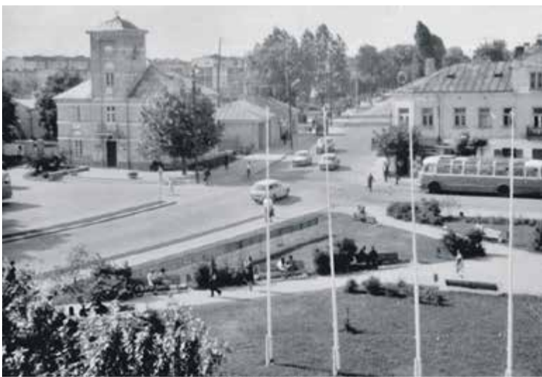
Rynek – pocztówka