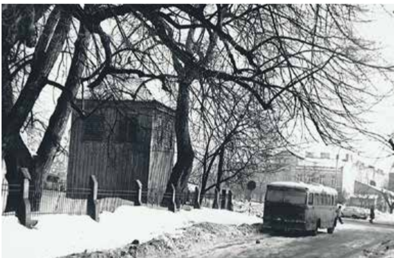
Rynek z 1979 roku