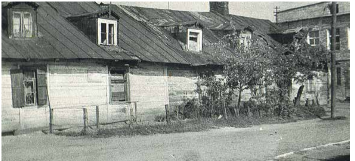
Ul. Kilińskiego część zwana Kradziejowem

Tego lata dopadła mnie miłość i to zupełnie nie moja, ale to właśnie ja chodziłam jak zaczadzona. Kryjąc się za tym kufrem, z zapartym tchem czytałam kompletnie zakazaną dla mnie książkę i całym ciałem teleportując się na francuską riwierę, stałam się prawie bohaterką opowiadania – siedemnastoletnią Cecile. Ojciec Cecile, Raymond, pięćdziesięcioletni wdowiec, był nieodporny na wdzięki kobiece, a szcze-