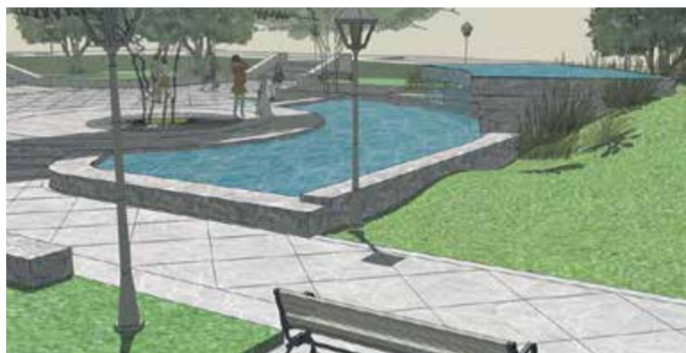
Wizualizacja Sweru Kisiela z widoczną wodną kaskadą. Firma Remprojekt

Kanał Piaseczyński, znany każdemu jako Perełka, to mały strumyk przepływający przez całe miasto, który niemal 6 lat temu wyrządził ogromne szkody na terenie Piaseczna. Aby w razie dużych opadów deszczu oraz gwałtownego wezbrania wody w Perełce sytuacja się nie powtórzyła, jakiś czas temu wyremontowano mostki na ulicach Wojska Polskiego i Kniaziewicza. Za mostkami kanał znikną pod ziemią przed Sądem Rejonowym i wyłania się na powierzchnię za przedszkolem przy Sierakowskiego. Został on bowiem kilkadziesiąt lat temu „schowany” pod skwerkiem, wówczas jeszcze bezimiennym.