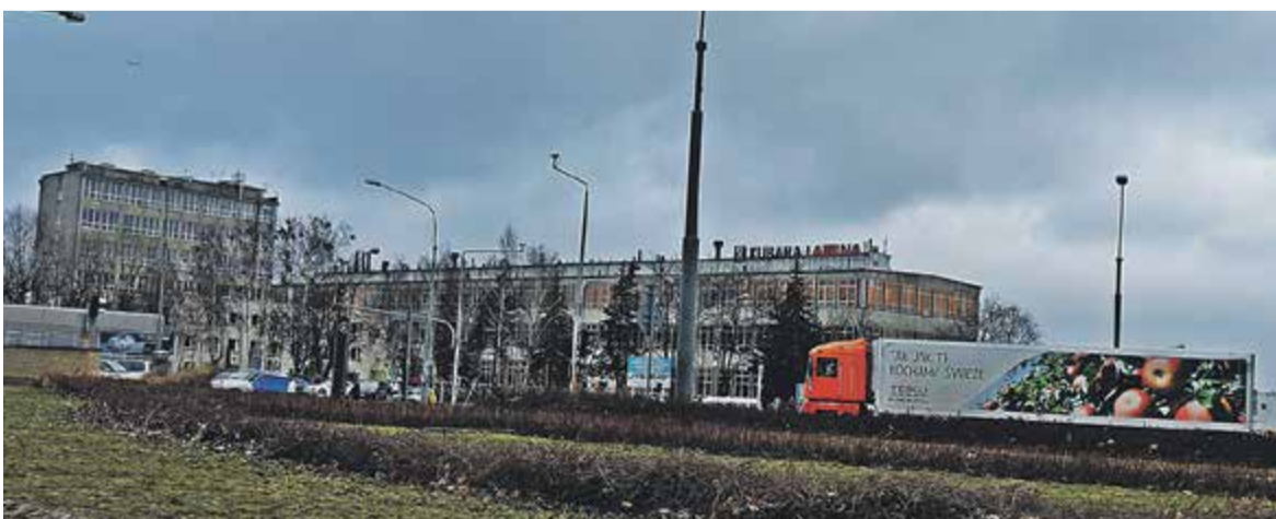
Lamina, zdjęcie współczesne