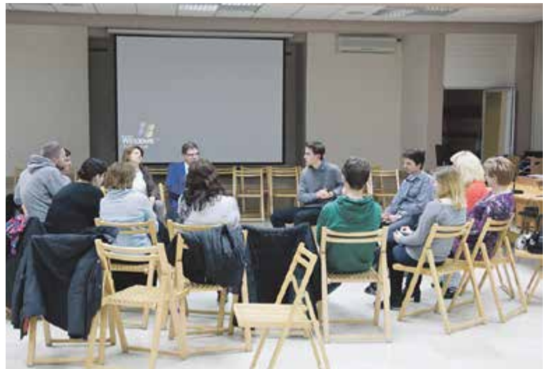
Rodzice dyskutowali na temat szans uzyskania większego wpływu na funkcjonowanie szkoły blisko dwie godziny