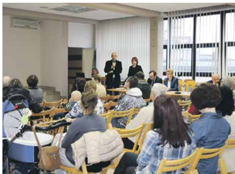
Konferencja w UMiG

– W przeciwnym wypadku będziemy mieć problem z centrum