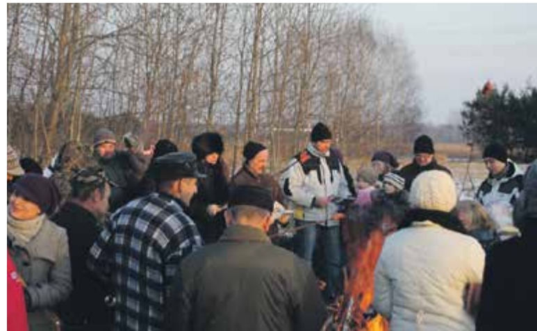
Ognisko podczas zimowej imprezy integracyjnej mieszkańców

T.W.: Chcielibyśmy mieć jakiś mały plac z ławeczkami, huśtawkami. Takie przyjazne miejsce, dla starszych i dla młodzieży, by mogli wyjść, usiąść i porozmawiać. Chciałabym, by nasza wieś była skanalizowana i zgazyfikowana. Marzy nam się dobra komunikacja, by mieszkańcy mogli wszędzie dotrzeć. Nie wszyscy są zmotoryzowani, nie każdy może jeździć samochodem. Mamy połączenie z Piasecznem, jeżdżą autobusy linii L, ale nie kursują one w niedzielę. Dla niektórych jest to dokuczliwe, ponieważ nie mogą w weekend wybrać się do kina czy na jakieś imprezy kulturalne organizowane w Piasecznie. Brakuje nam też wiat na przystankach. Nie mamy też świetlicy, czyli miejsca, w którym moglibyśmy się spotkać. To jedna z naszych bolączek. Marzy mi się świetlica