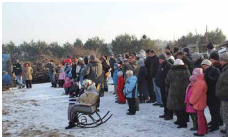
Mieszkańcy podczas zimowej imprezy integracyjnej w Uwielinach