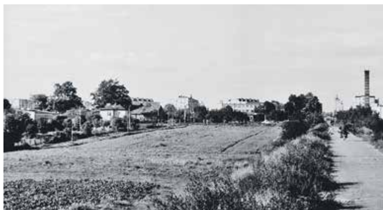
Nasyp kolejowy, dziś ul. Wojska Polskiego w tle SP nr 5

napisz do autorki m.szturowska@przełompiaseczynski.pl