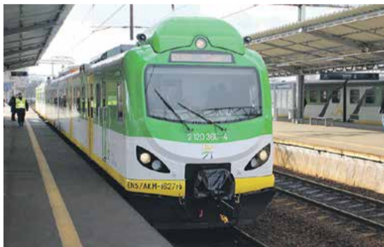
Pociąg Kolei Mazowieckich.