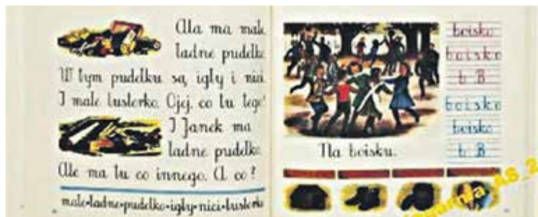
Jeszcze nie było gender – kartki z elementarza M. Falskiego