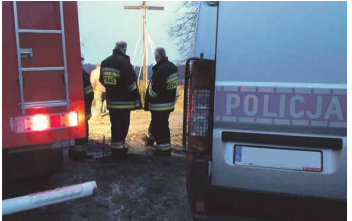
Ekshumacja znalezionych szczątek.

Inne wersje mieszkańców mówią o tym, że pod krzyżem był grób żoł-