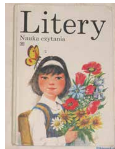
Okładka elementarza Przytułskich

W okolicach nowo powstałej Al. Róż, na której stawiano pierwsze bloki tonące w błocie i jak recytowały moje przedszkolaki „Aleja Róż bez amfibii ani rusz”, rosły sady jabłoniowe i wycieczka np. ulicą Fabryczną