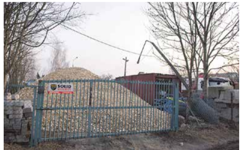
Działka wciąż funkcjonuje jako zaplecze budowy

– 26 tysięcy złotych – odpowiedział Woszczyk. Po czym odbyło