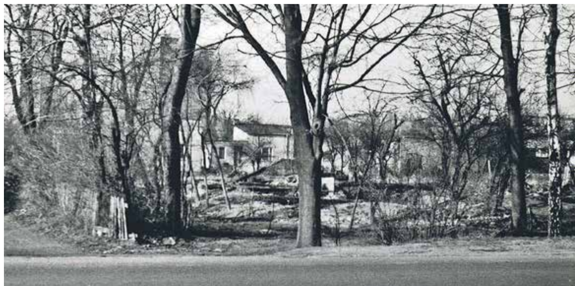
Rumowisko domu Swobodziana

Wchodzę do sali pełnej dzieci i dostaję oczopląsu. Czasy były takie, że grupa przedszkolna liczyła około 40 żrebaków pełnych energii i pomysłów. Ja, wyposażona w nowe idee i nową pedagogiczną wiedzę, zabieram się rażno do pracy. Dzieci, z którymi będę miała do czynienia, to sześciolatki, niby są na początku drogi rozwoju myślenia abstrakcyjnego, ale są inteligentne i bardzo kreatywne. Mają to coś, co po latach zanika na drodze niefortunnej edukacji, czyli chęć do tworzenia dzieł niezwykłych, rysunków z kompozycją i treścią, przedstawień teatralnych improwizowanych i mądrych, obrazujących otaczającą rzeczywistość. Zapal do nauki. W twórczości plastycznej potrafią zawrzeć tajemnicę swoich przeżyć, tylko wystarczy im dać szansę i wsparcie. Nie oceniać tylko pytać, wyrażać maksymalne zainteresowanie tym, co stworzyły. Ekspresja plastyczna i muzyczna dziecka w wieku przedszkolnym to mój bzik, moja pasja, wyrażona największym zachwytem nad tym, co stworzone przez młodego twórcę. Z całkowitym szacunkiem dla dzieła. Czyli braku ingerencji na-