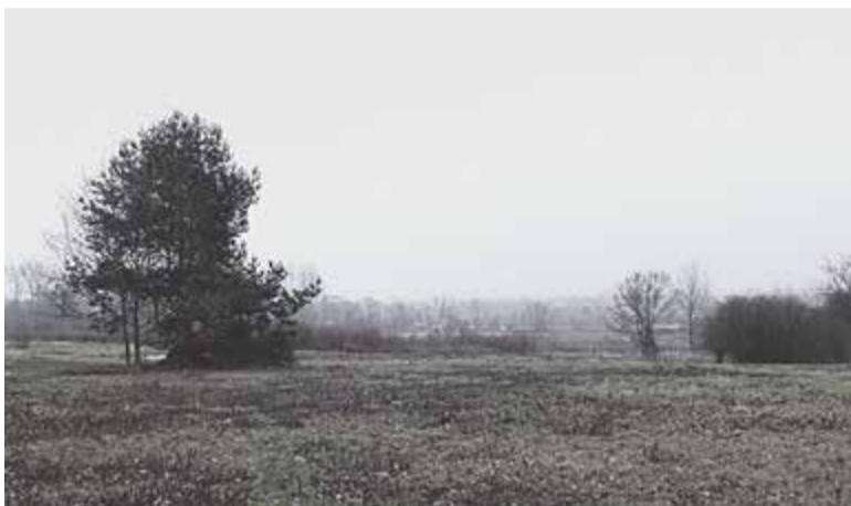
Wólka Kozodawska - część której dotyczy projekt miejscowego planu zagospodarowania, widok od strony Zalesinka